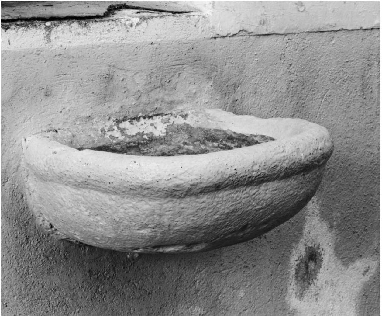
Vue d'ensemble du bénitier.