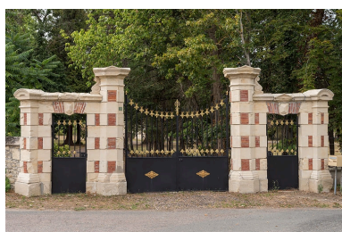
Entrée du parc. IVR26_20205800560NUC4A