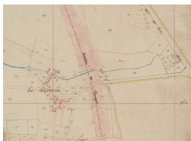
Écart des Métairies dans le plan du cadastre ancien dit napoléonien (1812).