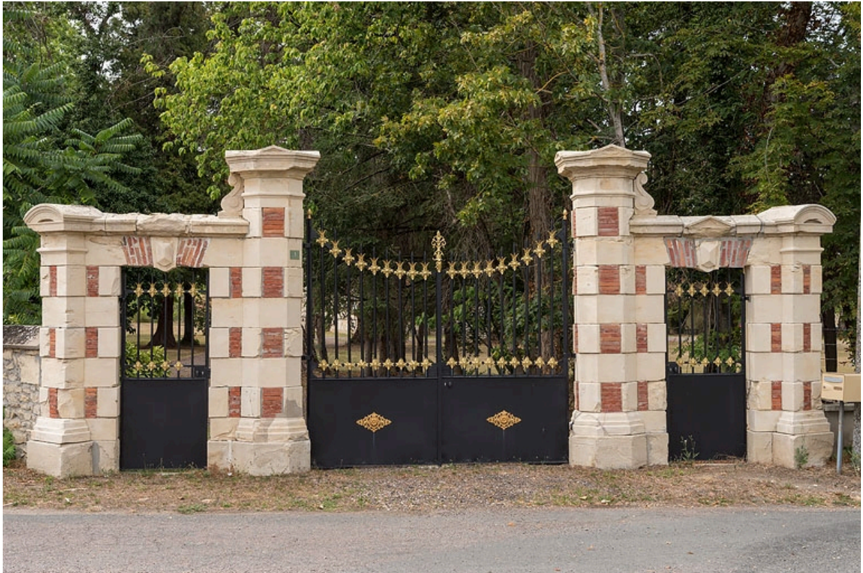
Entrée du parc.