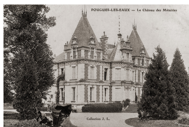
Vue ancienne.