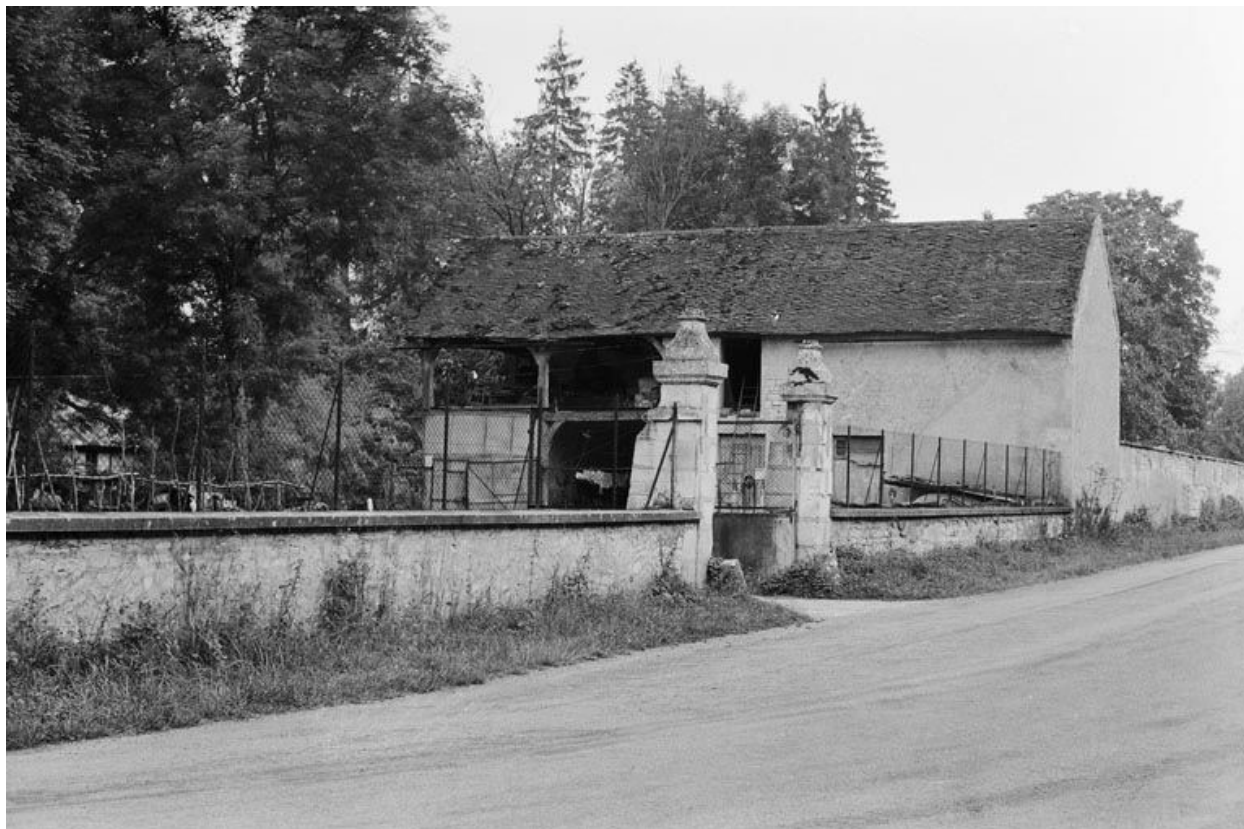
Une des entrées.