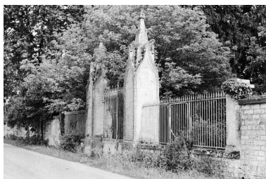
Une des entrées.