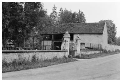
Une des entrées.