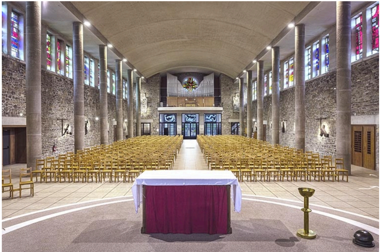
Chandelier de chœur, disposé à droite de l'autel.