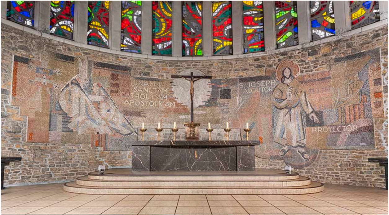
Ensemble de six chandeliers d'autel disposés de part et d'autre du tabernacle.