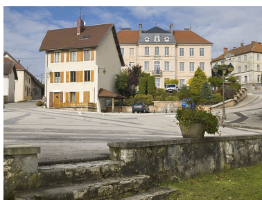
Vue générale depuis la poste. IVR43_20082501120NUC2A