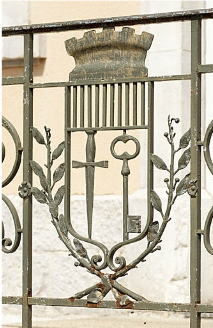
Blason ornant le garde-corps du perron.