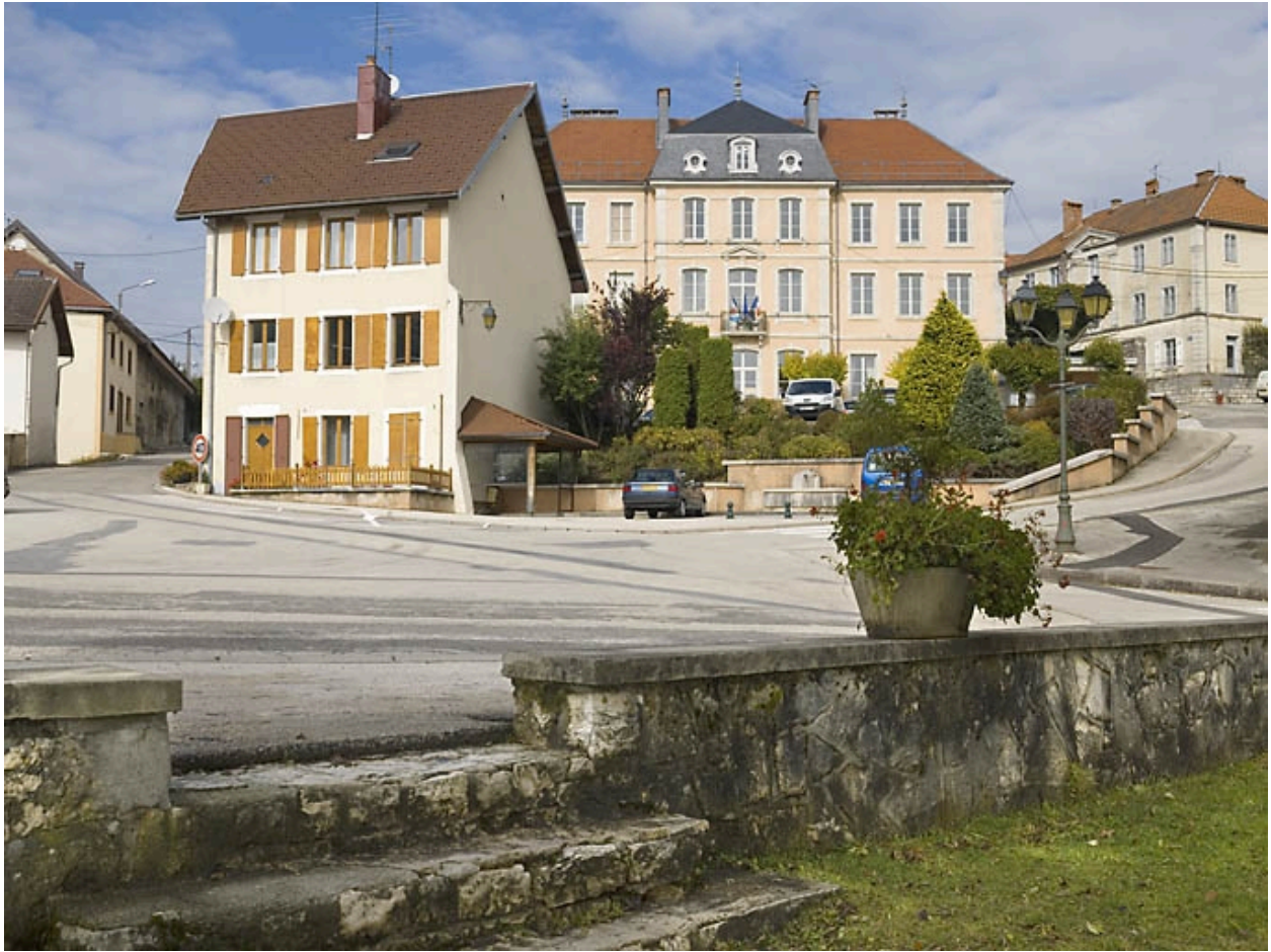
Vue générale depuis la poste.