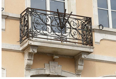
Balcon surmontant l'entrée.