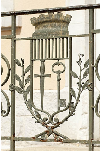
Blason ornant le garde- corps du perron. IVR43_20092501639NUC2A