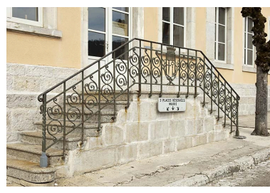
Perron. IVR43_20092501642NUC2A