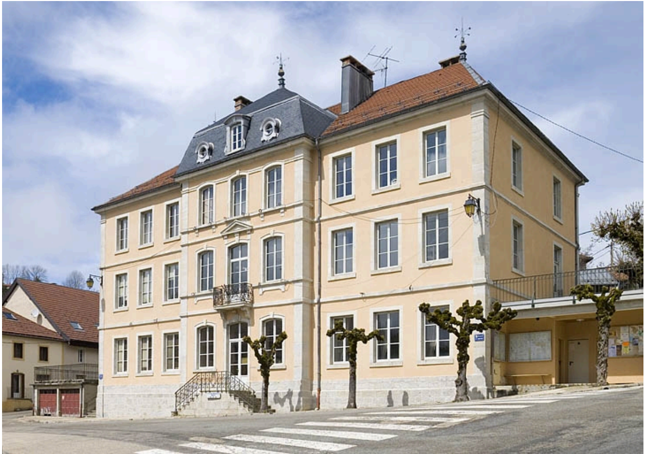
Façade antérieure et façade latérale droite.