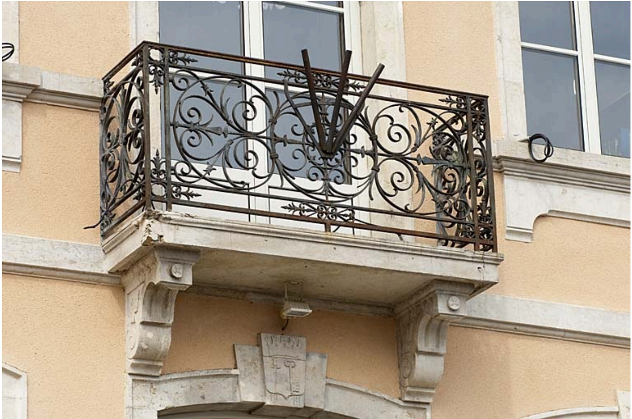
Balcon surmontant l'entrée.