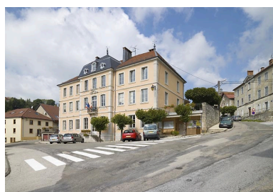
Vue générale de trois quarts droit. IVR43_20082501116NUC2A