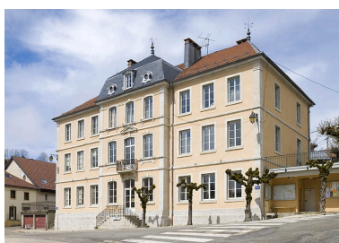
Façade antérieure et façade latérale droite. IVR43_20092500495NUC2A