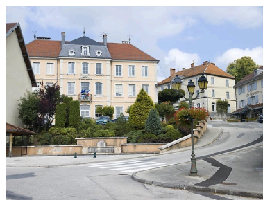
Vue générale rapprochée. IVR43_20082501117NUC2A