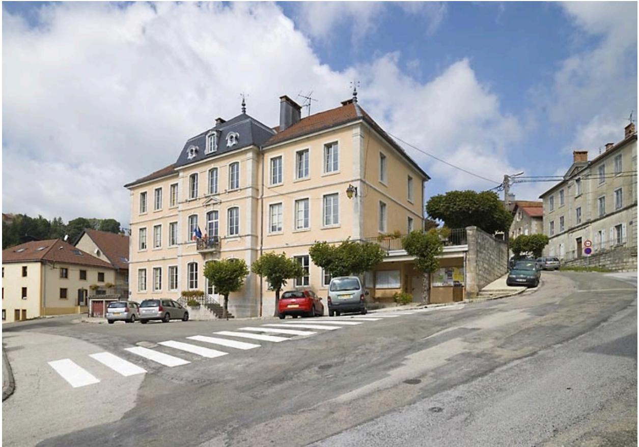
Vue générale de trois quarts droit.