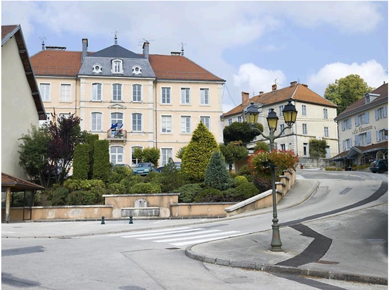
Vue générale rapprochée.