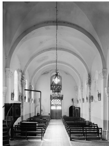
Nef. IVR26_19755800215V