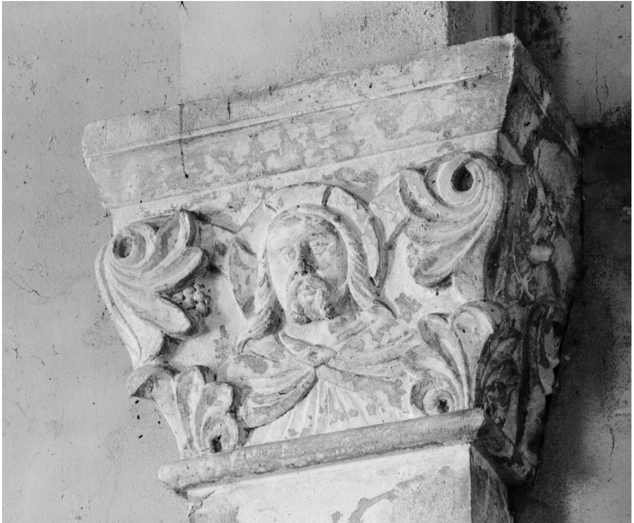
Choeur, chapiteau postérieur droit.