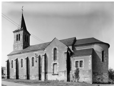
Elévation gauche. IVR26_19755800211V

IVR26_20125800036A3YY