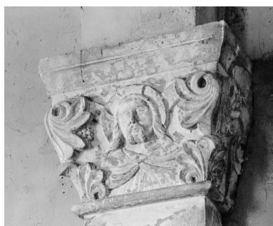
Choeur, chapiteau postérieur droit. IVR26_19755800217X