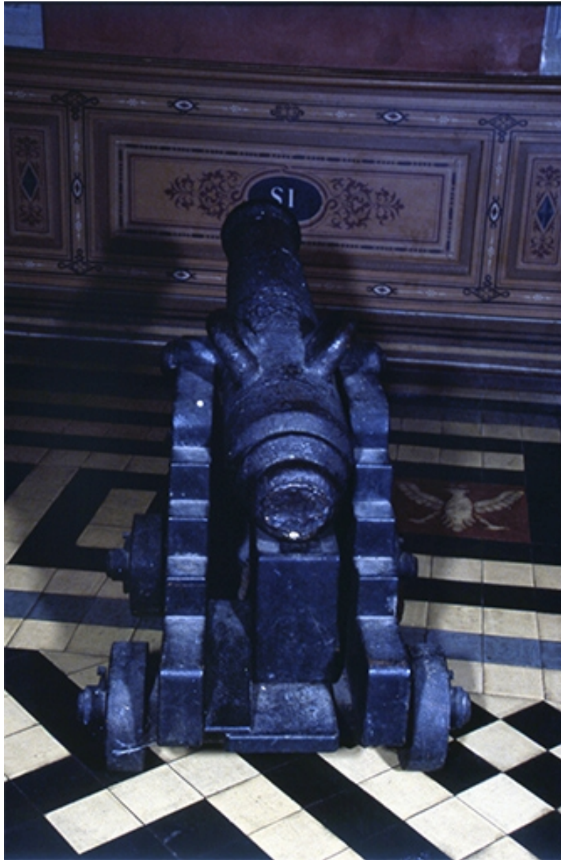
Vue postérieure d'un canon.