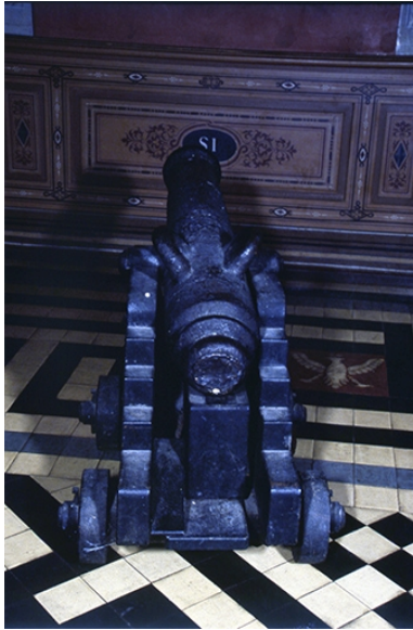
Vue postérieure d'un canon.