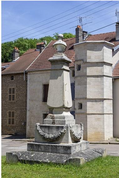
L'arrière du monument.