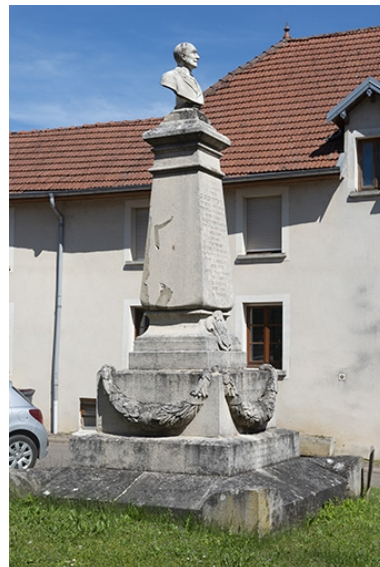
Le monument vu de trois quarts gauche.