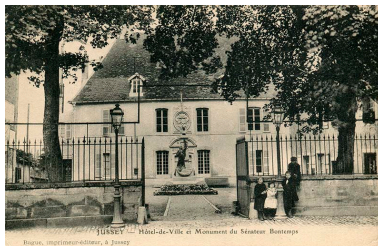
La cour de l'hôtel de ville avec le monument au début du 20e siècle.