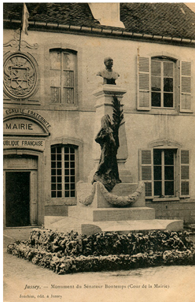
Le monument dans la cour de la mairie au début du 20e siècle.