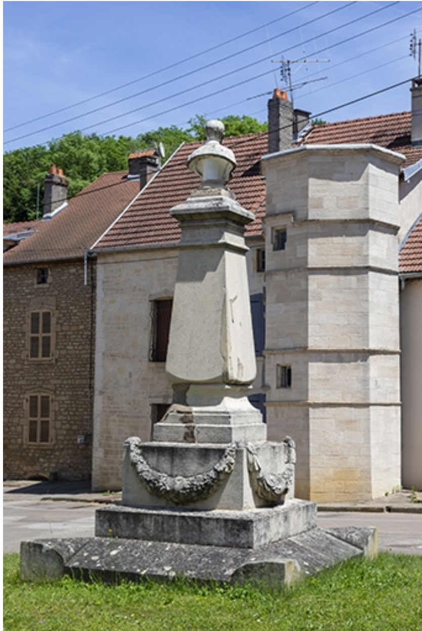
L'arrière du monument.