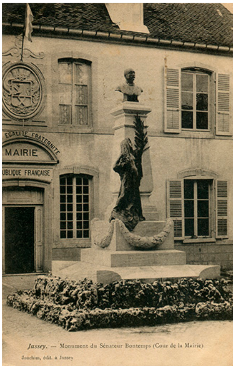
Jussey. — Monument du Sénateur Bontemps (Cour de la Mairie)