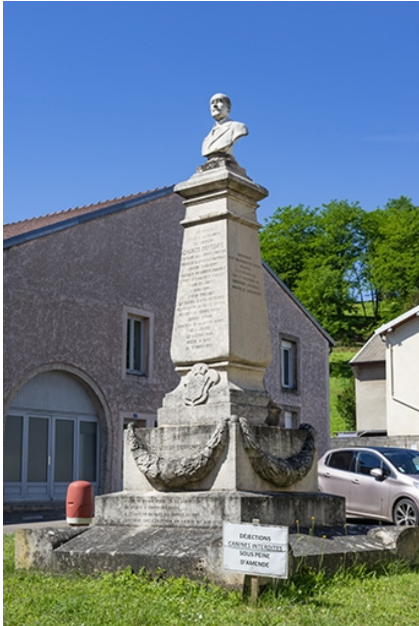
Le monument vu de trois quarts droit.