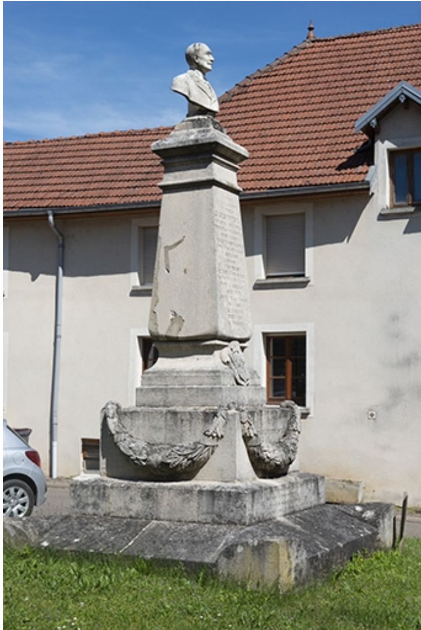
Le monument vu de trois quarts gauche.