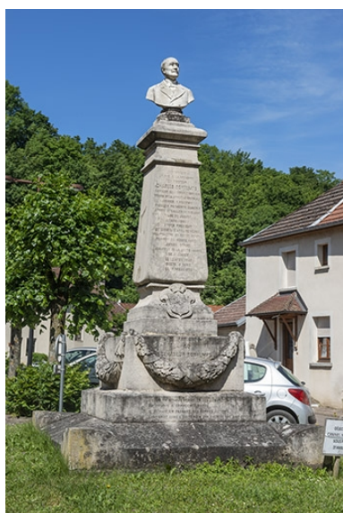
Le monument vu de face. IVR43_20217000385NUC4A