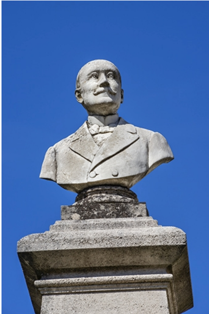
Le portrait en buste de Charles Bontemps.