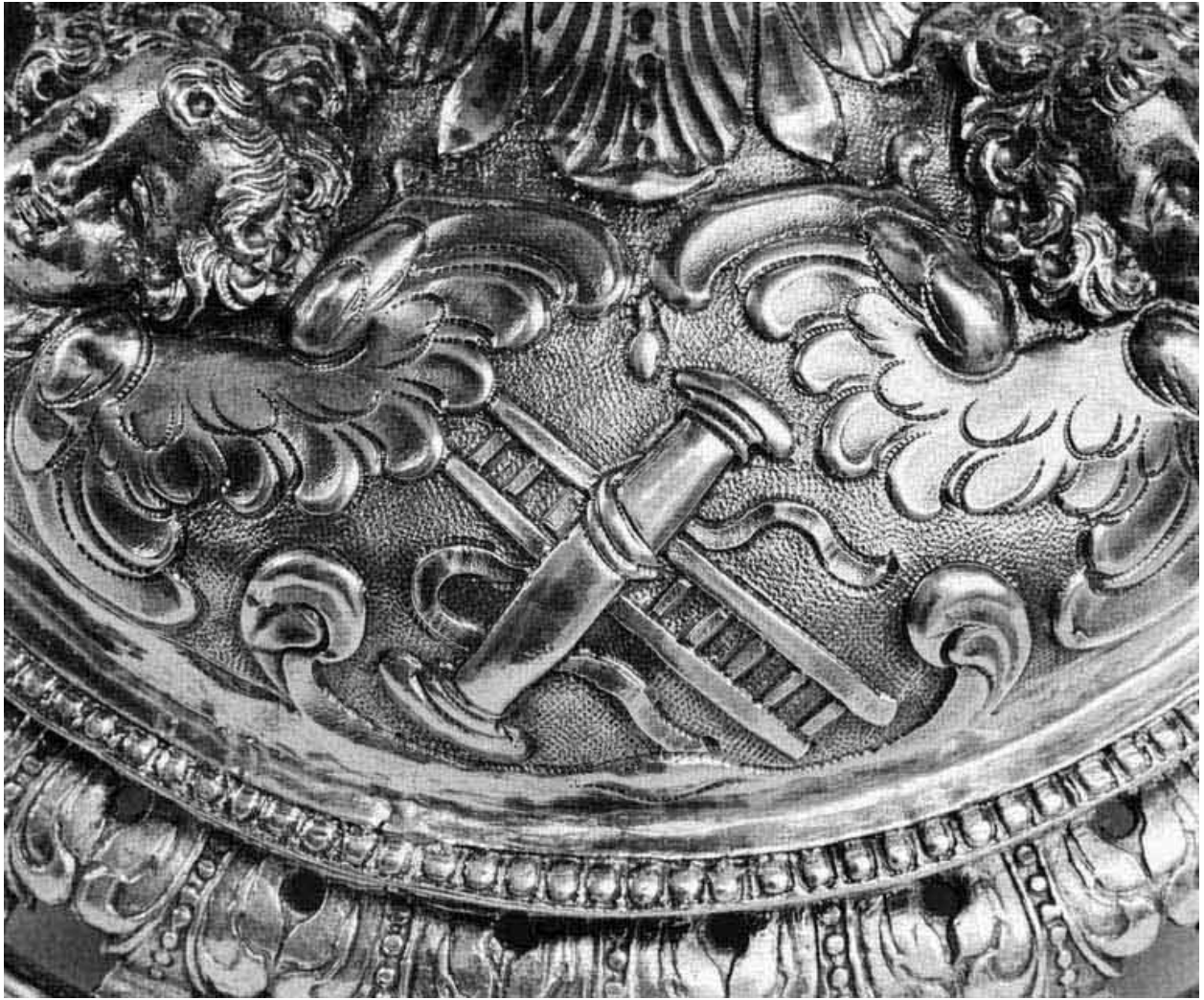
Détail du pied.