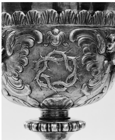
Détail de la fausse-coupe. IVR26_19792100742X