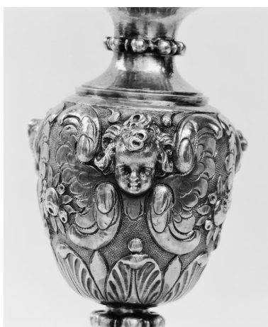
Détail du noeud.