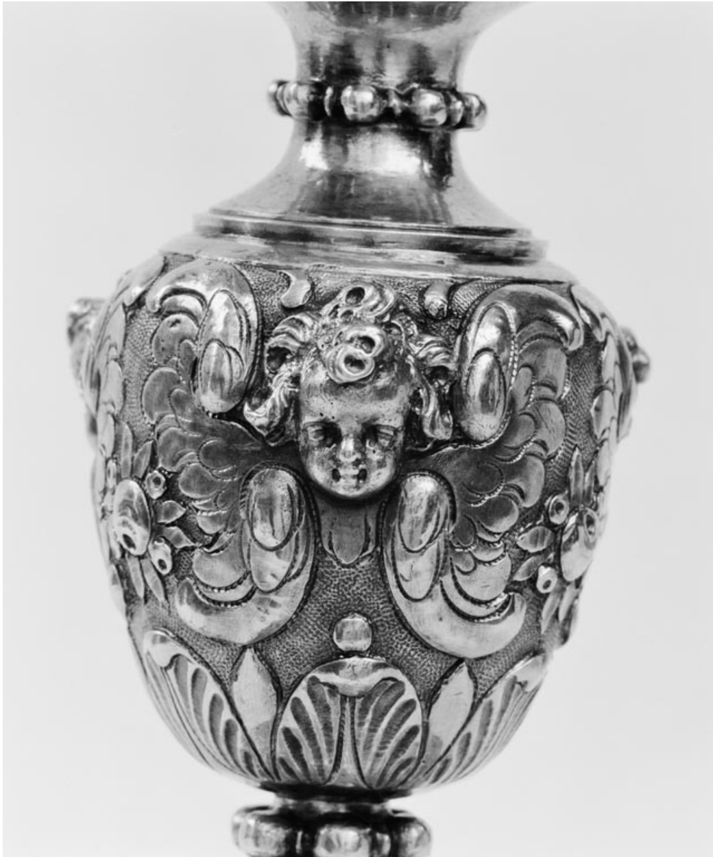
Détail du noeud.