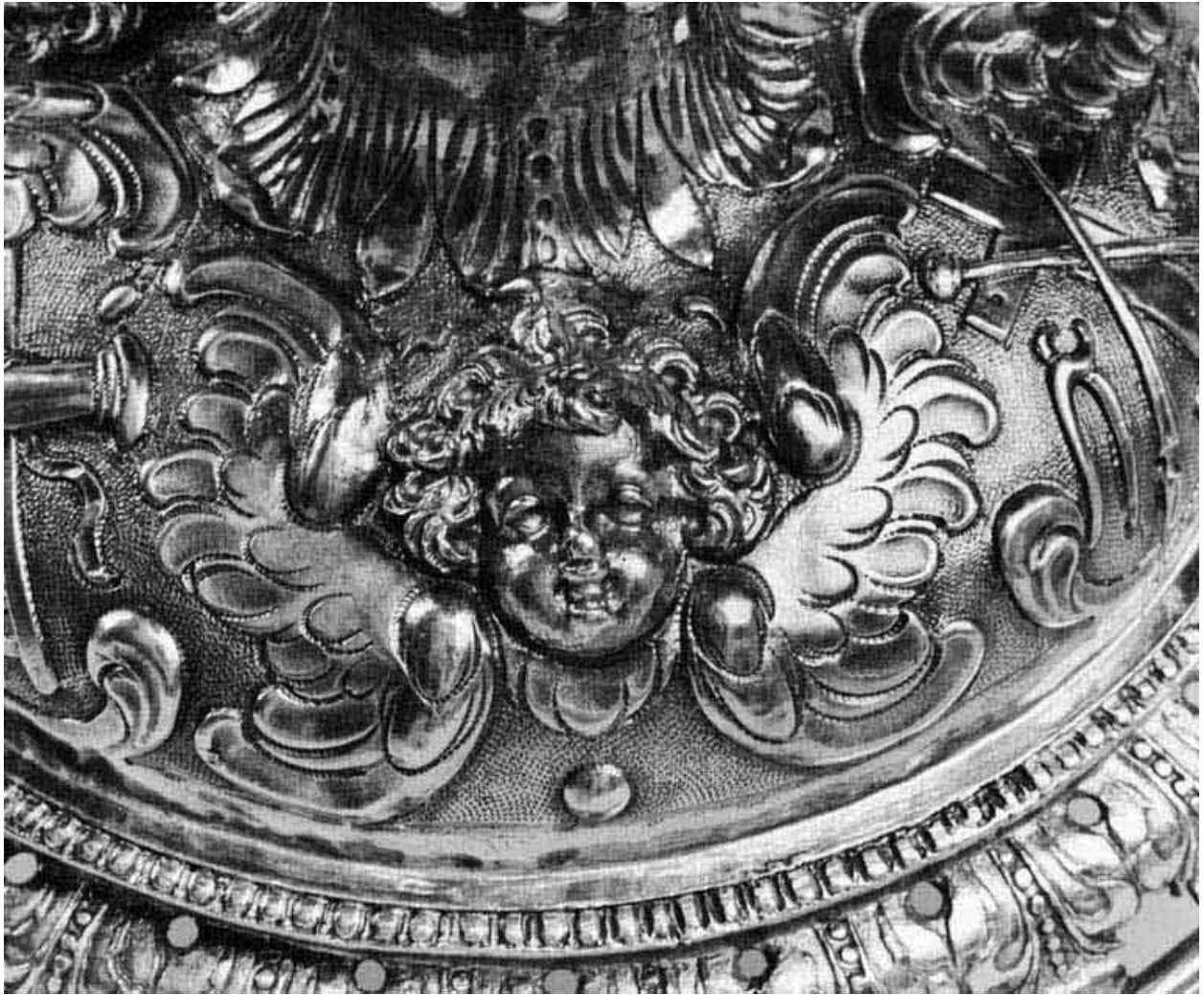
Détail du pied.