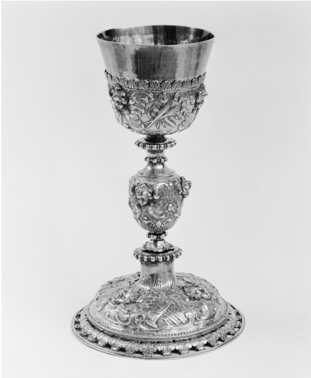
Vue d'ensemble du calice.