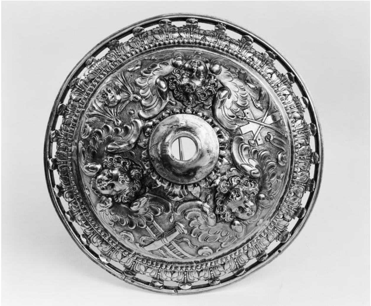
Détail du pied.