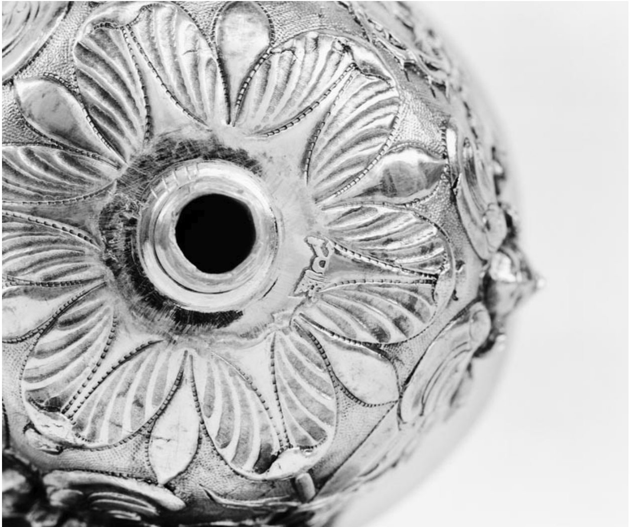
Détail des poinçons sur la fausse-coupe.