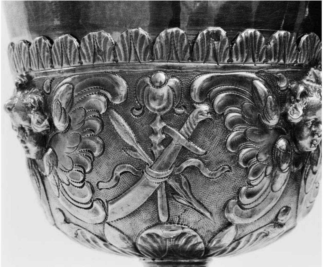
Détail de la fausse-coupe.