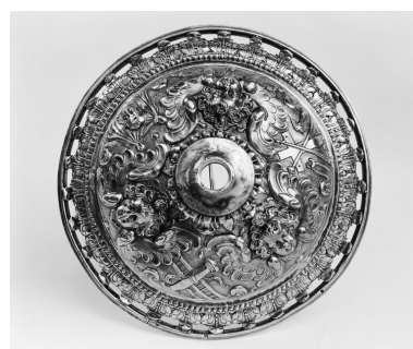
Détail du pied.