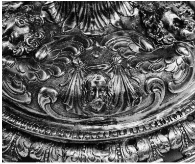
Détail du pied. IVR26_19792100740X