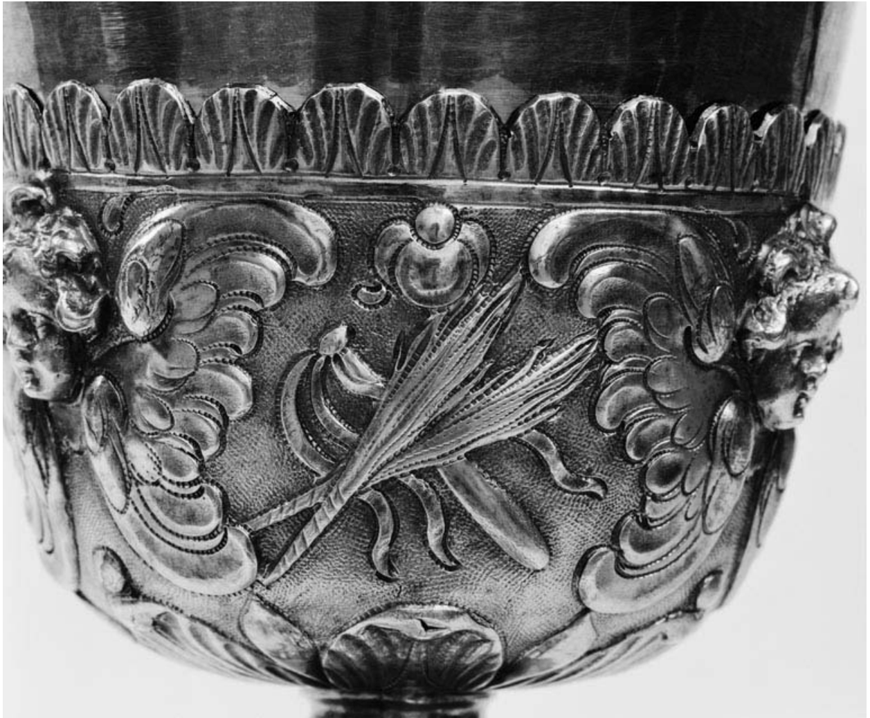
Détail de la fausse-coupe.