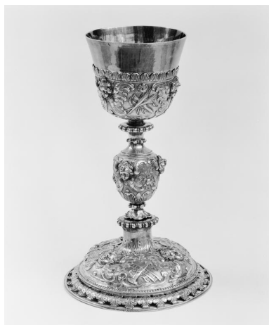
Vue d'ensemble du calice. IVR26_19792100734X