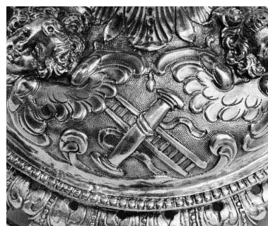
Détail du pied.