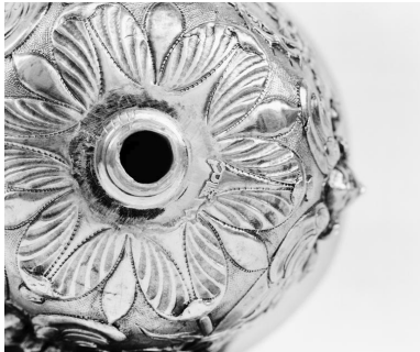
Détail des poinçons sur la fausse-coupe.