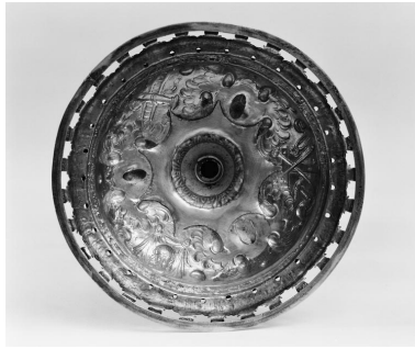
Détail du pied (revers).