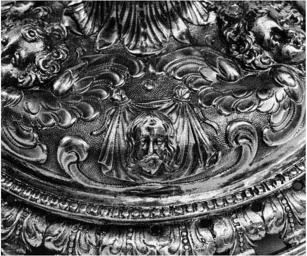
Détail du pied.