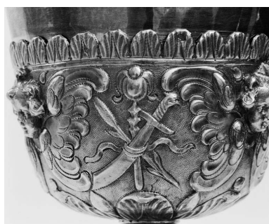
Détail de la fausse-coupe.