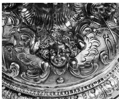
Détail du pied. IVR26_19792100737X