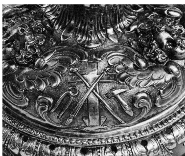
Détail du pied. IVR26_19792100738X