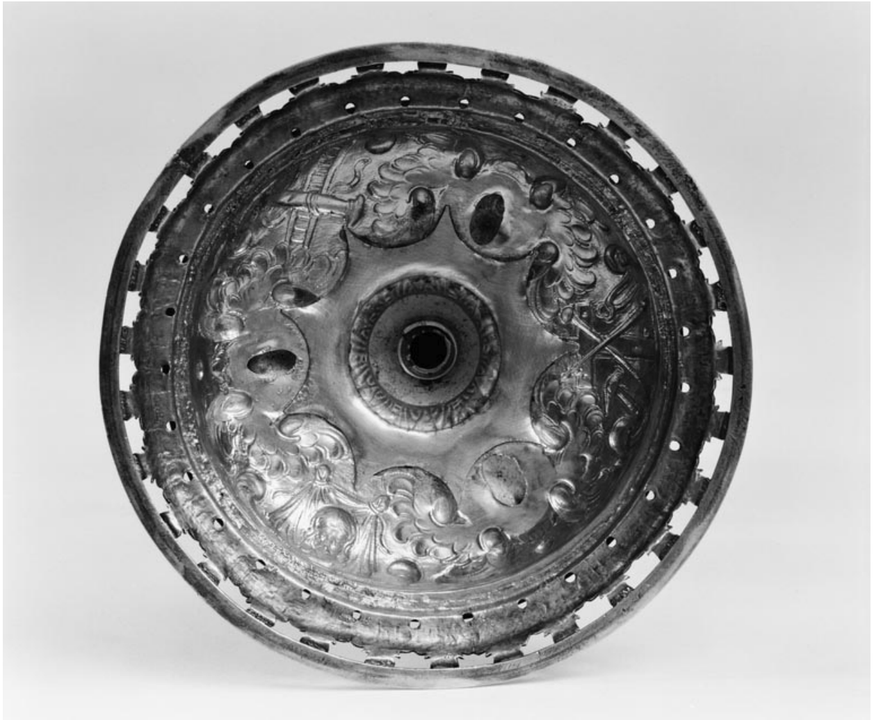
Détail du pied (revers).