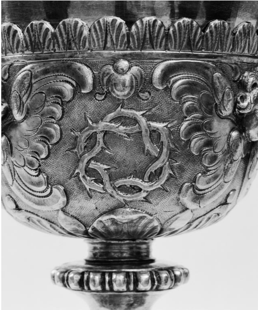
Détail de la fausse-coupe.