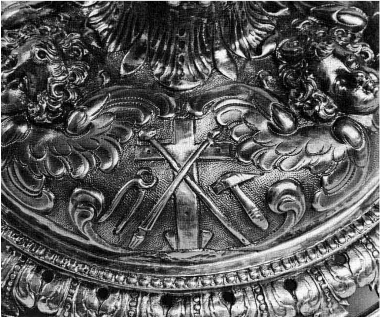
Détail du pied.