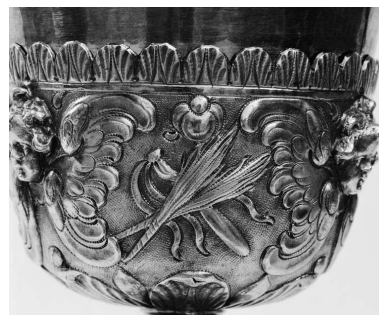
Détail de la fausse-coupe.