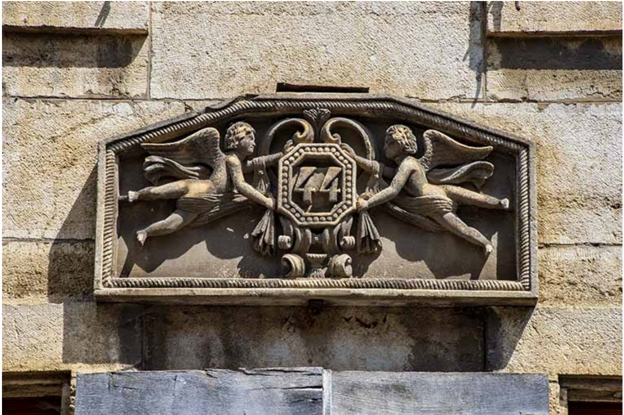
Cartouche en bas-relief.