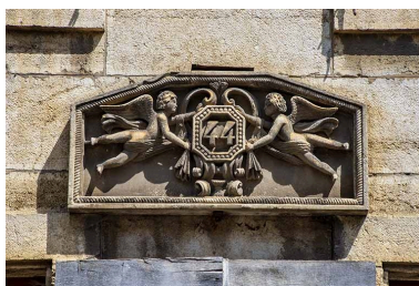
Cartouche en bas-relief. IVR43_20217000219NUC4A