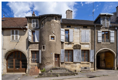
La façade antérieure depuis la rue. IVR43_20217000220NUC4A

IVR43_20257000052NUDA