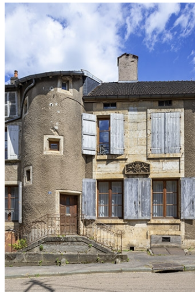
La façade antérieure, vue rapprochée.