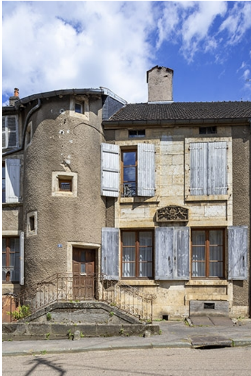
La façade antérieure, vue rapprochée.