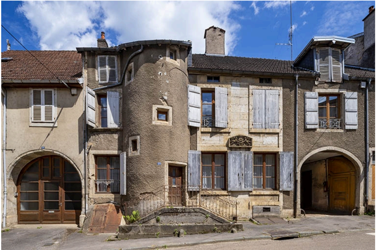
La façade antérieure depuis la rue.