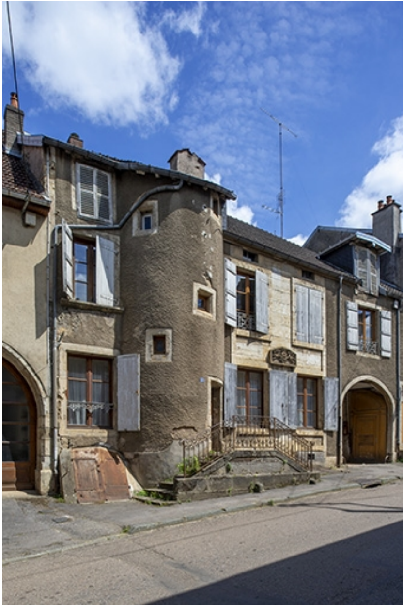
La façade antérieure, trois quarts gauche.