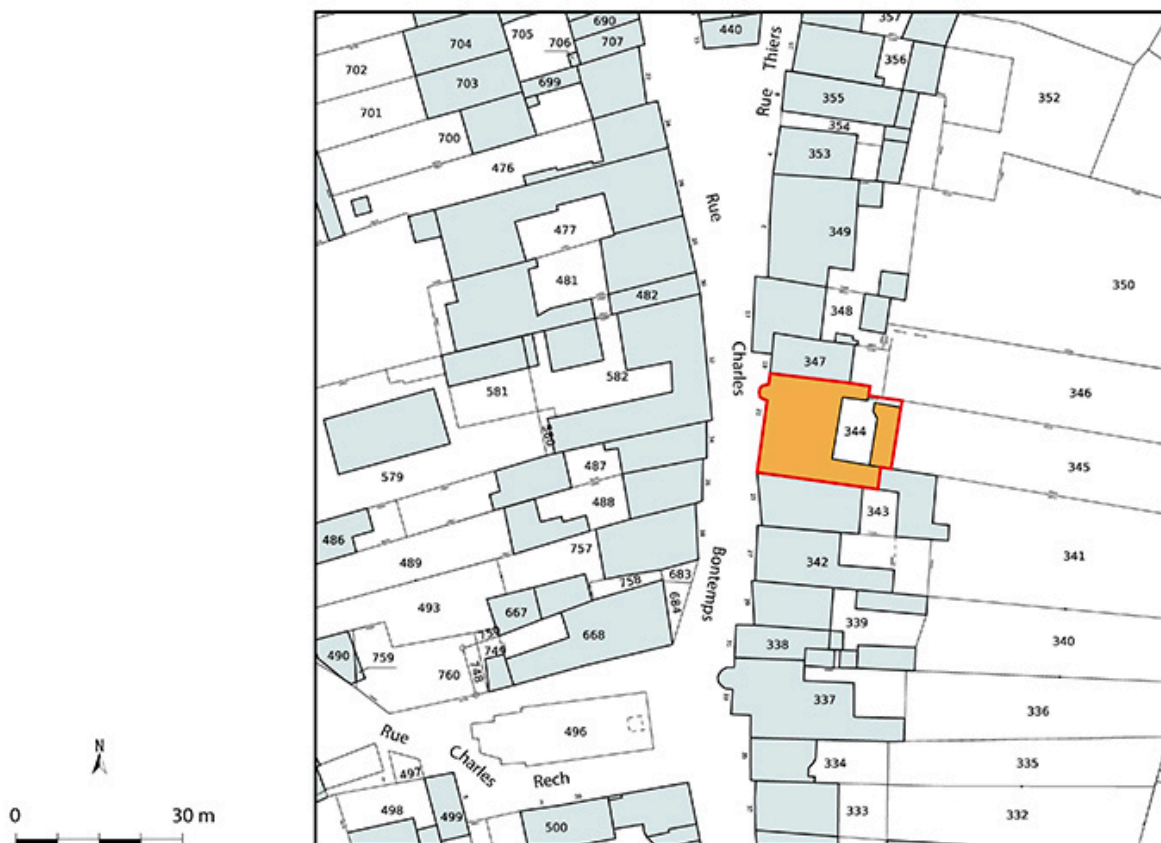
Plan-masse et de situation. Extrait du plan cadastral numérisé de la direction générale des finances publiques, 2025, 1/750.