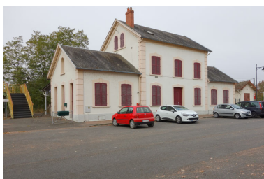
Façade, côté place. IVR26_20215800041NUC2A