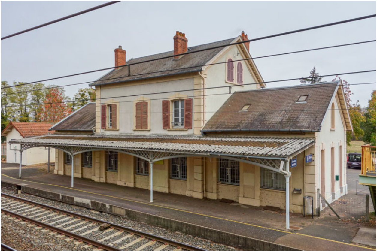
Façade, côté voie ferrée.