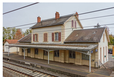
Façade, côté voie ferrée. IVR26_20215800040NUC2A