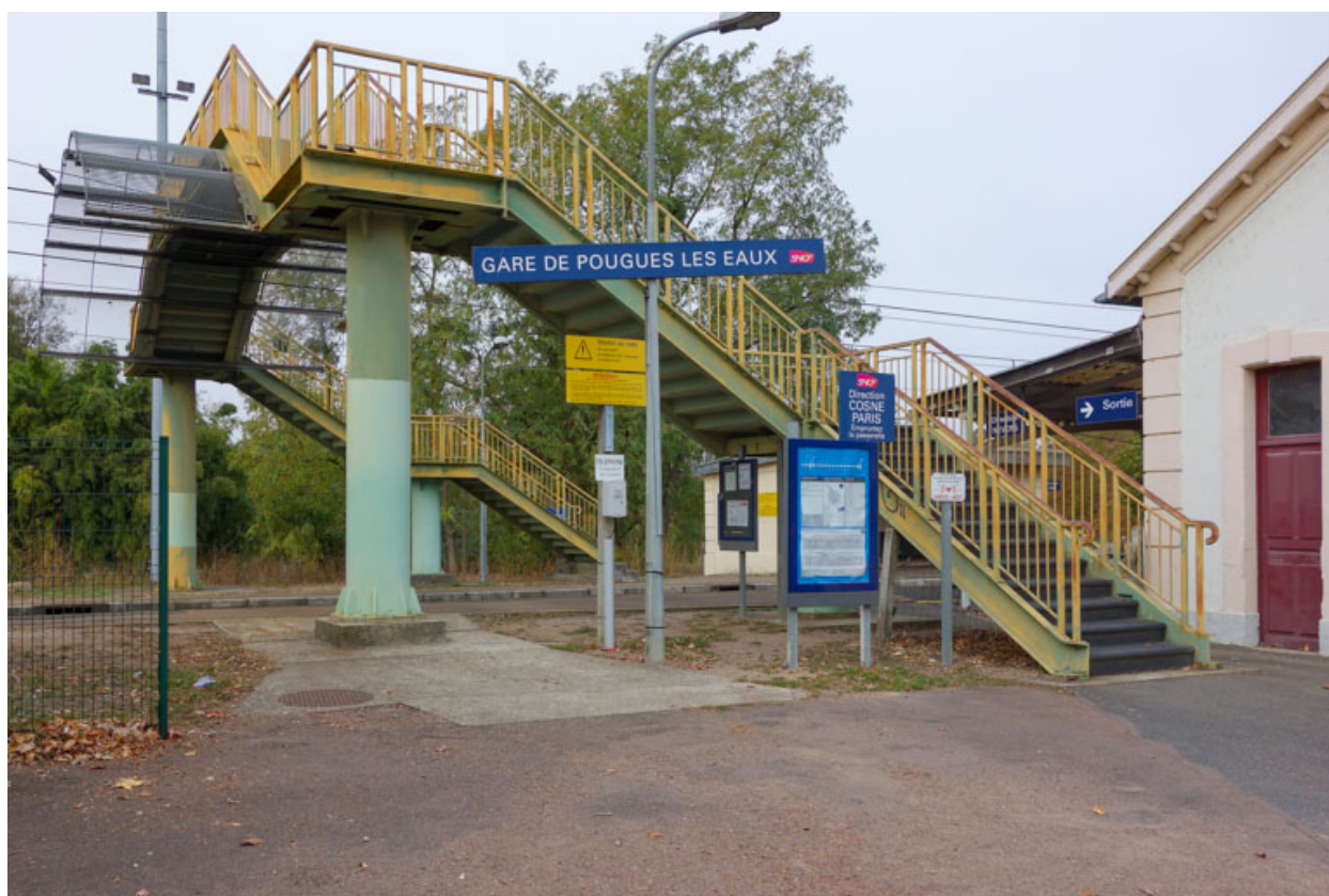
Passerelle au-dessus de la voie ferrée.