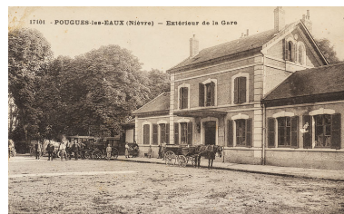
Façade, côté place. IVR26_20205800062NUC2A