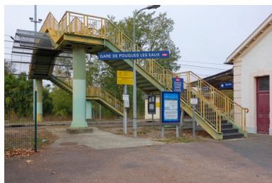
Passerelle au-dessus de la voie ferrée. IVR26_20215800039NUC2A