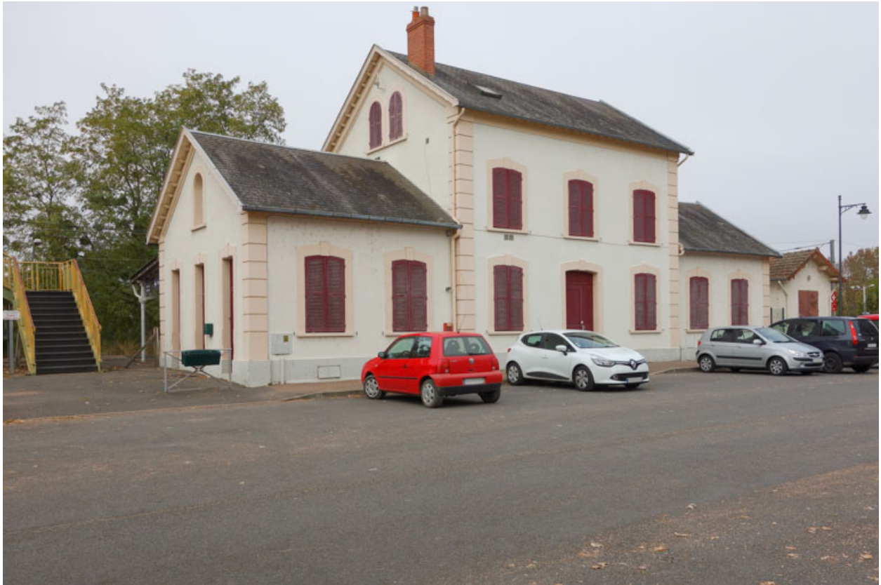
Façade, côté place.