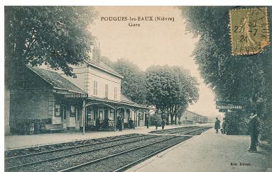
Façade, côté voie ferrée. IVR26_20205800063NUC2A