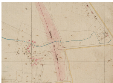
Écart des Métairies dans le plan du cadastre ancien dit napoléonien (1812) avec le tracé de la voie ferrée (vers 1861).