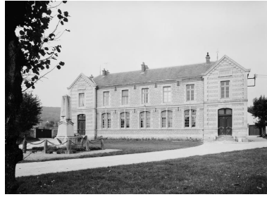
Vue d'ensemble. IVR26_19792101521V