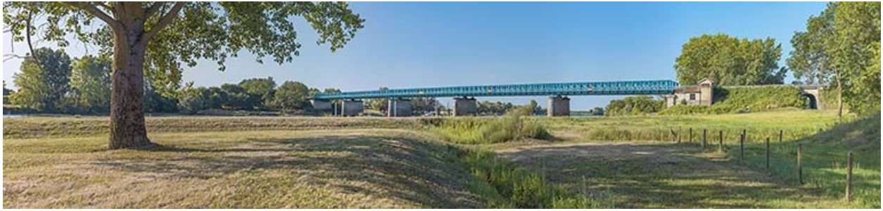
Vue d'ensemble du pont de Chauvort, depuis l'amont.