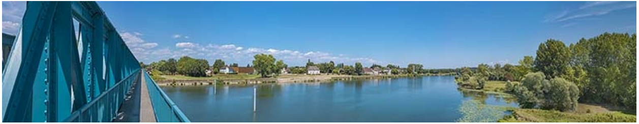
Le hameau de Chauvort vu depuis le pont.