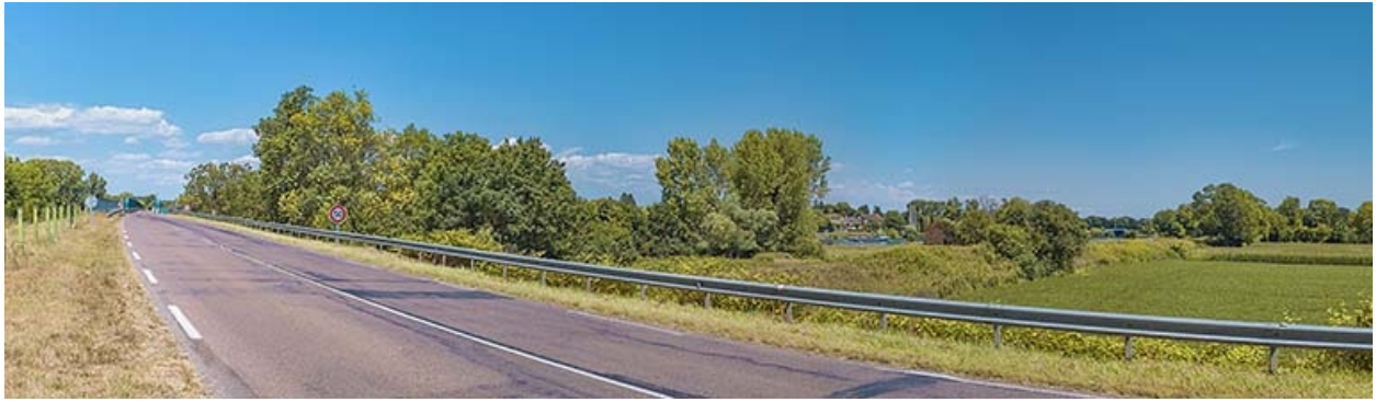
Chauvort et le pont, vue d'ensemble.