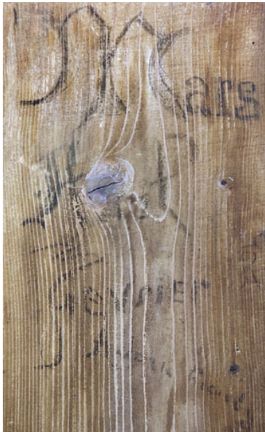
Inscriptions peintes sur la caisse. IVR43_20112500398NUC4A