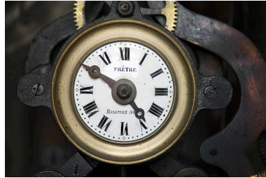
Détail : le cadran de contrôle.