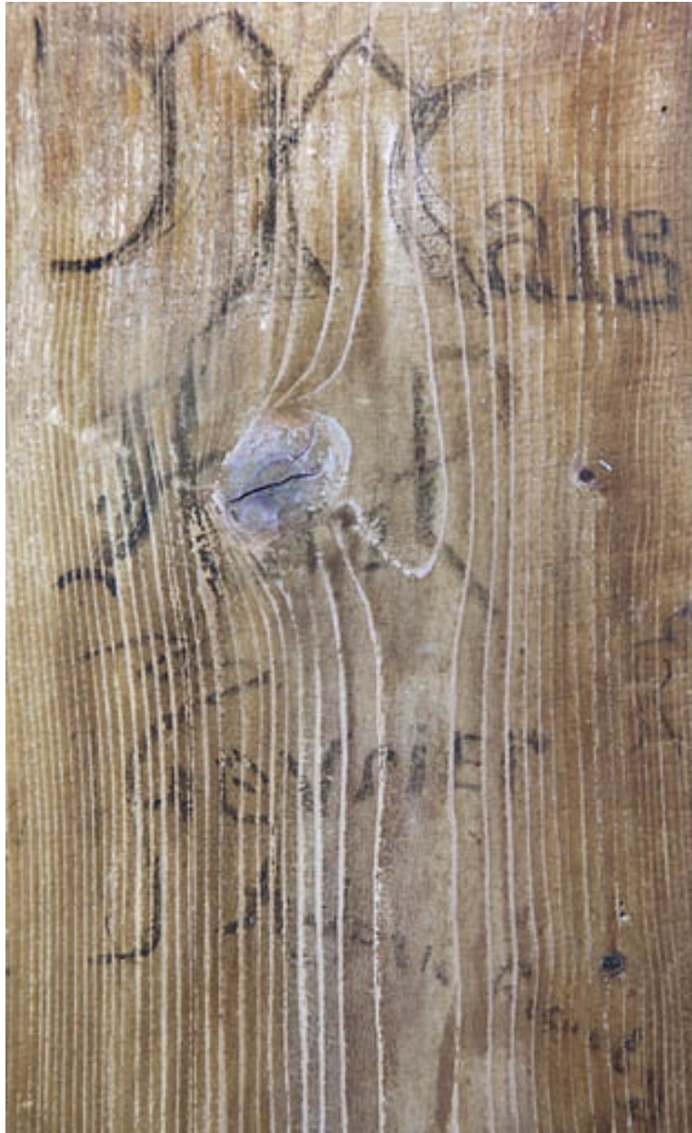
Inscriptions peintes sur la caisse.