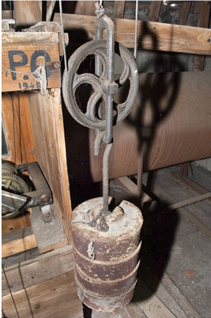
Un des poids actionnant les filins et l'une des inscriptions peintes sur la caisse.