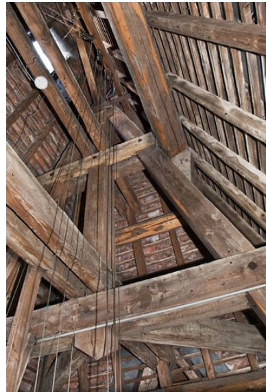
Les fils actionnant les cloches fixées au faîtage de la toiture. IVR43_20112502911NUC2A