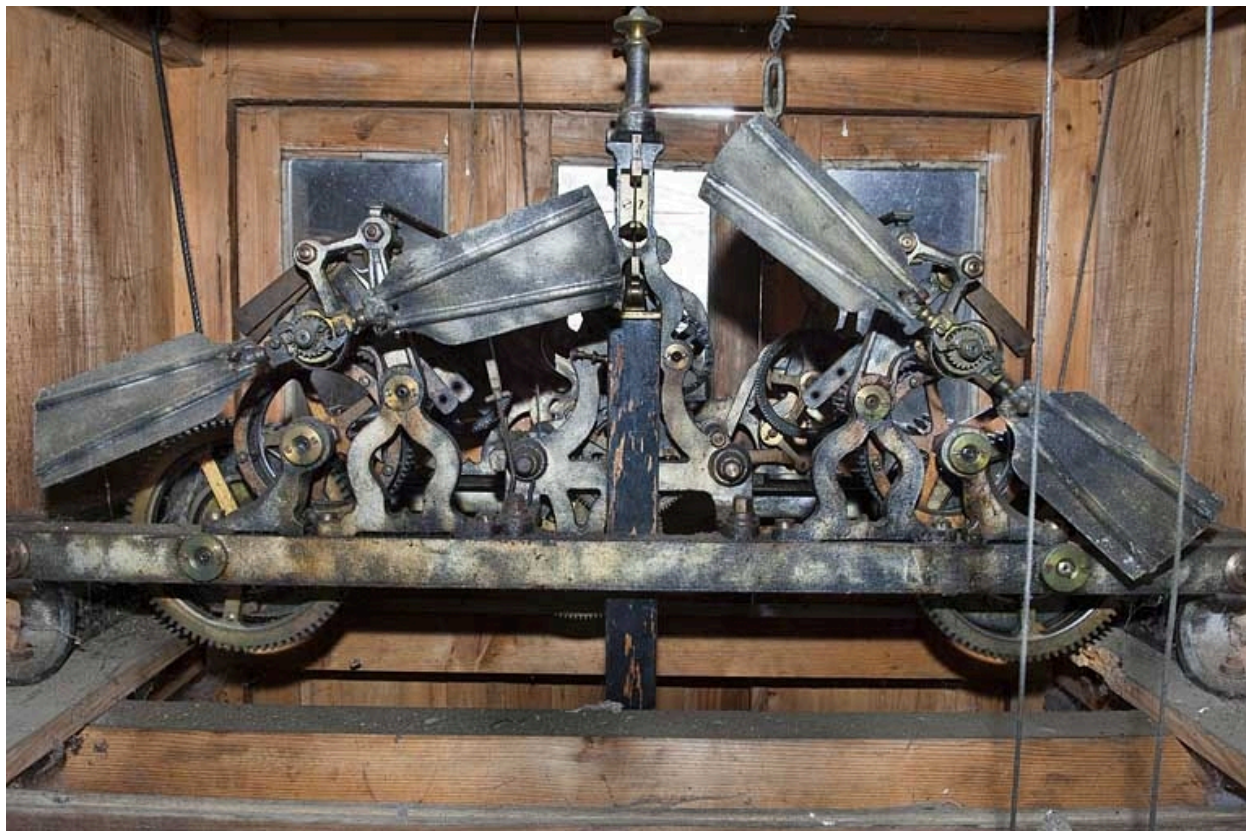
Vue du revers du mécanisme.