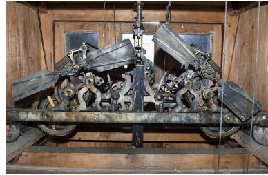
Vue du revers du mécanisme. IVR43_20112502910NUC2A