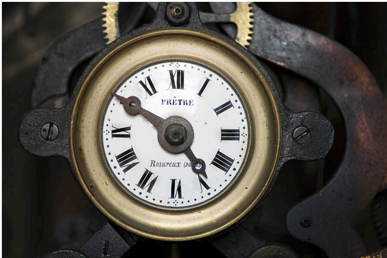
Détail : le cadran de contrôle.