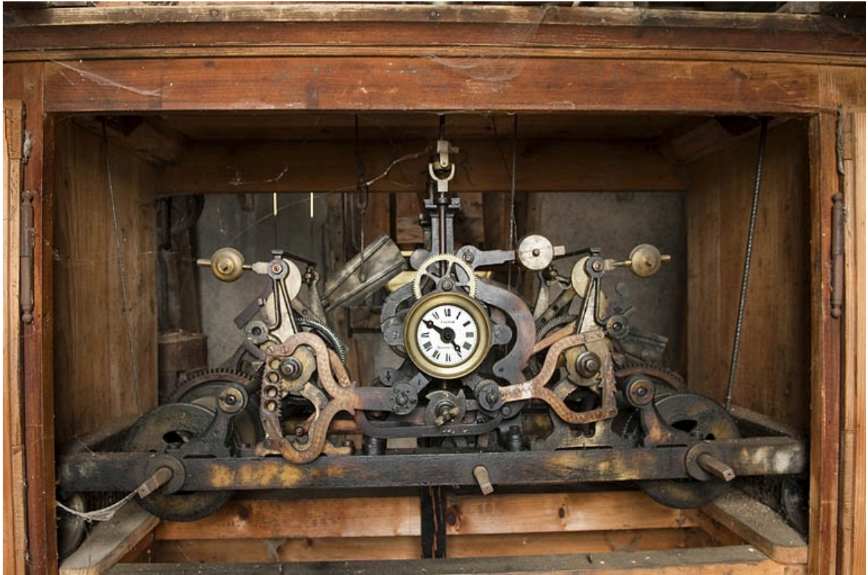
Vue générale du mécanisme.