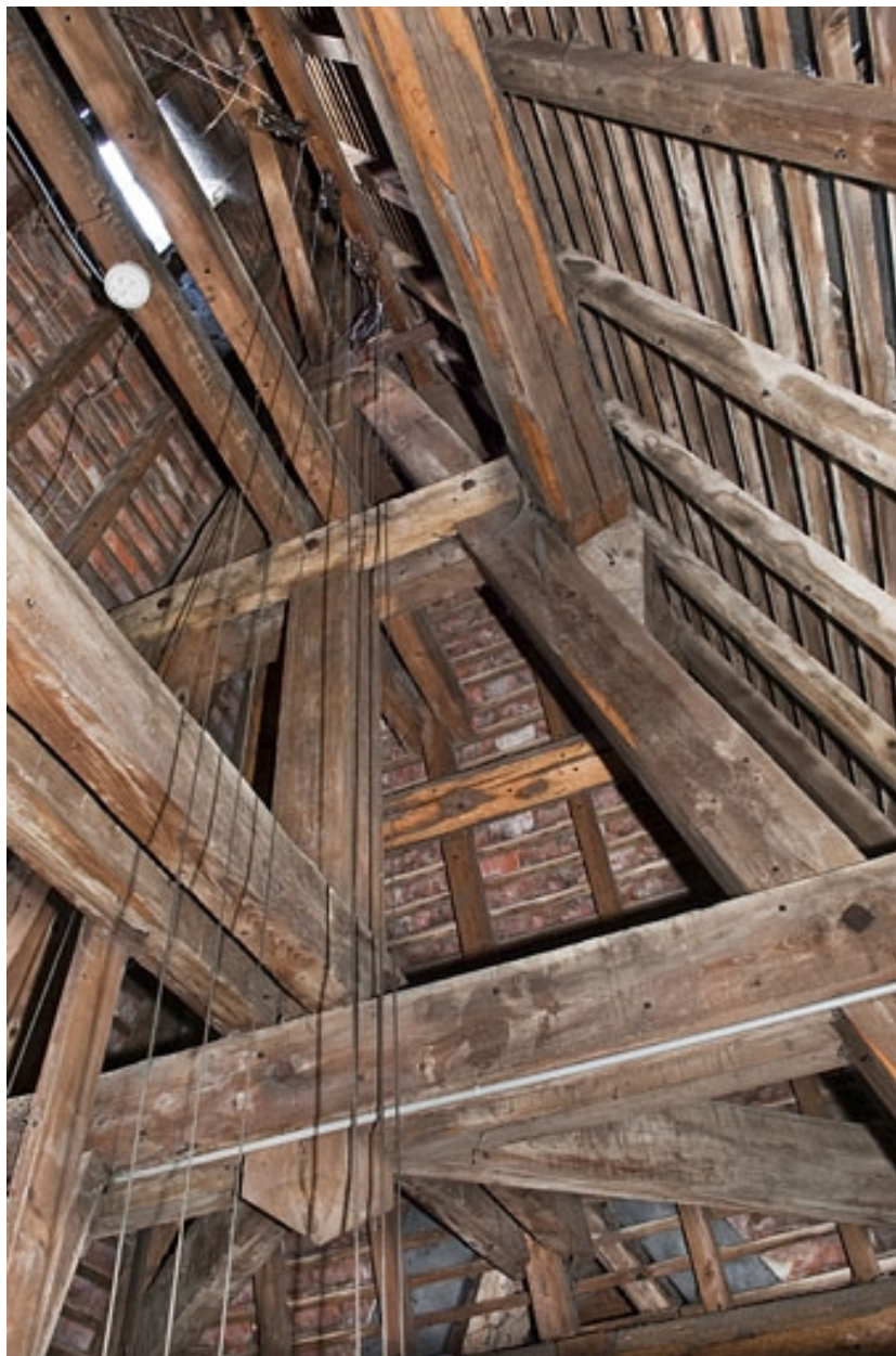
Les filins actionnant les cloches fixées au faîtage de la toiture.