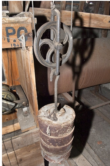
Un des poids actionnant les fils et l'une des inscriptions peintes sur la caisse. IVR43_20112502912NUC2A