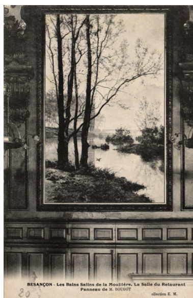
Vue ancienne du tableau encore en place dans la salle du restaurant.

Autr. auteur inconnu, Dess. Aline Thomas IVR43_20232500474NUDA