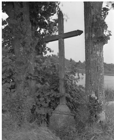
Croix de chemin. IVR26_19748901278X