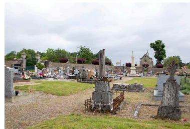
Vue d'ensemble du cimetière. IVR43_20157000305NUC2A