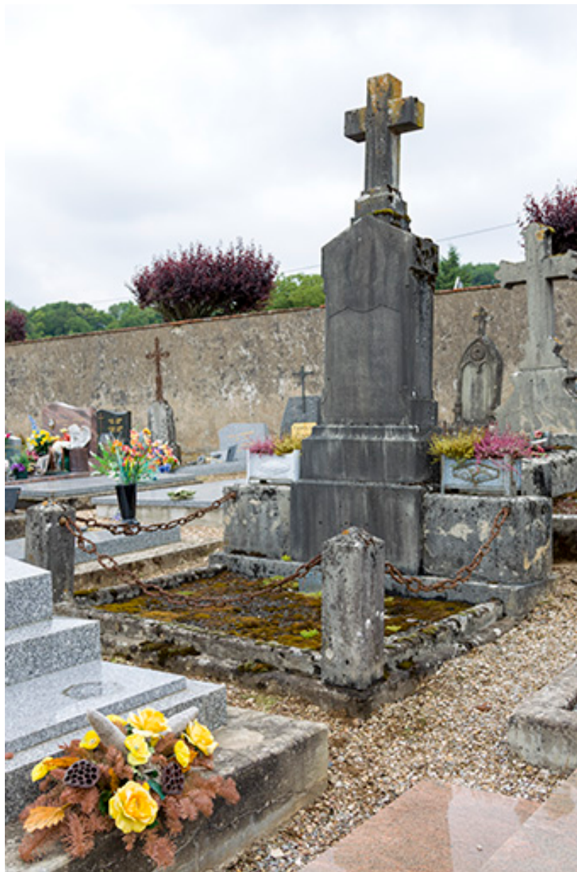
Tombeau d'Eugène Jardel.