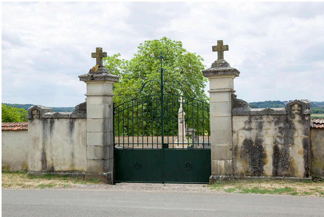
Entrée rue de Tincey.