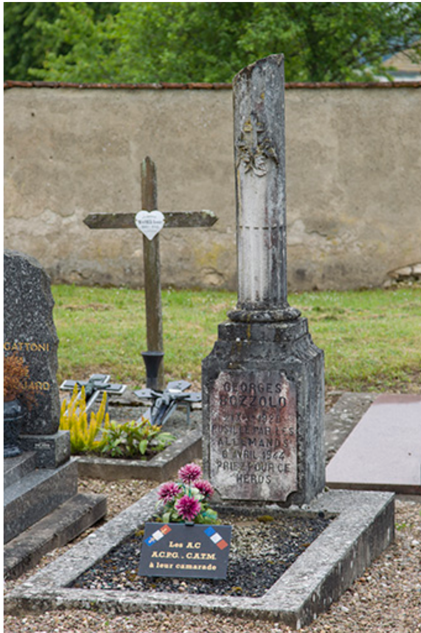
Tombeau de Bozzolo.