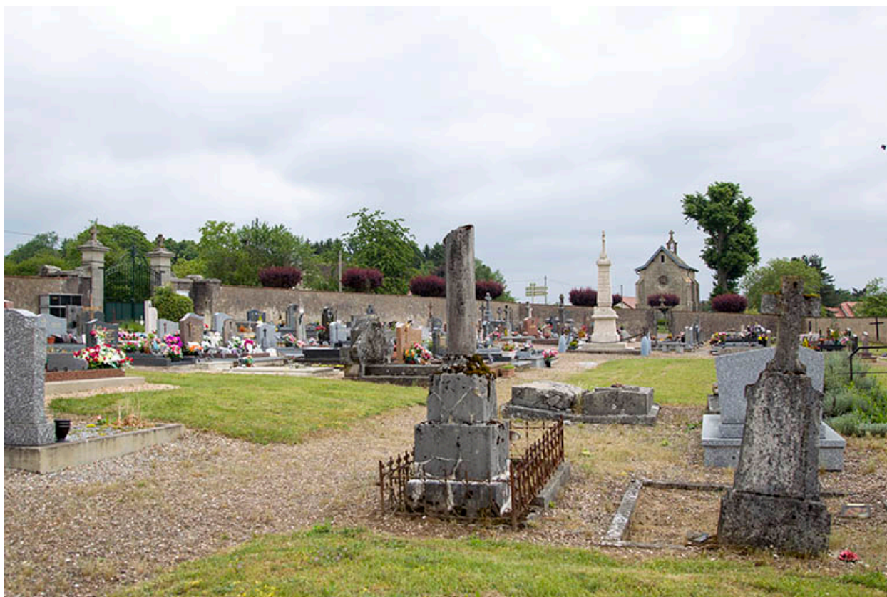
Vue d'ensemble du cimetière.