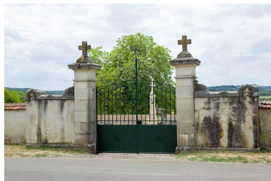
Entrée rue de Tincey.