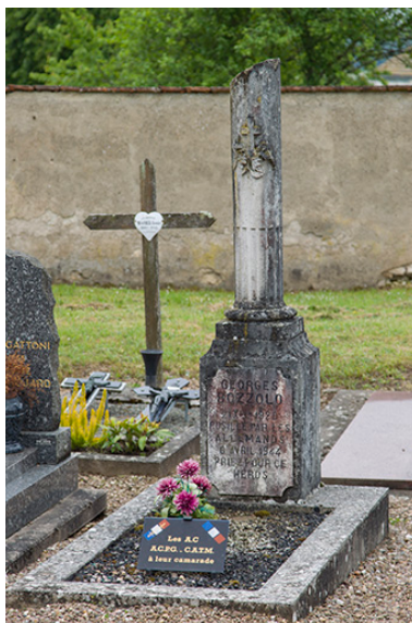
Tombeau de Bozzolo. IVR43_20157000303NUC2A