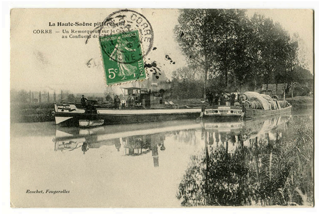
La Haute-Saône pittoresque. Un remorqueur sur le canal au confluent du Coney et de la Saône. Carte postale.