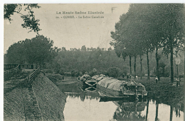
Corre. La Saône canalisée. Carte postale. IVR43_20167000099NUC4A