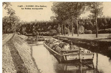
Corre. La Saône navigable. Carte postale n° 17466 IVR43_20167000105NUC4A