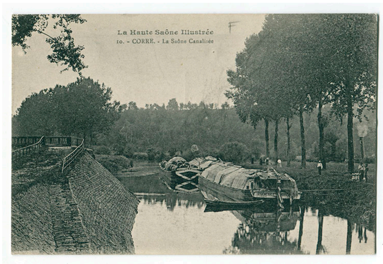
Corre. La Saône canalisée. Carte postale.