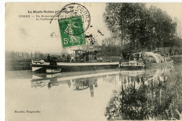
La Haute-Saône pittoresque. Un remorqueur sur le canal au confluent du Coney et de la Saône. Carte postale. IVR43_20167000101NUC4A