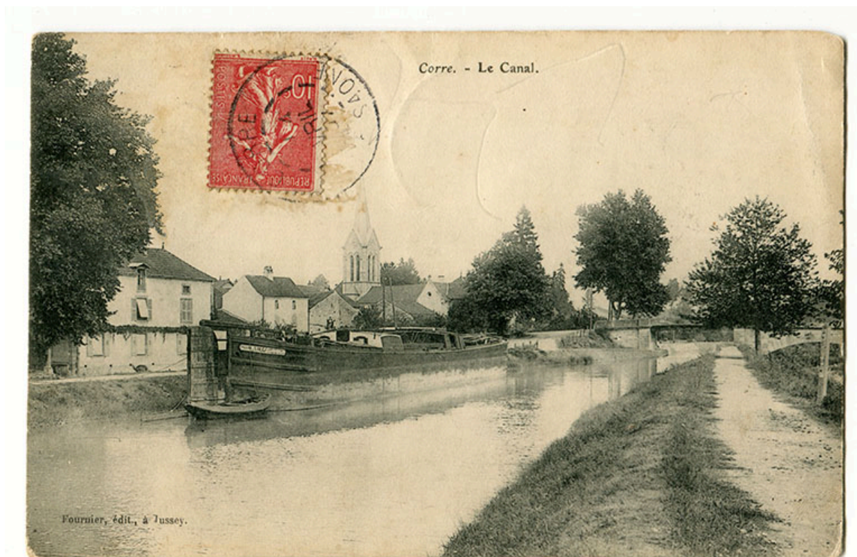
Corre. Le canal. Carte postale. (Vue antérieure à avril 1907)