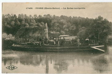
Corre. La Saône navigable. Carte postale IVR43_20167000100NUC4A