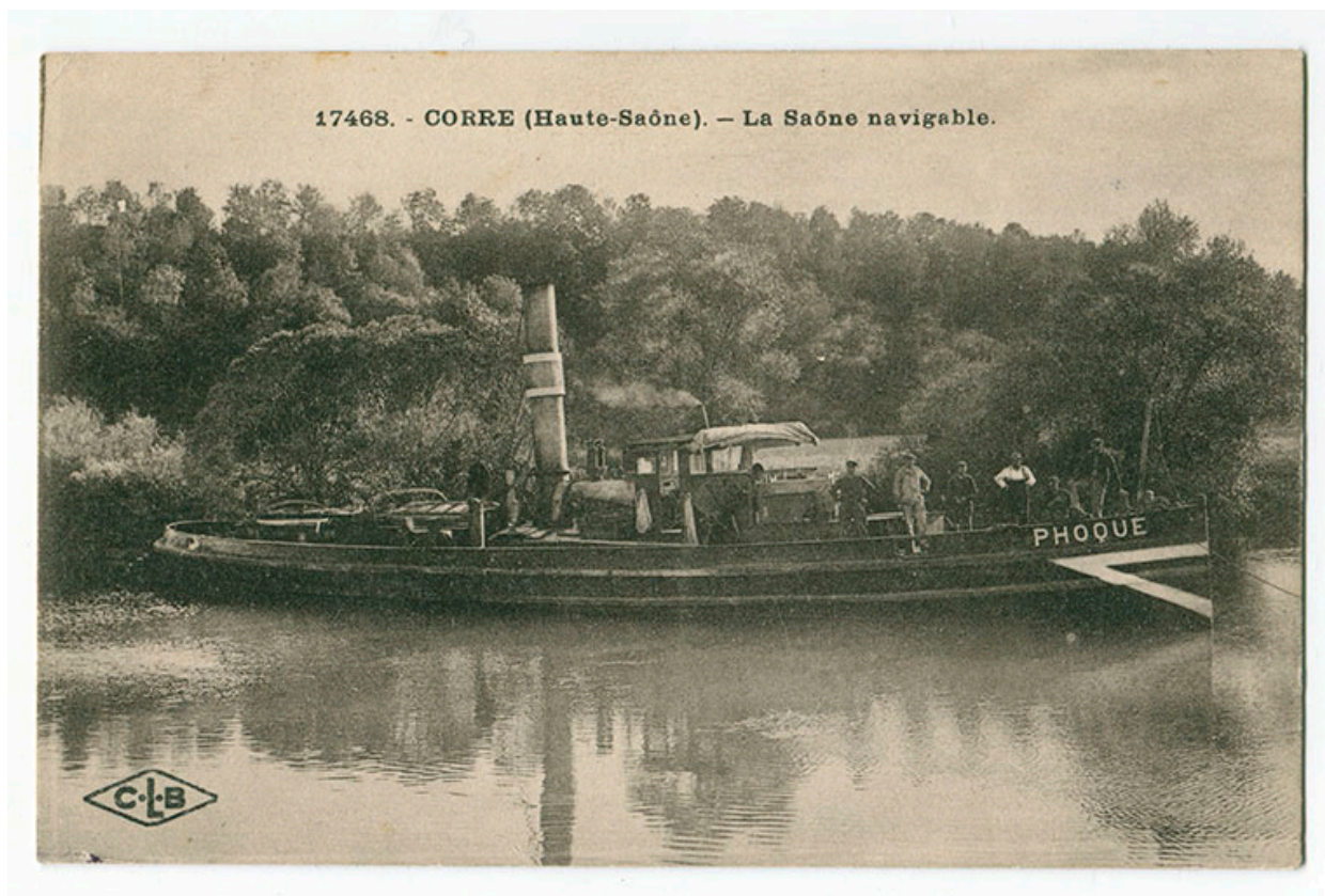
Corre. La Saône navigable. Carte postale