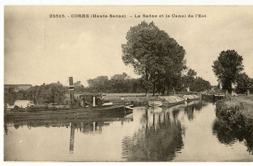
Corre. (Haute-Saône) La Saône et le canal de l'est. Carte postale n°25515. IVR43_20167000103NUC4A