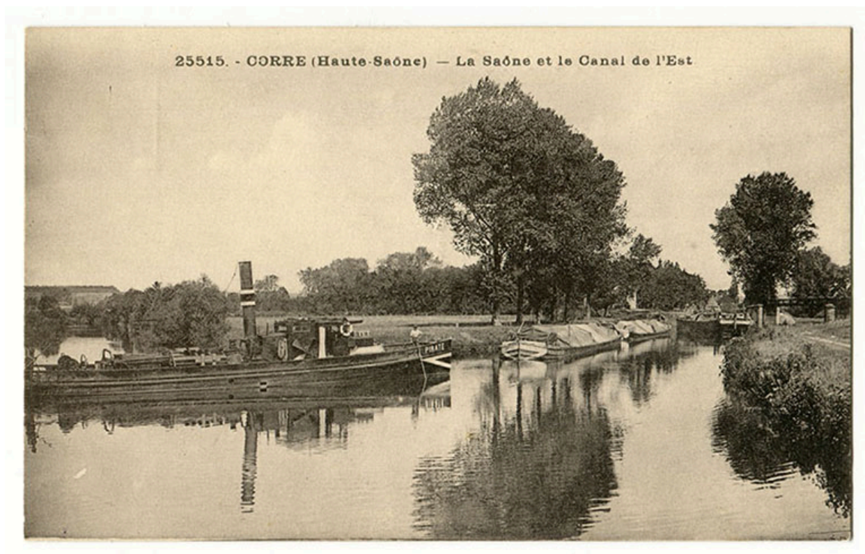
Corre. (Haute-Saône) La Saône et le canal de l'est. Carte postale n°25515.