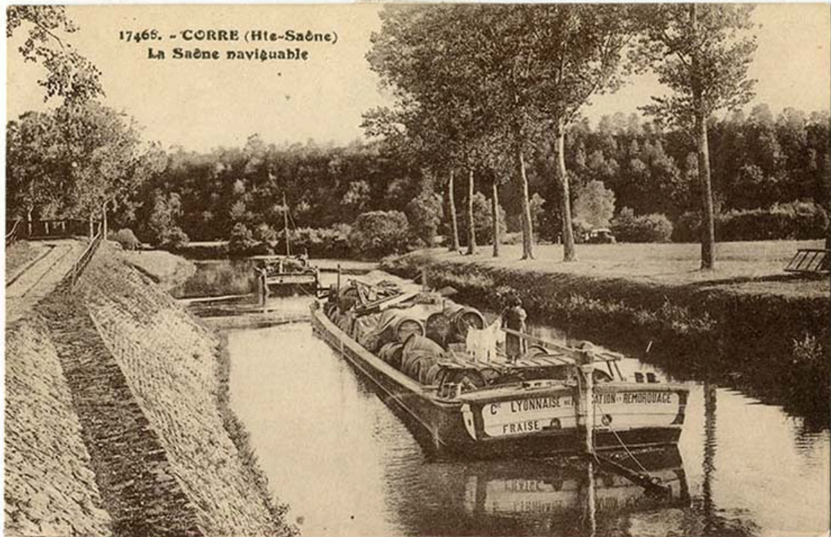
Corre. La Saône navigable. Carte postale n° 17466