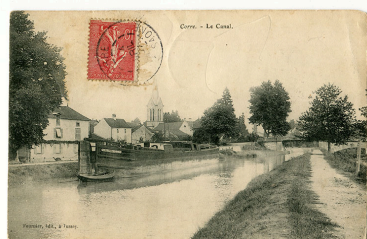
Corre. Le Canal. Carte postale. (Vue antérieure à avril 1907) IVR43_20167000102NUC4A