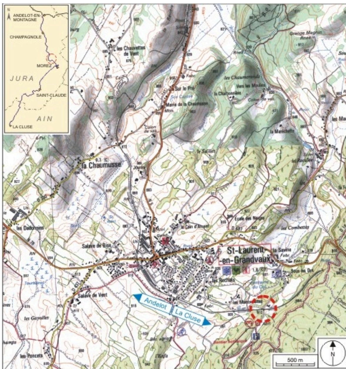
Carte et schéma de localisation. Carte topographique, IGN, 2000, dalle F087_049, échelle 1:25 000. Scan 25, licence n° 2008/CISE/2968.