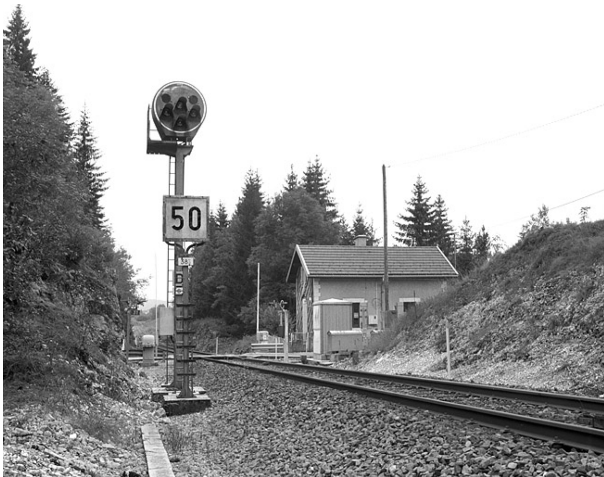
Vue d'ensemble depuis la voie, à l'est (côté La Cluse).