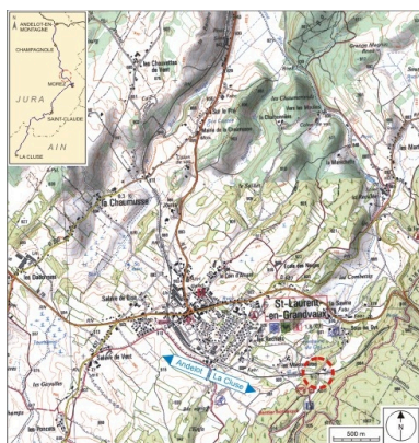
Carte et schéma de localisation. Carte topographique, IGN, 2000, dalle F087_049, échelle 1:25 000. Scan 25, licence n° 2008/CISE/2968. IVR43_20073900437NUDA