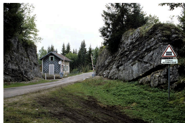
Vue d'ensemble, depuis le sud. IVR43_20043900276ZA