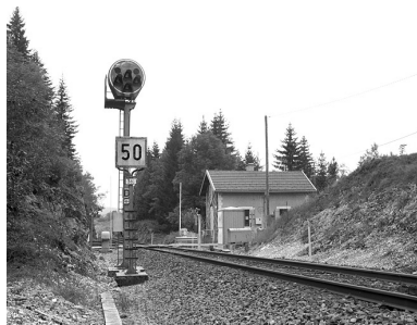
Vue d'ensemble depuis la voie, à l'est (côté La Cluse). IVR43_20043900279X