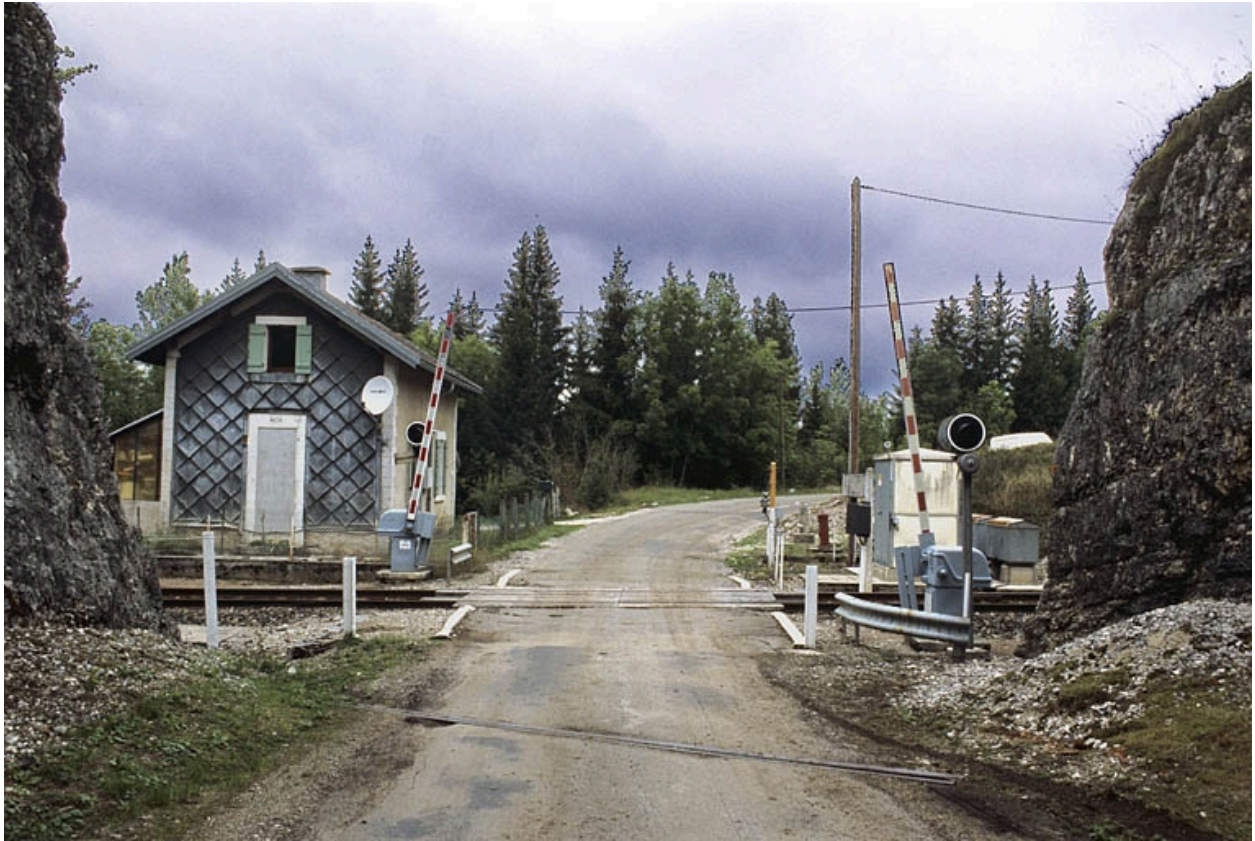
Façade sud (côté voie).