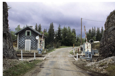
Façade sud (côté voie). IVR43_20043900278ZA