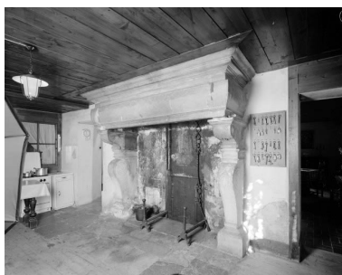
Intérieur : cheminée en pierre.