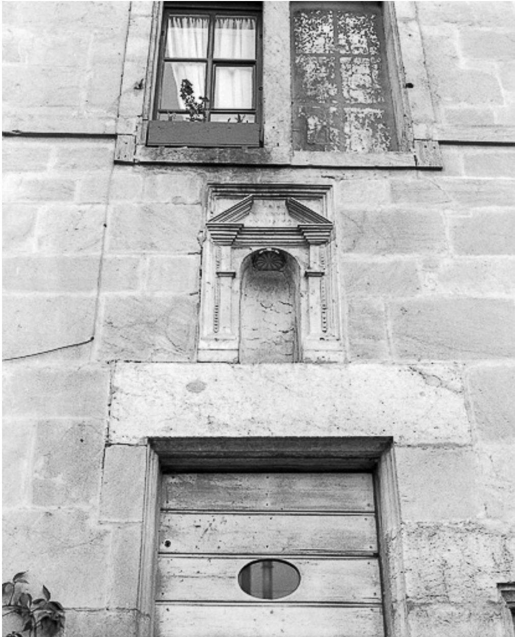
Détail : niche sur la façade antérieure.