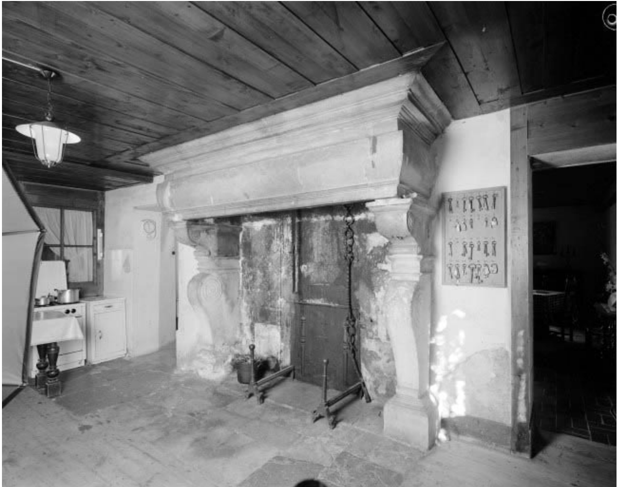
Intérieur : cheminée en pierre.