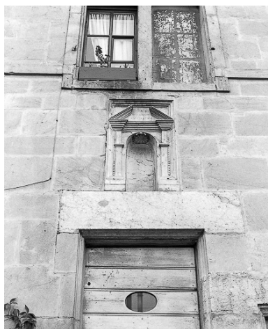
Détail : niche sur la façade antérieure. IVR43_19762500678X