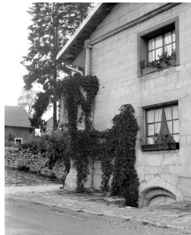
Façade antérieure : partie gauche avec contrefort et entrée de cave. IVR43_19762500679X