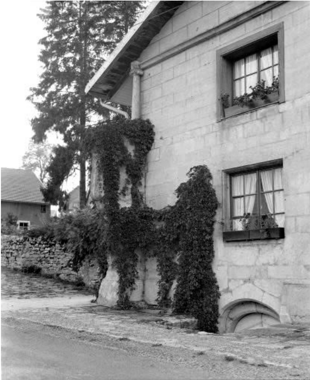
Façade antérieure : partie gauche avec contrefort et entrée de cave.