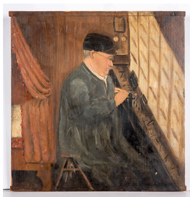
Vue d'ensemble. IVR43_20172501047NUC4A