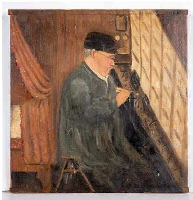
Vue d'ensemble. IVR43_20172501047NUC4A