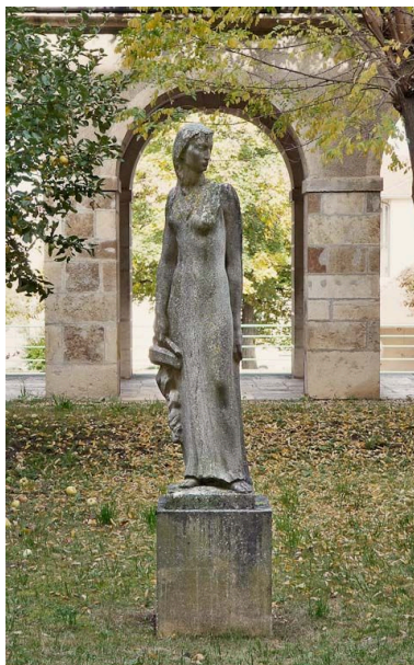
Vue d'ensemble. IVR26_20082101119NUC2A