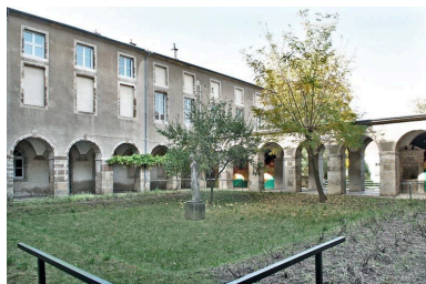
Vue d'ensemble. IVR26_20082101128NUC2A