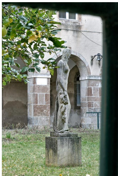
Vue latérale. IVR26_20082101122NUC2A