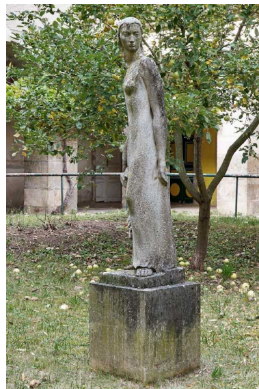
Vue de trois-quarts. IVR26_20082101121NUC2A