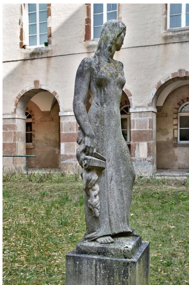
Vue de trois-quarts. IVR26_20082101120NUC2A