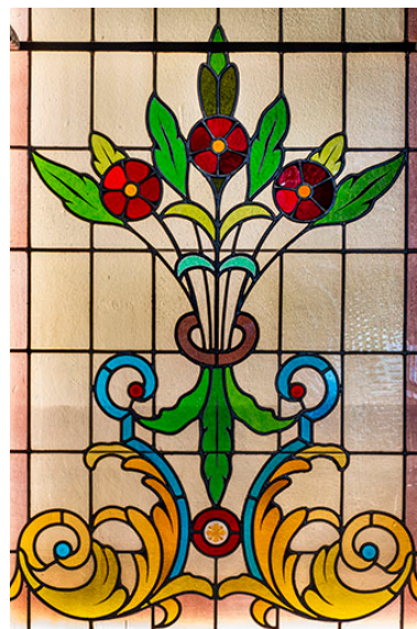
Détail de la verrière de gauche. IVR43_20232500368NUC4A