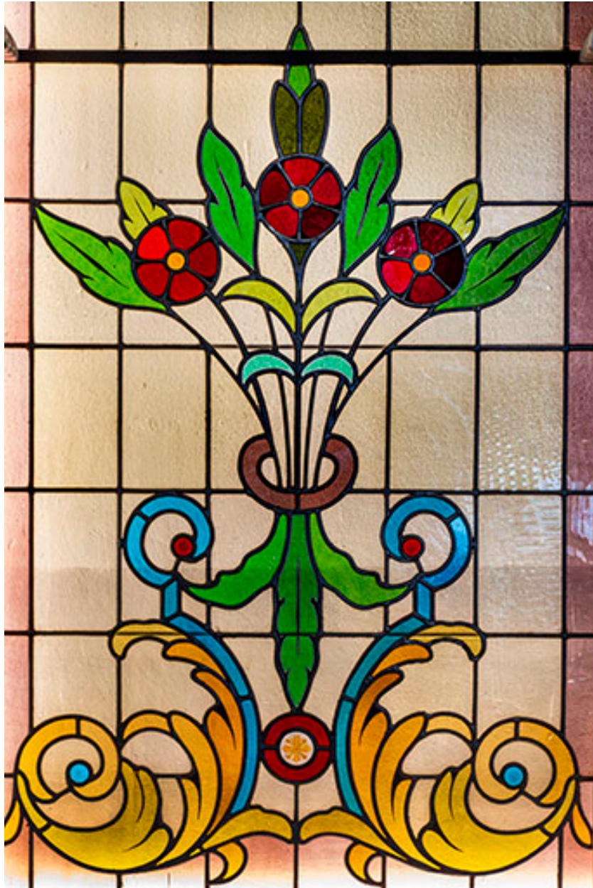
Détail de la verrière de gauche.