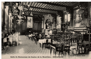
Vue intérieure du restaurant, avec les verrières sur le mur de droite.