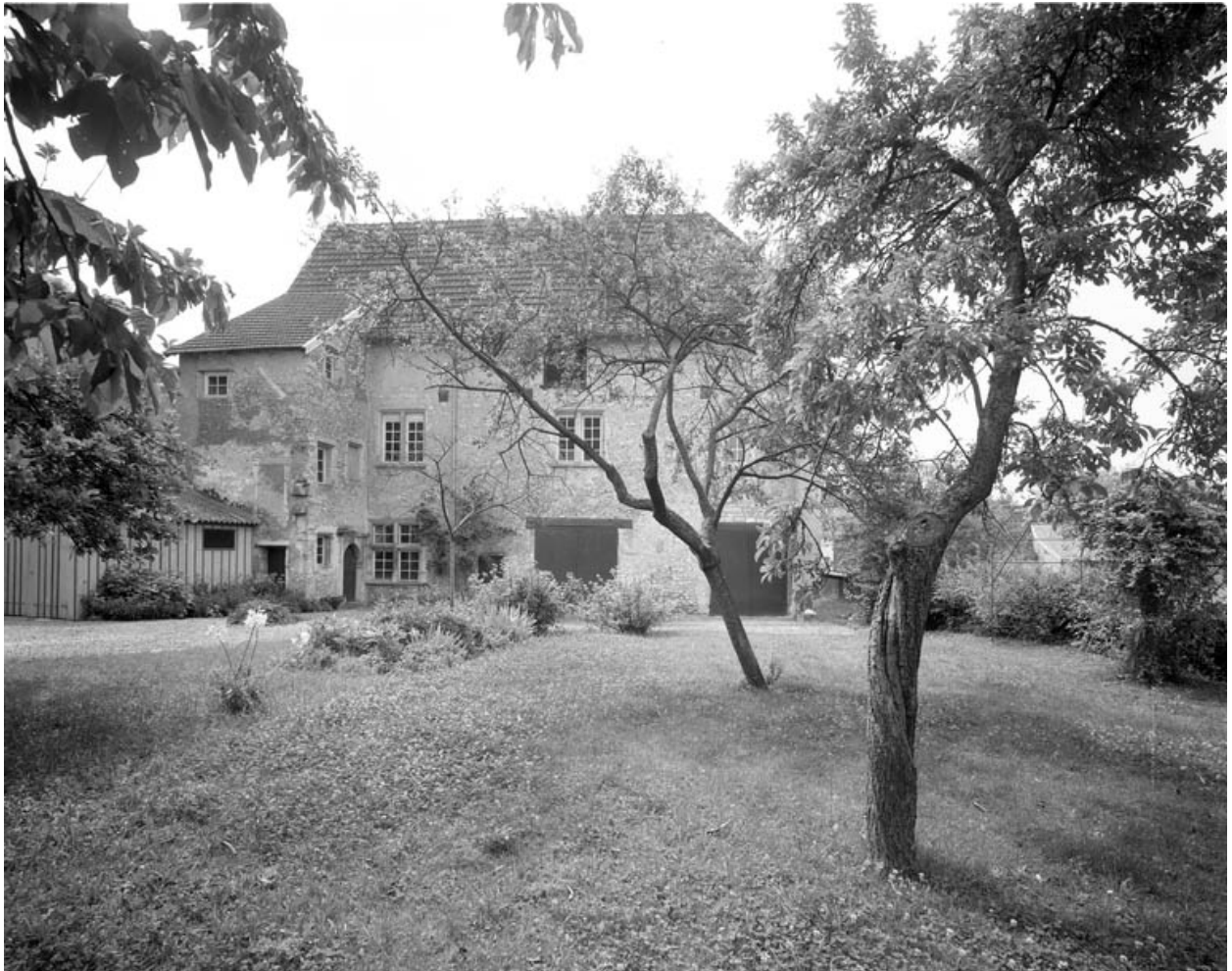
Partie gauche du couvent : bâtiment en fond de cour, de trois quarts droit.