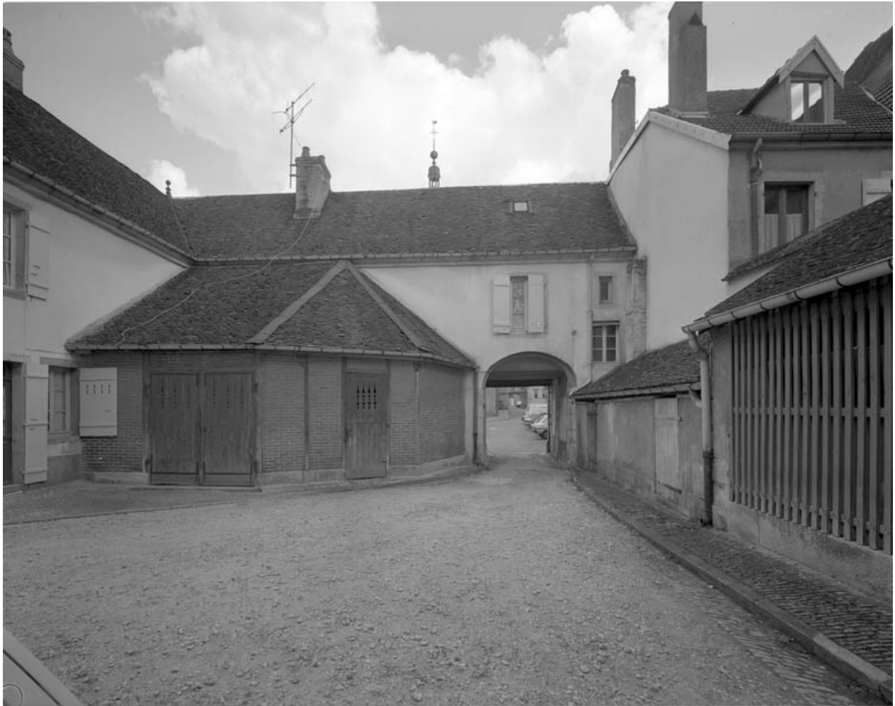
Vue du passage couvert, de face depuis la cour.