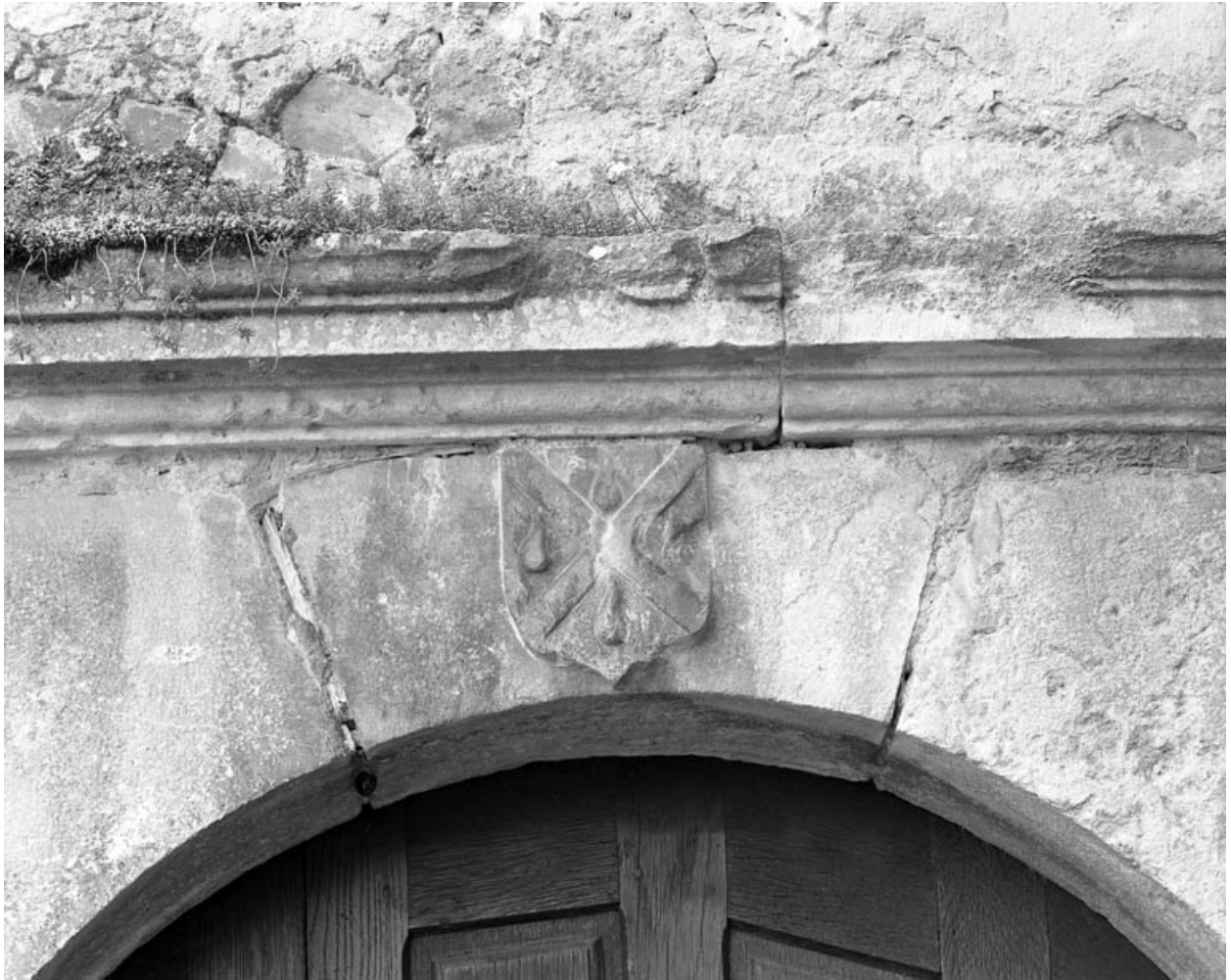
Partie gauche du couvent : détail du blason sur la porte d'entrée de l'escalier du bâtiment en fond de cour.