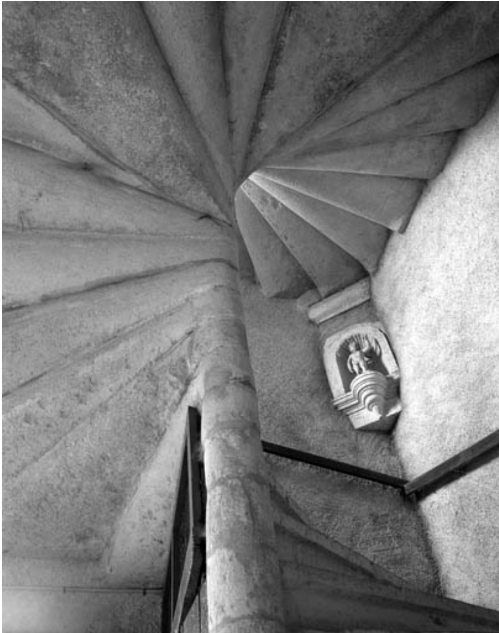
Partie gauche du couvent : détail de l'escalier en vis desservant le bâtiment en fond de cour.