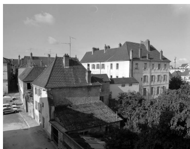
Partie droite : vue plongeante de trois quarts droit.