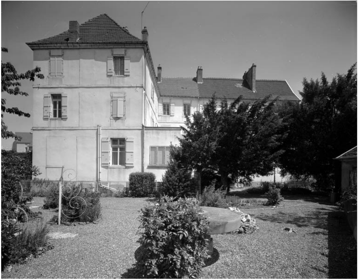
Façade postérieure du bâtiment principal : de face.