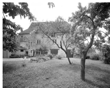
Partie gauche du couvent : bâtiment en fond de cour, de trois quarts droit.