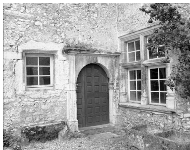
Partie gauche du couvent : bâtiment en fond de cour, détail de la porte d'entrée de l'escalier.