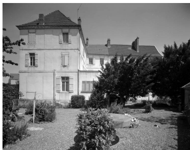
Façade postérieure du bâtiment principal : de face.