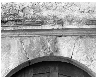
Partie gauche du couvent : détail du blason sur la porte d'entrée de l'escalier du bâtiment en fond de cour.