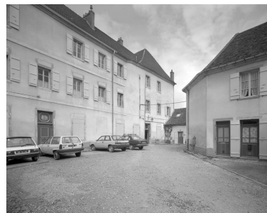
Façade antérieure du bâtiment principal : de trois quarts gauche.