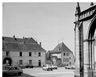
Façade antérieure : partie droite sur rue.