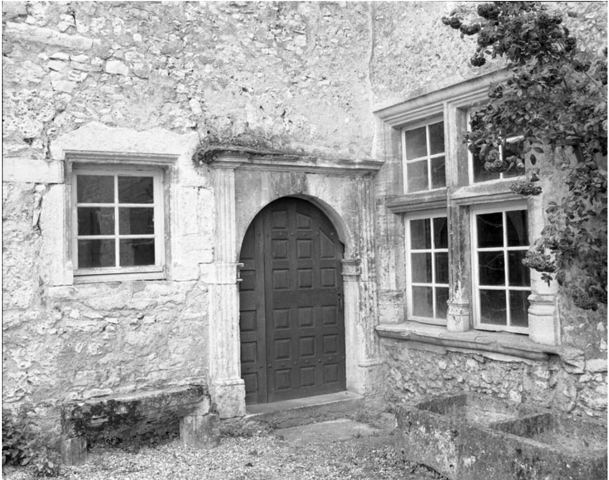
Partie gauche du couvent : bâtiment en fond de cour, détail de la porte d'entrée de l'escalier.