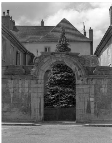
Portail d'entrée droit, depuis la place.