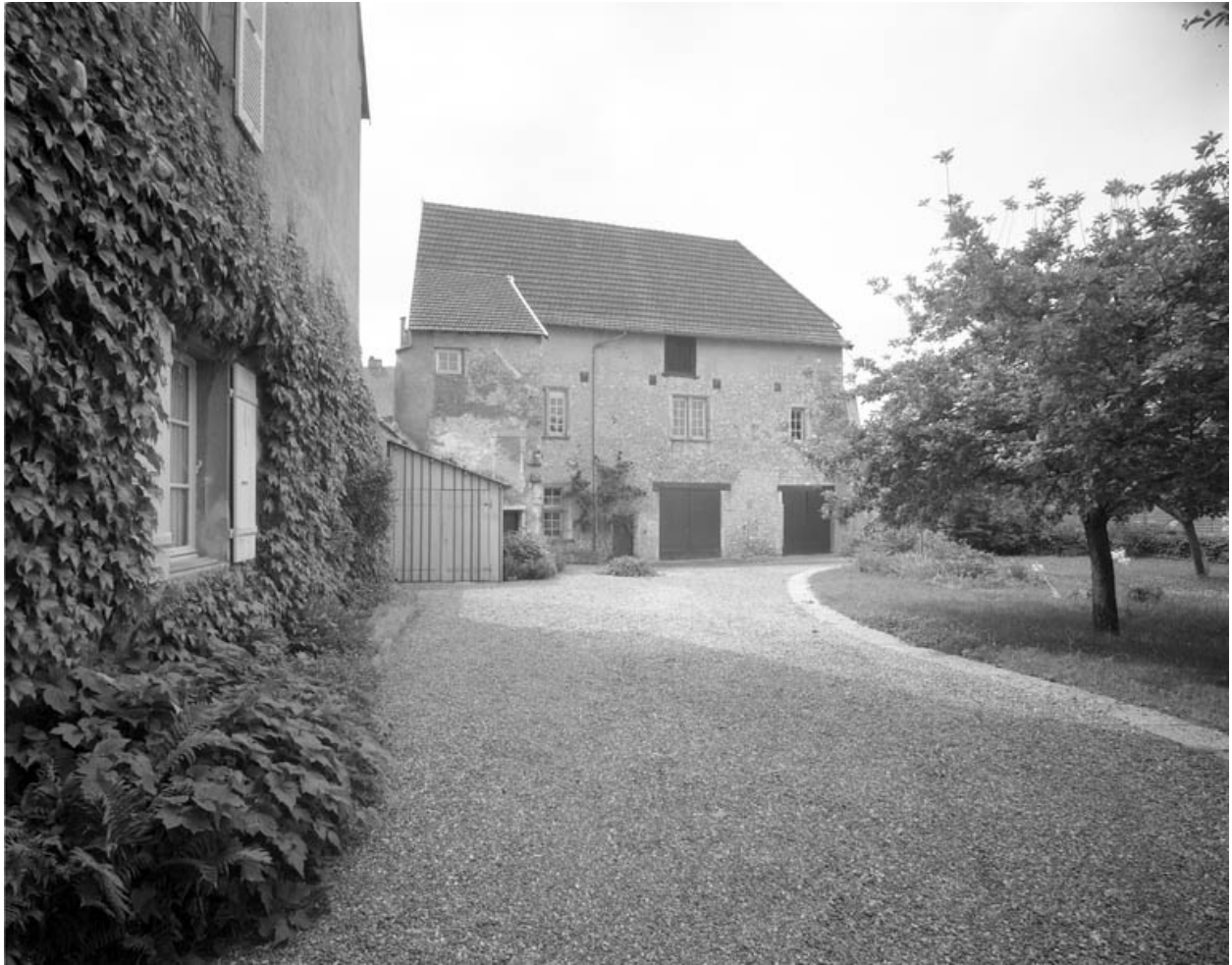
Partie gauche du couvent : bâtiment en fond de cour, de face.