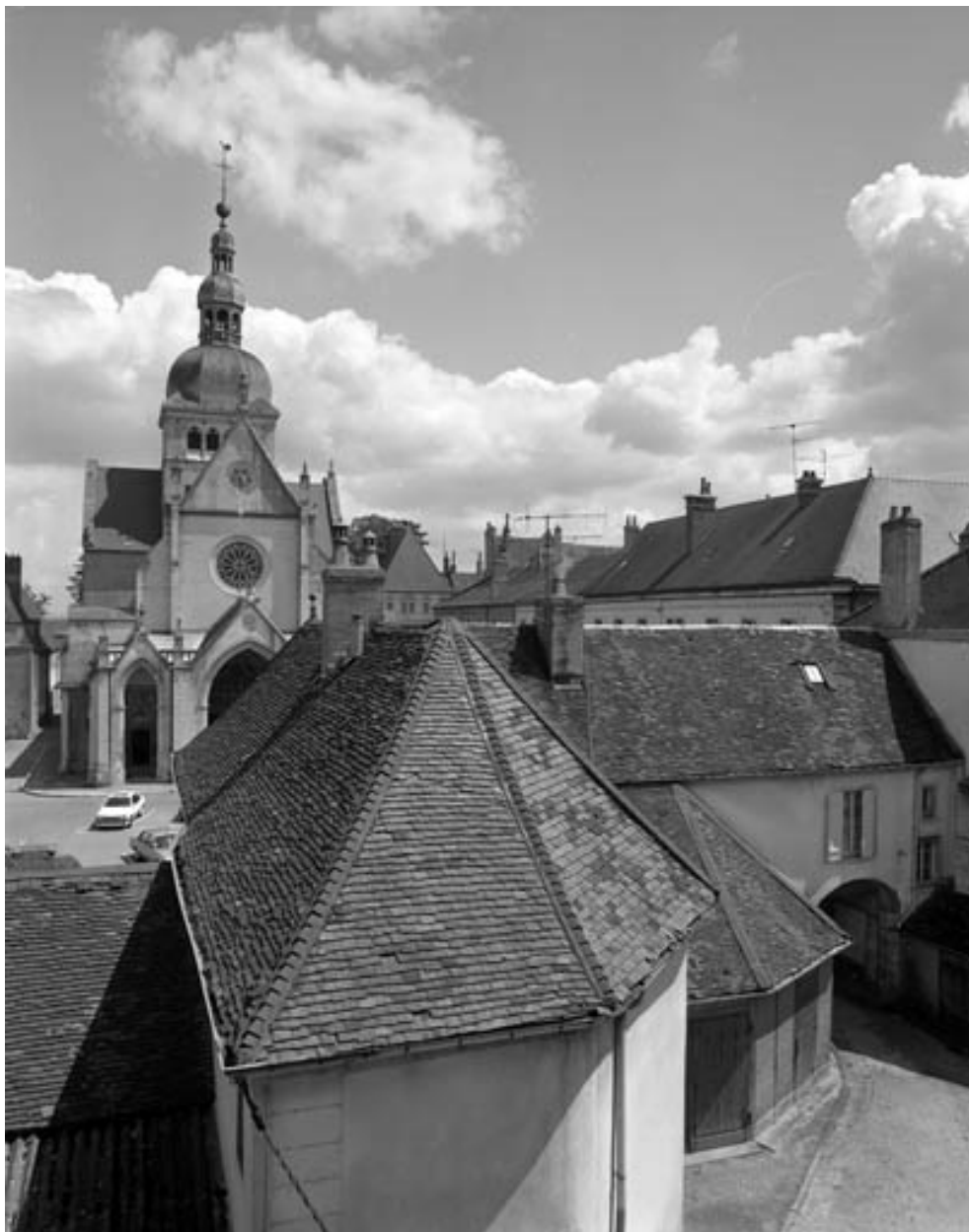
Vue des bâtiments bordant la place, depuis le premier étage du bâtiment principal.