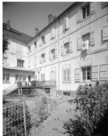
Façade postérieure du bâtiment principal : de trois quarts gauche.