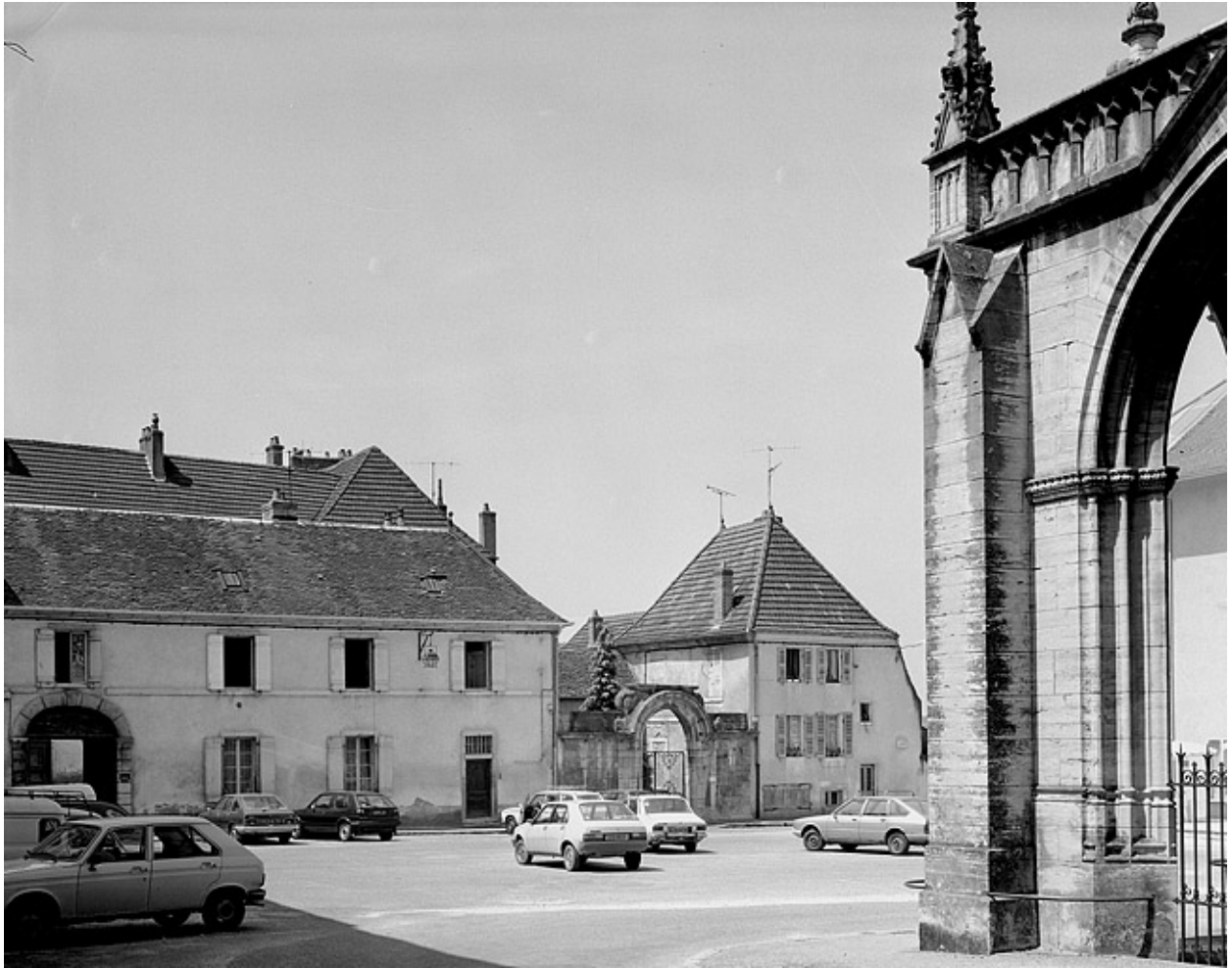
Façade antérieure : partie droite sur rue.