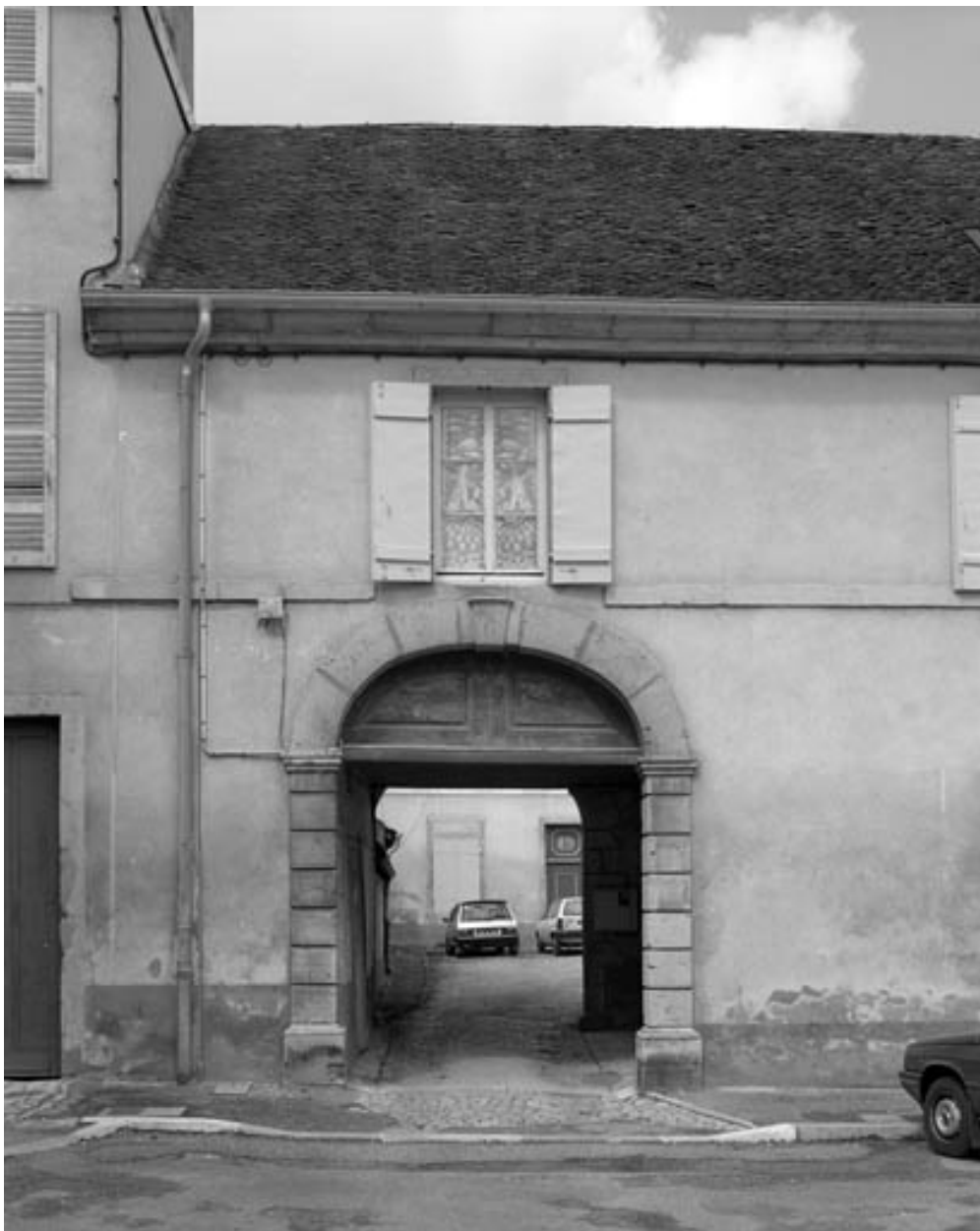
Passage couvert à gauche des bâtiments sur rue, depuis la place.