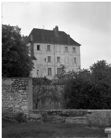
Façade latérale du bâtiment principal.