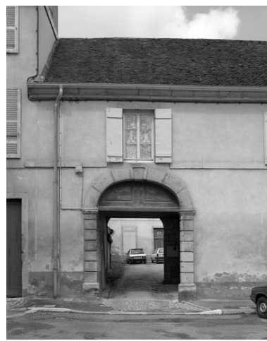
Passage couvert à gauche des bâtiments sur rue, depuis la place.