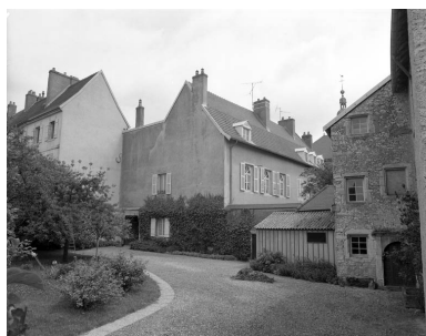
Partie gauche du couvent depuis le fond de la cour.