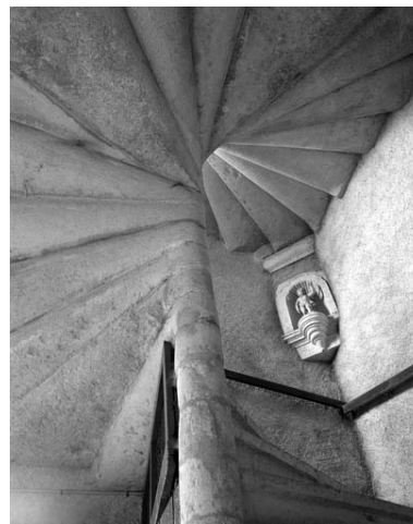
Partie gauche du couvent : détail de l'escalier en vis desservant le bâtiment en fond de cour.