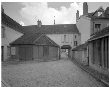
Vue du passage couvert, de face depuis la cour.