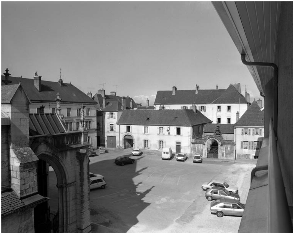
Façade antérieure sur rue : vue d'ensemble.