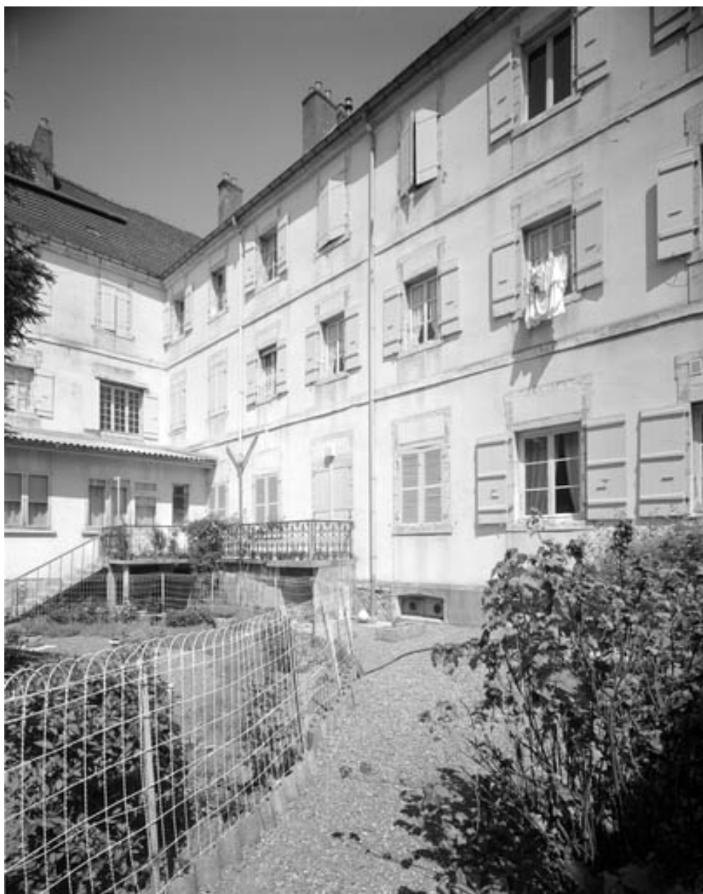
Façade postérieure du bâtiment principal : de trois quarts gauche.