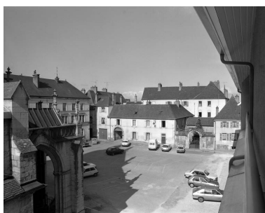
Façade antérieure sur rue : vue d'ensemble.