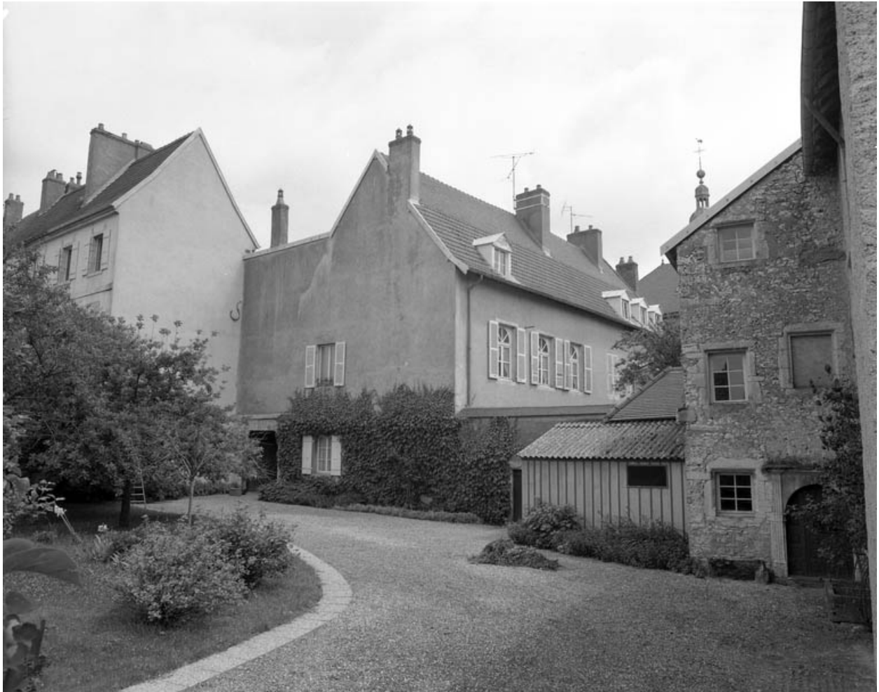
Partie gauche du couvent depuis le fond de la cour.