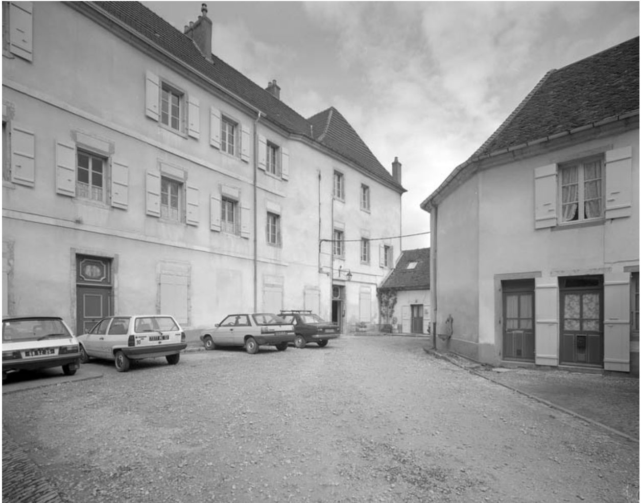
Façade antérieure du bâtiment principal : de trois quarts gauche.