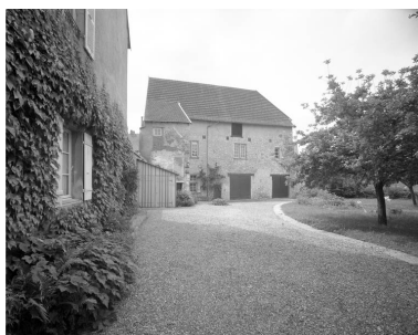
Partie gauche du couvent : bâtiment en fond de cour, de face.