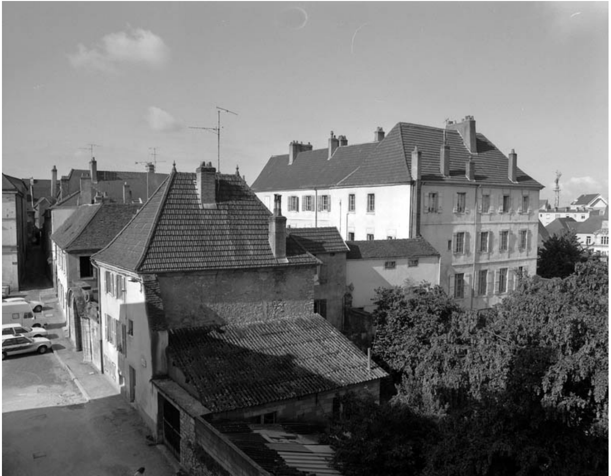
Partie droite : vue plongeante de trois quarts droit.