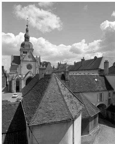
Vue des bâtiments bordant la place, depuis le premier étage du bâtiment principal.