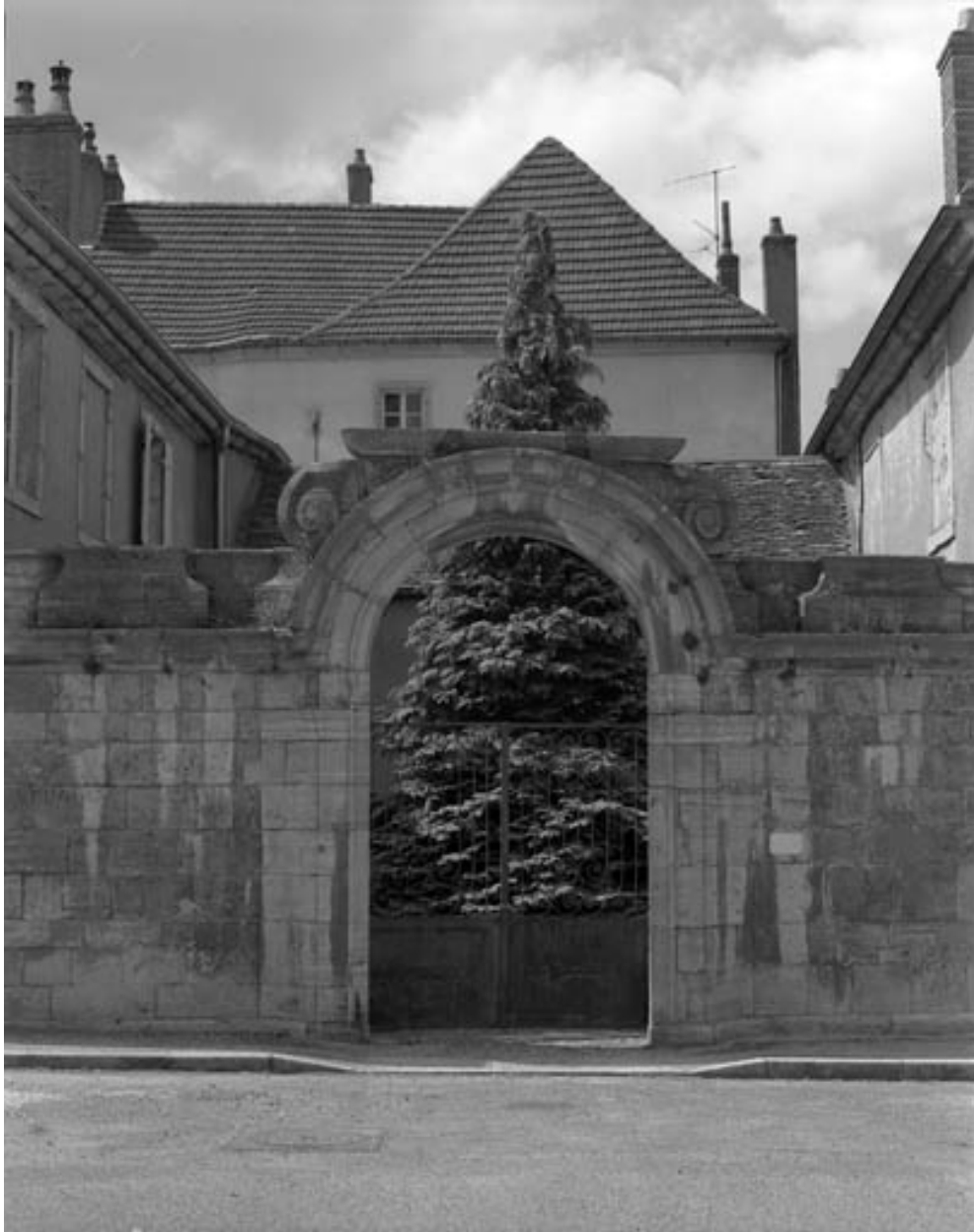
Portail d'entrée droit, depuis la place.