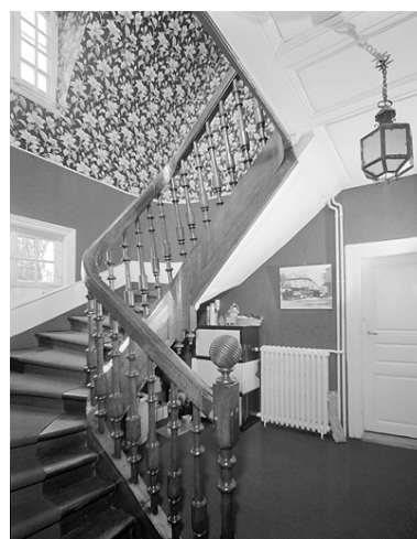
Escalier vu du premier étage. IVR43_19872501095V