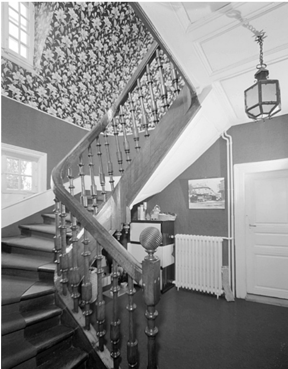
Escalier vu du premier étage.