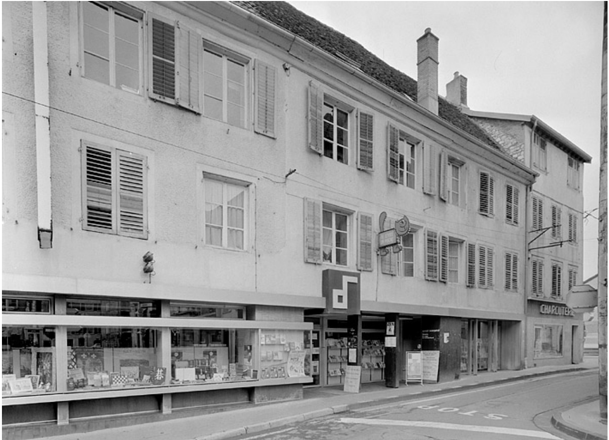
Façade sur la place.