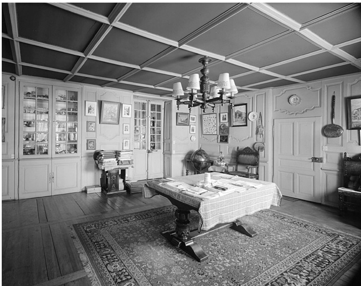
Pièce du premier étage.