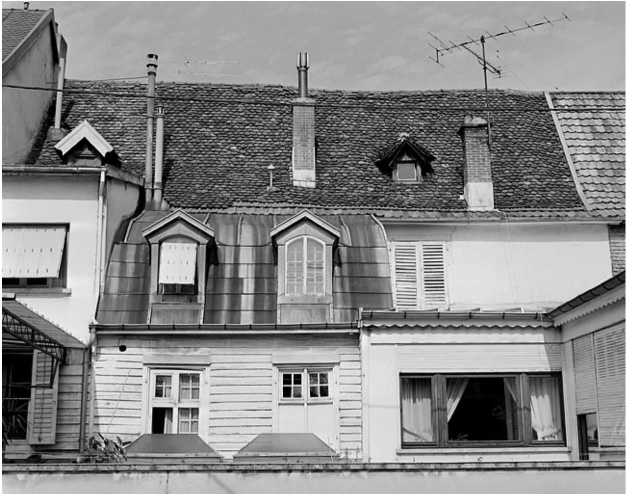
Façade sur cour vue à partir du premier étage. A gauche, le corps d'escalier dont la première travée à gauche a été surélevée.