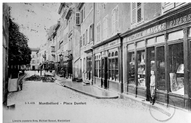
Montbéliard. Place Denfert [vue de la devanture], début 20e siècle.