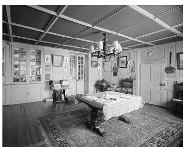
Pièce du premier étage. IVR43_19872501096V