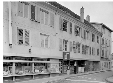
Façade sur la place.