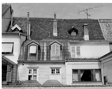
Façade sur cour vue à partir du premier étage. A gauche, le corps d'escalier dont la première travée à gauche a été surélevée.