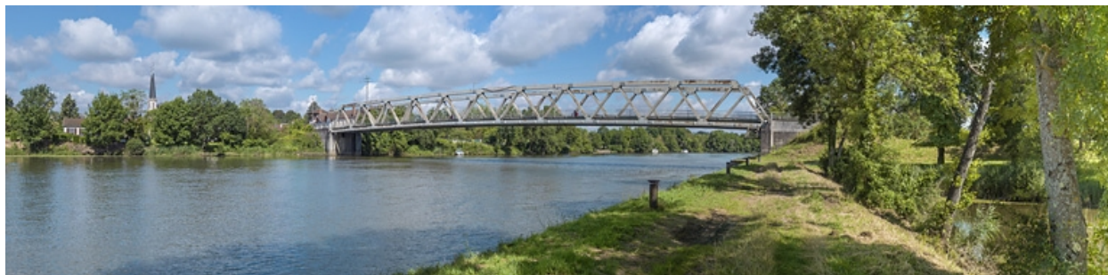
Vue d'ensemble, rive gauche.