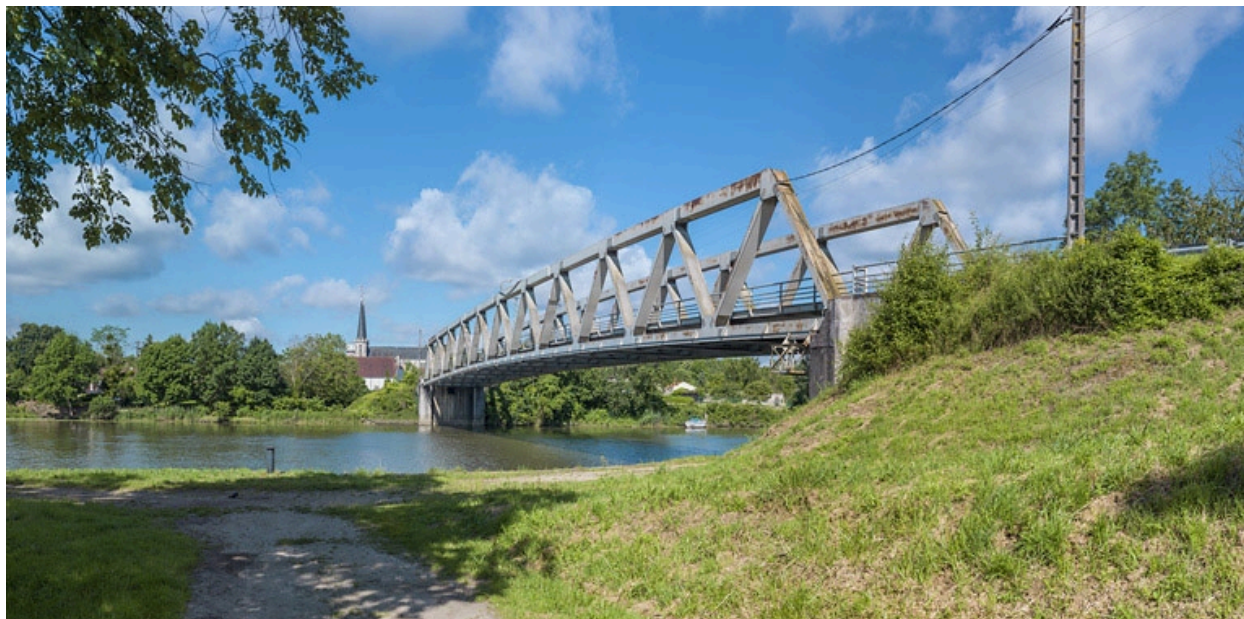
Vue d'ensemble, rive gauche.