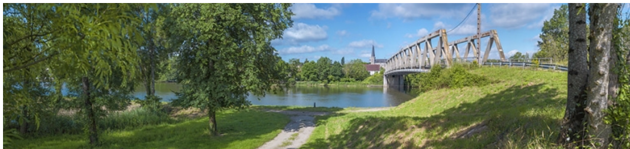
Vue d'ensemble, rive gauche.