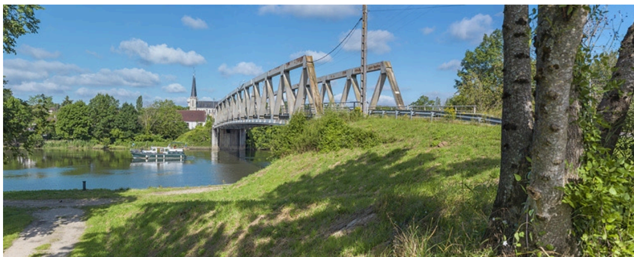
Vue d'ensemble, rive gauche.