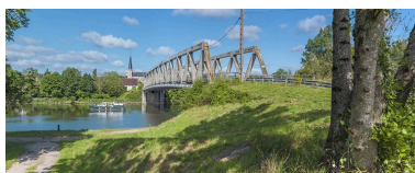
Vue d'ensemble, rive gauche.