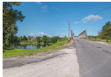
Vue d'ensemble, rive gauche. IVR26_20162101303NUC4A