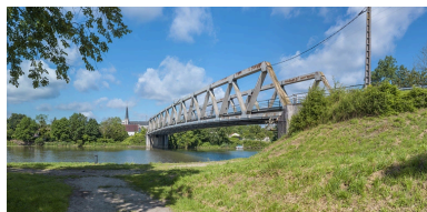
Vue d'ensemble, rive gauche. IVR26_20162101302NUC4A