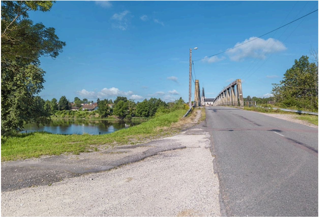
Vue d'ensemble, rive gauche.