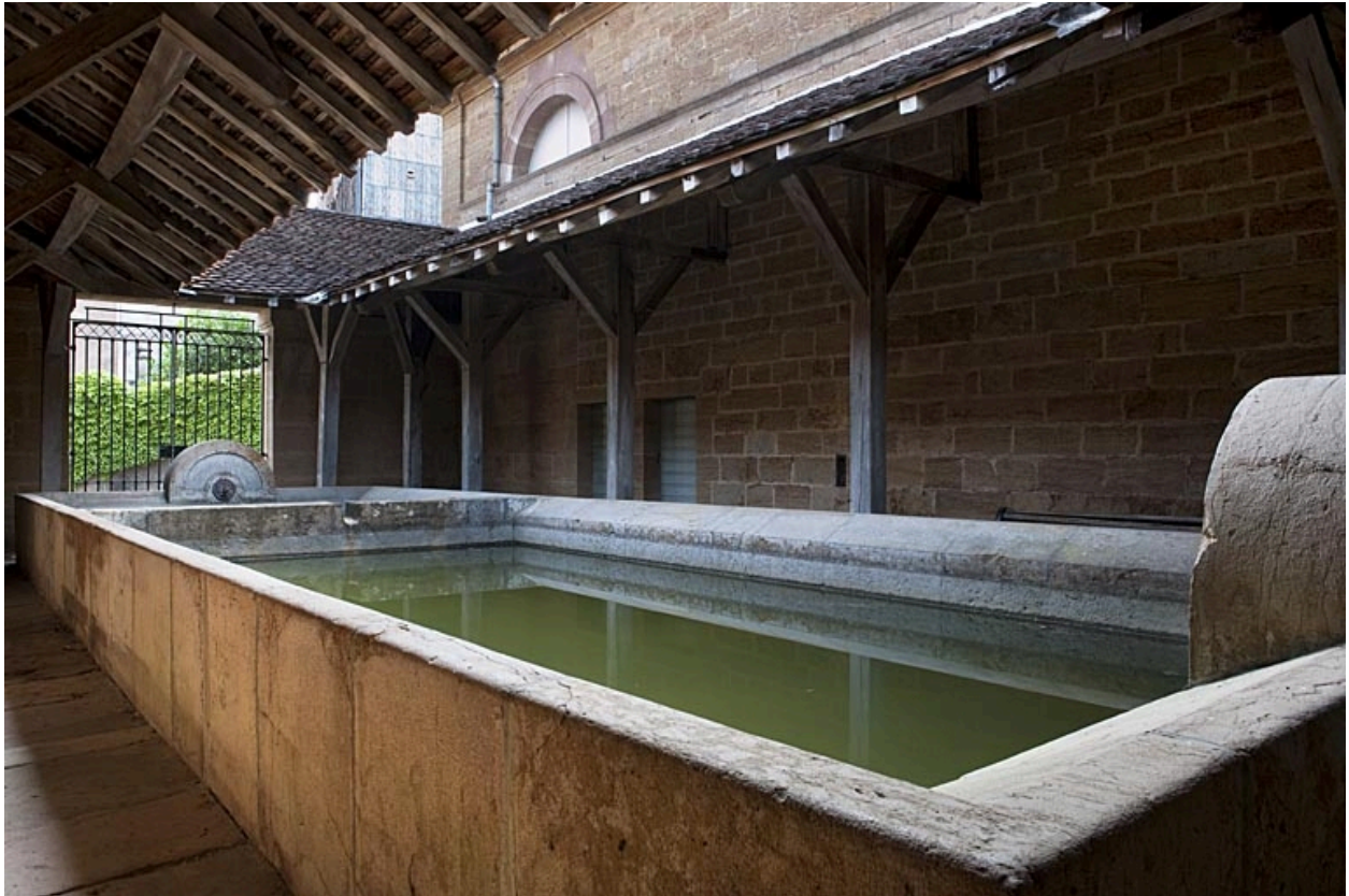
Vue des bassins.