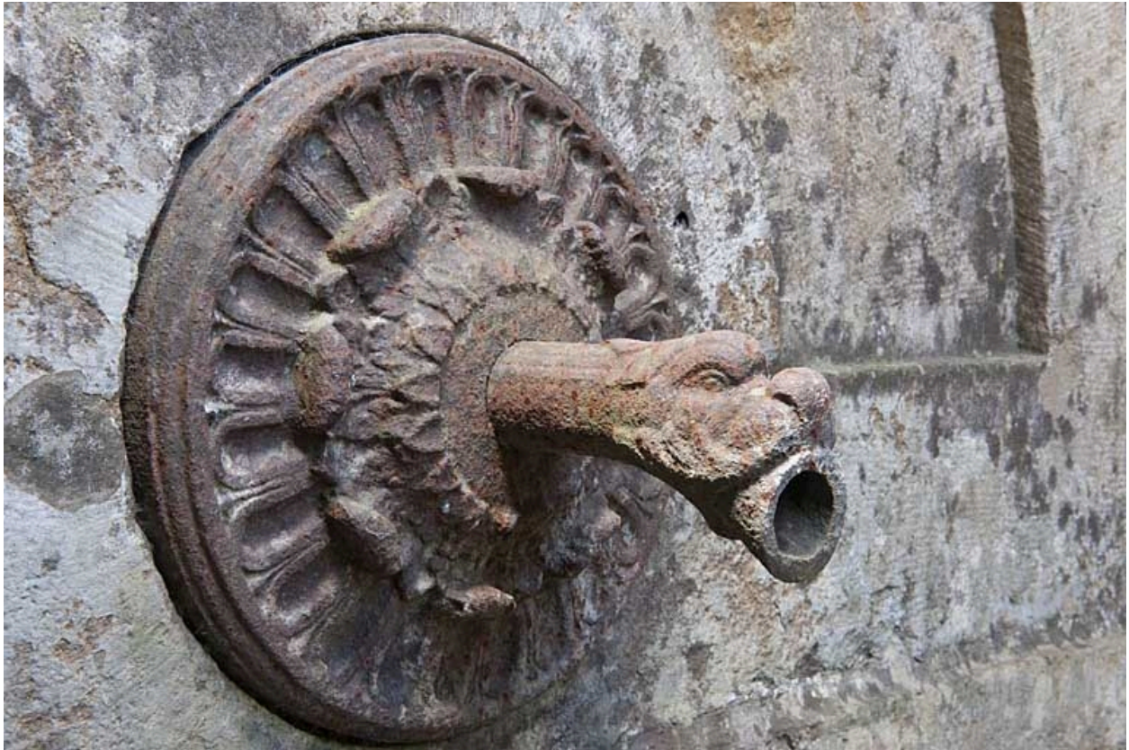
Vue d'une gueule de dragon ornant une pile de jet.