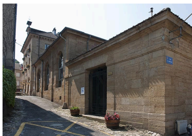
Façade rue du Lavoir.