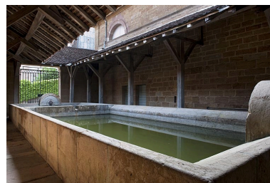
Vue des bassins. IVR43_20112500350NUC4A