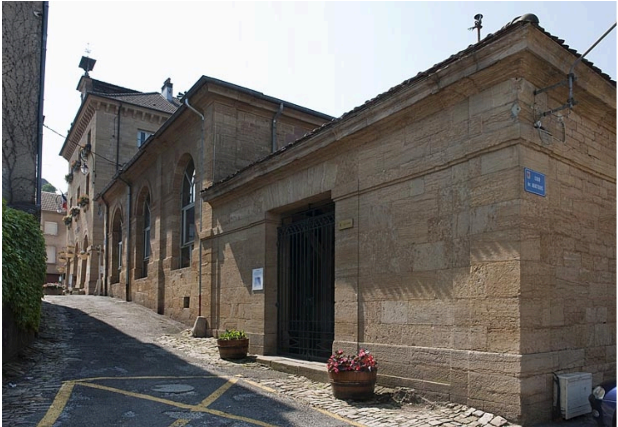
Façade rue du Lavoir.