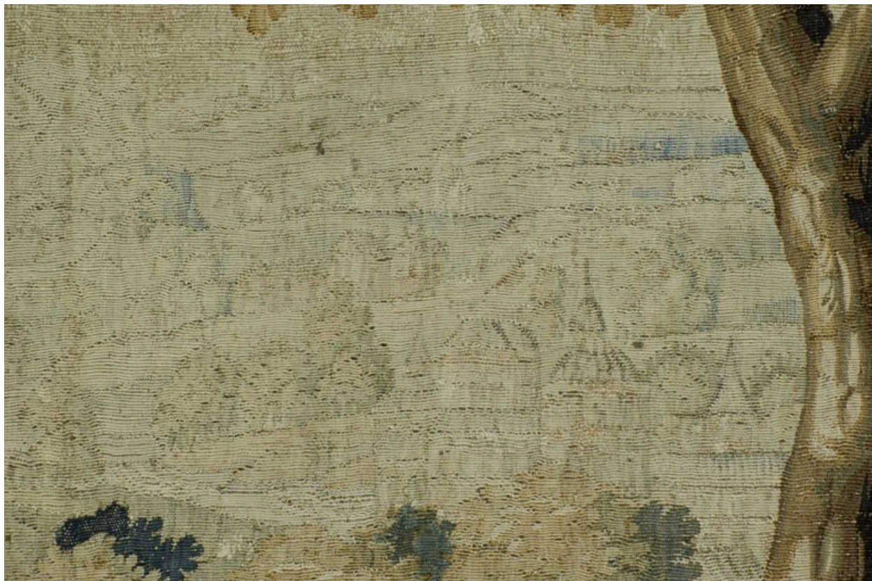
Pièce n. 2 : Verdure aux ruines antiques, détail.