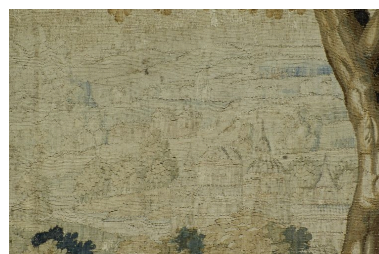
Pièce n. 2 : Verdure aux ruines antiques, détail. IVR26_19912100662ZA