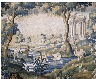
Pièce n. 2 : Verdure aux ruines antiques, détail. IVR26_19912100659XA