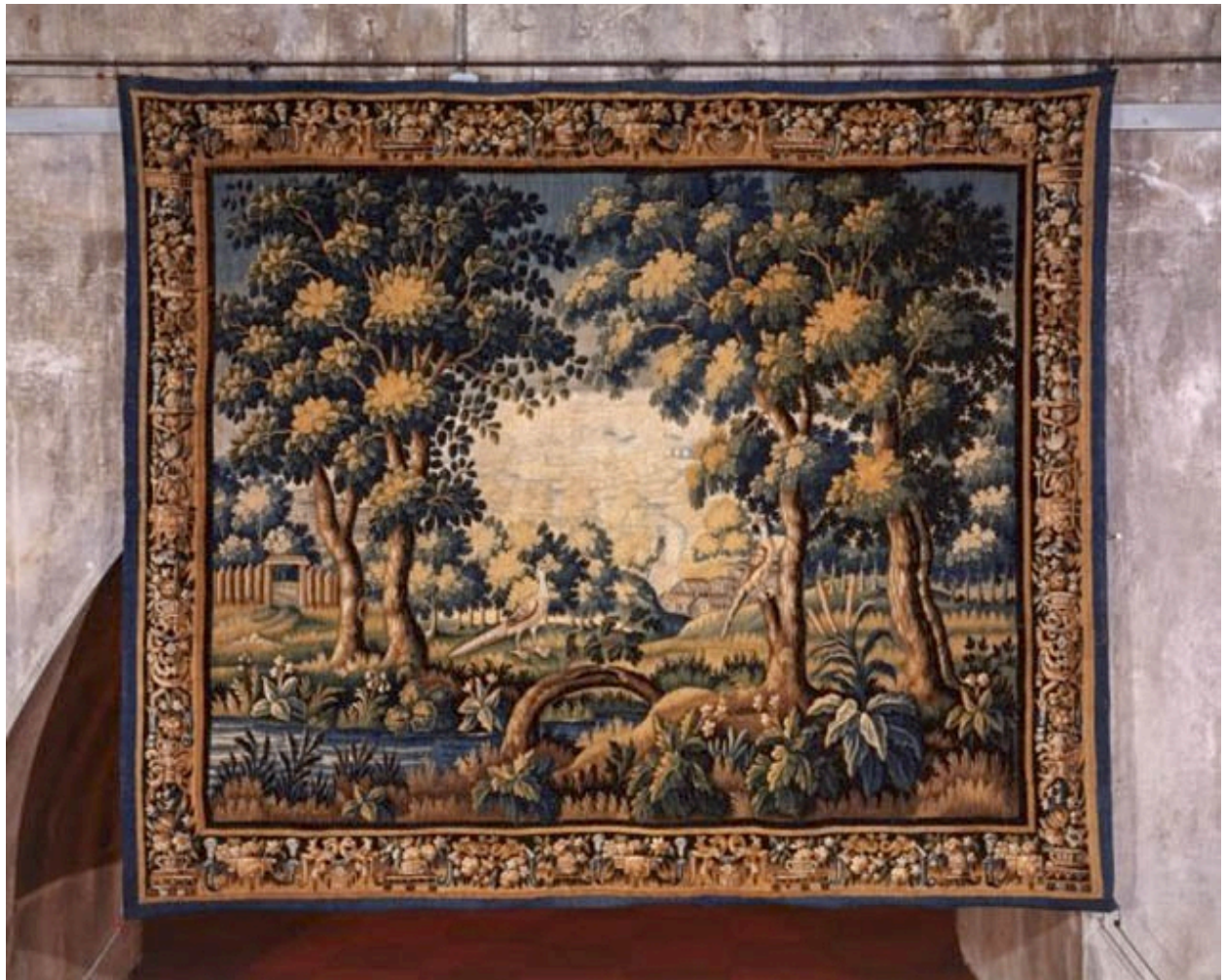
Pièce n. 1 : verdure au tronc d'arbre courbé.