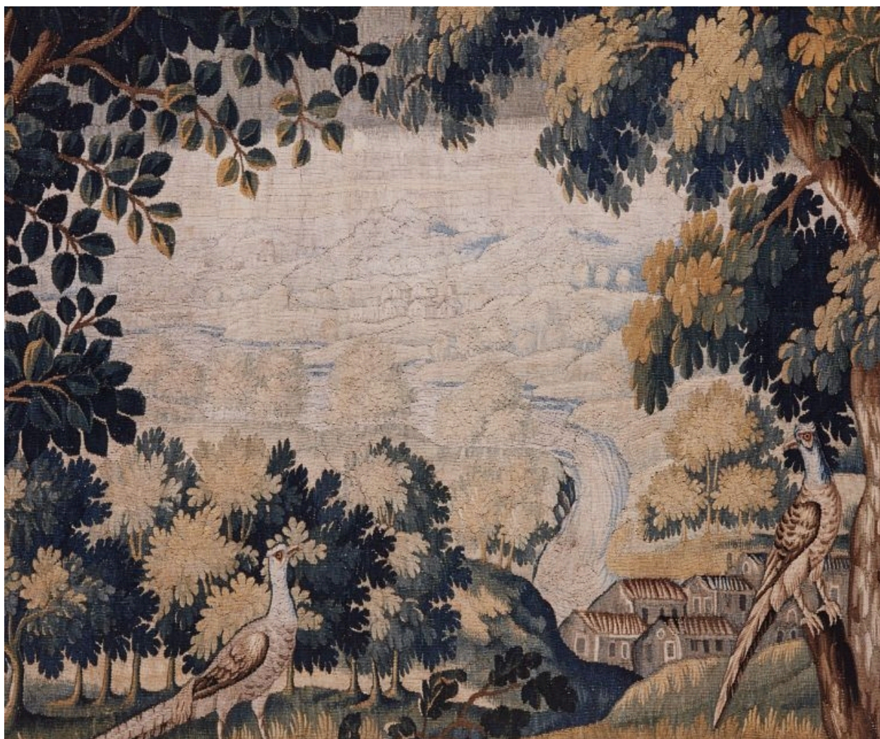
Pièce n. 1 : verdure au tronc d'arbre courbé, détail