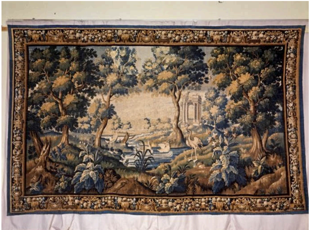
Pièce n. 2 : Verdure aux ruines antiques