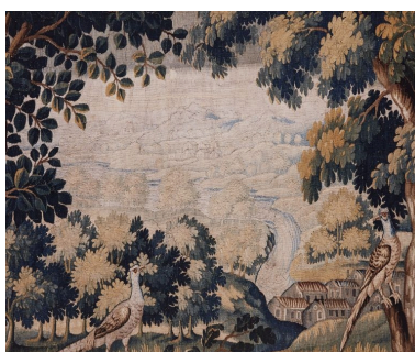
Pièce n. 1 : verdure au tronc d'arbre courbé, détail IVR26_19912100089XA