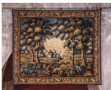
Pièce n. 1 : verdure au tronc d'arbre courbé. IVR26_19912100085VA