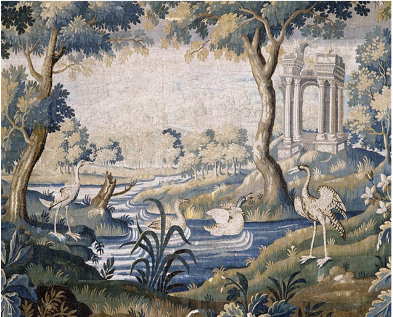
Pièce n. 2 : Verdures aux ruines antiques, détail.