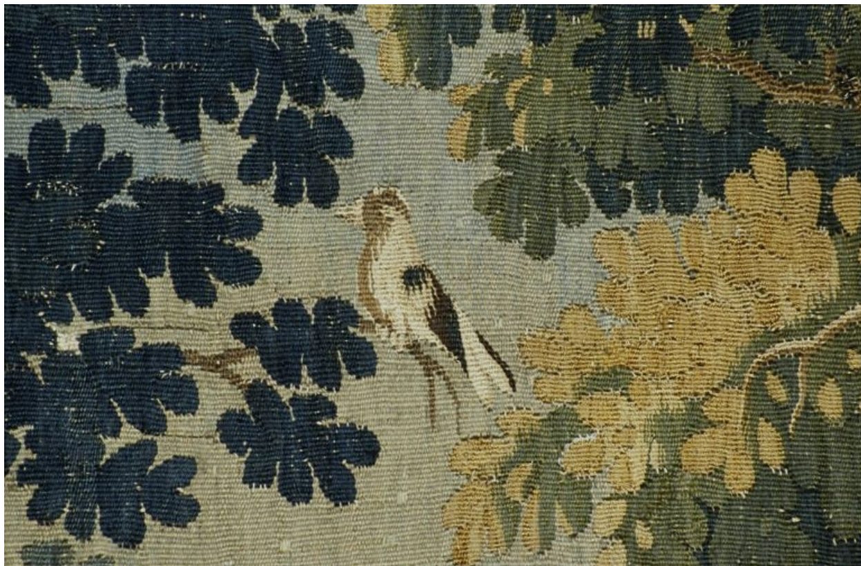
Pièce n. 2 : Verdure aux ruines antiques, détail.