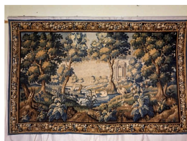
Pièce n. 2 : Verdure aux ruines antiques IVR26_19912100655VA