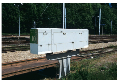
Vue d'ensemble. IVR43_20053900008ZA

Plan de situation. Extrait du plan cadastral, 1995, section A, 12e feuille, échelle 1:1250 réduite à 1:2000, complété d'après un plan numérique de la SNCF (1999).