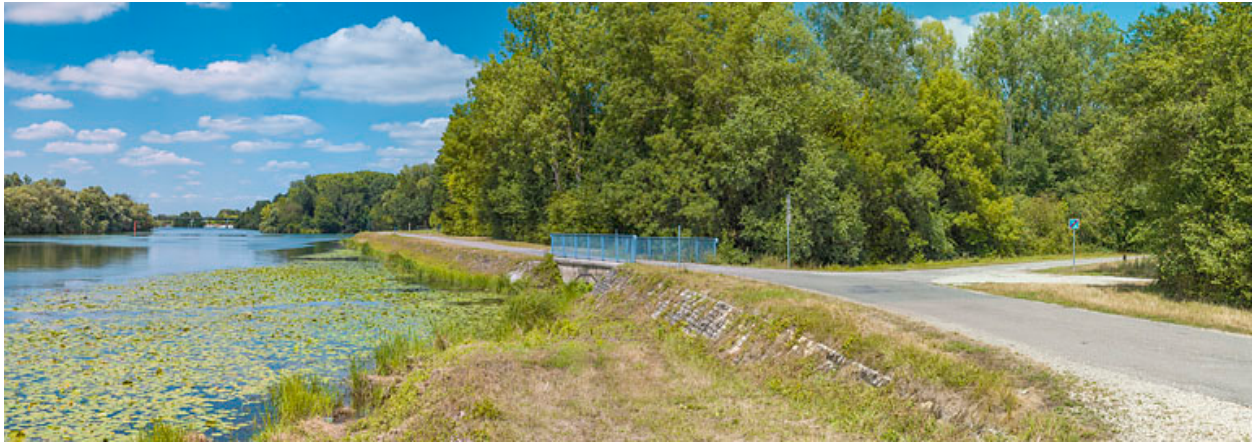
Ponceau sur la Roye.