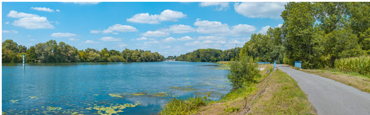
Vue d'ensemble des deux ponceaux, rive gauche.