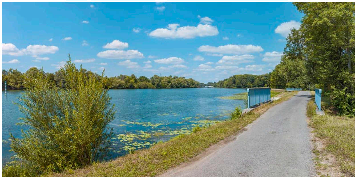
Vue d'ensemble des deux ponceaux, rive gauche.