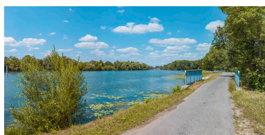
Vue d'ensemble des deux ponceaux, rive gauche.