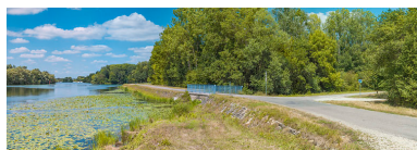
Ponceau sur la Roye.