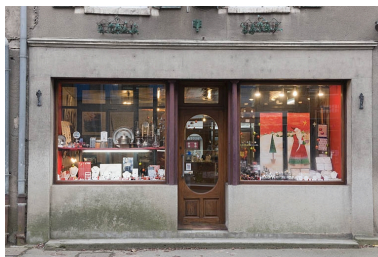
La devanture.