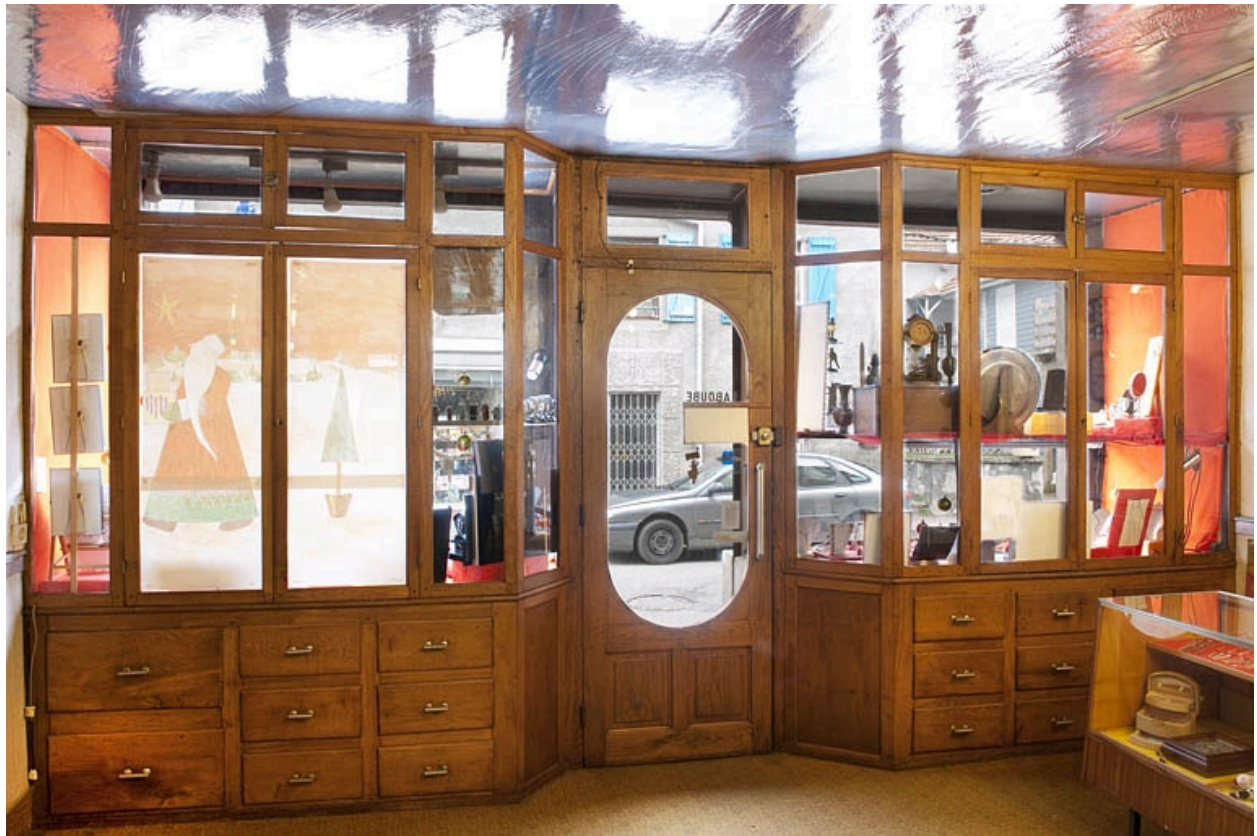
Intérieur de la boutique.