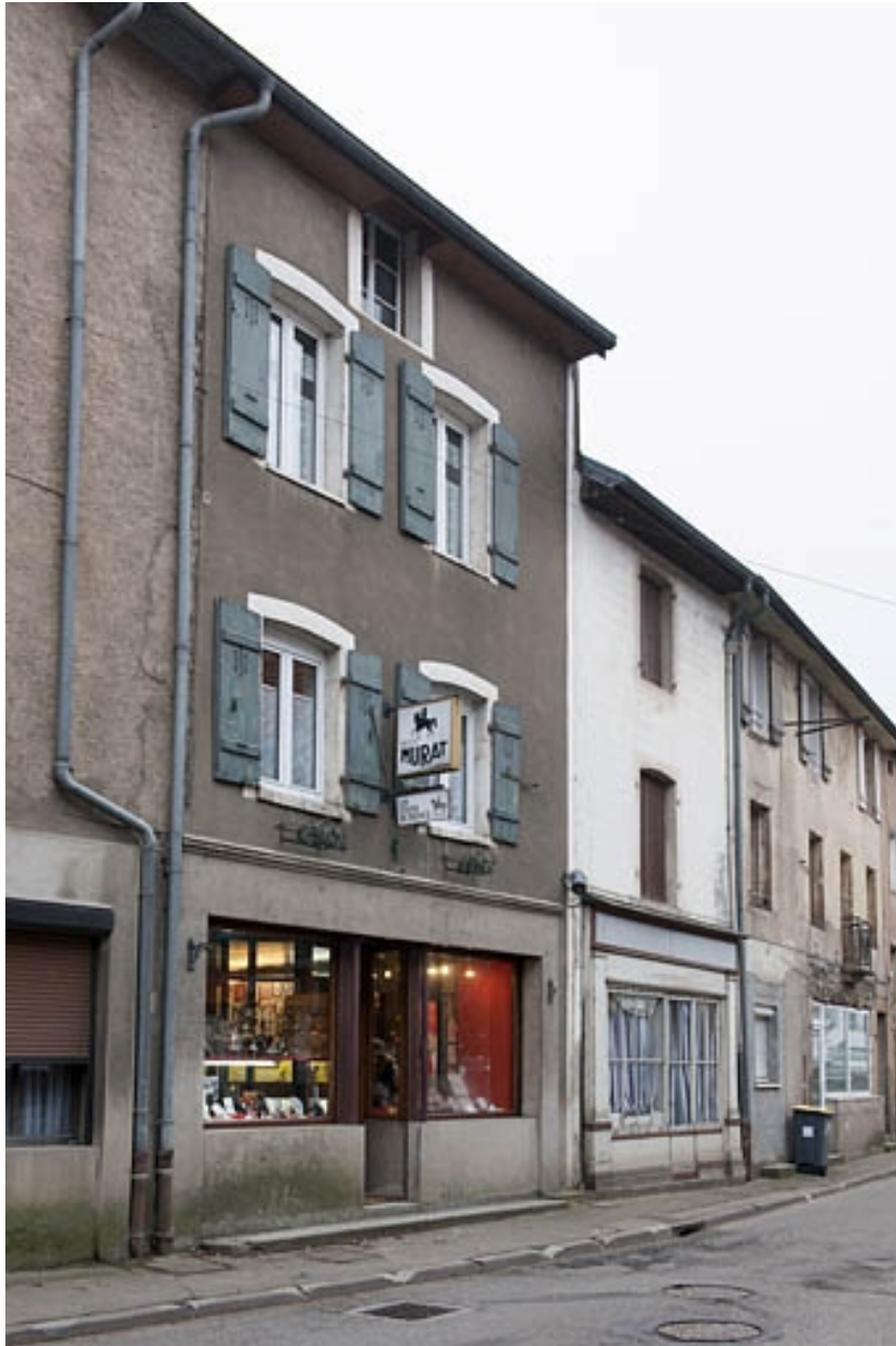
Vue générale de trois quarts gauche.