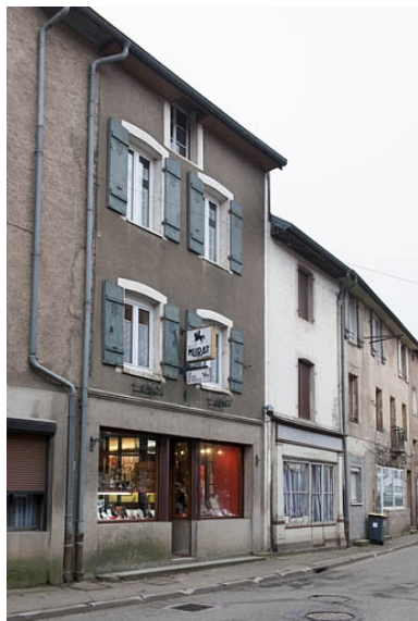
Vue générale de trois quarts gauche.