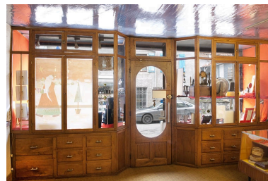
Intérieur de la boutique. IVR43_20112502934NUC4A