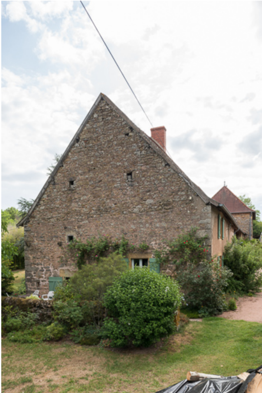
Vue du pignon de la seconde maison