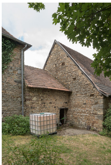
Façade postérieure de cette même remise.

Phot. Pierre-Marie Barbe-Richaud IVR26_20197100284NUC4A