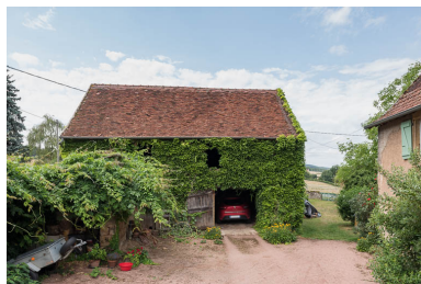
Vue de la dépendance construite au XIXe siècle, abritant une remise (ou garage) et une étable IVR26_20197100296NUC4A