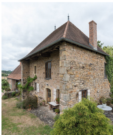
Vue d'ensemble de l'alignement. Au premier plan, la maison d'origine, construite dans le premier quart du XVIIIe siècle.