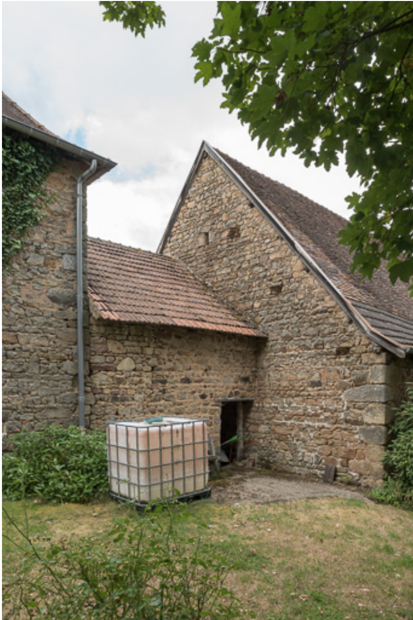
Façade postérieure de cette même remise.