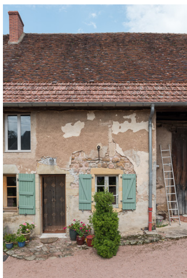
Vue partielle de la façade antérieure de la seconde maison. Cette partie de la maison, autrefois étable, a connu plusieurs modifications de ses ouvertures. Au-dessus de la fenêtre, une chaîne indique l'emplacement d'une ancienne baie, qui servait peut-être à l'aération du fenil.