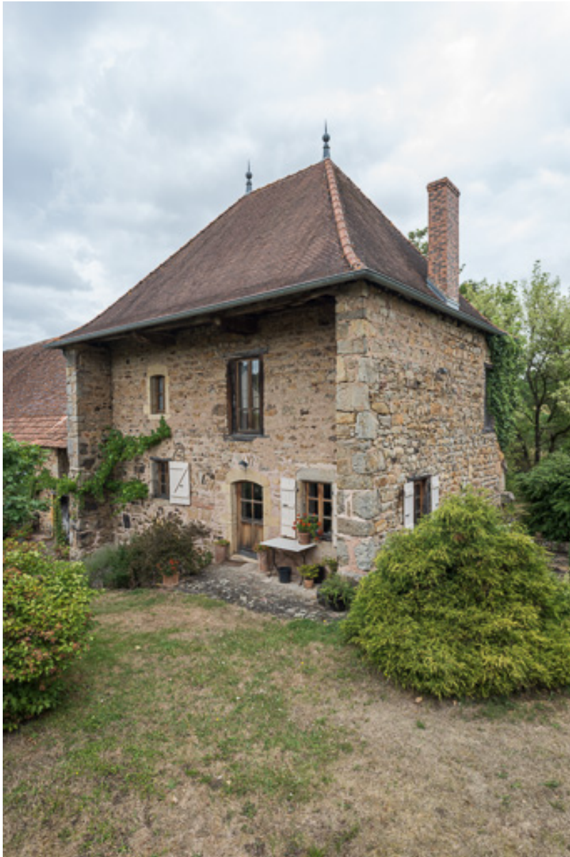
Vue des façades antérieures et latérales de la maison à l'origine de l'ensemble en alignement