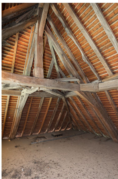
Vue de la charpente du toit à croupes de la maison IVR26_20197100293NUC4A