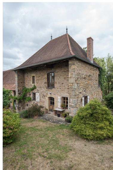
Vue des façades antérieures et latérales de la maison à l'origine de l'ensemble en alignement IVR26_20197100286NUC4A