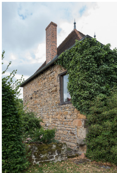
Vue de l'angle sud-est de la maison. Les traces d'arrachement de mur indique l'emplacement de l'ancien escalier qui permettait l'accès à l'étage. IVR26_20197100285NUC4A