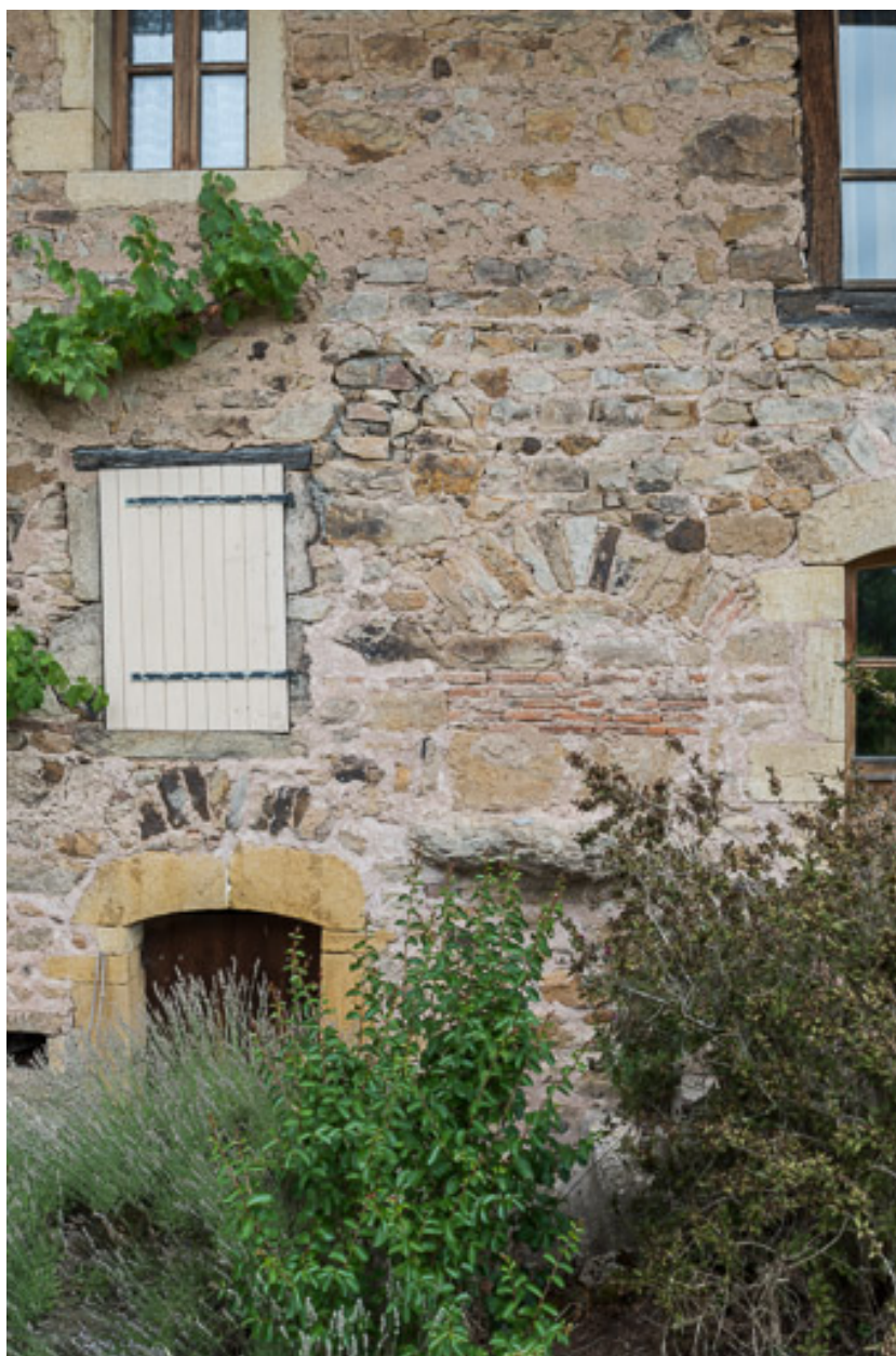
Détail de la façade antérieure de la maison. Au centre, l'évacuation de la pierre d'évier.