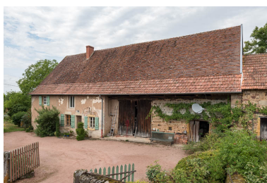
Vue des bâtiments inscrits dans le même alignement, à la suite des précédents. La grange était autrefois constitué d'une remise et de deux étables de part et d'autre. Celle de gauche a été par la suite incluse dans l'espace de la seconde maison, construite au milieu du XVIIIe siècle et remaniée vers 1840. IVR26_20197100294NUC4A

IVR26_20197100284NUC4A