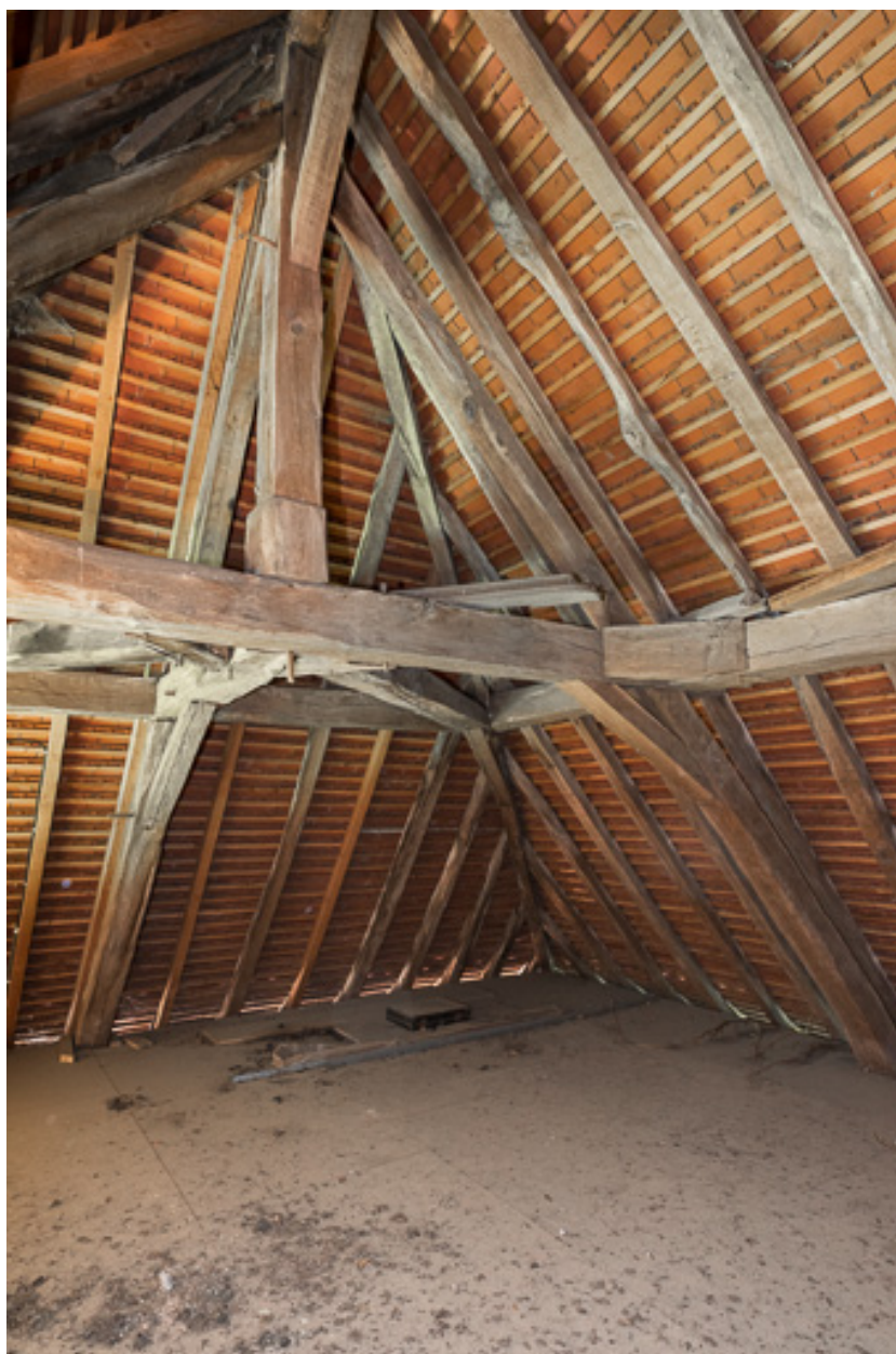
Vue de la charpente du toit à croupes de la maison