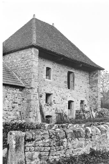
Maison, anciennement à galerie ou à balcon, à Frâgne, vers 1970. IVR26_20207100088NUC2