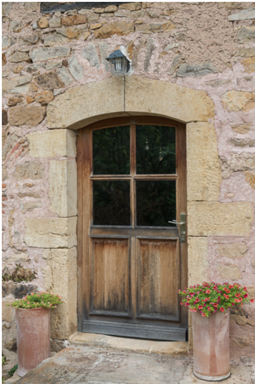
Porte d'entrée de la maison, couverte d'un arc segmentaire