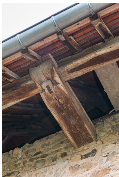
Cette solive, sur laquelle repose le plancher des combles de la maison, forme encorbellement et soutien le débord du toit. Le trou (ou mortaise) indique qu'un pilier en bois venait s'assembler avec la solive. Ce pilier était un élément de la galerie qui se développait à l'origine au premier étage de la façade de la maison.