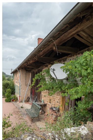
Comme la maison d'origine dont elle est contemporaine, la grange présente un large débord de toit protégeant sa façade.