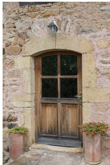
Porte d'entrée de la maison, couverte d'un arc segmentaire IVR26_20197100289NUC4A