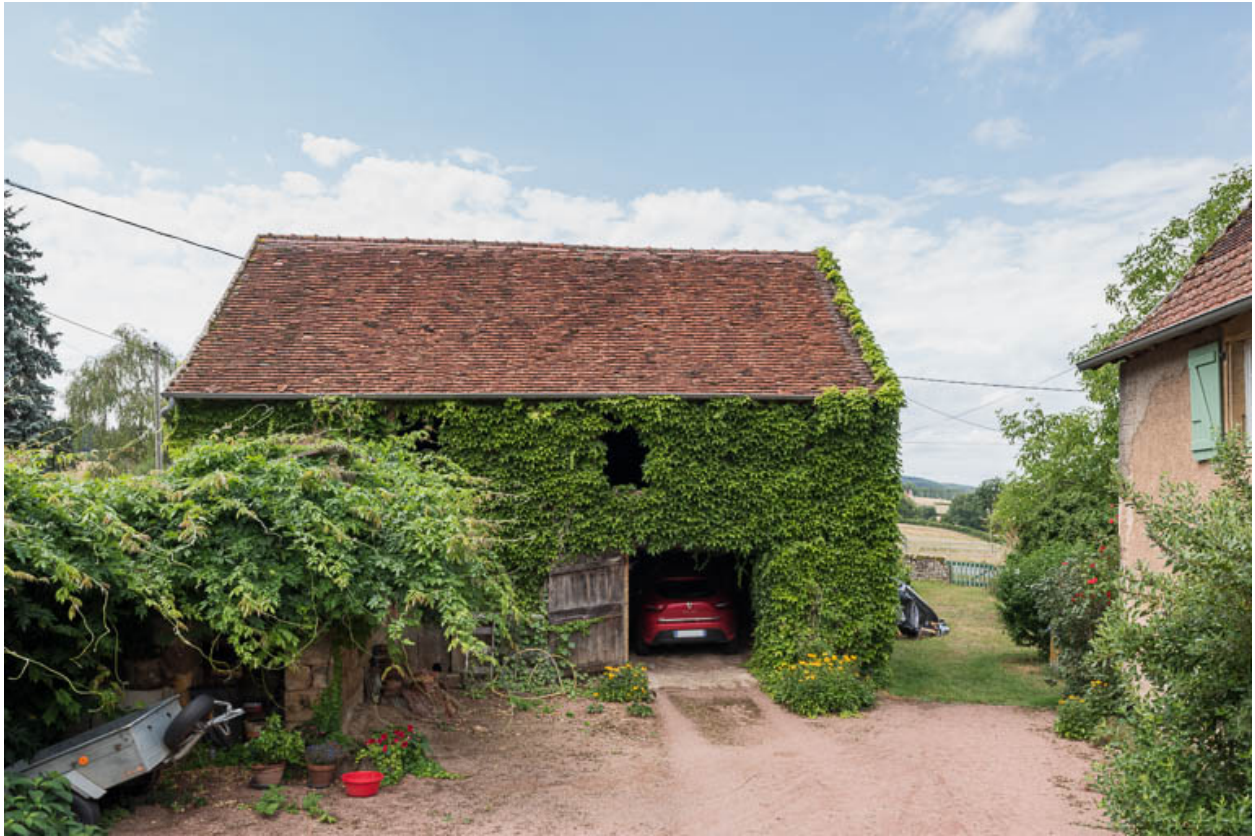
Vue de la dépendance construite au XIXe siècle, abritant une remise (ou garage) et une étable