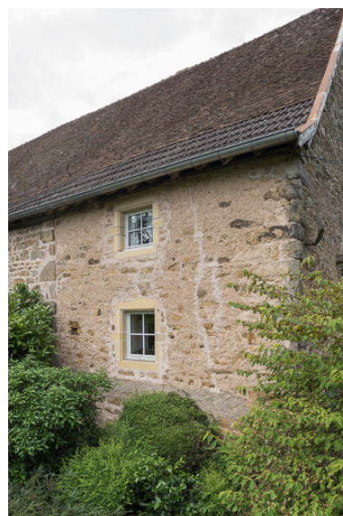
Vue de la façade postérieure de la maison. La rupture de maçonnerie montre qu'il s'agit bien d'un agrandissement de la grange primitive vers l'ouest. IVR26_20197100283NUC4A