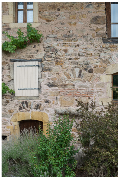
Détail de la façade antérieure de la maison. Au centre, l'évacuation de la pierre d'évier. IVR26_20197100288NUC4A