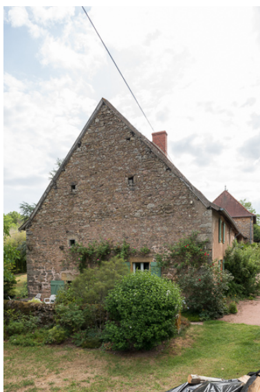
Vue du pignon de la seconde maison IVR26_20197100282NUC4A