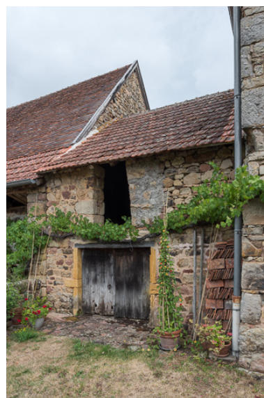
Façade antérieure de la remise, construite entre la maison et la grange primitive, après le partage de la propriété au milieu du XVIIIe siècle. IVR26_20197100291NUC4A