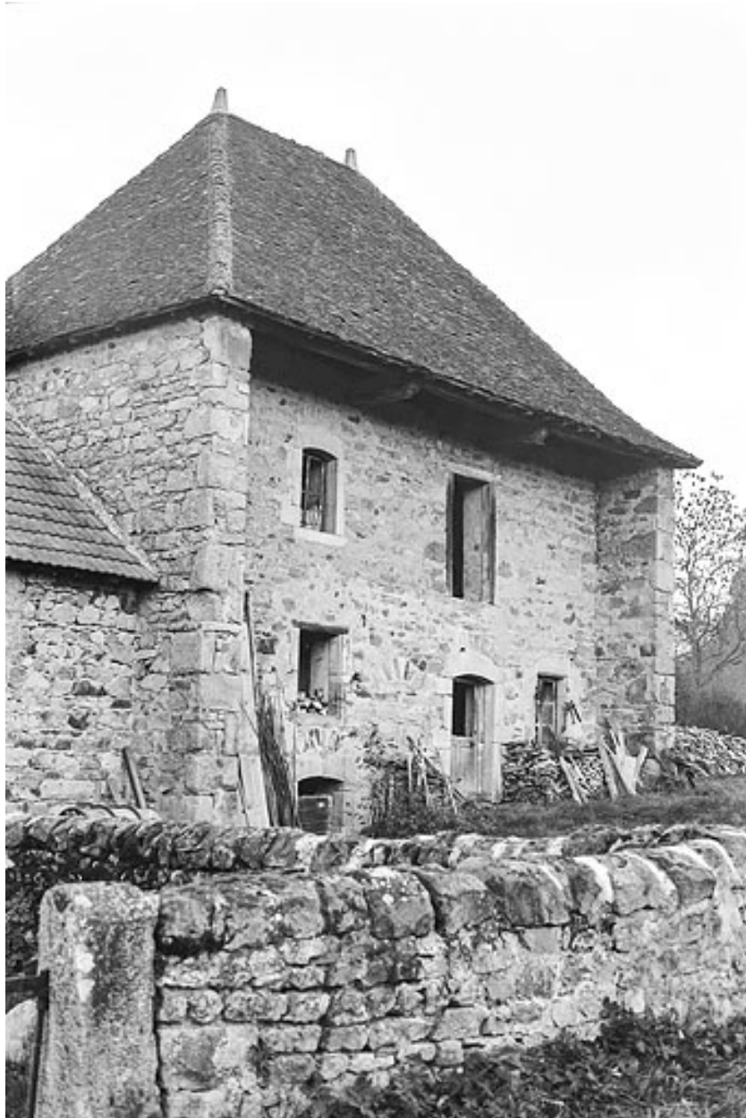
Maison, anciennement à galerie ou à balcon, à Frâgne, vers 1970.