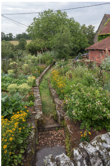
Canalisation du ruisseau traversant le jardin IVR26_20197100295NUC4A