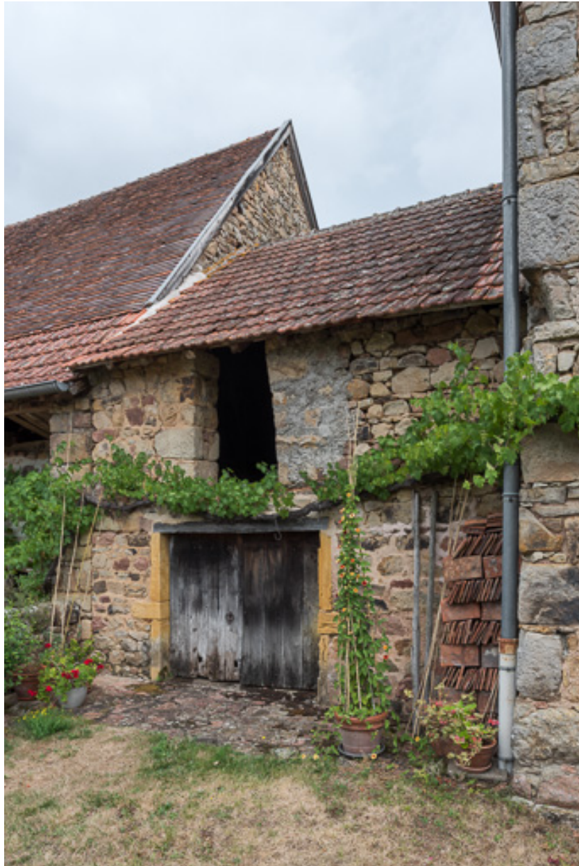
Façade antérieure de la remise, construite entre la maison et la grange primitive, après le partage de la propriété au milieu du XVIIIe siècle.