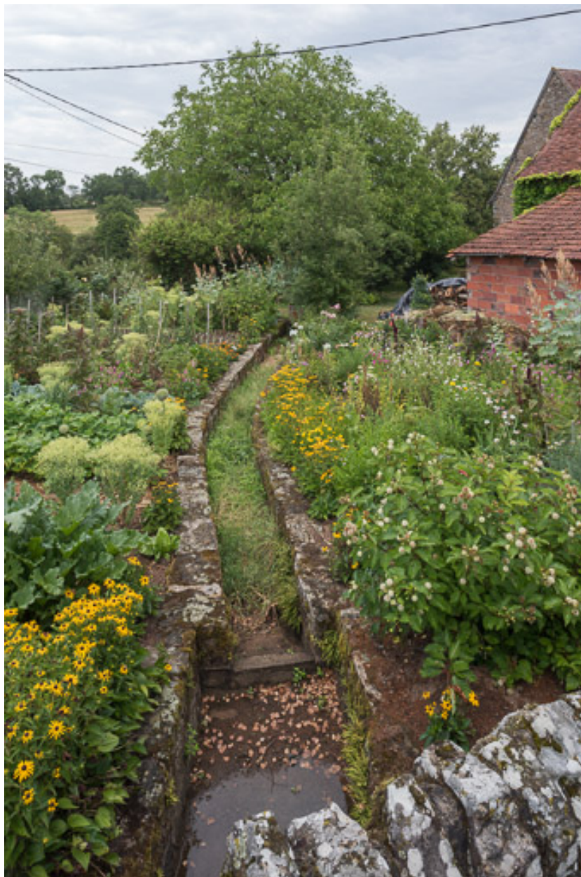
Canalisation du ruisseau traversant le jardin