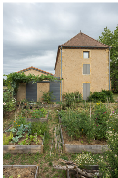
Vue de la façade latérale ouest de la maison, depuis le jardin potager IVR26_20197100304NUC4A