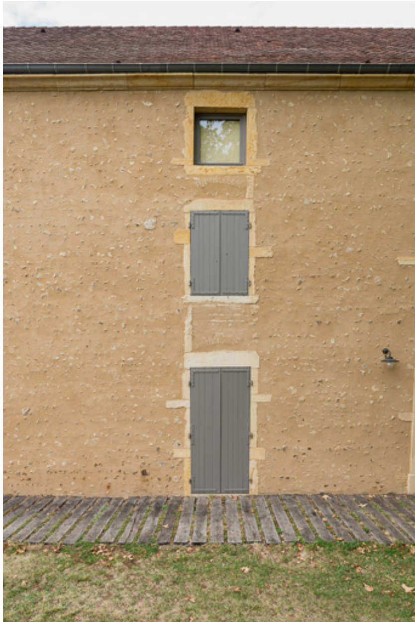
Travée de la façade antérieure de la maison