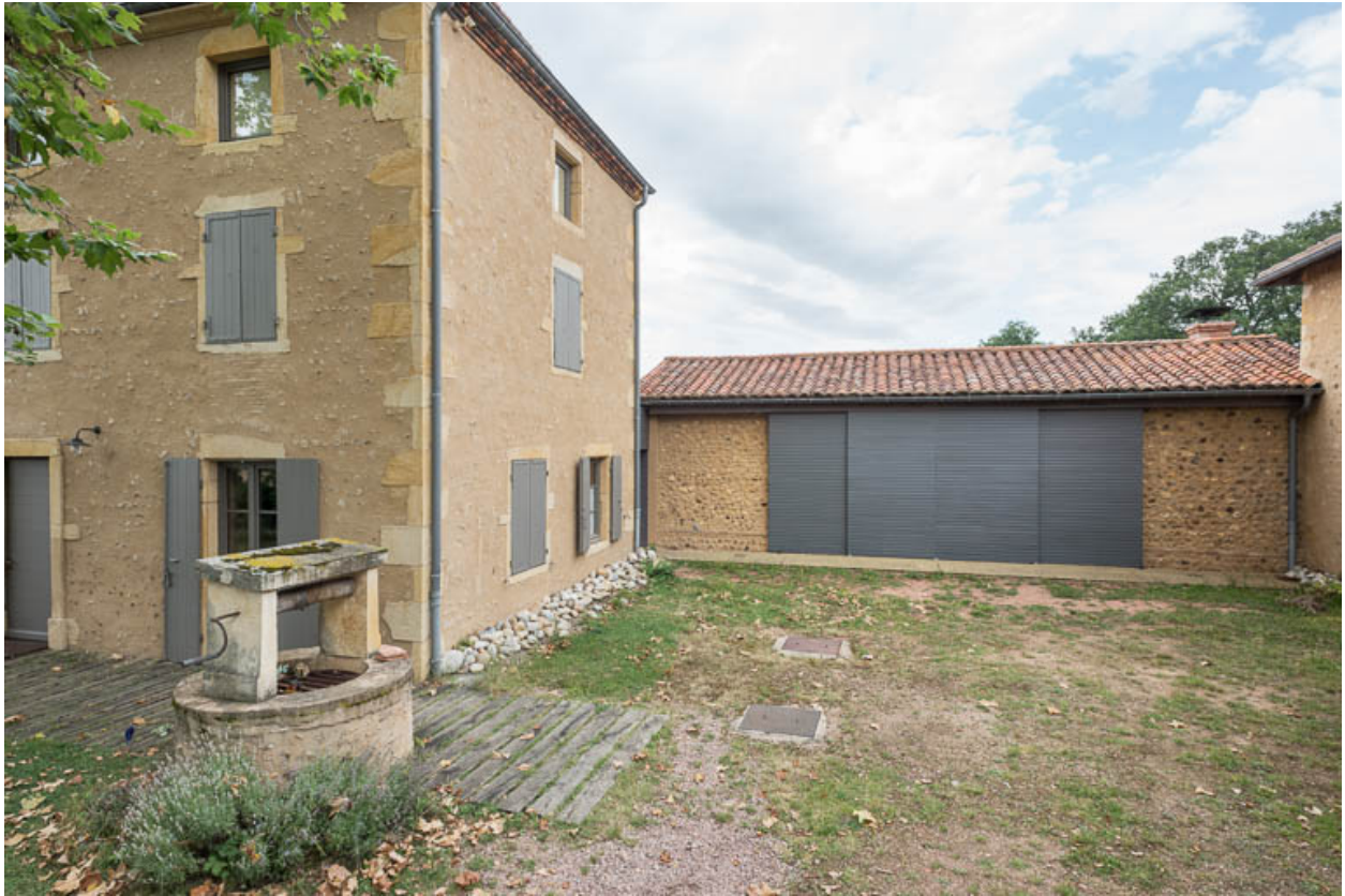
Cour de la ferme