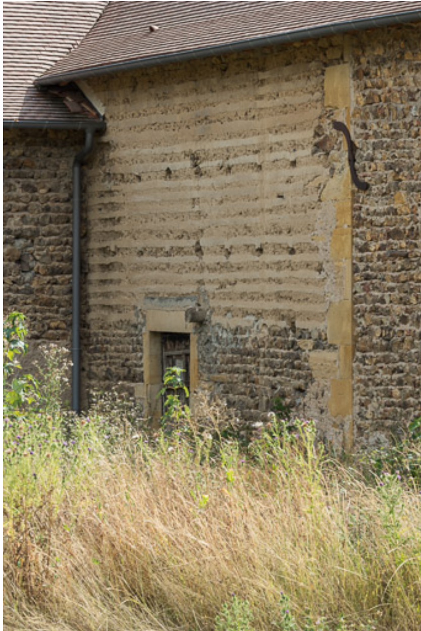
Détail d'un mur de la grange, partiellement bâti en pisé