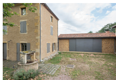
Cour de la ferme IVR26_20197100299NUC4A