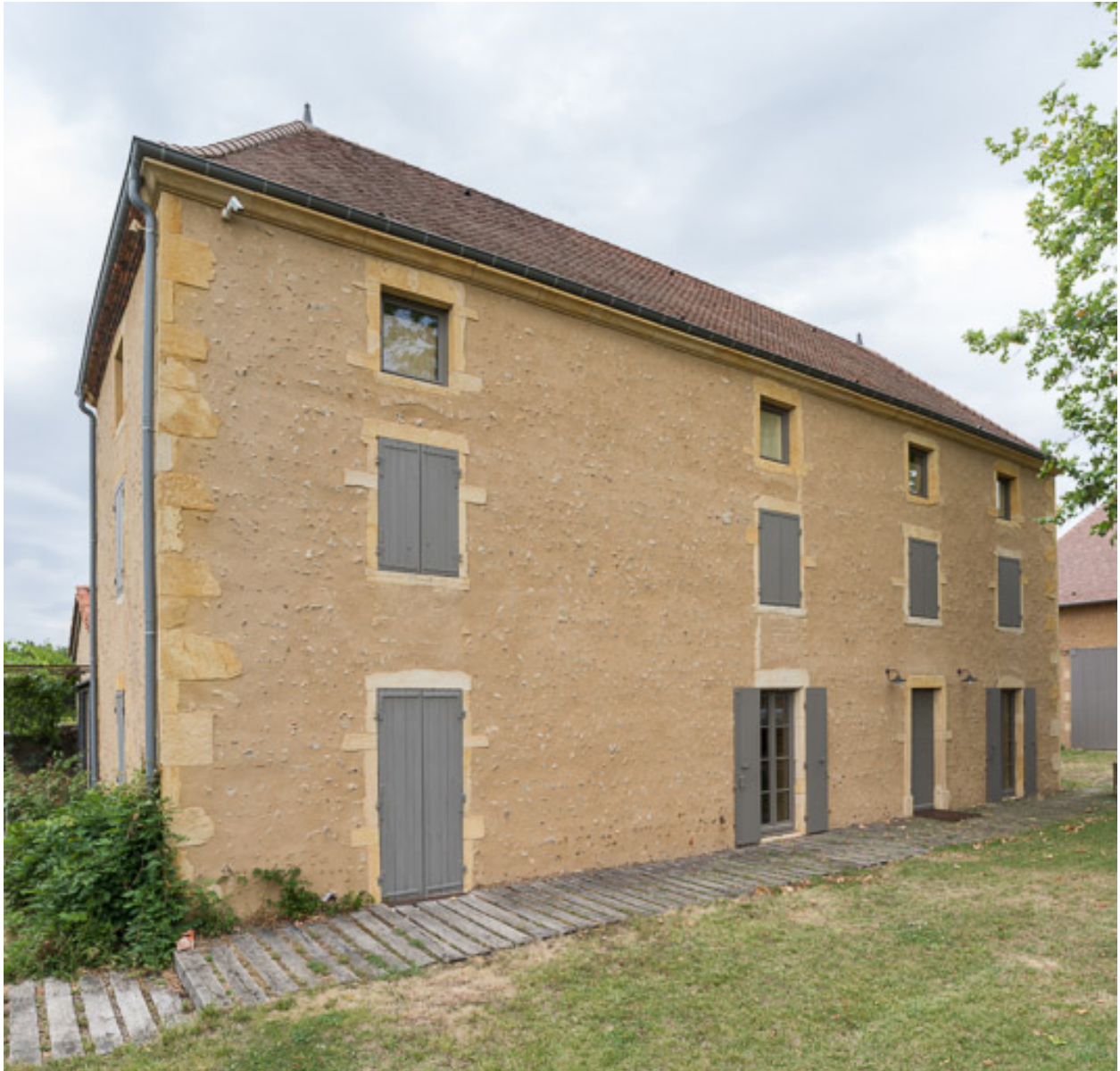
Façade antérieure de la maison de la ferme du Bois-Dieu