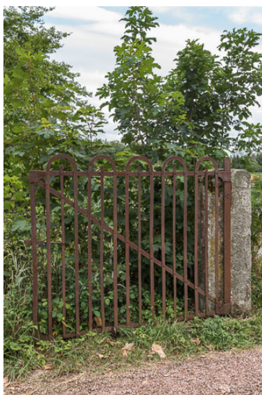
Portail à l'entrée de la propriété

IVR26_20197100303NUC4A