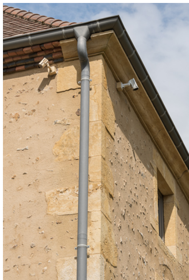
Détail de la corniche en pierre calcaire sur la façade antérieure de la maison IVR26_20197100307NUC4A