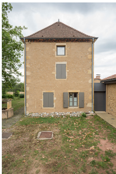
Façade latérale est de la maison IVR26_20197100300NUC4A

Plan masse et de situation de l'écart de Chaumont. Extrait du plan cadastral, 2021, section C, échelle 1/500 e. IVR26_20217100032NUDA