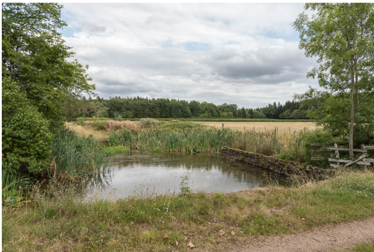
Mare à l'entrée de la propriété