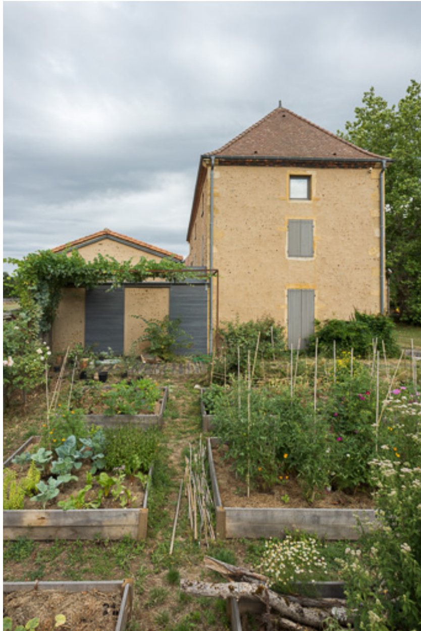
Vue de la façade latérale ouest de la maison, depuis le jardin potager