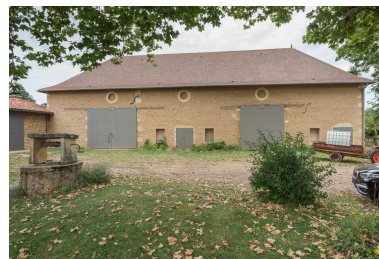
Façade antérieure de la grange