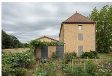
Vue de la façade latérale ouest de la maison, depuis le jardin potager. L'appentis, à l'arrière de la maison, a été rabaissé et couvert d'une petite toiture à deux pans.