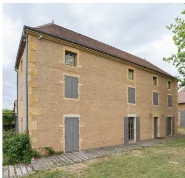
Façade antérieure de la maison de la ferme du Bois-Dieu IVR26_20197100301NUC4AQ