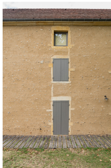
Travée de la façade antérieure de la maison IVR26_20197100302NUC4A

Plan masse et de situation de l'écart de Chaumont. Extrait du plan cadastral, 2021, section C, échelle 1/500 e. IVR26_20217100032NUDA