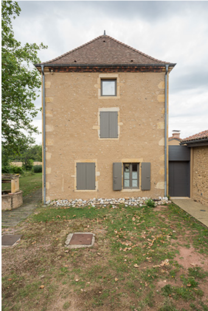
Façade latérale est de la maison