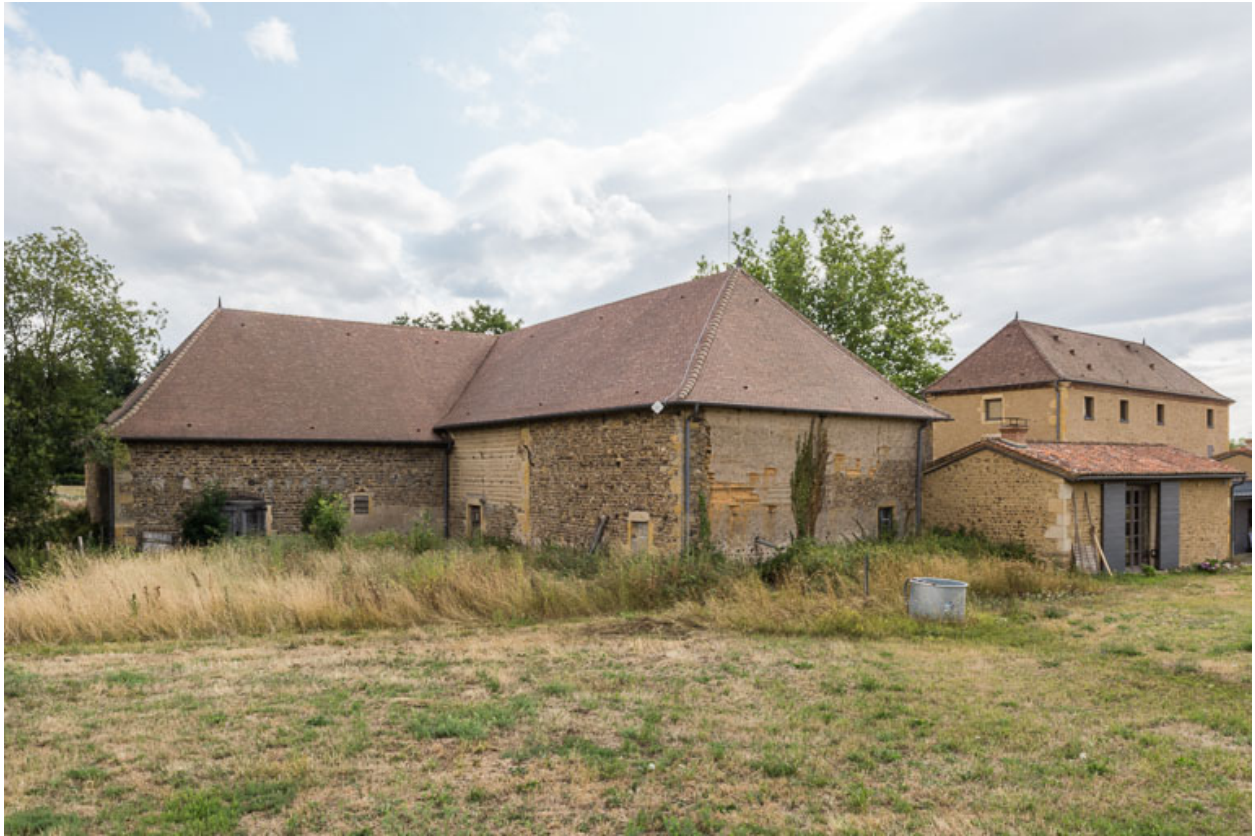
Vue d'ensemble des bâtiments au nord-est