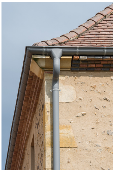
Détail de la corniche sur les façades latérales et postérieures de la maison. Seule la corniche de la façade antérieure est entièrement réalisée en pierre, alors que la brique est utilisée pour les autres façades.