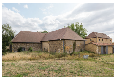
Vue d'ensemble des bâtiments au nord-est