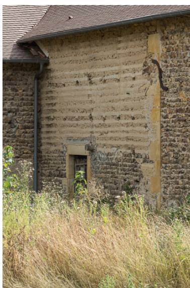
Détail d'un mur de la grange, partiellement bâti en pisé IVR26_20197100308NUC4A