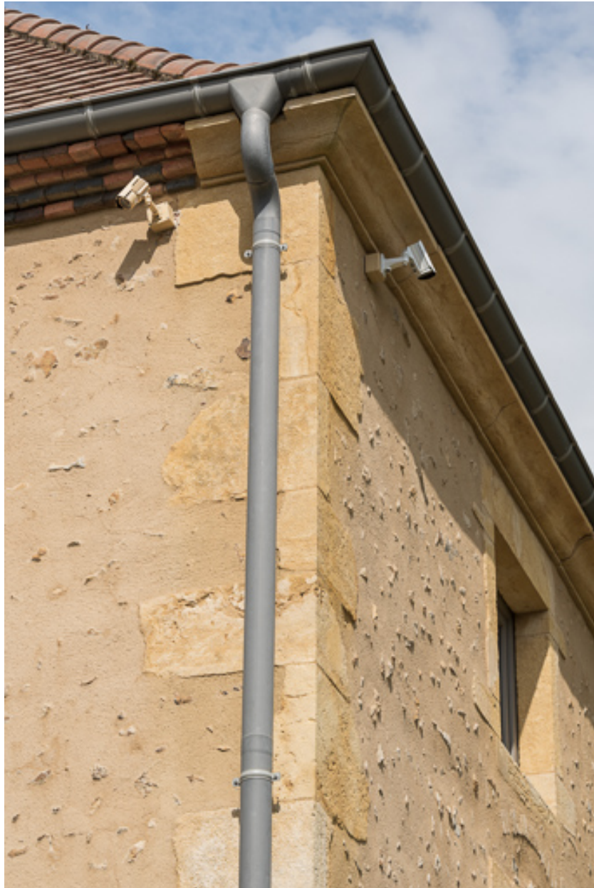
Détail de la corniche en pierre calcaire sur la façade antérieure de la maison