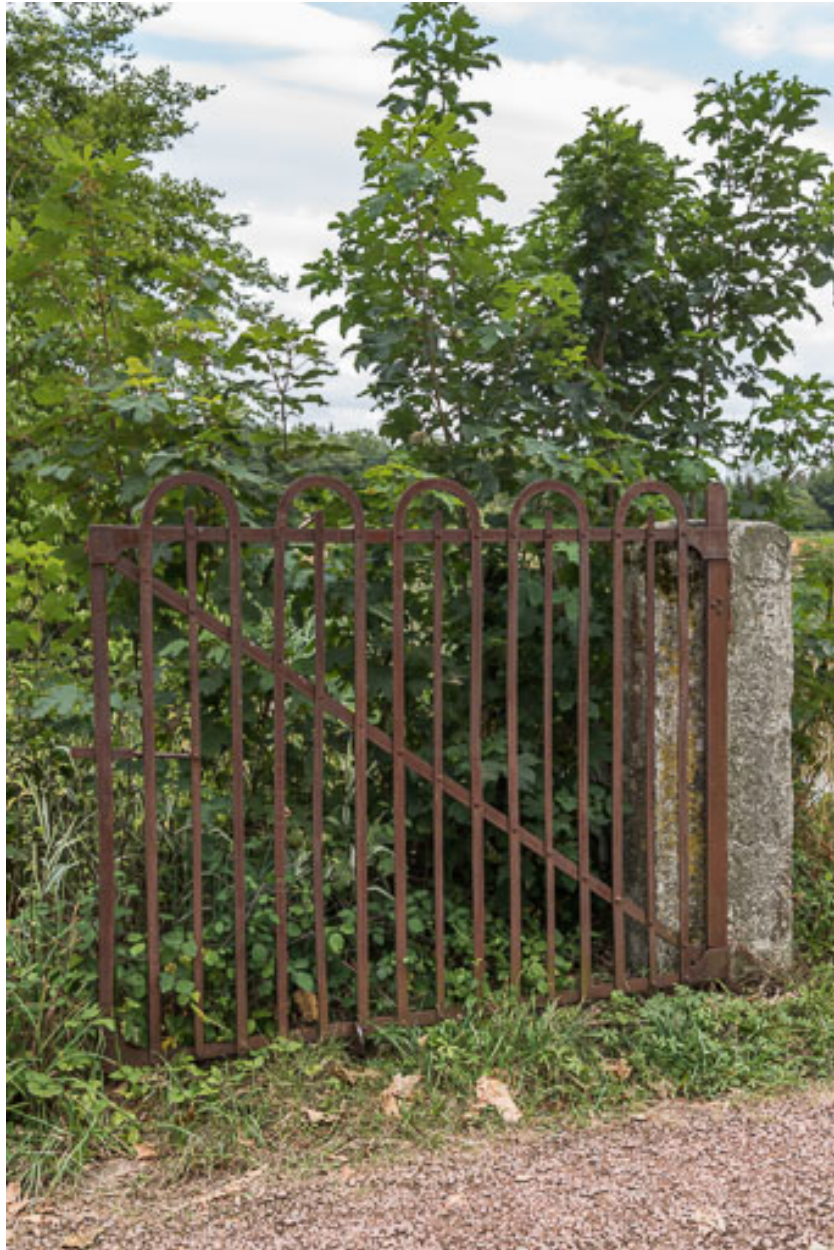
Portail à l'entrée de la propriété