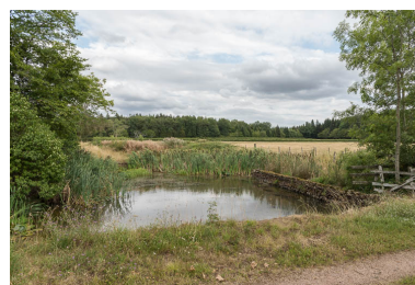
Mare à l'entrée de la propriété IVR26_20197100311NUC4A

IVR26_20197100310NUC4A