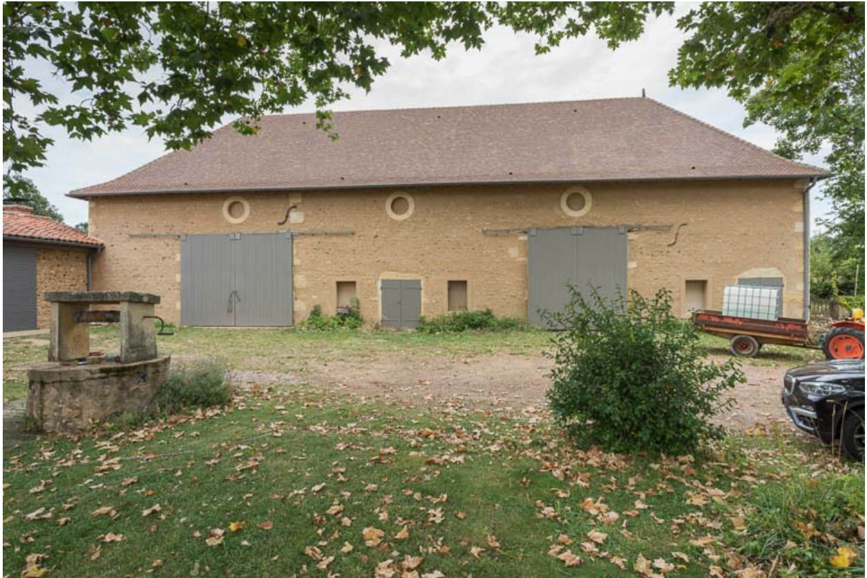
Façade antérieure de la grange