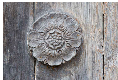
Décor de la porte cochère. IVR43_20157000339NUC2A