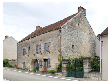
Vue générale de trois quarts droite.