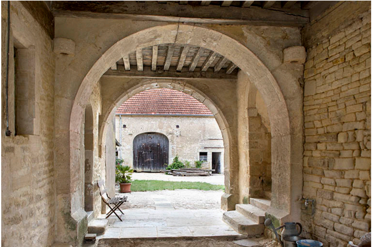
Passage conduisant à la cour.