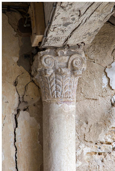
Colonne adossée au mur du deuxième palier. IVR43_20157000331NUC2A