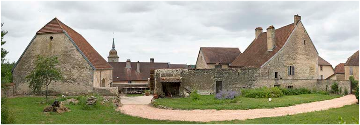
Vue générale des bâtiments autour de la cour : grange à gauche et demeure à droite.