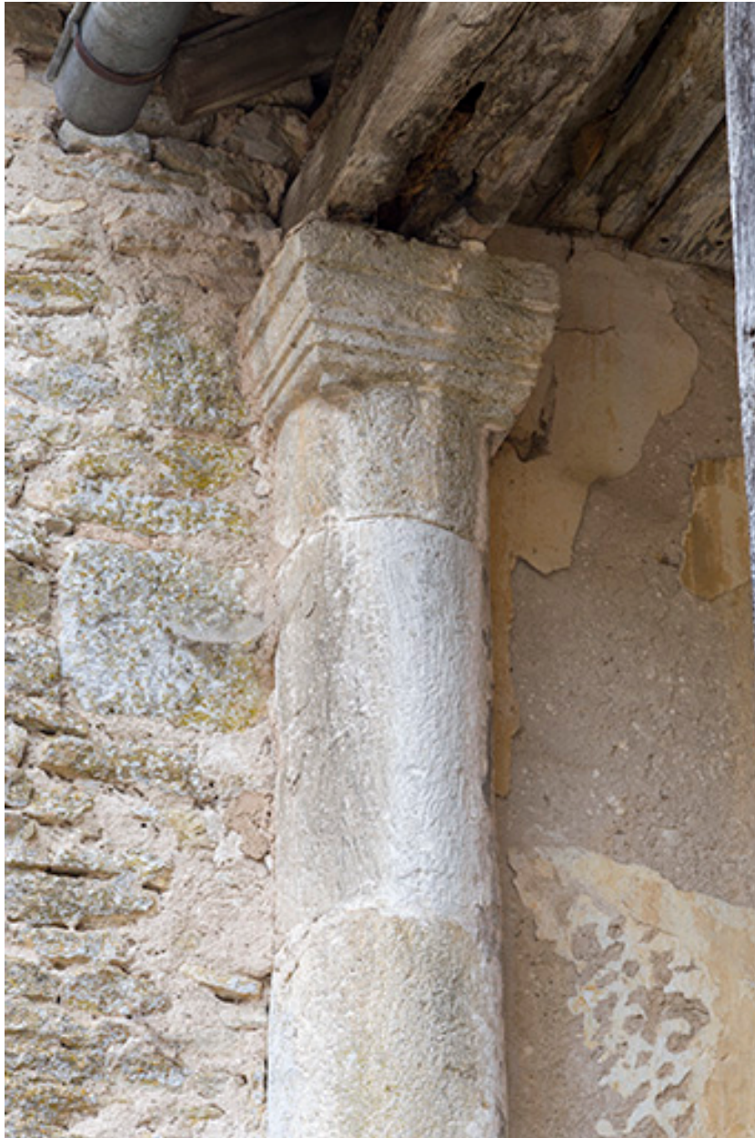
Colonne adossée au mur du premier palier.