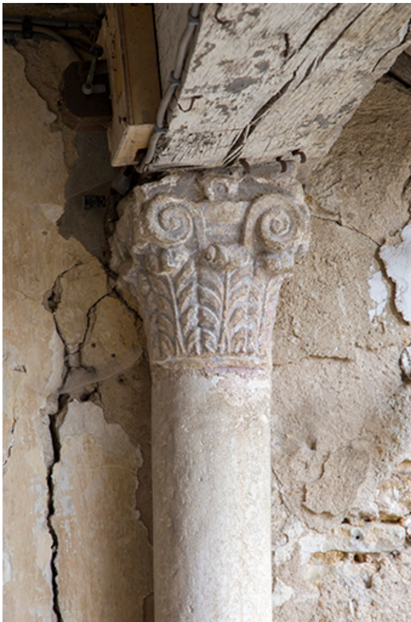
Colonne adossée au mur du deuxième palier.