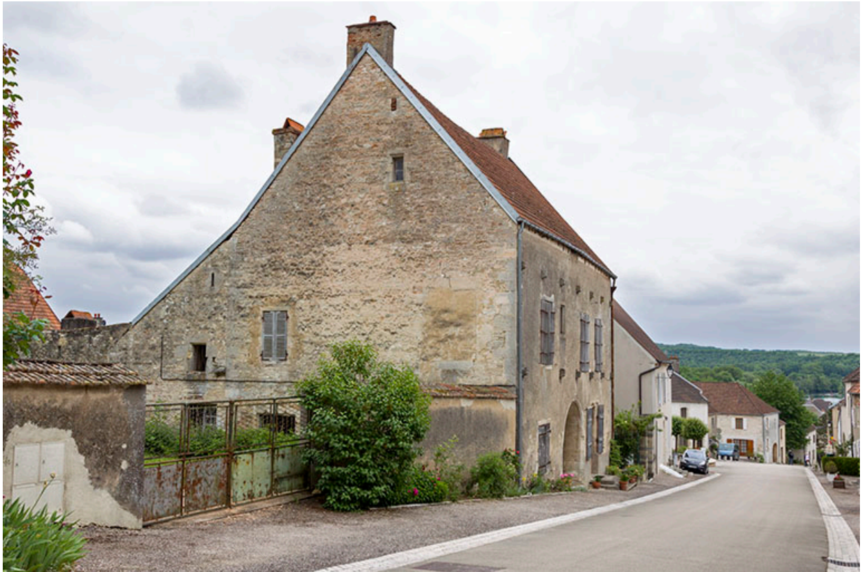
Vue générale de trois quarts gauche.