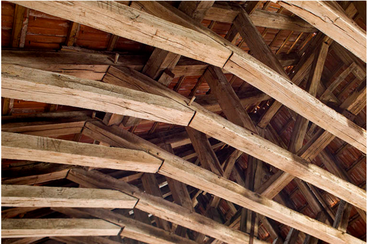
Détail de l'assemblage de la charpente.