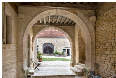
Passage conduisant à la cour. IVR43_20157000334NUC2A