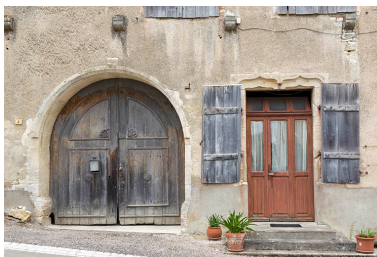
Façade antérieure : porte cochère et baie modifiée avec linteau en accolade. IVR43_20157000338NUC2A