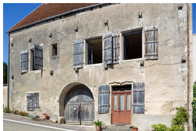
Façade antérieure. IVR43_20157000327NUC2A