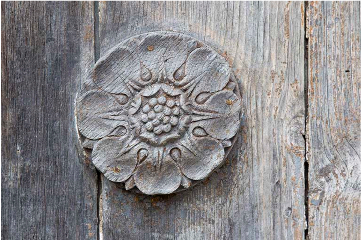
Décor de la porte cochère.