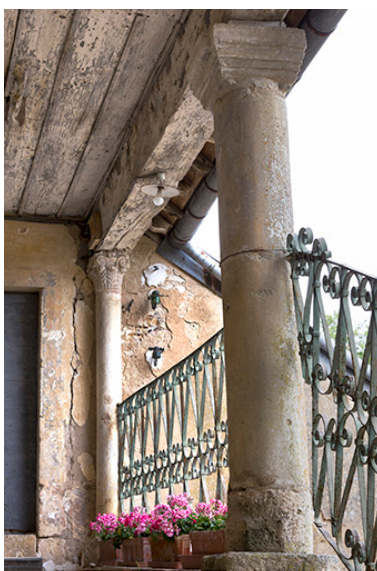
Colonnes du deuxième palier.