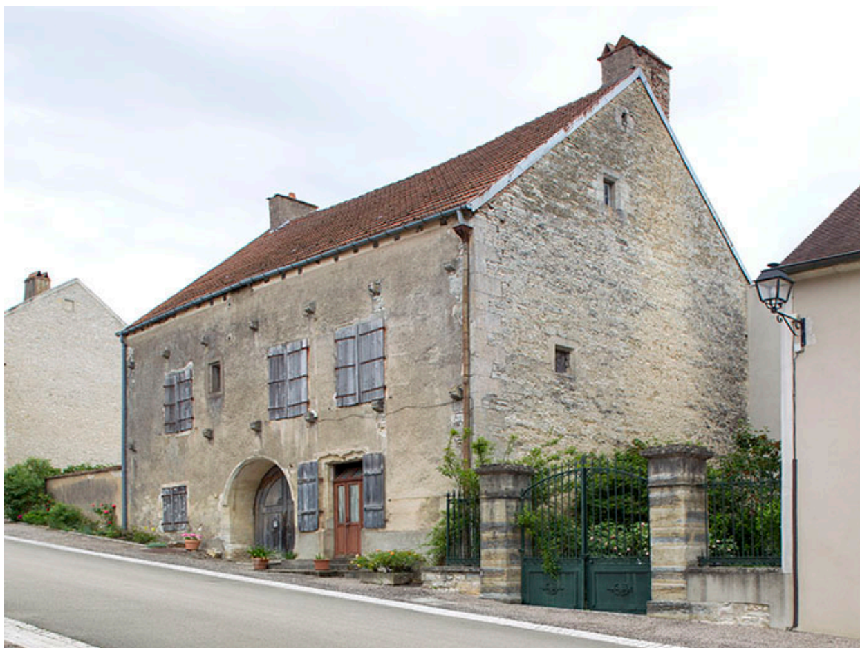
Vue générale de trois quart droite.