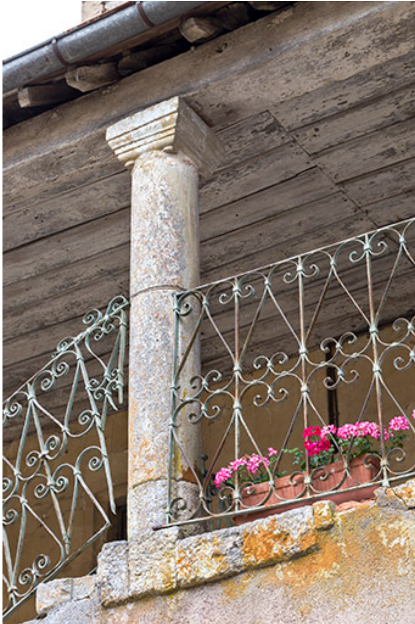
Colonne centrale du deuxième palier.