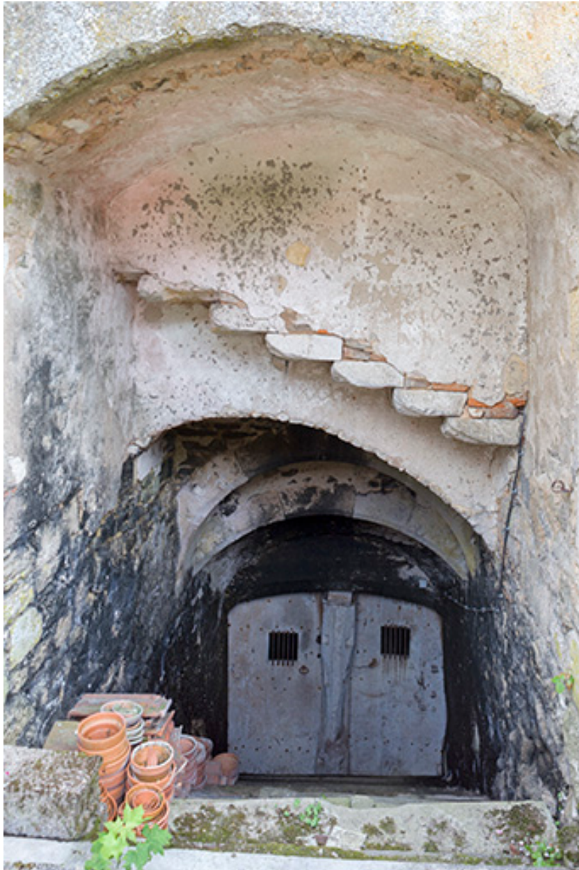
Entrée de la cave.