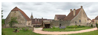
Vue générale des bâtiments autour de la cour : grange à gauche et demeure à droite.