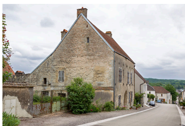
Vue générale de trois quarts gauche.