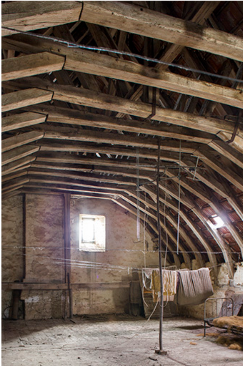
Vue rapprochée de la charpente.