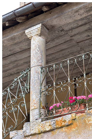
Colonne centrale du deuxième palier. IVR43_20157000333NUC2A