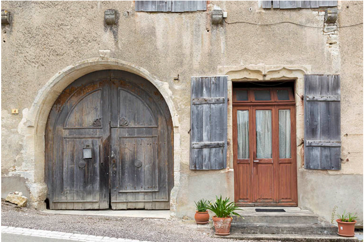
Façade antérieure : porte cochère et baie modifiée avec linteau en accolade.