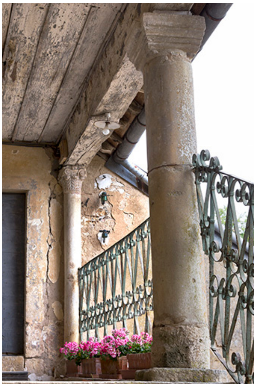
Colonnes du deuxième palier.