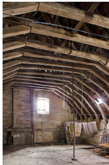
Vue rapprochée de la charpente. IVR43_20157000336NUC2A