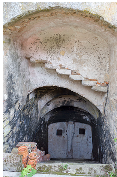
Entrée de la cave. IVR43_20157000329NUC2A