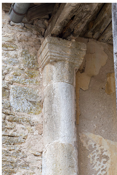
Colonne adossée au mur du premier palier. IVR43_20157000332NUC2A