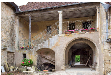
Façade postérieure.