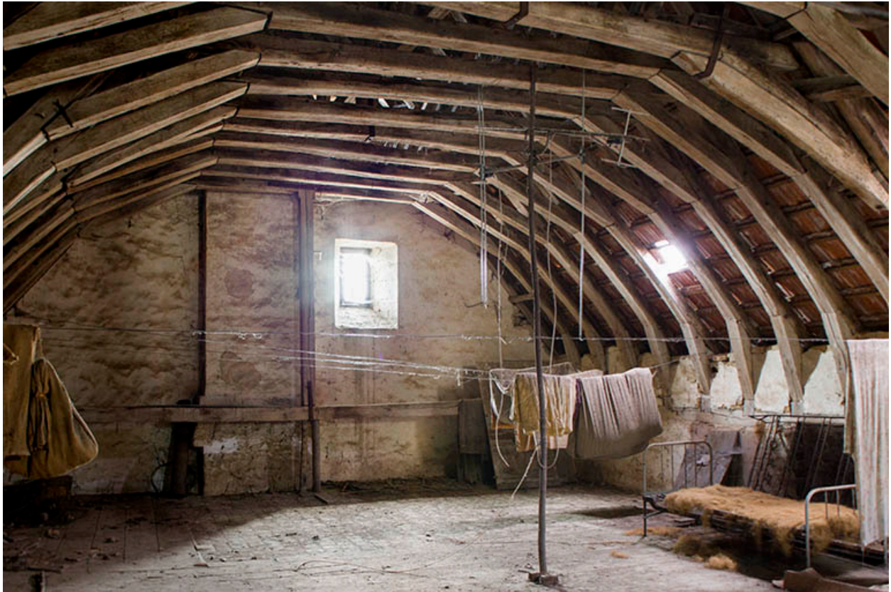
Vue générale de la charpente.