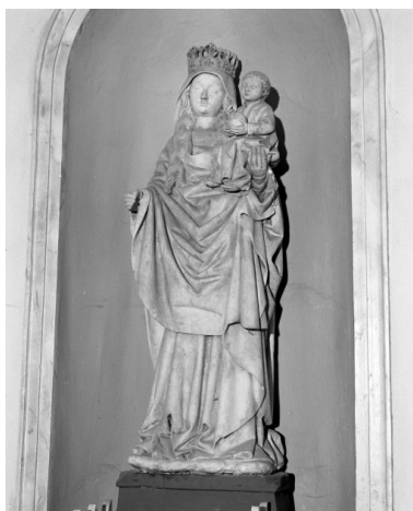
Vue de face IVR26_20017100800X