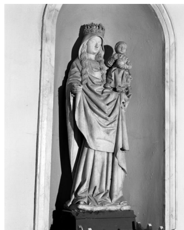
Vue de trois-quarts IVR26_20017100802X