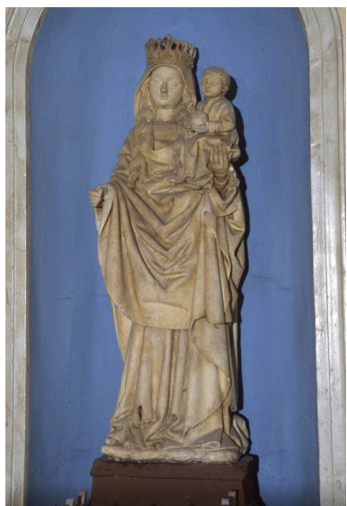
Vue de face IVR26_20017100801ZA