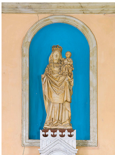
Vue de face. IVR26_20237100021NUC4A