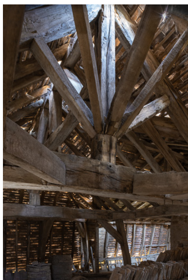
Détail de la charpente : poinçon et contrefiches IVR26_20197100320NUC4A