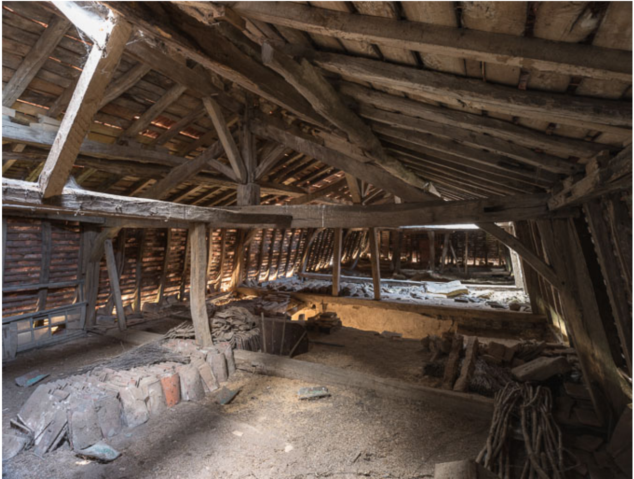
Vue de la charpente de la demeure