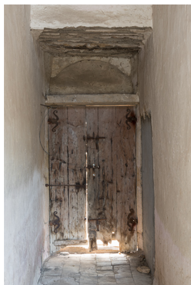
Vue de la porte de la façade postérieure, depuis le vestibule