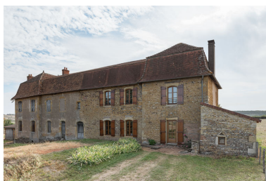
Vue de la demeure ou maison de maître de la Mollière (façade antérieure) IVR26_20197100335NUC4A