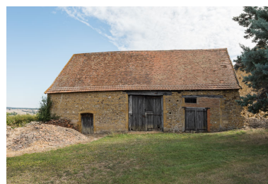
Façade antérieure de l'aile principale des dépendances, orientée à l'ouest IVR26_20197100334NUC4A