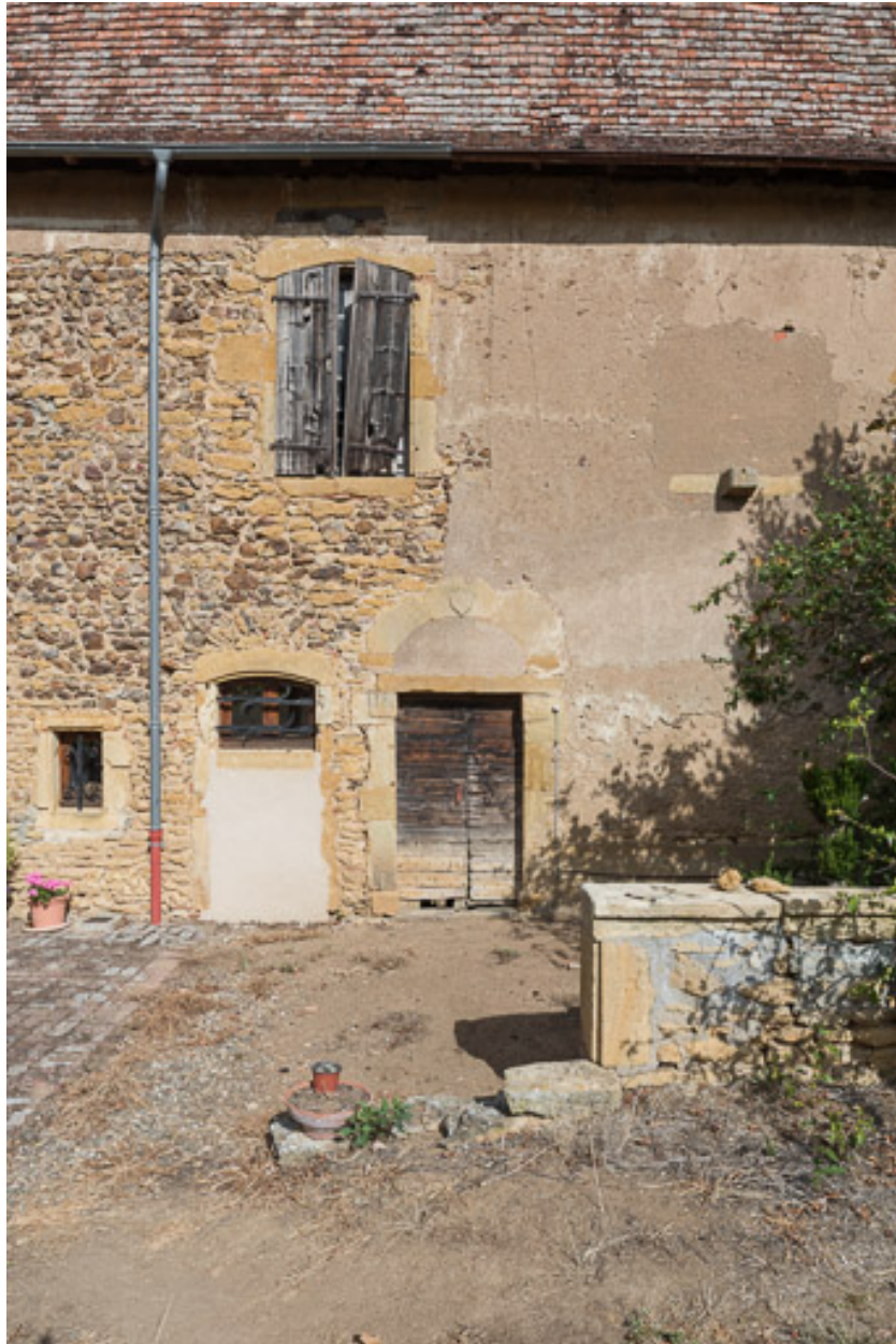
Travée centrale de la façade postérieure de la maison