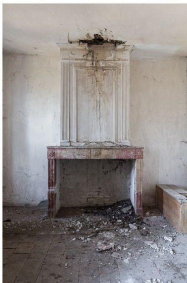
Vue de la cheminée de cette chambre IVR26_20197100323NUC4A