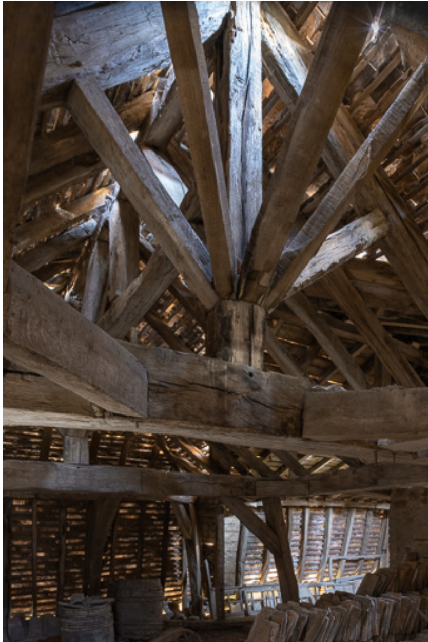
Détail de la charpente : pignon et contrefiches