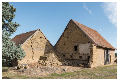
Vue des deux ailes de dépendances. A la jonction des deux bâtiments, une ancienne étable à bovins a été démolie suite à l'effondrement de sa charpente.. IVR26_20197100330NUC4A