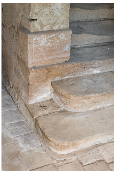
Moulure, à la base du mur-noyau de l'escalier IVR26_20197100315NUC4A