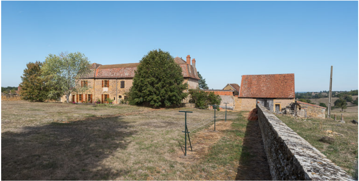
Vue de la demeure (façade postérieure) de la Mollière et de ses dépendances, depuis le jardin.