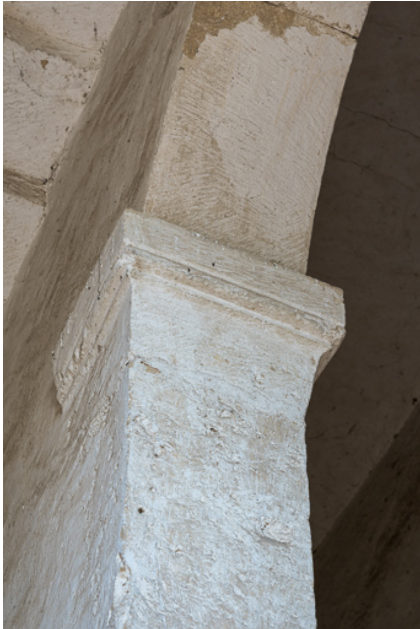
Chapiteau recevant la retombée de l'arche