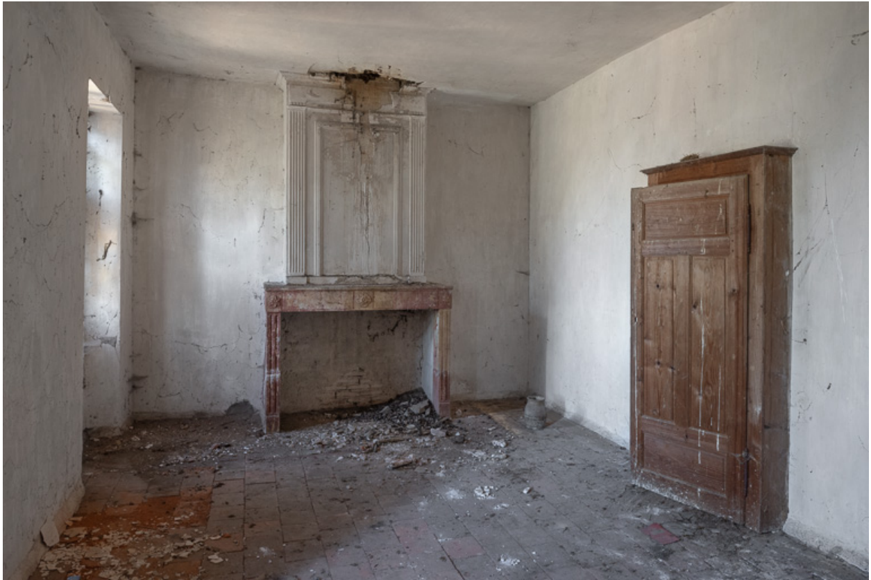
Vue d'une ancienne chambre de la demeure