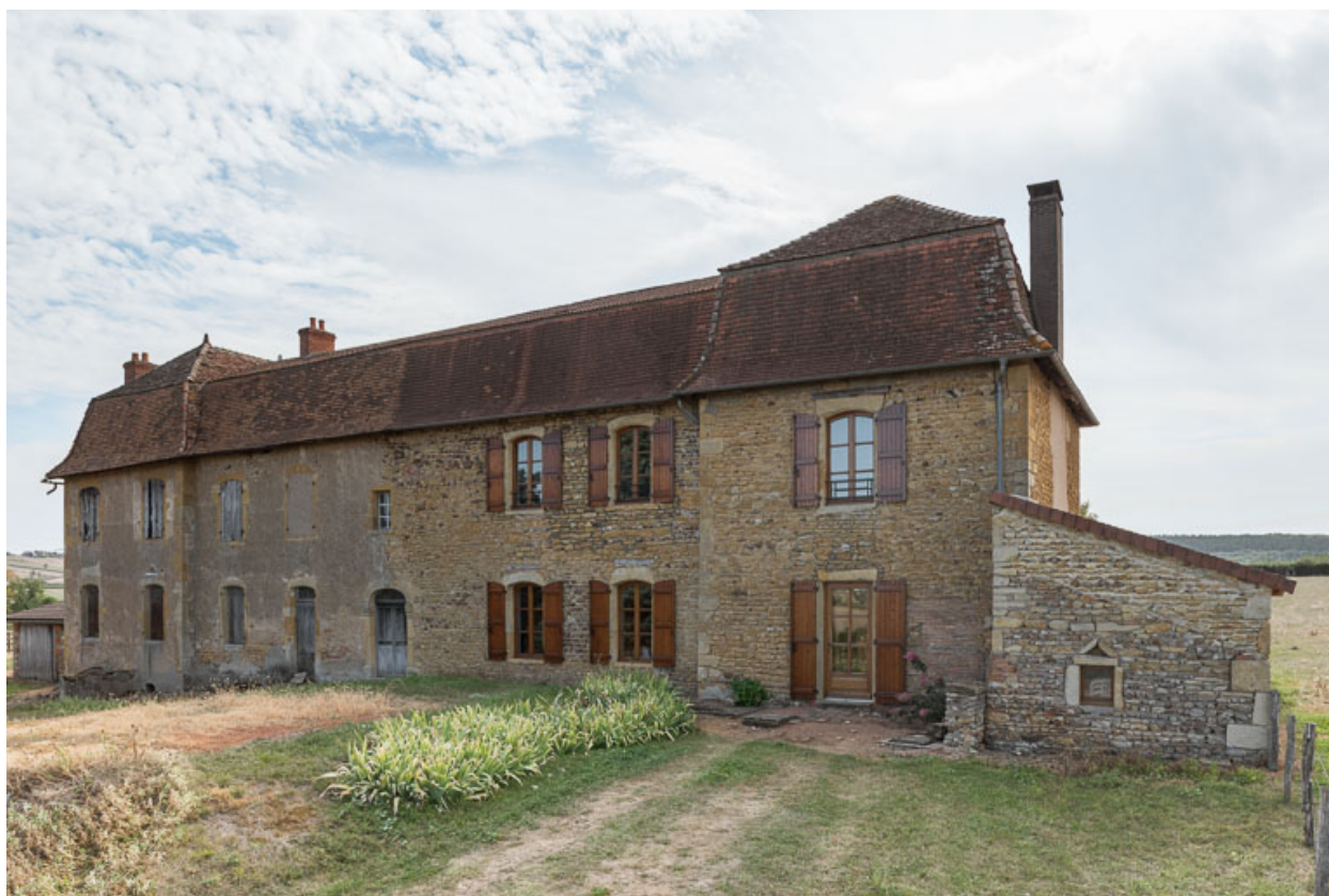
Vue de la demeure ou maison de maître de la Mollière (façade antérieure)