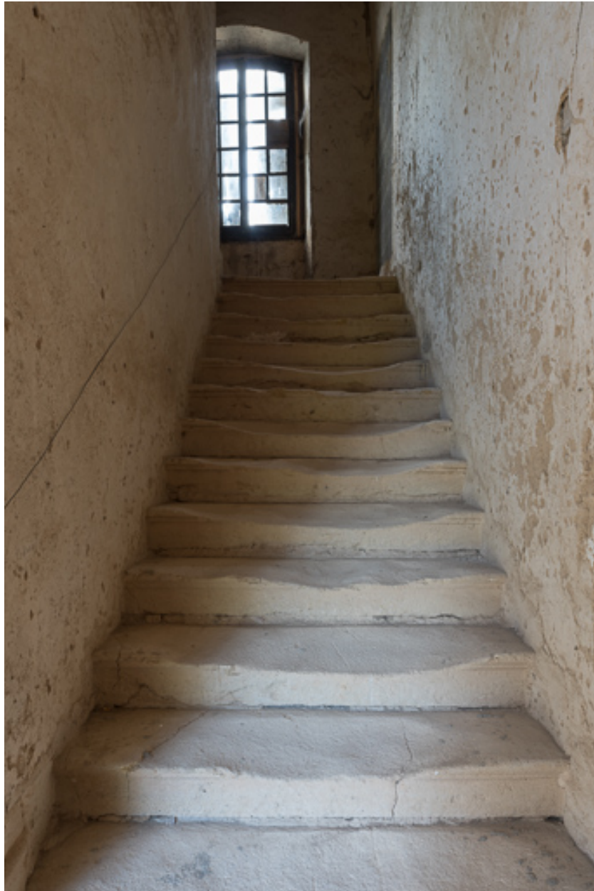
Une des volées de l'escalier rampe sur rampe de la demeure