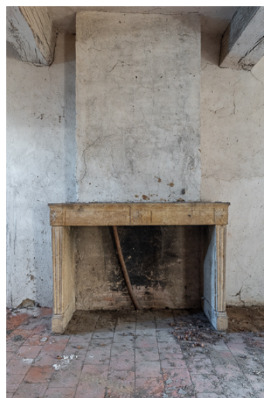
Cheminée d'une des anciennes chambres de la demeure IVR26_20197100321NUC4A