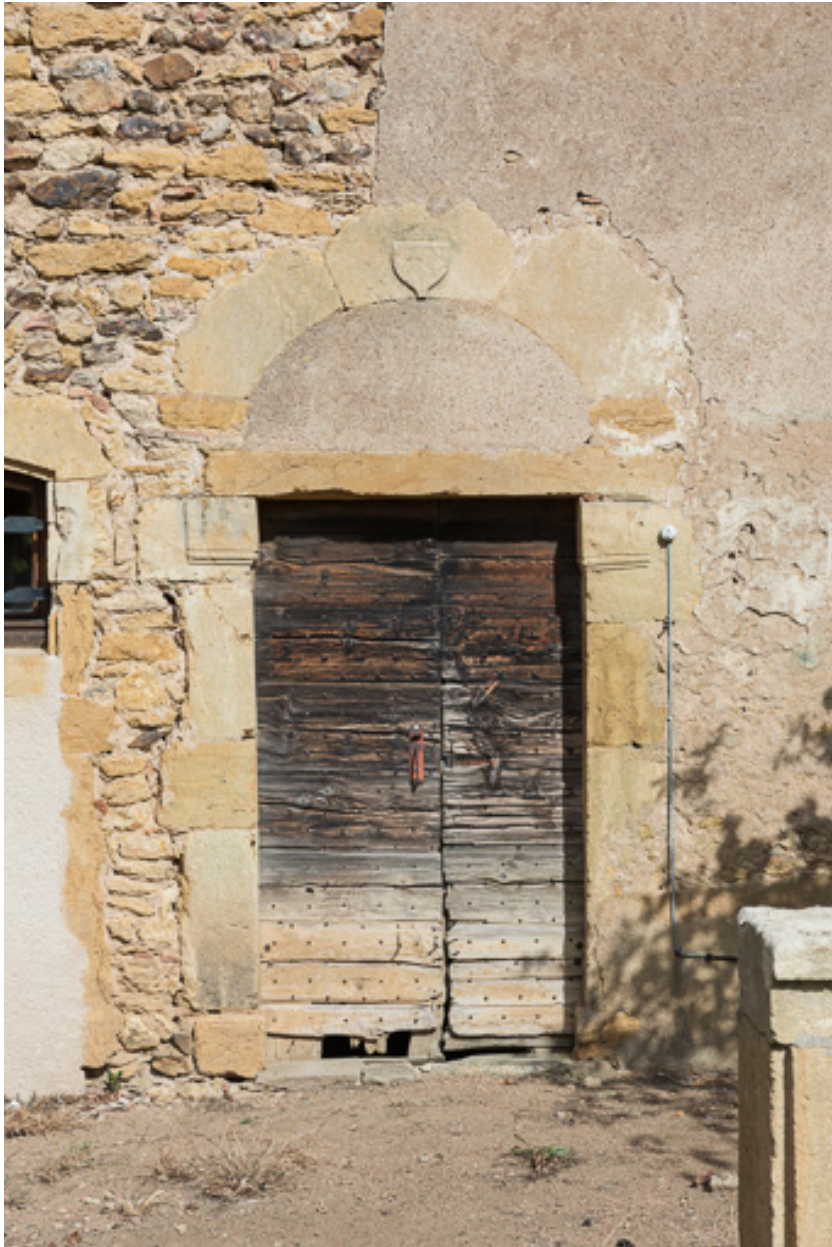
Porte de la façade postérieure de la demeure