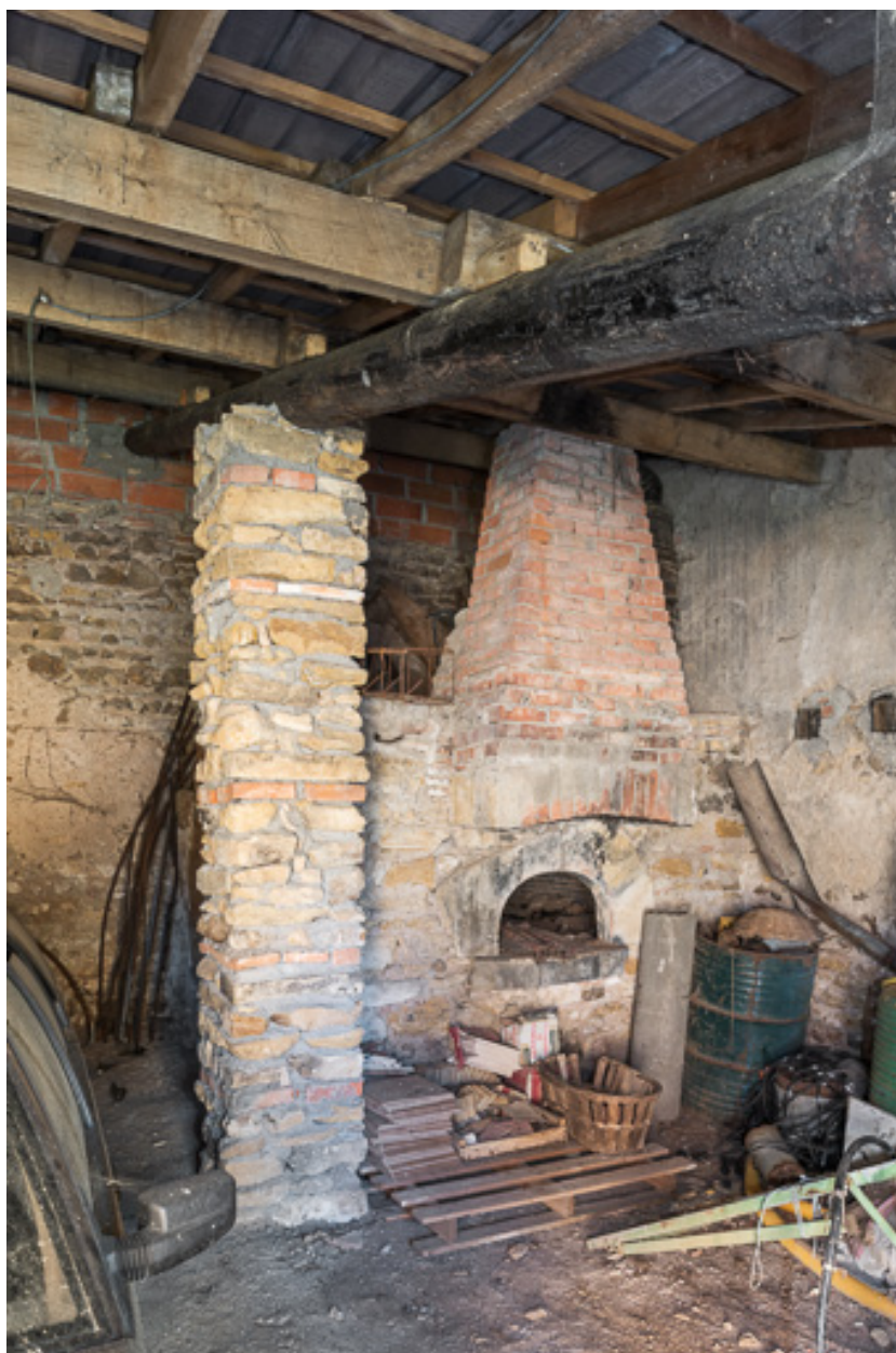
Four à pain du XIXe siècle, contre la façade nord-est de la demeure