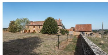
Vue de la demeure (façade postérieure) de la Mollière et de ses dépendances, depuis le jardin.