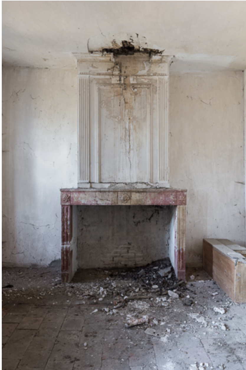
Vue de la cheminée de cette chambre