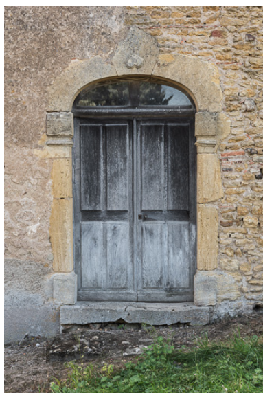
Porte principale de la demeure sur la façade antérieure du bâtiment