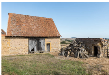
Seconde aile des dépendances (façade antérieure, orientée au sud). A droite, les soues à cochons (XIXe siècle) partiellement démolies.