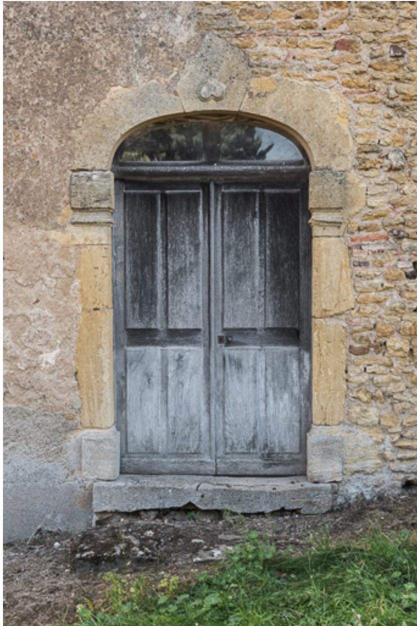
Porte principale de la demeure sur la façade antérieure du bâtiment