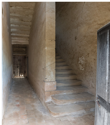
Vestibule et escalier IVR26_20197100312NUC4AQ