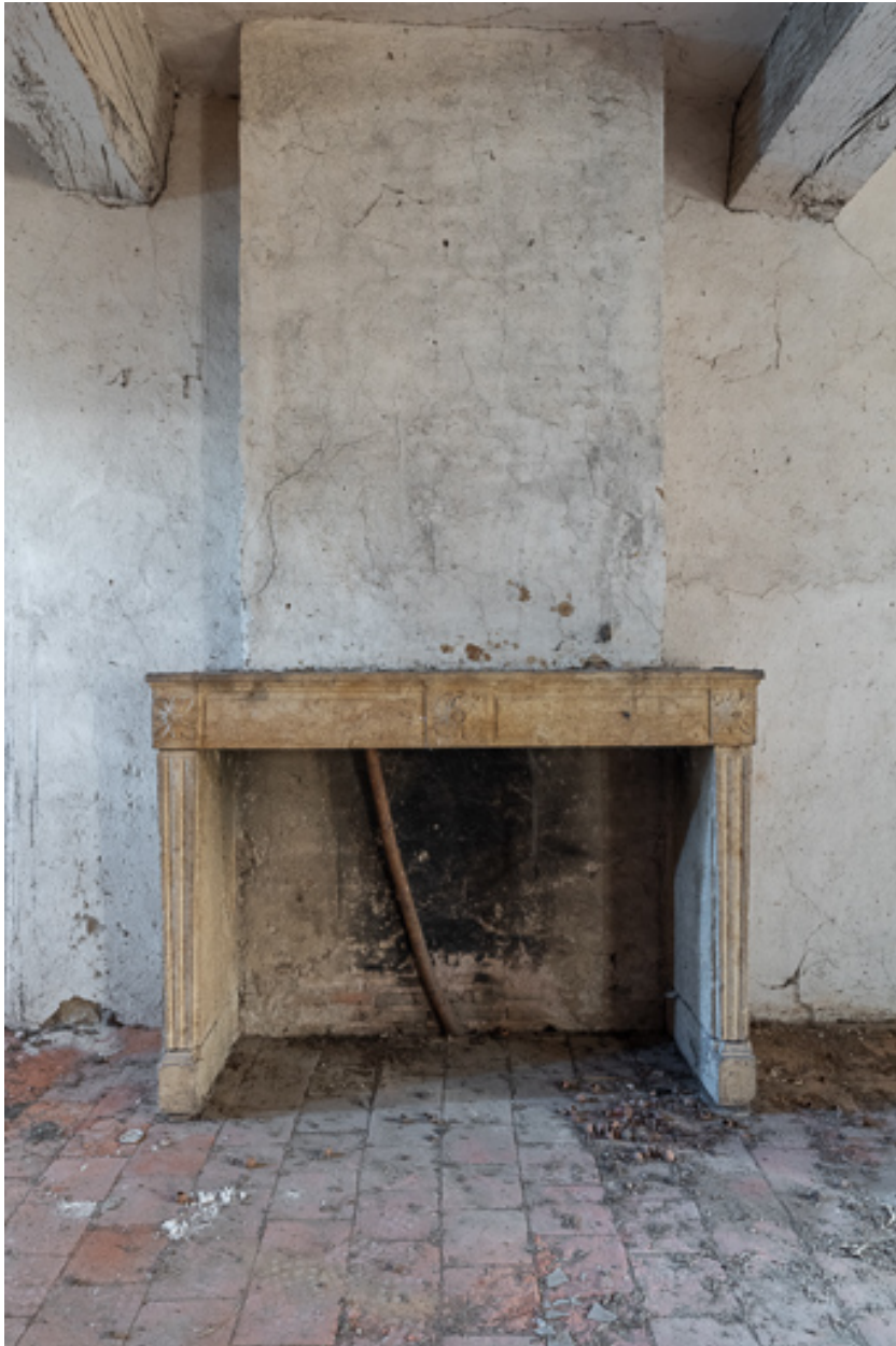
Cheminée d'une des anciennes chambres de la demeure