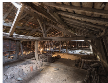
Vue de la charpente de la demeure IVR26_20197100319NUC4AQ