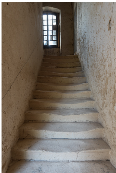
Une des volées de l'escalier rampe sur rampe de la demeure