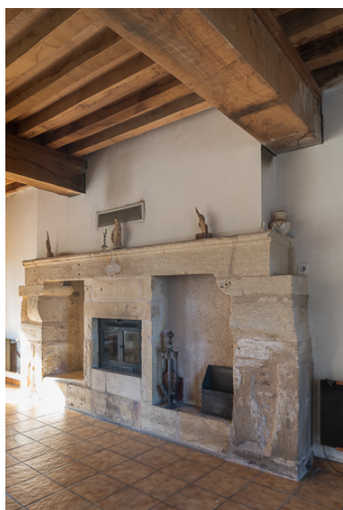
Cheminée de l'ancienne cuisine de la demeure IVR26_20197100325NUC4A