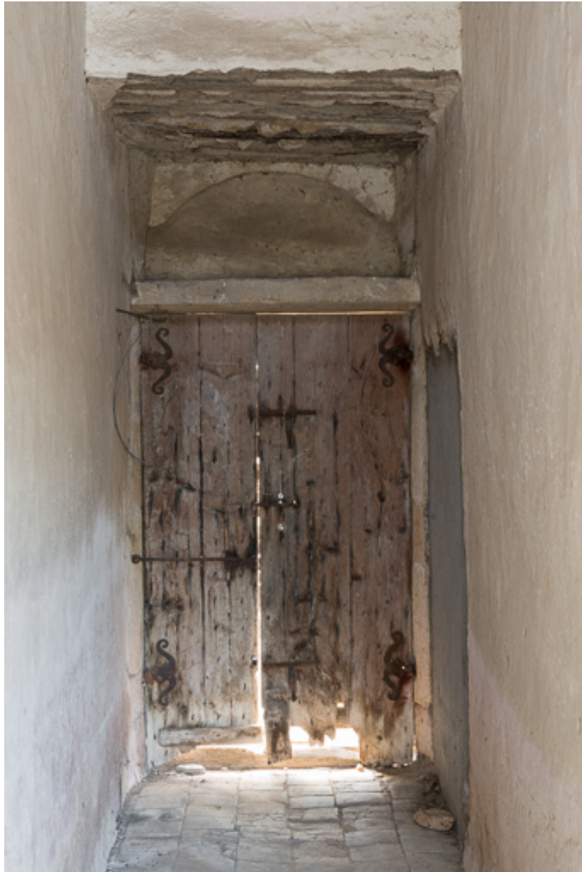
Vue de la porte de la façade postérieure, depuis le vestibule