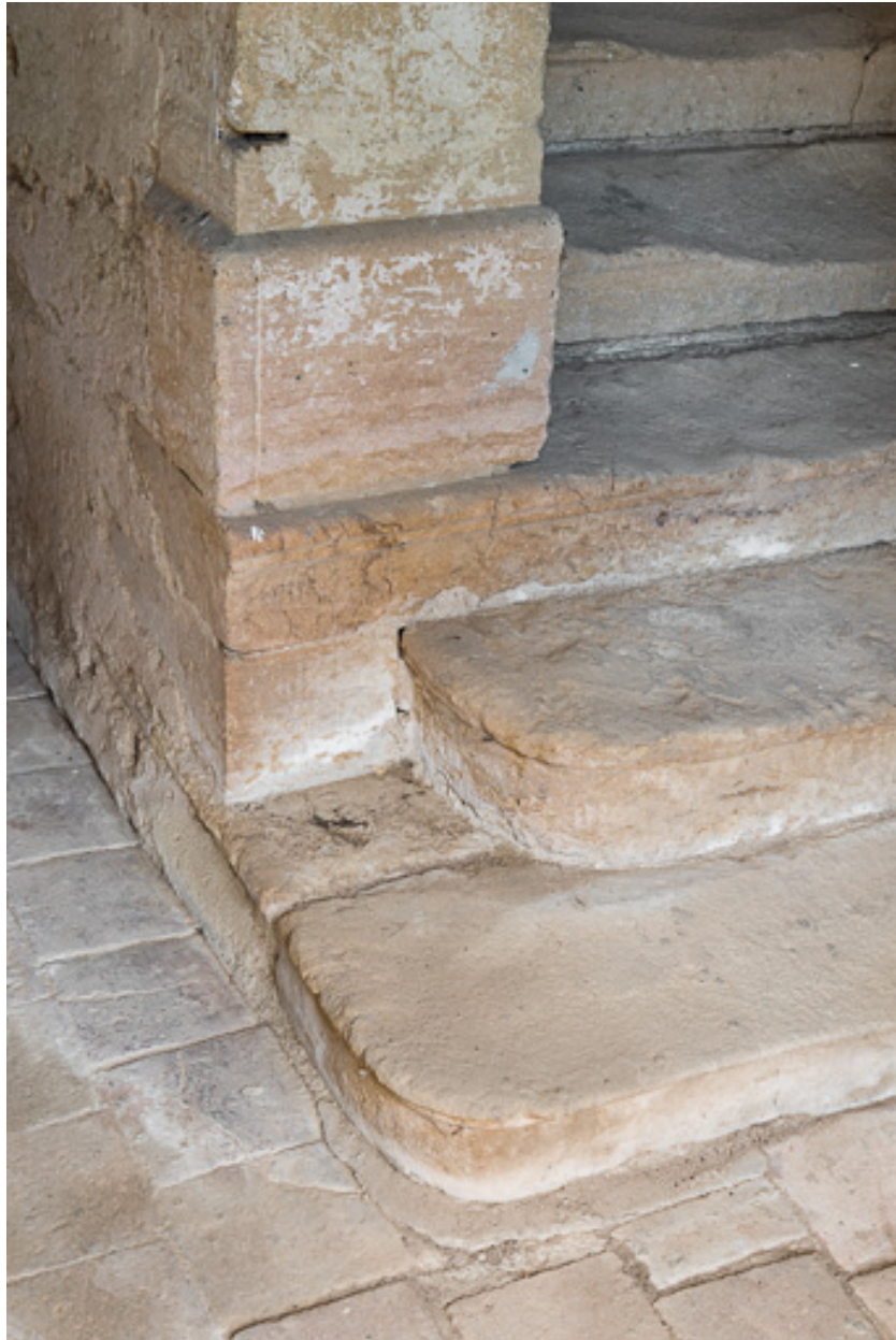
Moulure, à la base du mur-noyau de l'escalier