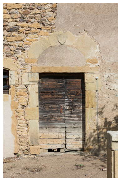
Porte de la façade postérieure de la demeure