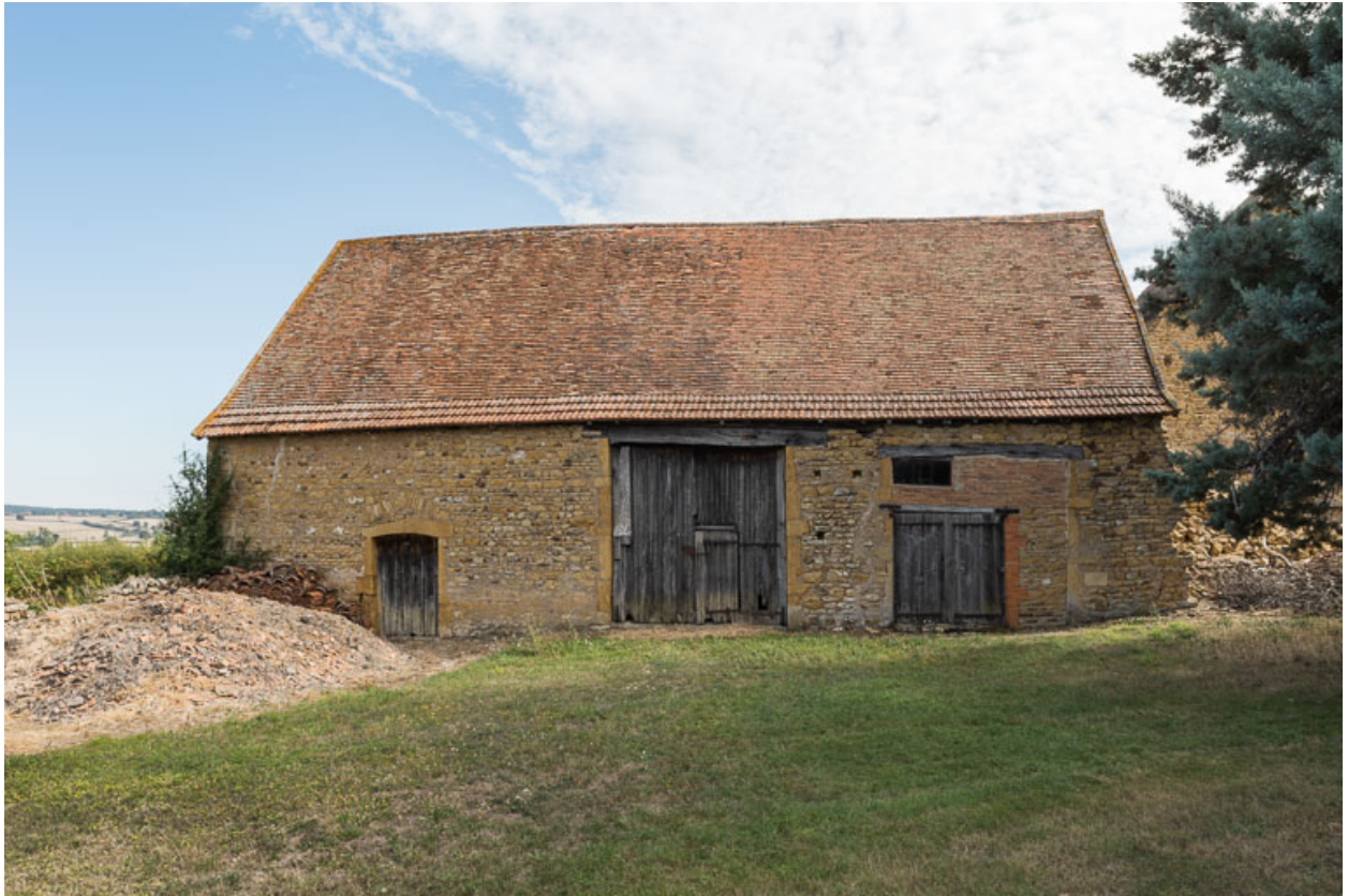
Façade antérieure de l'aile principale des dépendances, orientée à l'ouest