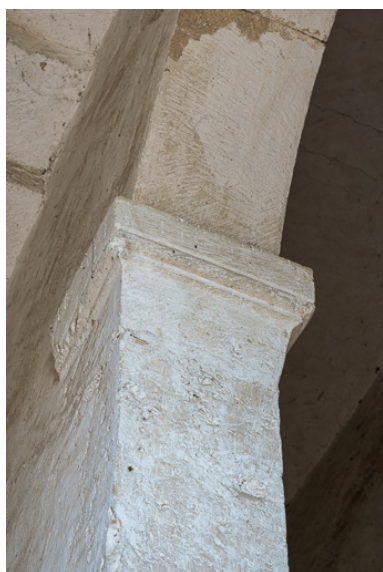
Chapiteau recevant la retombée de l'arche