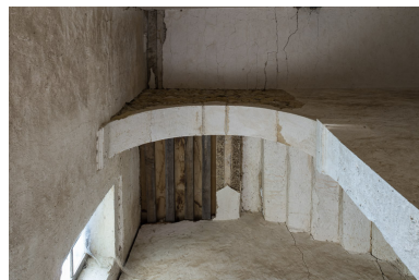
Arche ouvrant sur l'escalier de la demeure IVR26_20197100314NUC4A