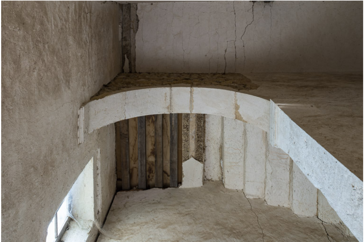
Arche ouvrant sur l'escalier de la demeure