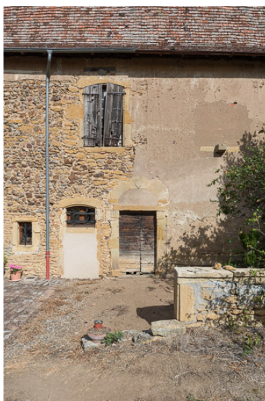
Travée centrale de la façade postérieure de la maison