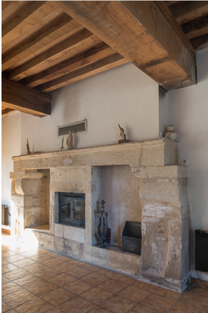
Cheminée de l'ancienne cuisine de la demeure