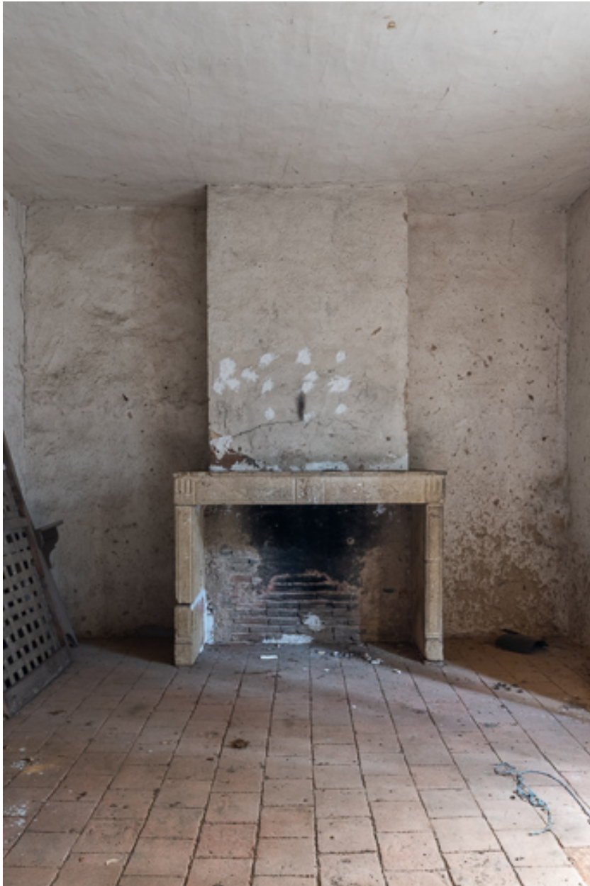
Une des anciennes chambres, à l'étage de la demeure