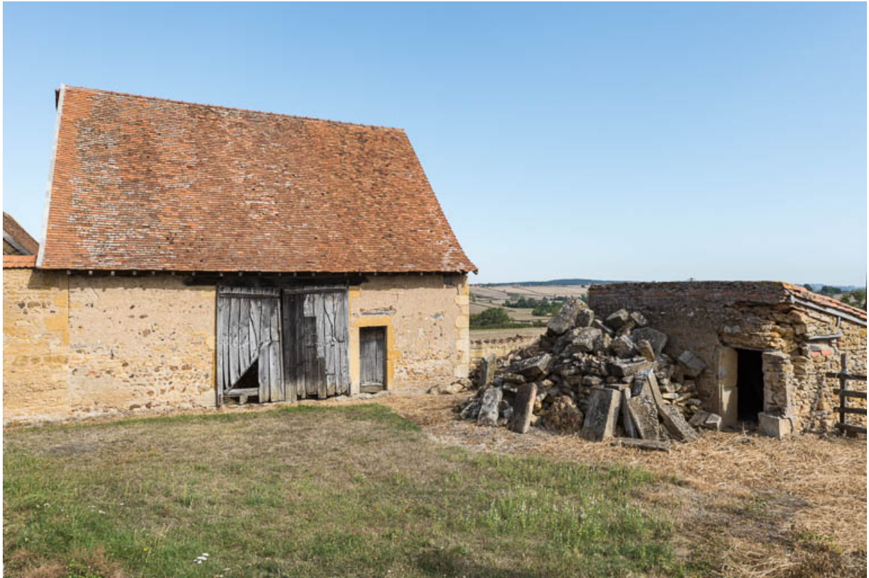
Seconde aile des dépendances (façade antérieure, orientée au sud). A droite, les soues à cochons (XIXe siècle) partiellement démolies.