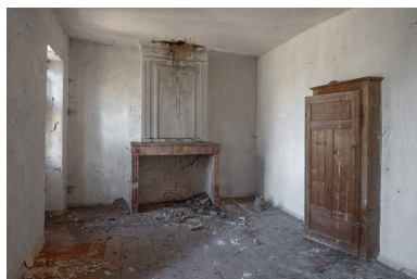
Vue d'une ancienne chambre de la demeure