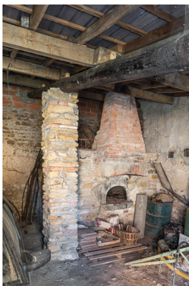
Four à pain du XIXe siècle, contre la façade nord-est de la demeure IVR26_20197100333NUC4A