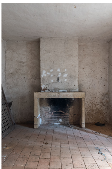
Une des anciennes chambres, à l'étage de la demeure IVR26_20197100322NUC4A