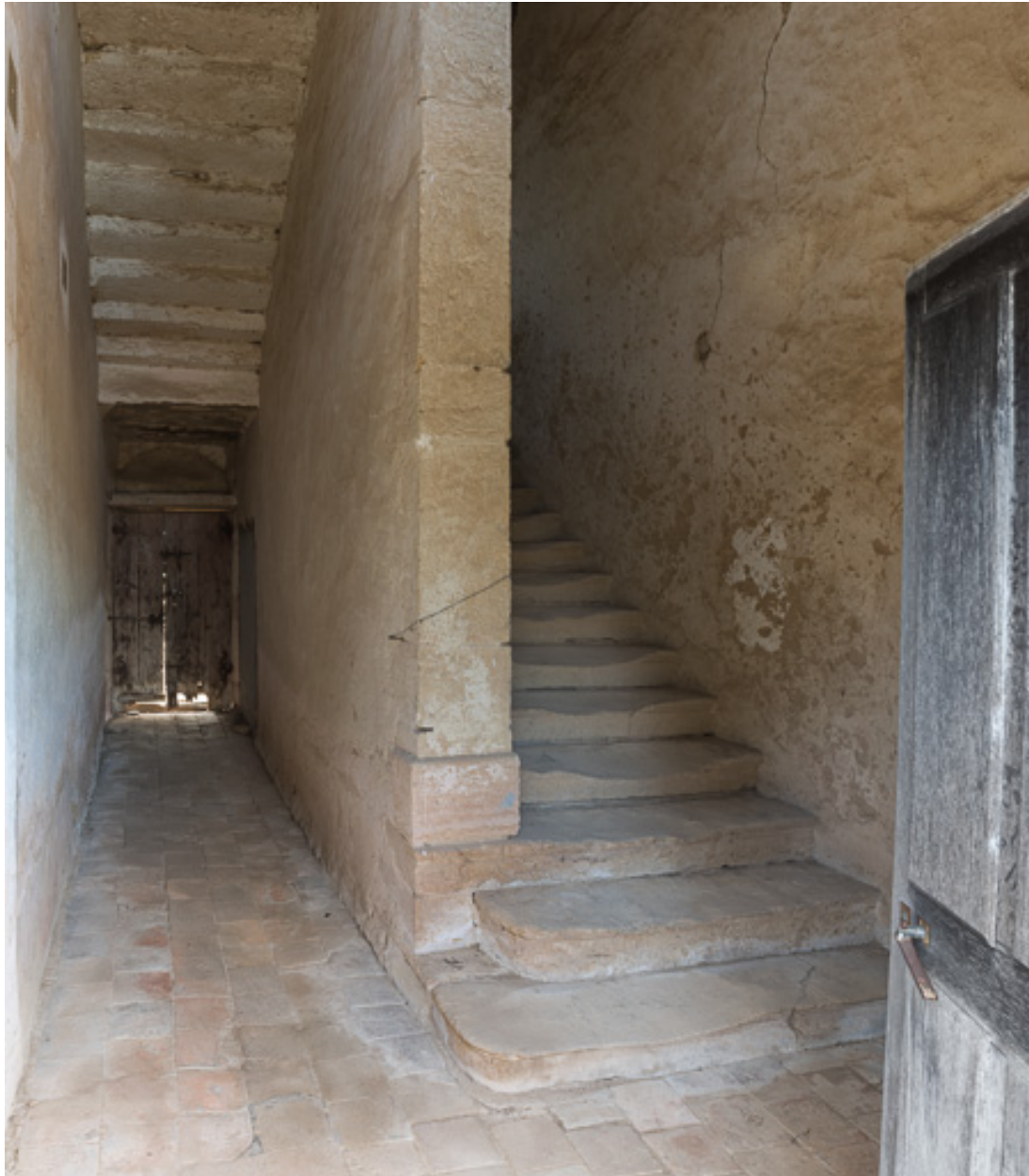
Vestibule et escalier