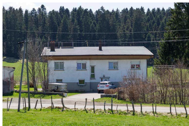
Façade antérieure.