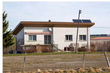
Façade postérieure.