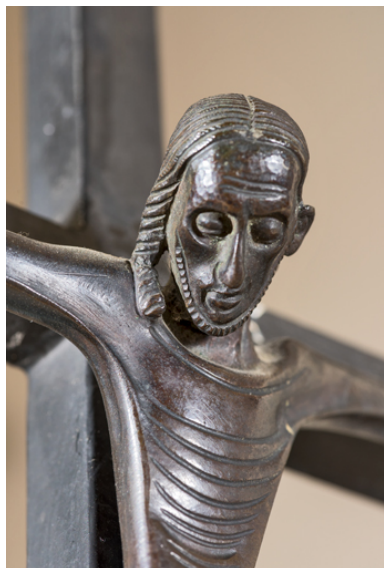
Visage du Christ.