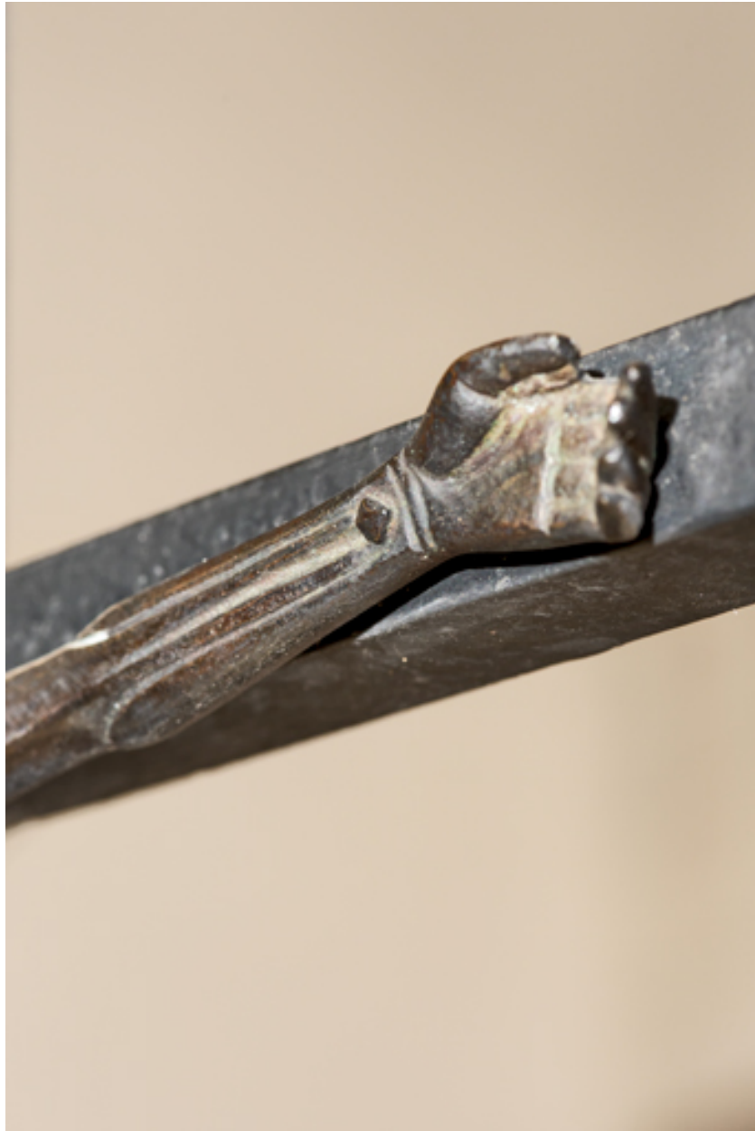
Détail de la main.