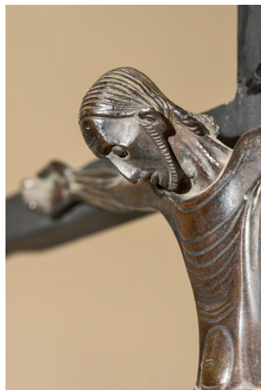
Détail du visage et du buste. Vue de trois quarts. IVR26_20238901219NUC4A