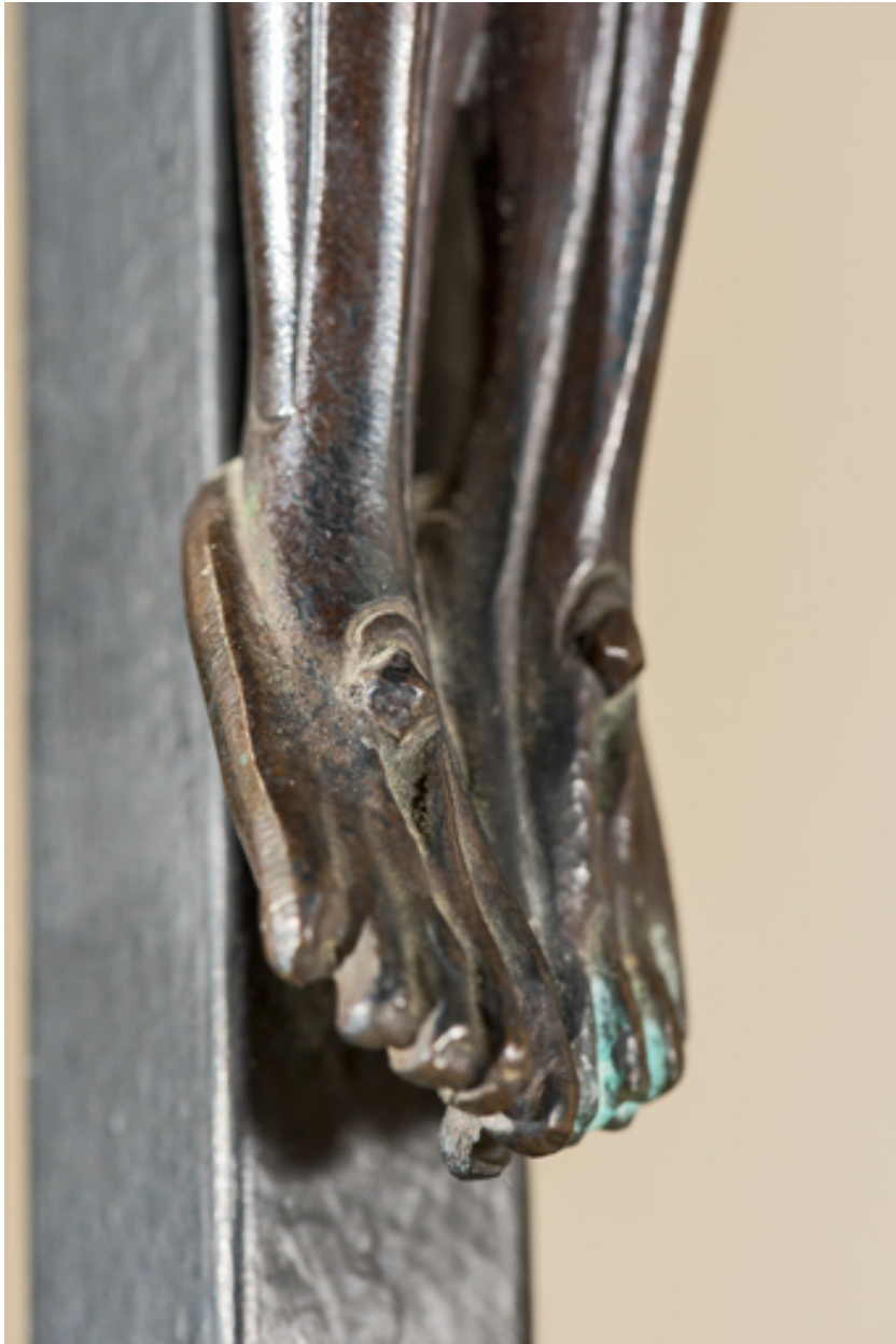
Détail des pieds.