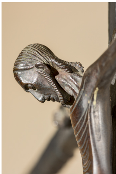
Visage du Christ. Vue latérale. IVR26_20238901218NUC4A