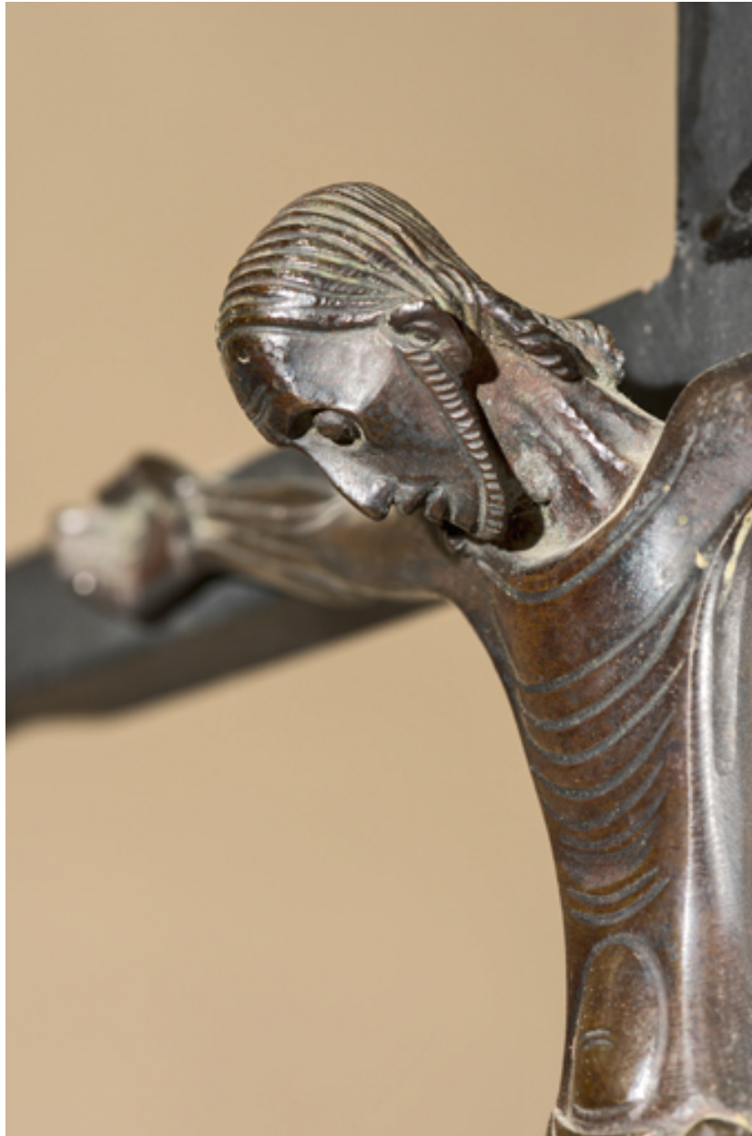
Détail du visage et du buste. Vue de trois quarts.