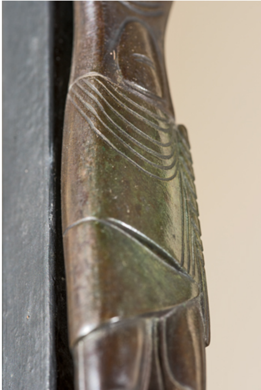
Détail du périzonium.