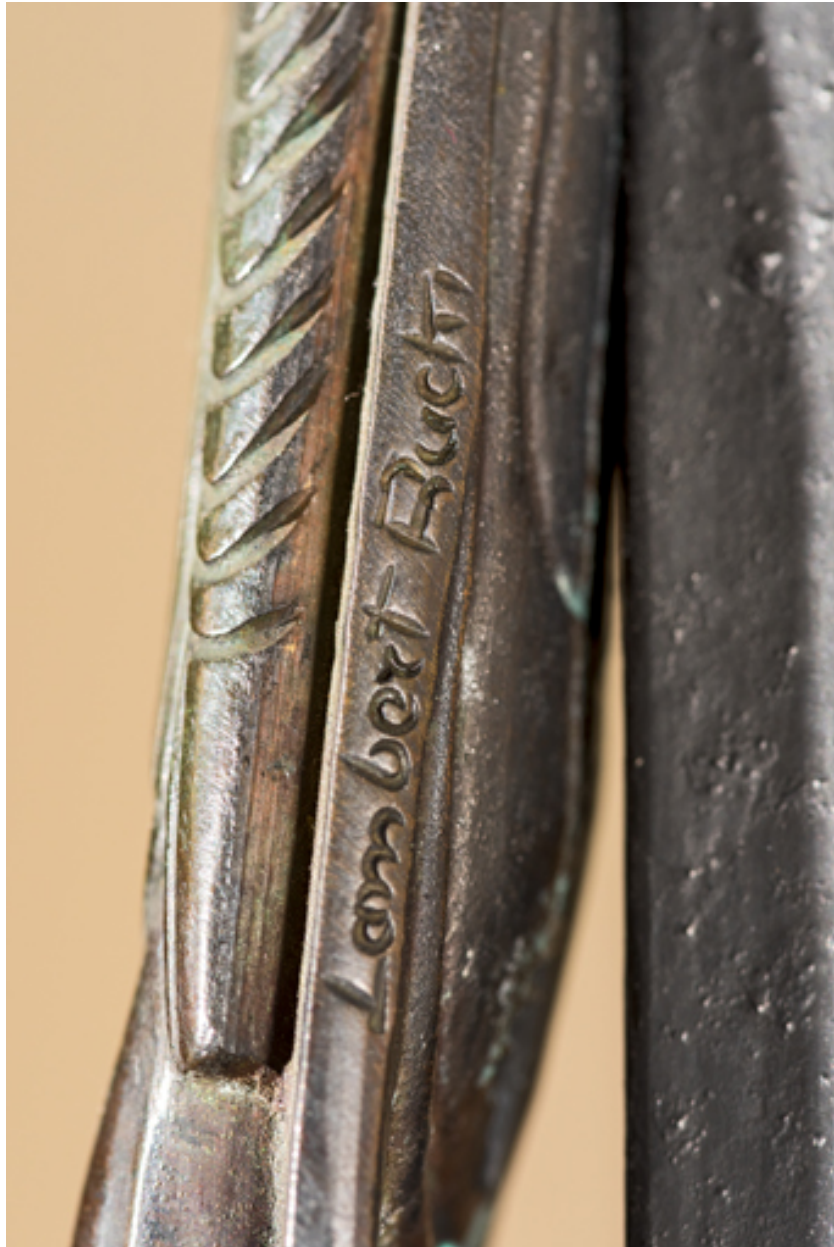
Détail de la signature.