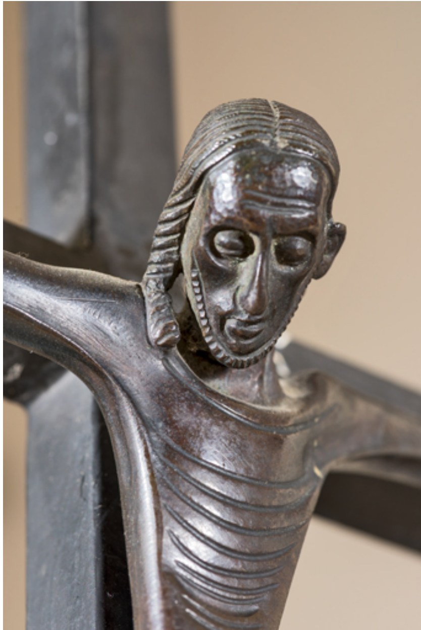
Visage du Christ.