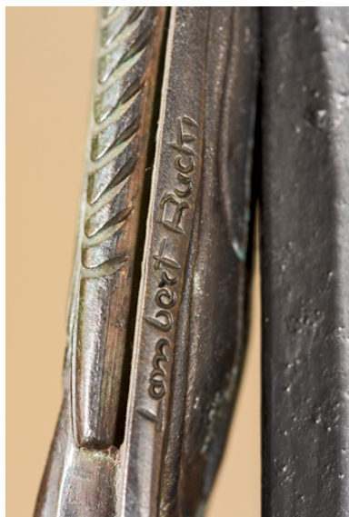
Détail de la signature. IVR26_20238901217NUC4A