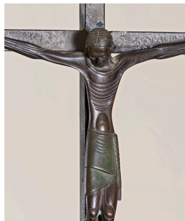
Christ sur la croix. Détail. IVR26_20238901210NUC2A