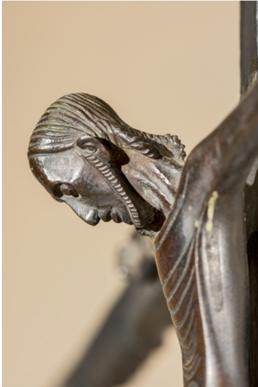
Visage du Christ. Vue latérale.