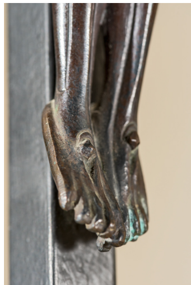
Détail des pieds. IVR26_20238901216NUC4A