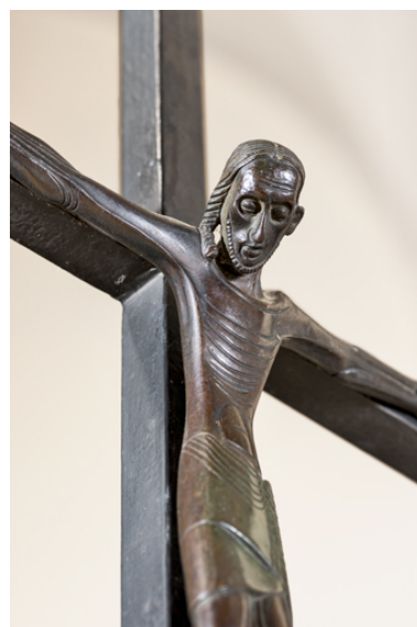
Christ sur la croix. Détail, de trois quarts.