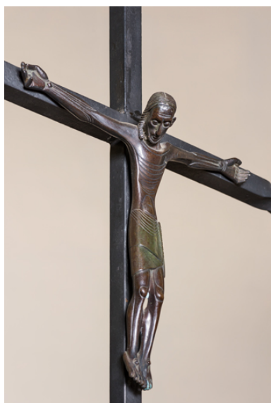
Christ sur la croix. Vue d'ensemble, de trois quarts. IVR26_20238901310NUC4A