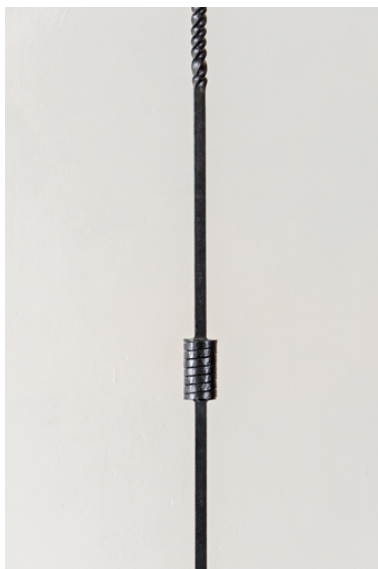
Croix. Détail. IVR26_20238901209NUC4A