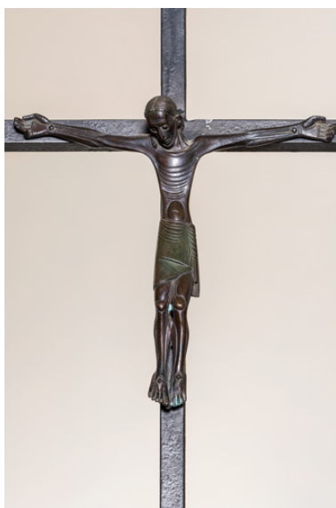
Christ sur la croix. Vue d'ensemble. IVR26_20238901211NUC4A