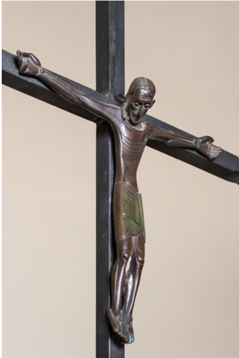
Christ sur la croix. Vue d'ensemble, de trois quarts.