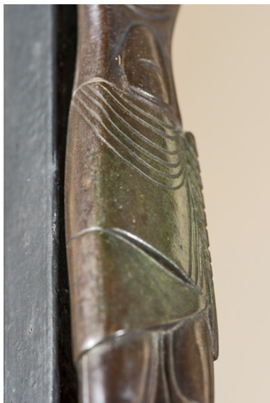
Détail du périzonium. IVR26_20238901215NUC4A