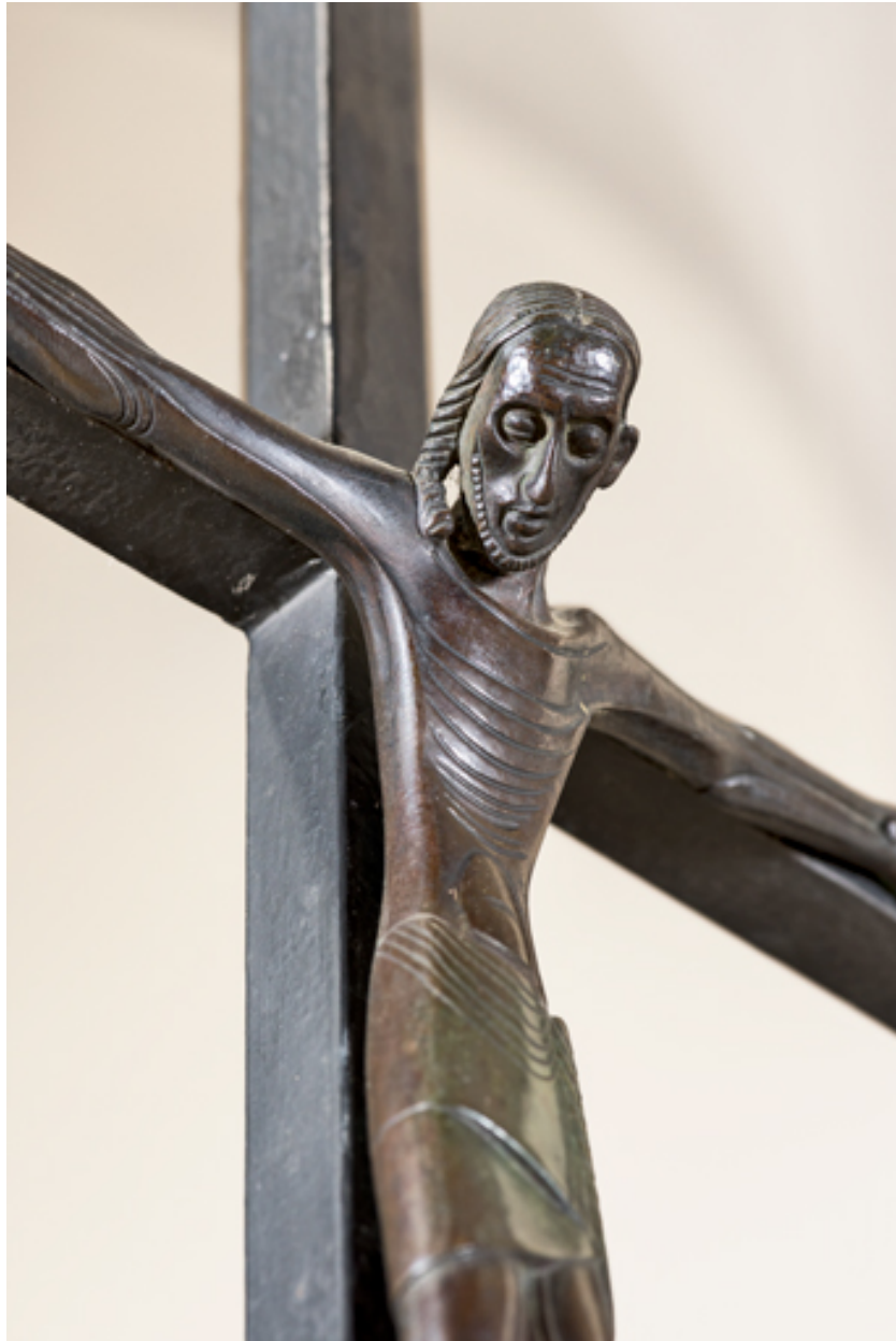
Christ sur la croix. Détail, de trois quarts.