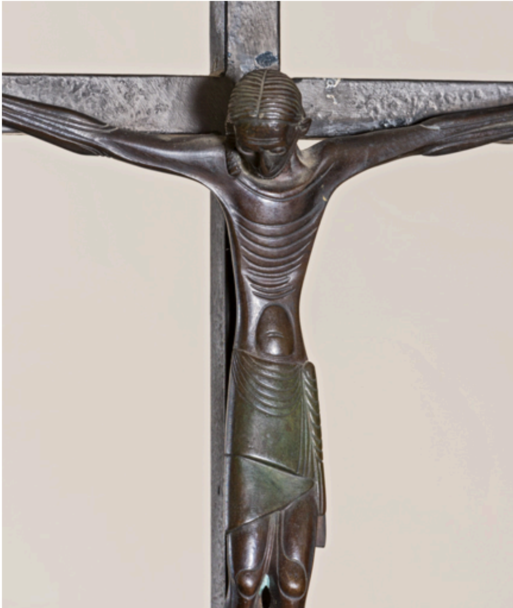
Christ sur la croix. Détail.