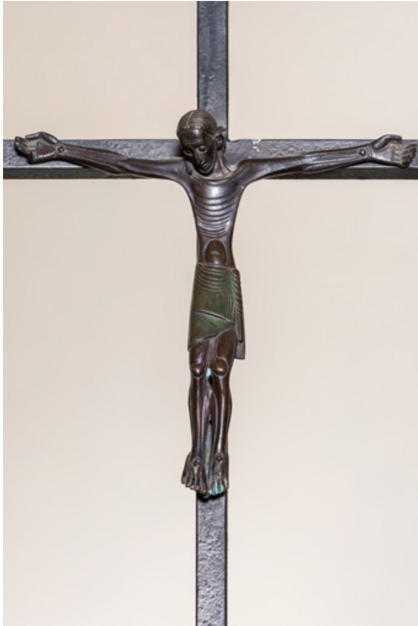
Christ sur la croix. Vue d'ensemble.