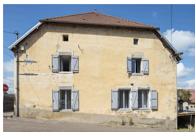
Mur pignon de la ferme, depuis la rue de la Pêcheurie. IVR43_20217000530NUC4A