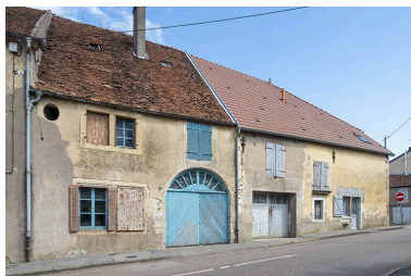
Trois quarts gauche de la ferme. IVR43_20217000527NUC4A