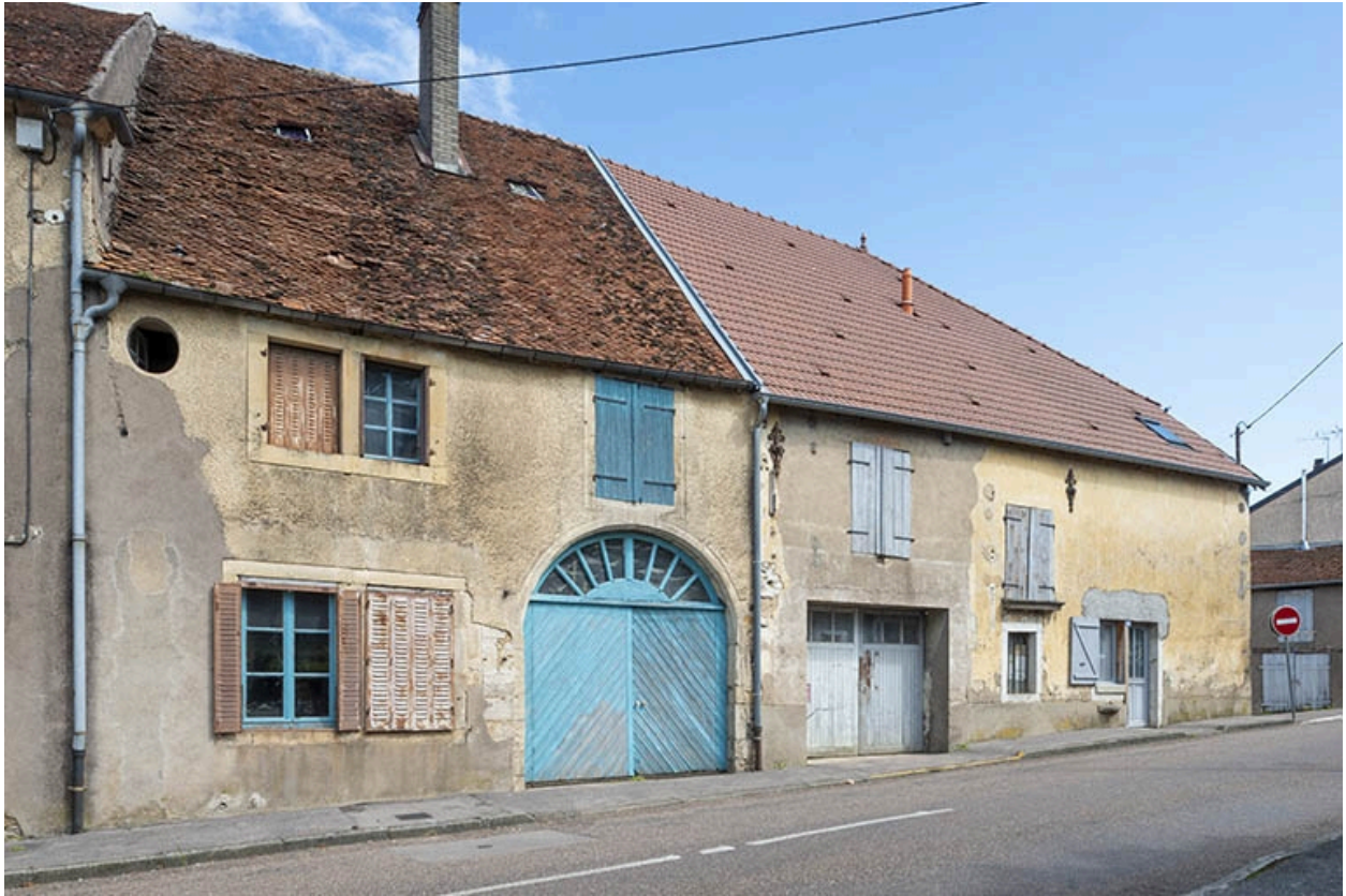
Trois quarts gauche de la ferme.