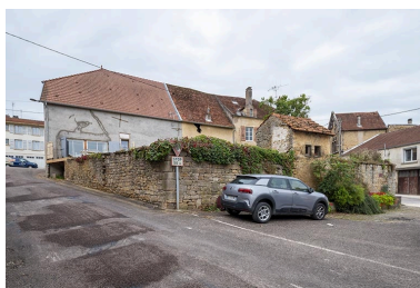
L'arrière de la ferme et le mur de soutènement du jardin. IVR43_20217000538NUC4A