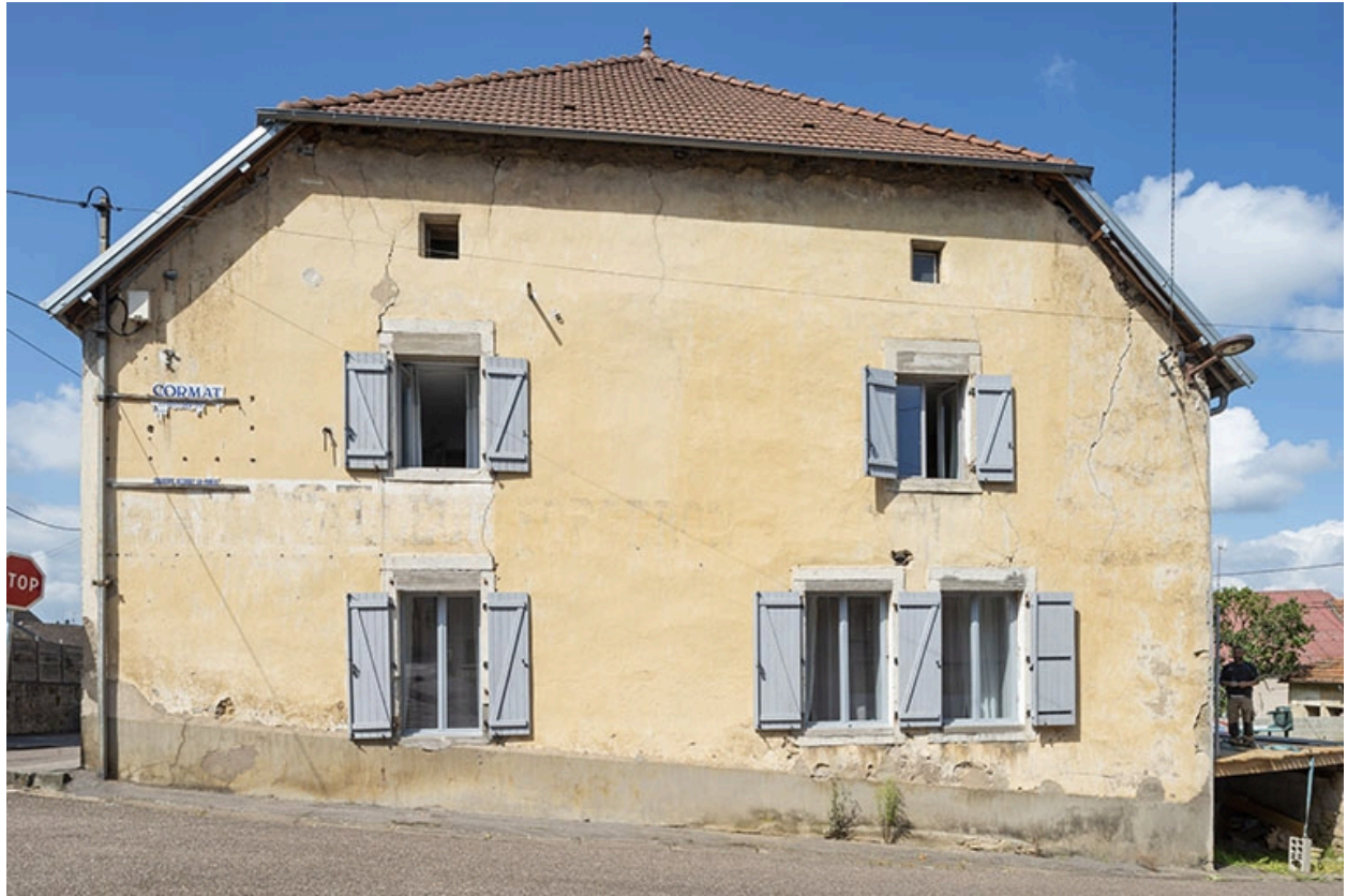
Mur pignon de la ferme, depuis la rue de la Pêcheurie.