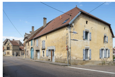
Trois quarts droit de la ferme.