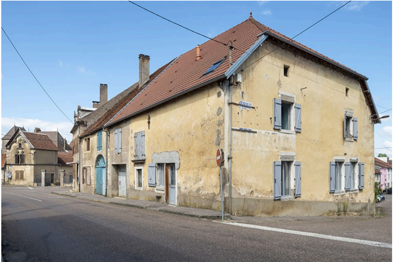
Trois quarts droit de la ferme.