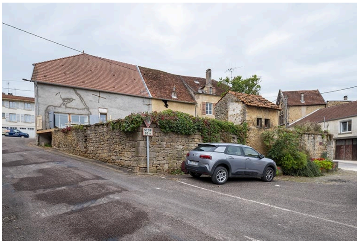
L'arrière de la ferme et le mur de soutènement du jardin.