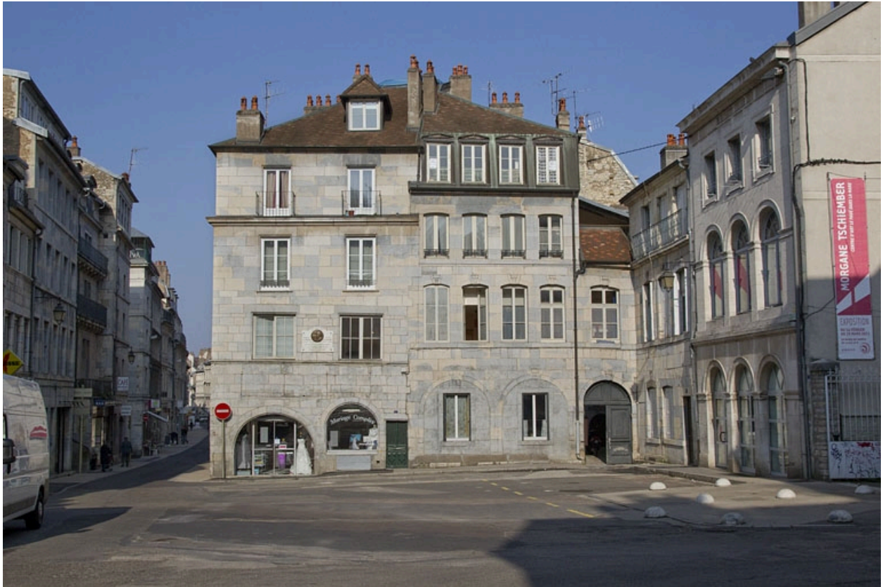
Vue d'ensemble depuis la place, de face.