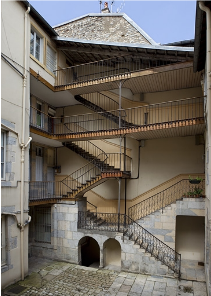
Vue d'ensemble de l'escalier à cage ouverte sur cour.