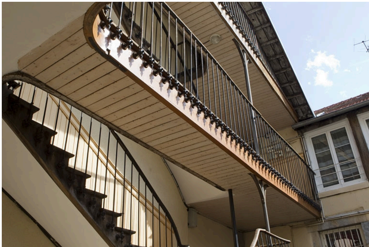
Escalier à cage ouverte sur cour : détail de la partie supérieure.