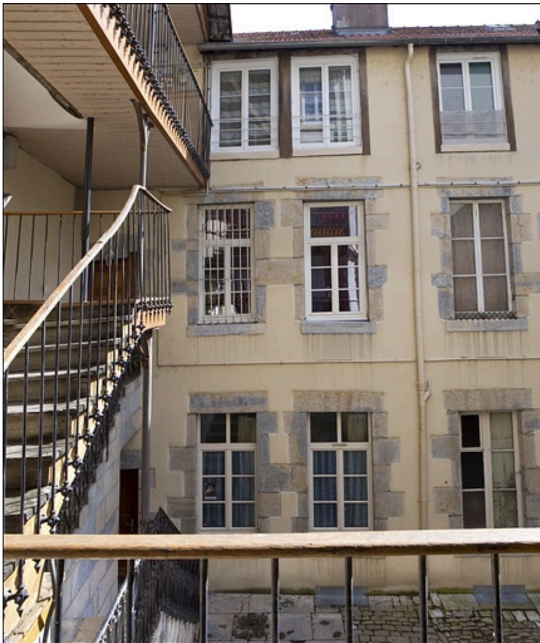
Vue d'ensemble de la façade antérieure du logis secondaire à droite de la première cour.