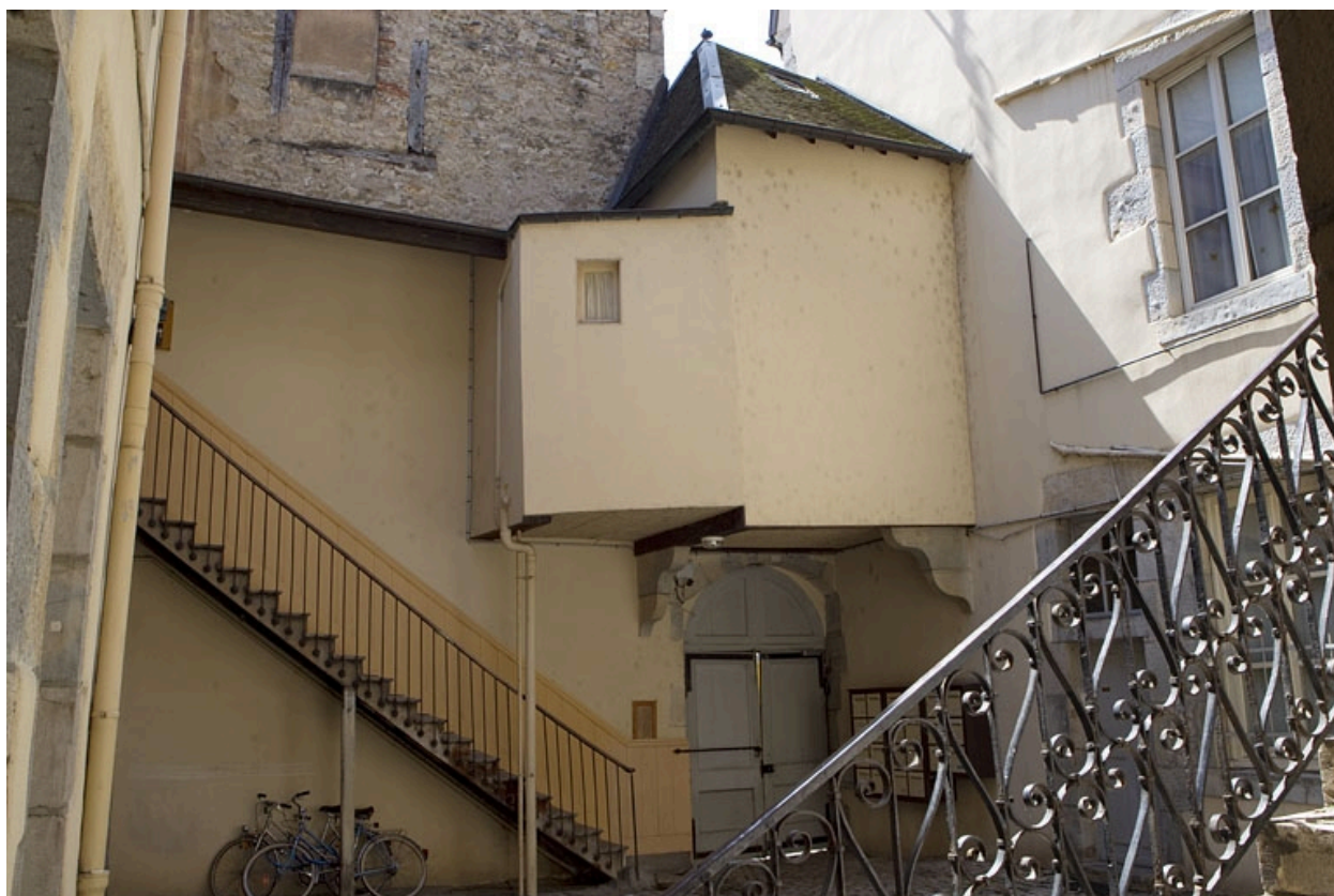
Vue d'ensemble de l'escalier extérieur secondaire situé dans la première cour.