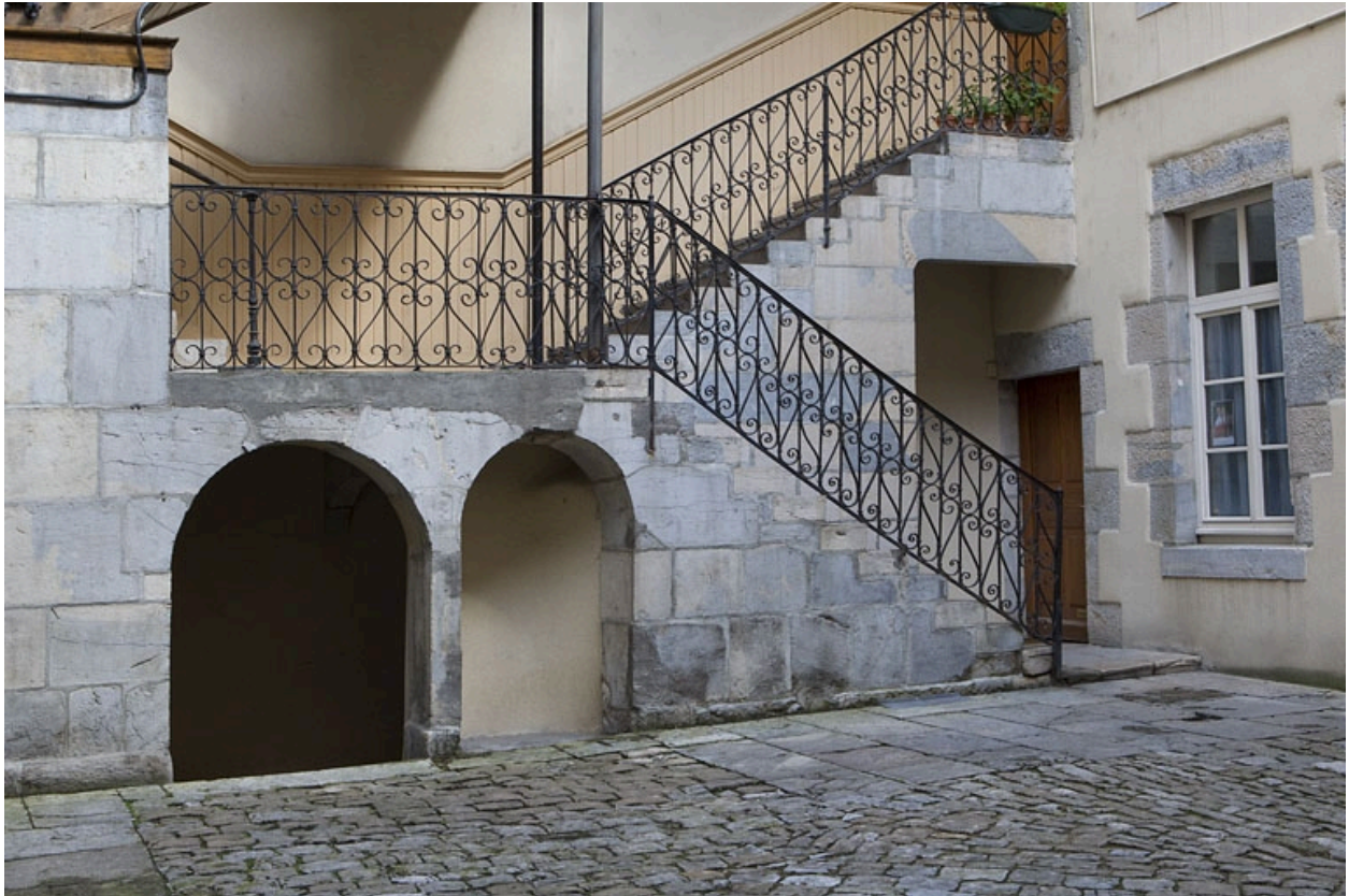
Escalier à cage ouverte sur cour : détail des deux premières volées.