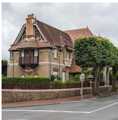
Vue actuelle. IVR26_20217100229NUC2A