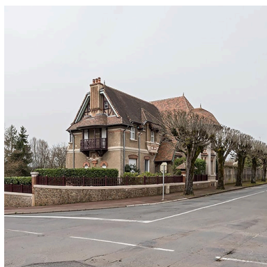
Vue actuelle.