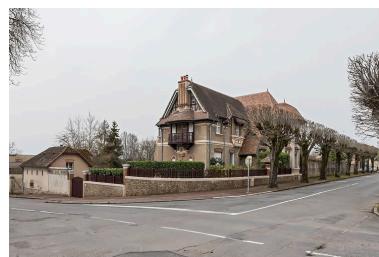
Vue actuelle. IVR26_20227100008NUC4A