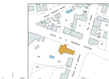
Plan-masse et de situation, extrait du plan cadastral (2023). IVR26_20237100006NUDA