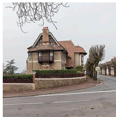
Vue actuelle. IVR26_20227100007NUC2A