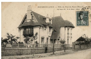
Vue ancienne. IVR26_20207100071NUC4A