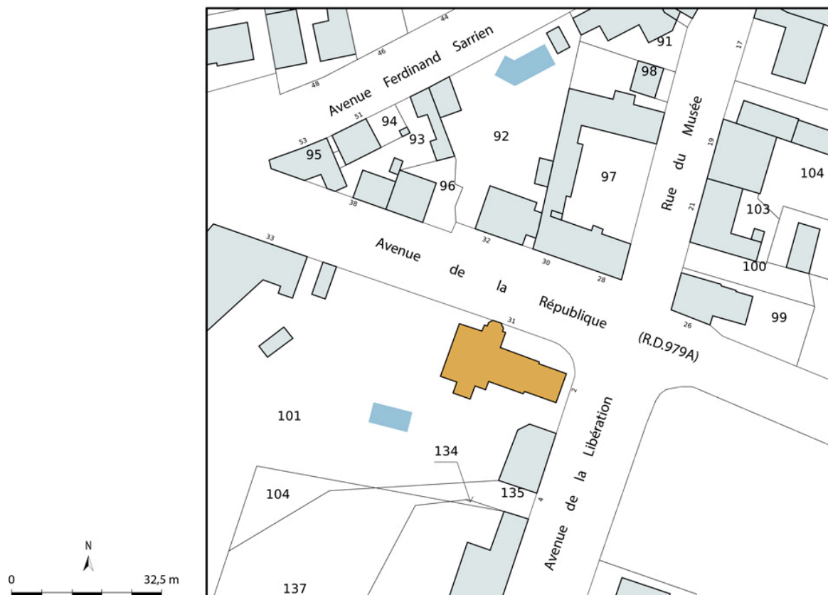
Plan-masse et de situation, extrait du plan cadastral (2023).