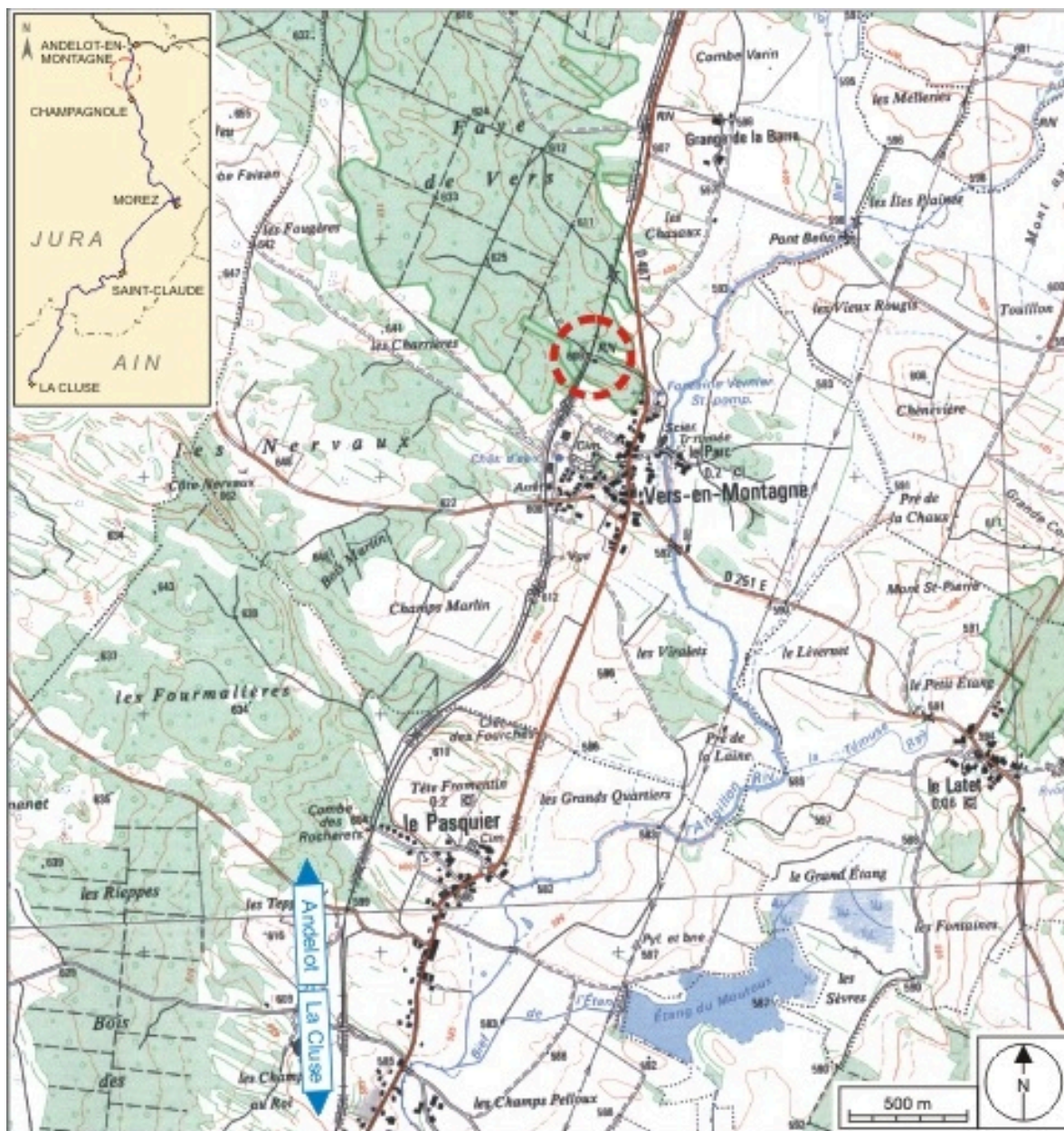
Carte et schéma de localisation. Carte topographique, IGN, 2000, dalle F087_047, échelle 1:25 000. Scan 25, licence n° 2008/CISE/2968.