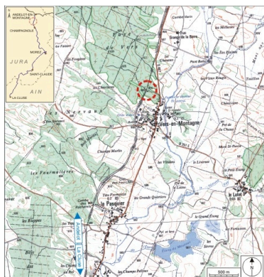
Carte et schéma de localisation. Carte topographique, IGN, 2000, dalle F087_047, échelle 1:25 000. Scan 25, licence n° 2008/CISE/2968. IVR43_20073900411NUDA