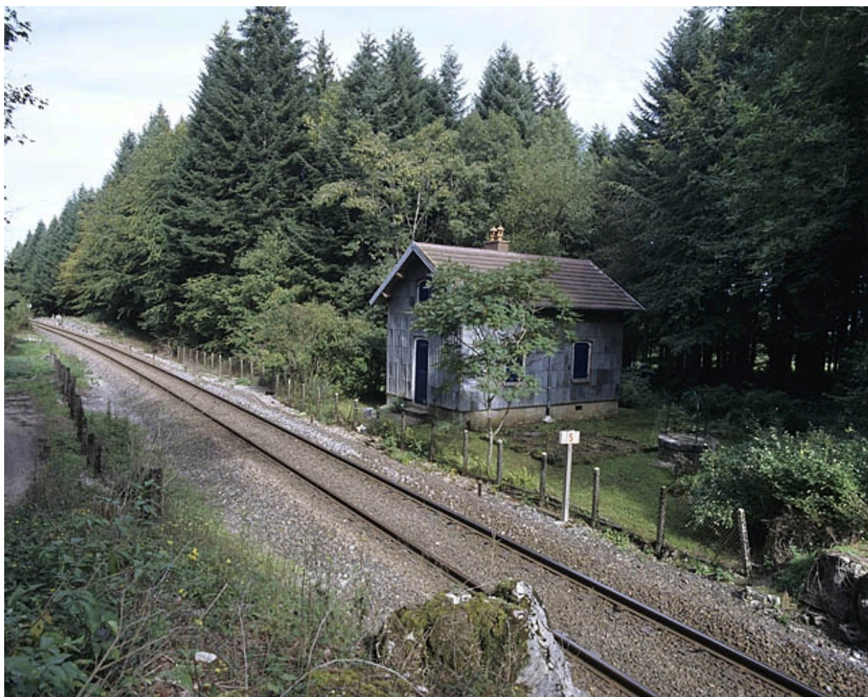
Vue d'ensemble, depuis le sud-ouest.