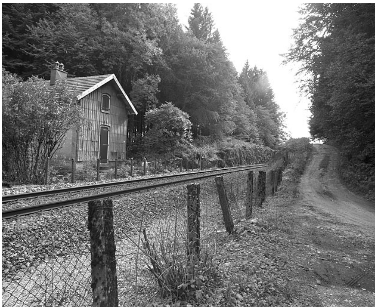
Vue d'ensemble, depuis le nord.