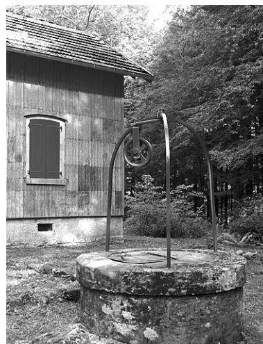
Puits. IVR43_20043900113X