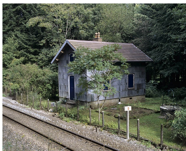
Façades antérieure et latérale droite. IVR43_20043900111XA