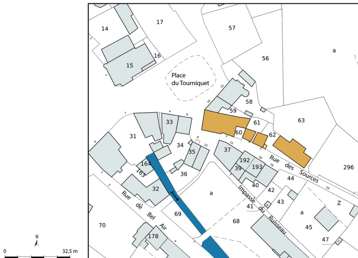
Plan-masse et de situation, extrait du plan cadastral (2023).