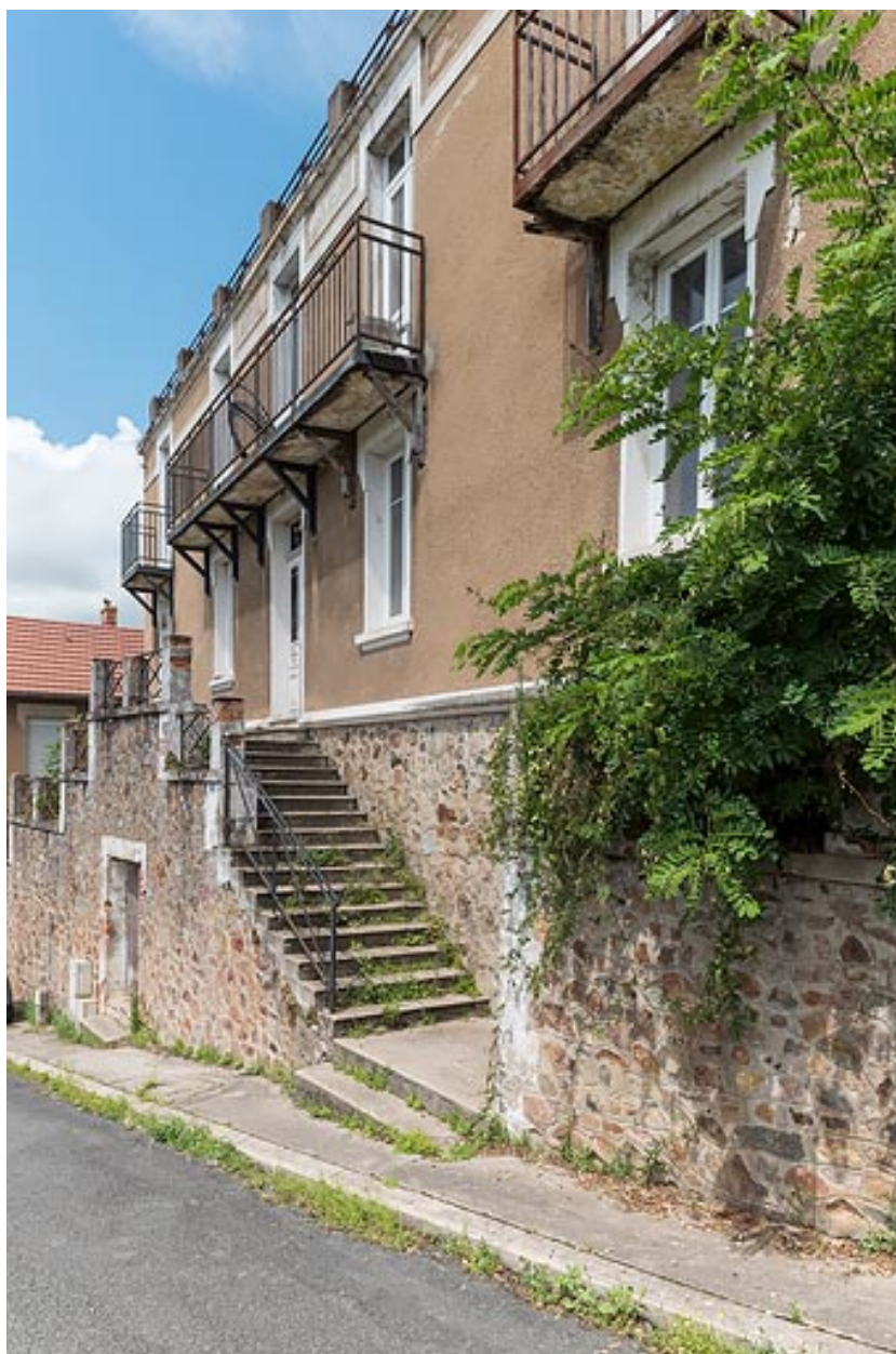
Façade de l'extension ("annexe").