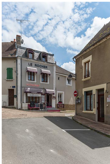
Façade de la maison sur la place du Tourniquet.