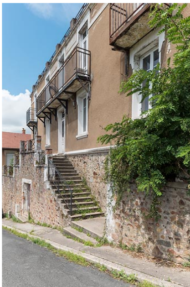
Façade de l'extension ("annexe").