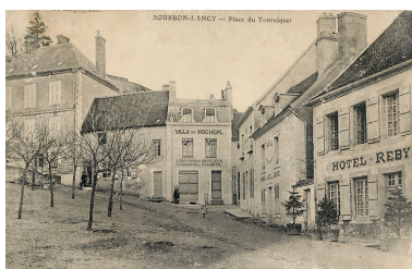
Façade de la maison sur la place du Tourniquet.