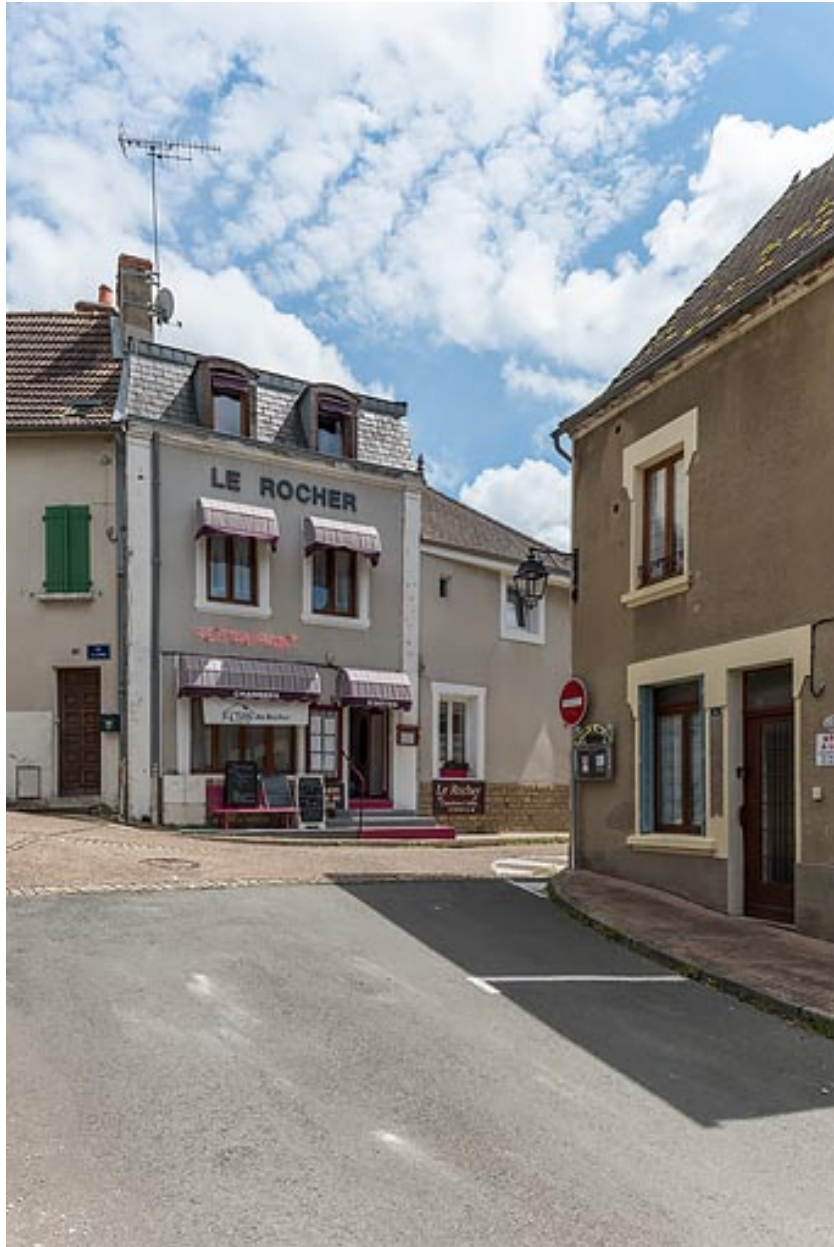
Façade de la maison sur la place du Tourniquet.