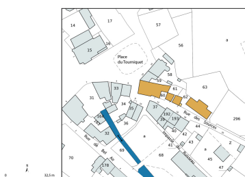
Plan-masse et de situation, extrait du plan cadastral (2023). IVR26_20237100013NUDA