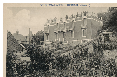
Façade de l'extension ("annexe"). IVR26_20207100070NUC4A