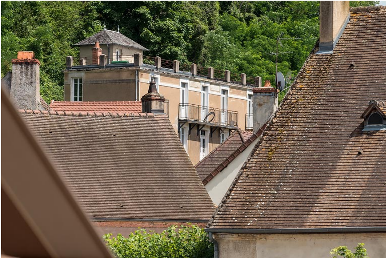
Façade de l'extension ("annexe").