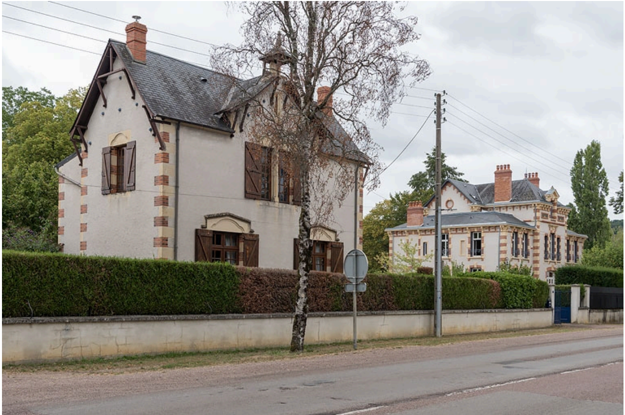
Vue de trois quarts, depuis l'avenue.