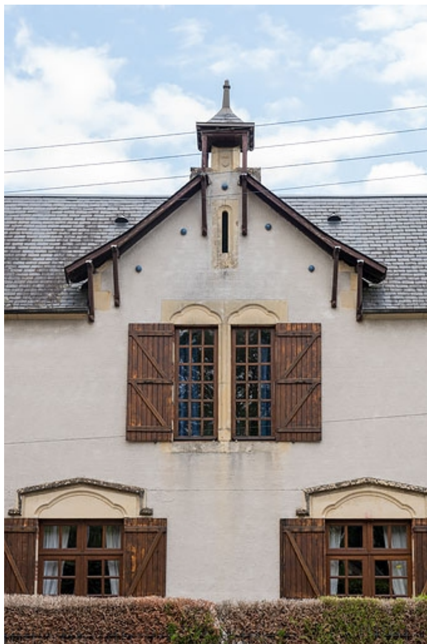
Pignon de la façade principale.