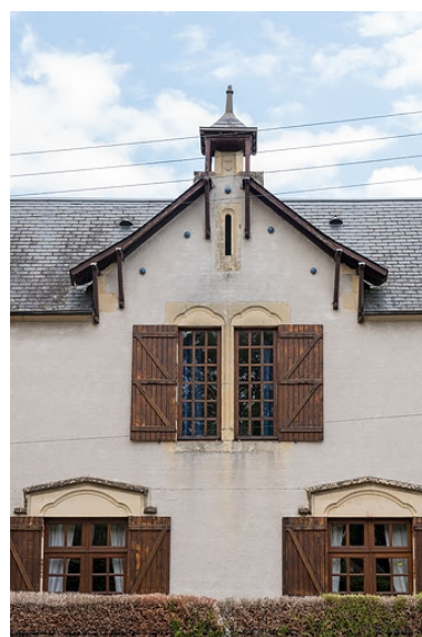
Pignon de la façade principale.