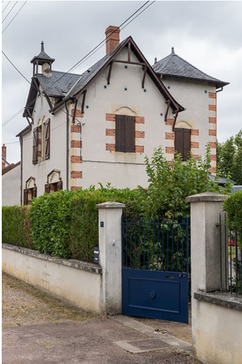
Vue de trois quarts, depuis l'avenue.