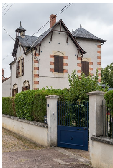
Vue de trois quarts, depuis l'avenue.