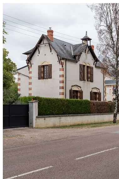
Vue de trois quarts, depuis l'avenue. IVR26_20205800464NUC4A