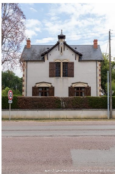
Vue de face, depuis l'avenue.