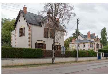
Vue de trois quarts, depuis l'avenue. IVR26_20205800465NUC4A