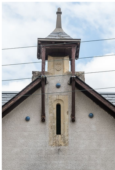
Armoires de la famille de Montlouis ("D'azur, à trois chevrons d'or, accompagné de trois fleurs- de-lis du même, rangées en chef") au sommet du pignon.