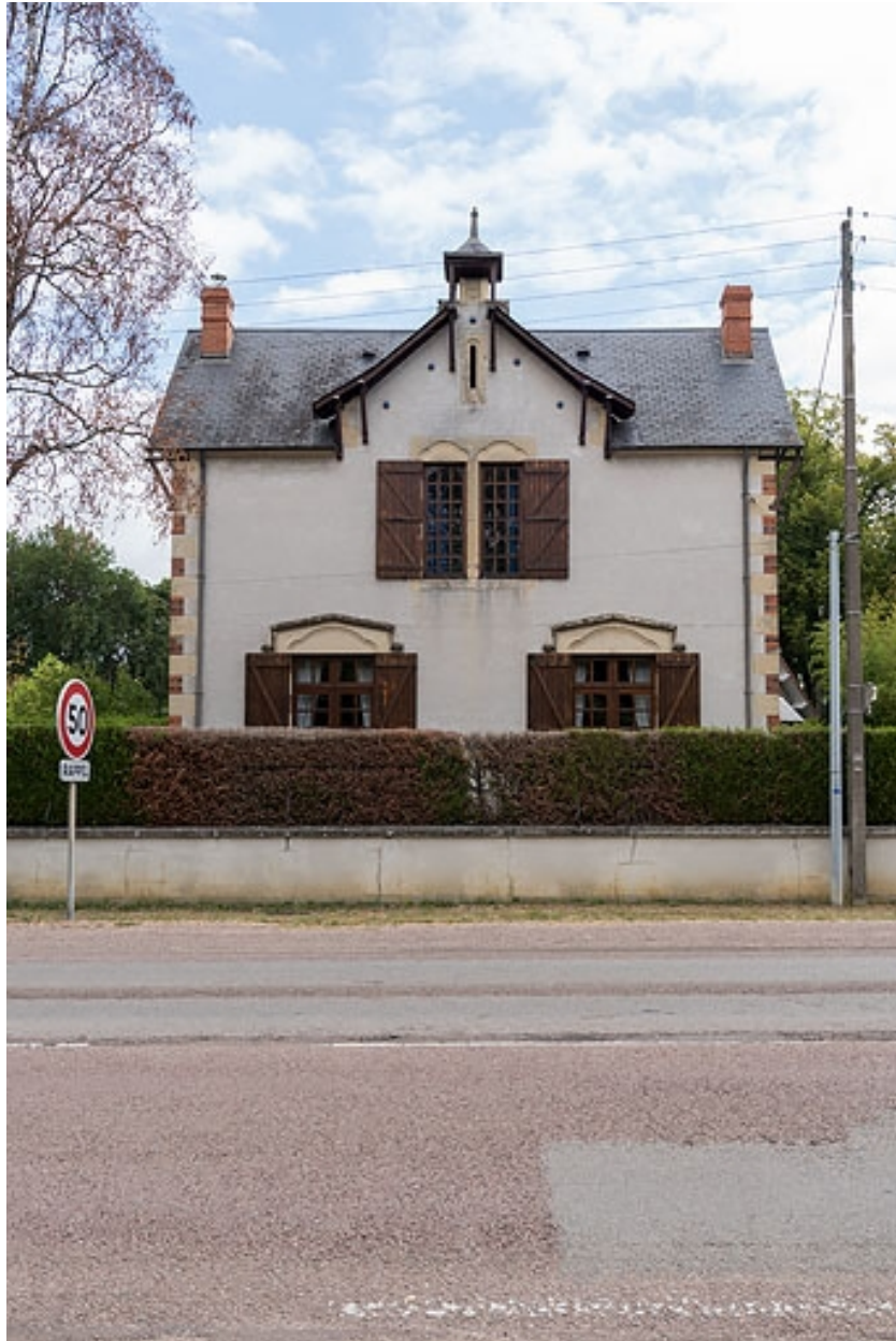
Vue de face, depuis l'avenue.