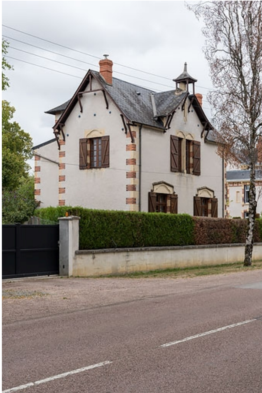
Vue de trois quarts, depuis l'avenue.