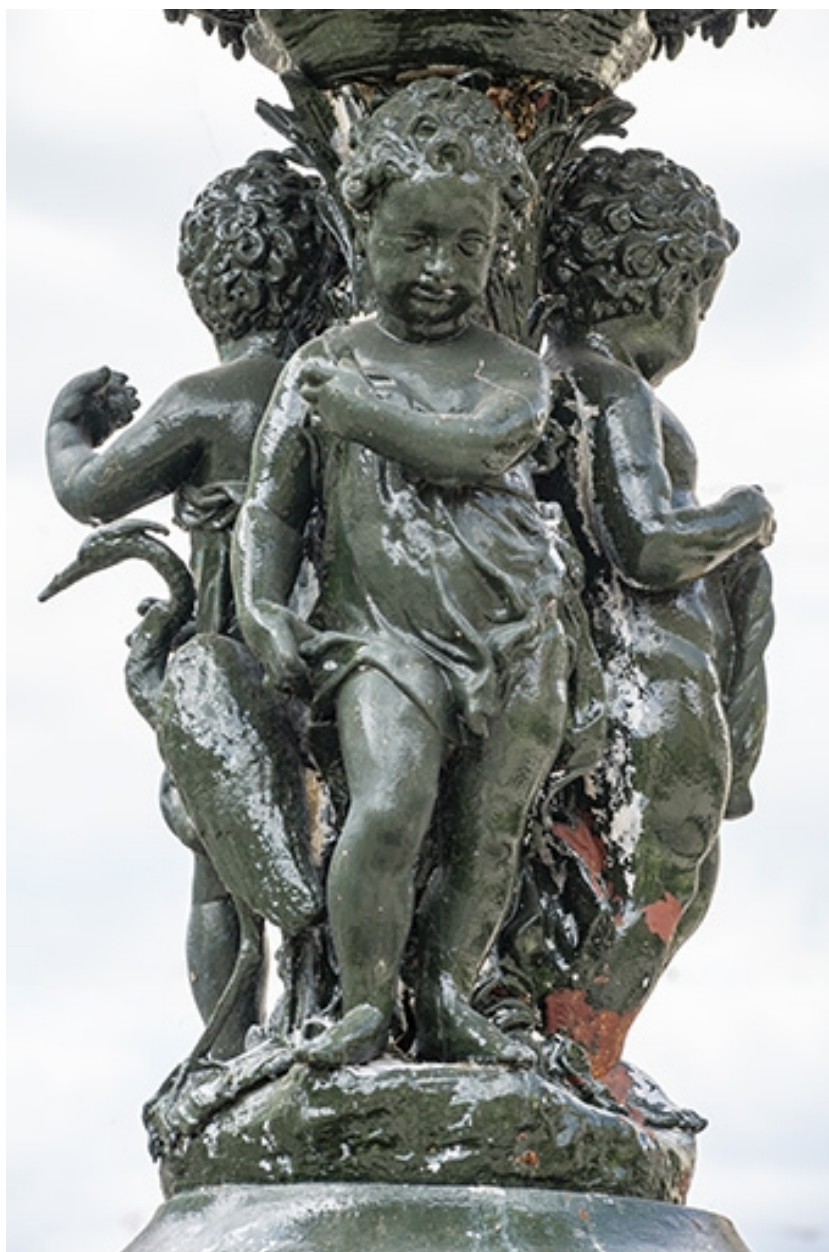
Détail des anges.