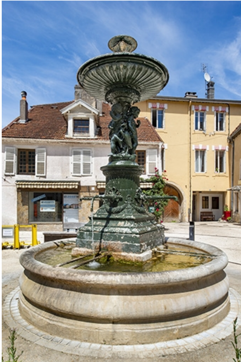
La fontaine, vue rapprochée.