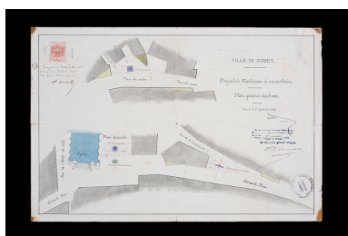
Plan projeté de l'adduction en eau des nouvelles fontaines de Jussey (l'ancienne fontaine des anges se trouve en haut), 1869.