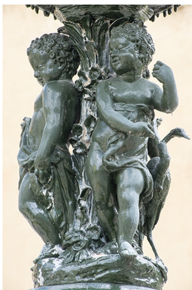
Détail des anges. IVR43_20217000624NUC4A