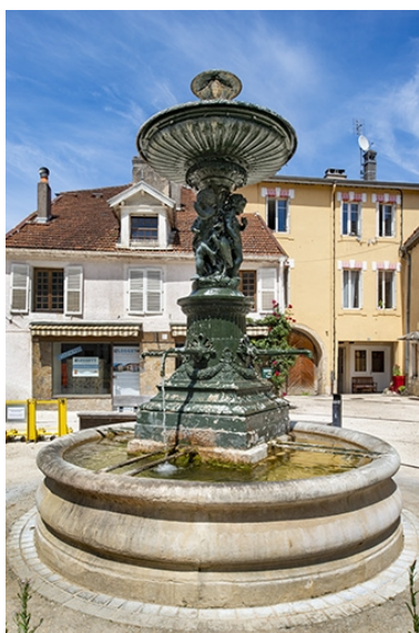
La fontaine, vue rapprochée.