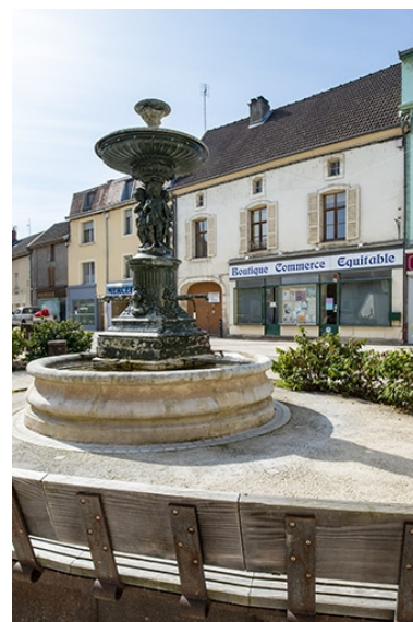
La fontaine et les façades opposées de la rue Gambetta.