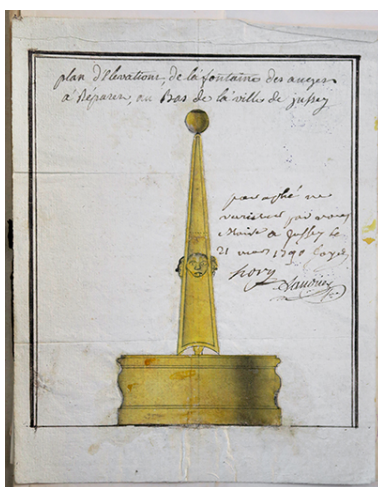
La fontaine des anges (détruite) en 1790.