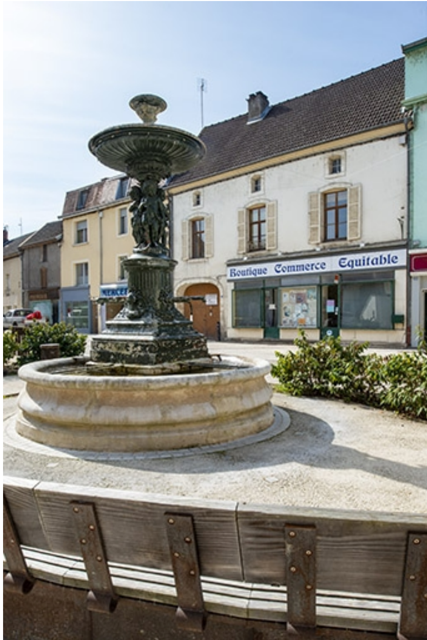
La fontaine et les façades opposées de la rue Gambetta.