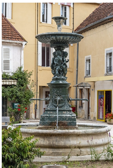
La fontaine et le bassin. IVR43_20217000626NUC4A