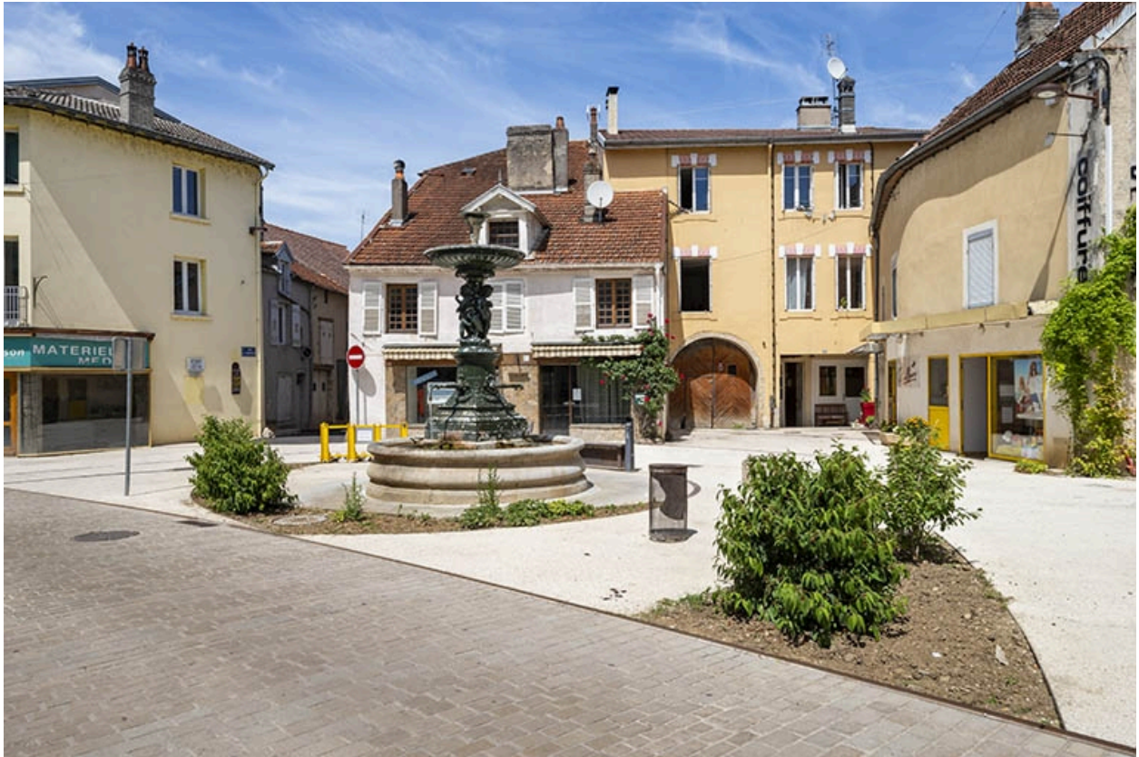
La fontaine dans son contexte.