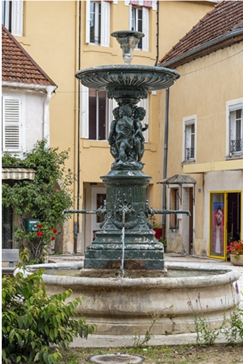
La fontaine et le bassin.