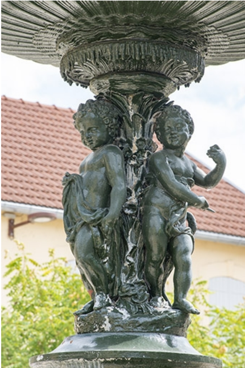
Détail des anges et de la partie inférieure de la vasque.