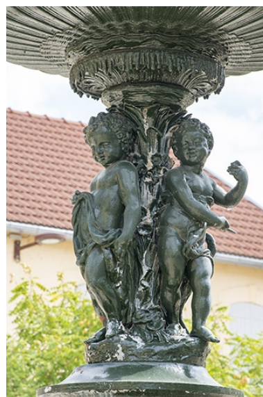
Détail des anges et de la partie inférieure de la vasque.