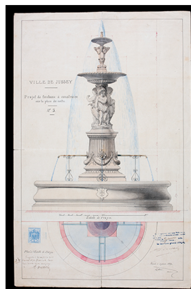
Projet pour l'élévation et le plan de la fontaine, 1869.