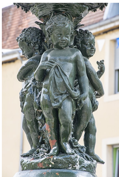
Détail des anges. IVR43_20217000623NUC4A