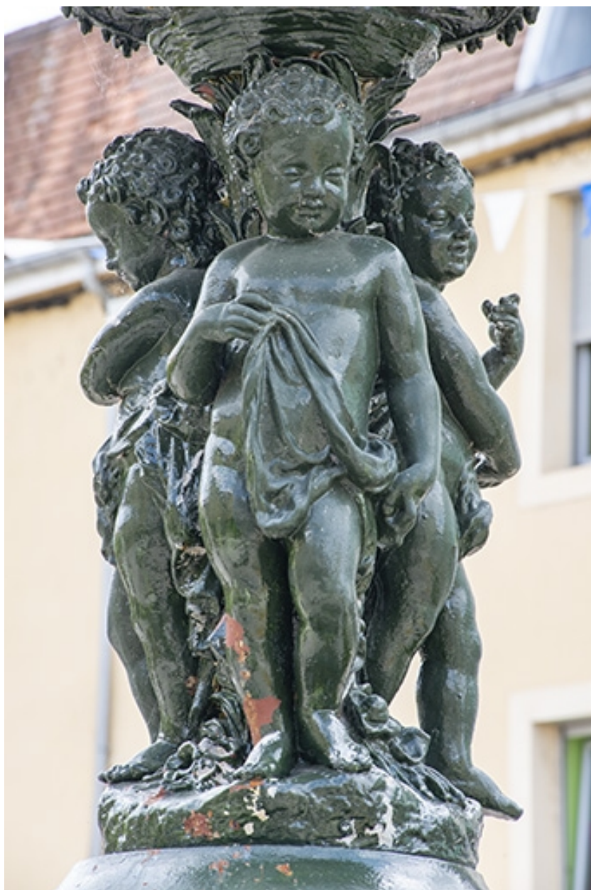
Détail des anges.