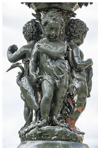
Détail des anges. IVR43_20217000622NUC4A