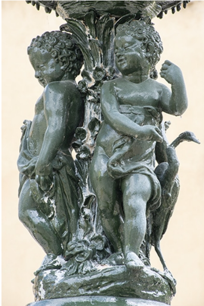
Détail des anges.