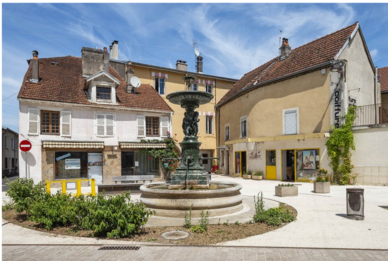
La fontaine et les façades de la rue Gambetta à l'arrière.