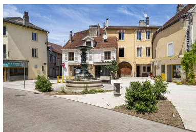
La fontaine dans son contexte.