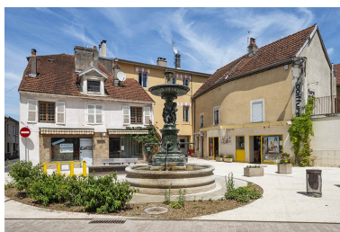
La fontaine et les façades de la rue Gambetta à l'arrière.