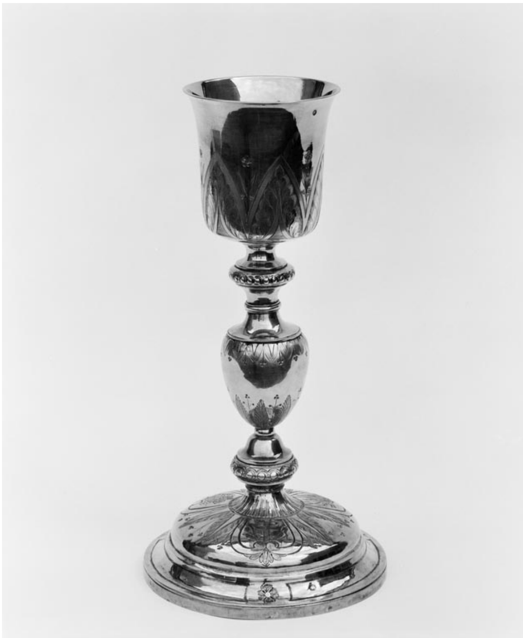
Vue d'ensemble du calice.