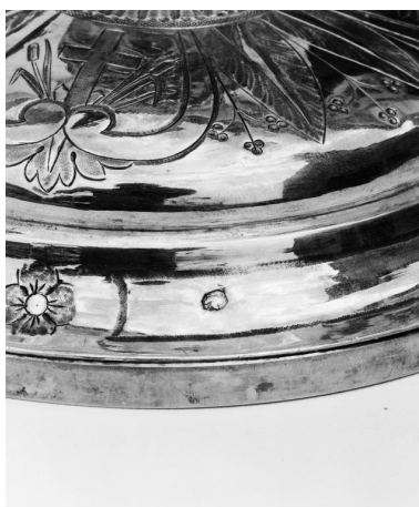
Détail du poinçon au pied du calice. IVR26_19792100767X