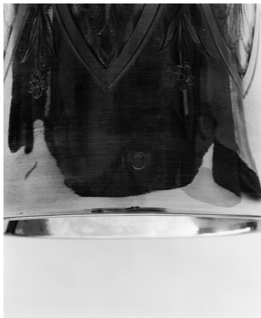
Détail du poinçon au bord de la coupe du calice.