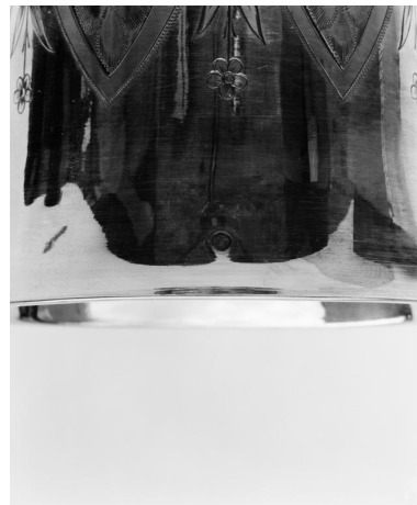
Détail du poinçon au bord de la coupe du calice.