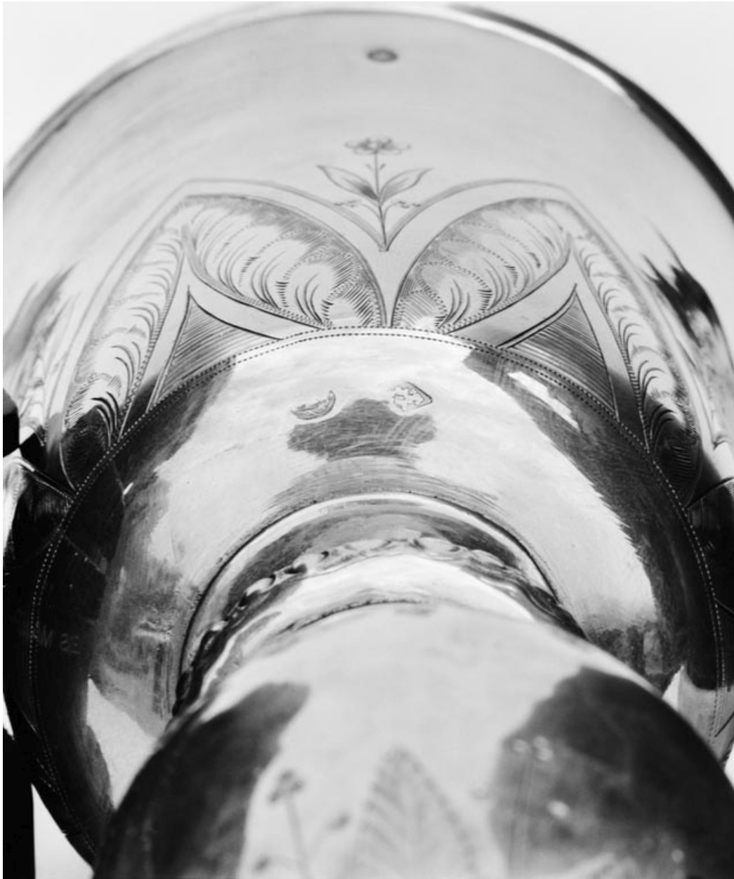
Détail du poinçon à la base de la coupe du calice.