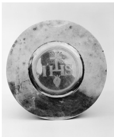
La patène.