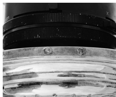
Détail de poinçons au bord du pied du calice. IVR26_19792100768X