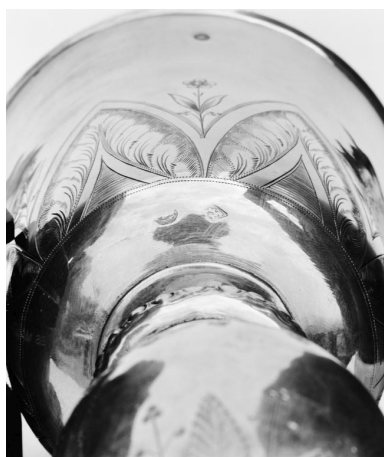
Détail du poinçon à la base de la coupe du calice.