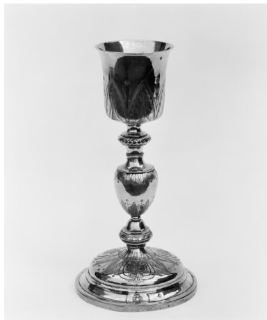
Vue d'ensemble du calice. IVR26_19792100762X