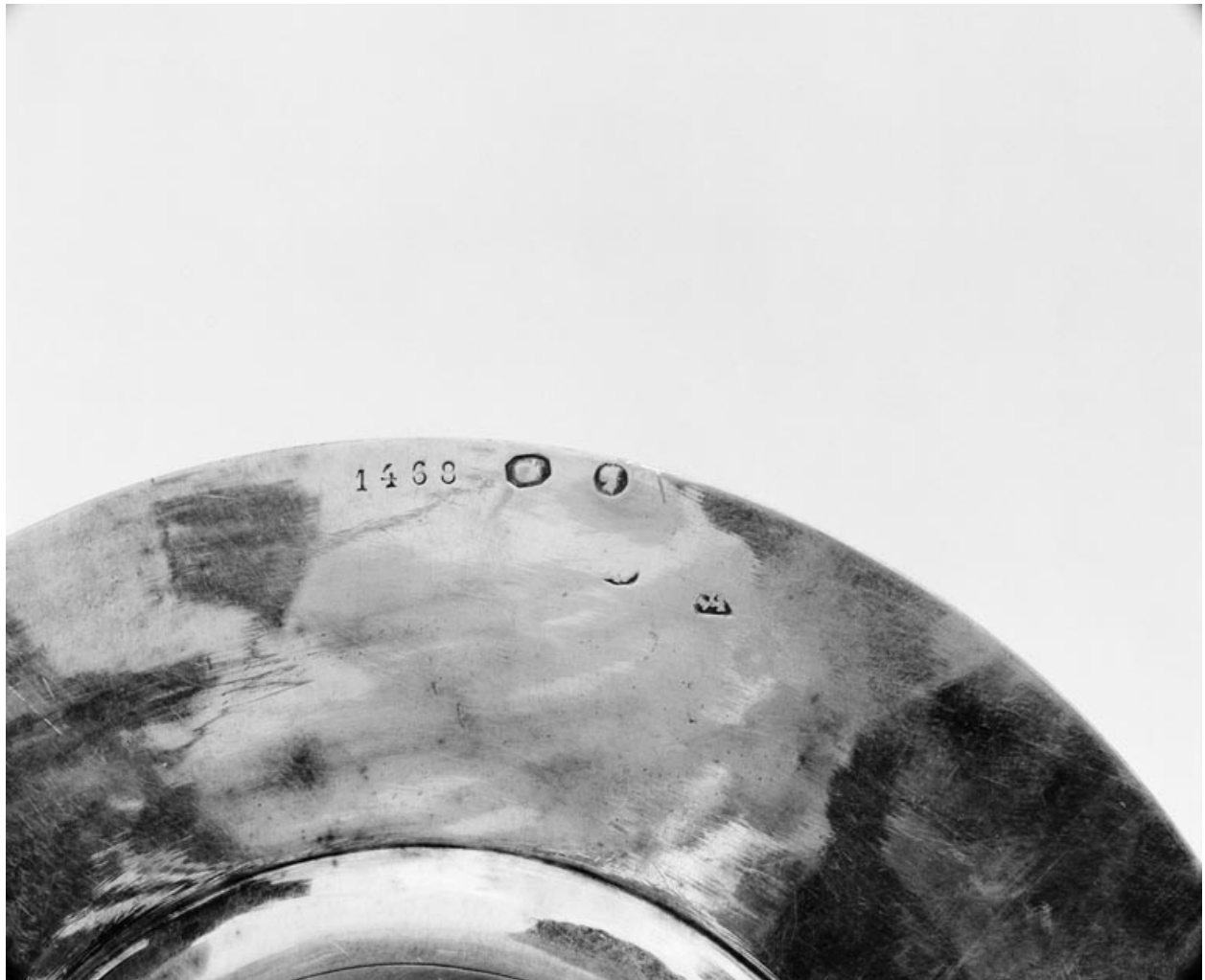
Détail des poinçons de la patène.