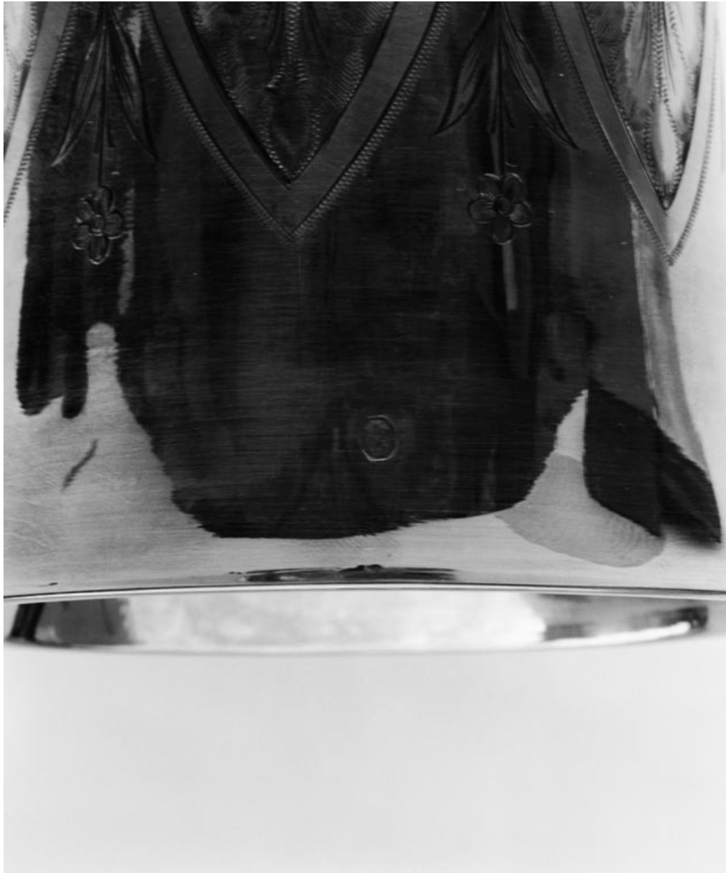
Détail du poinçon au bord de la coupe du calice.