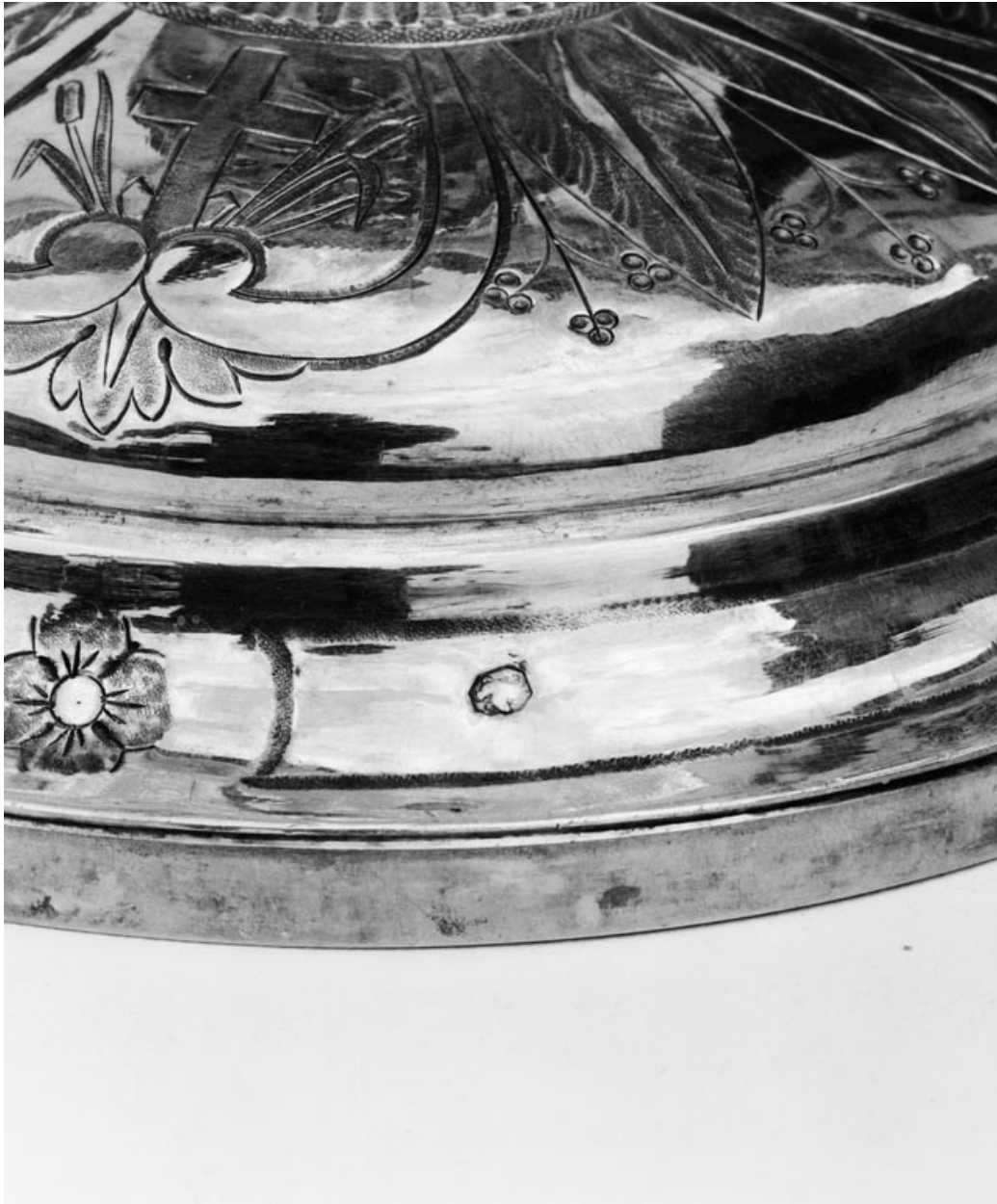
Détail du poinçon au pied du calice.