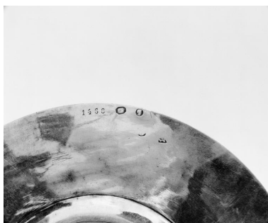
Détail des poinçons de la patène. IVR26_19792100769X