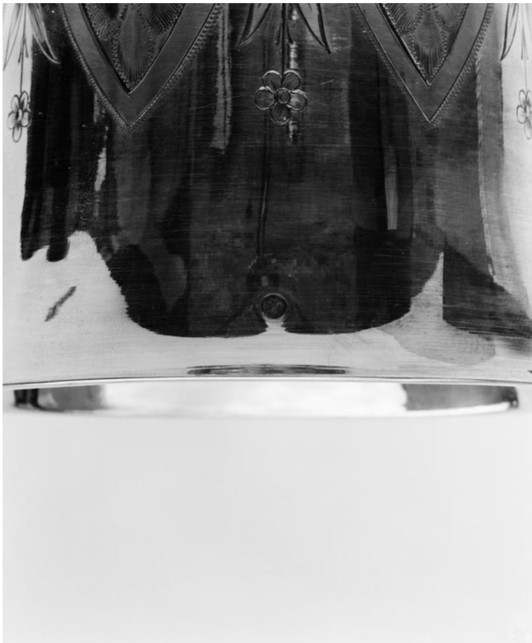
Détail du poinçon au bord de la coupe du calice.