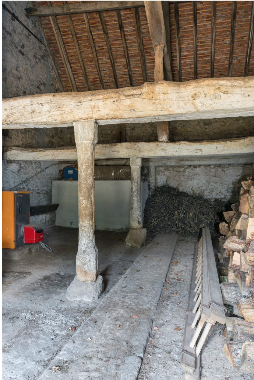
Vue intérieure de l'étable : poteaux sculptés.