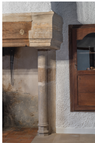
Vue rapprochée du piedroit droit de la cheminée du rez-de-chaussée. IVR26_20187100365NUC4A