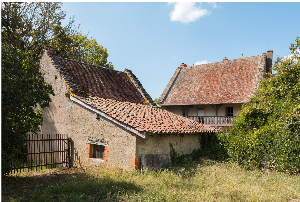
Vue de trois-quart sud-est de la dépendance agricole.