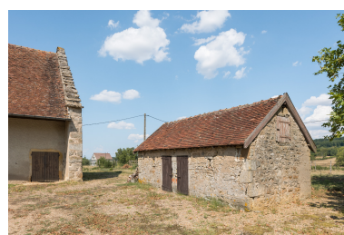
Vue de trois-quart sud-ouest de la dépendance est. (soue? poulailler?) IVR26_20187100383NUC4A