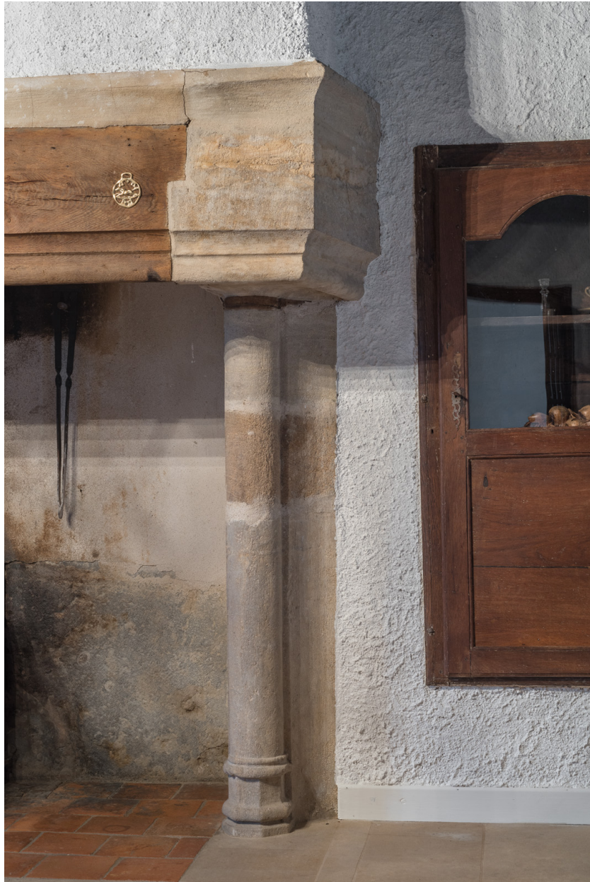
Vue rapprochée du piedroit droit de la cheminée du rez-de-chaussée.