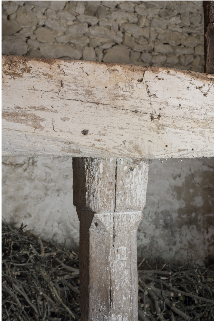
Vue rapprochée d'un assemblage poutre-poteau.