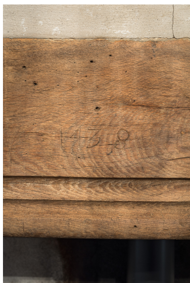
Date portée - 1438 - sur le couvrement de la cheminée du rez-de-chaussée.