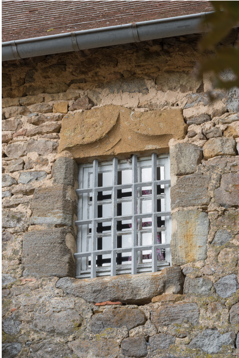
Détail de la baie ouest à l'étage de la façade postérieure.