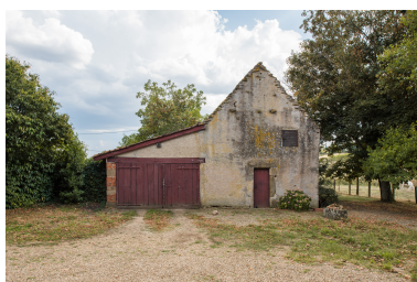
Vue de face de la façade antérieure - nord - des dépendances. IVR26_20187100376NUC4A