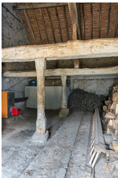
Vue intérieure de l'étable : poteaux sculptés. IVR26_20187100373NUC4A