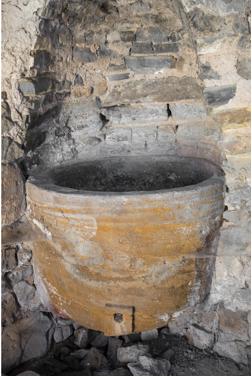
Vue rapprochée : cuve.