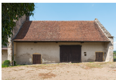
Vue de face de la façade antérieure de la partie agricole : grange et étables.