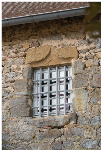
Détail de la baie ouest à l'étage de la façade postérieure. IVR26_20187100363NUC4A