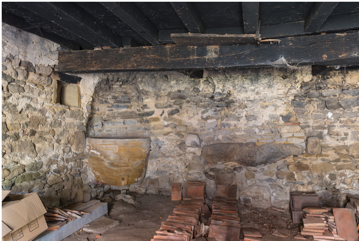
Vue intérieure de la dépendance. Face au mur postérieur sud.