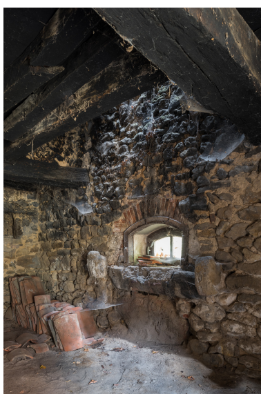
Vue intérieure du pignon ouest de la dépendance.