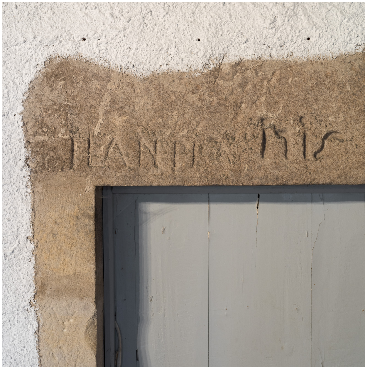
Vue rapprochée d'une inscription et d'une date portée sur un linteau.