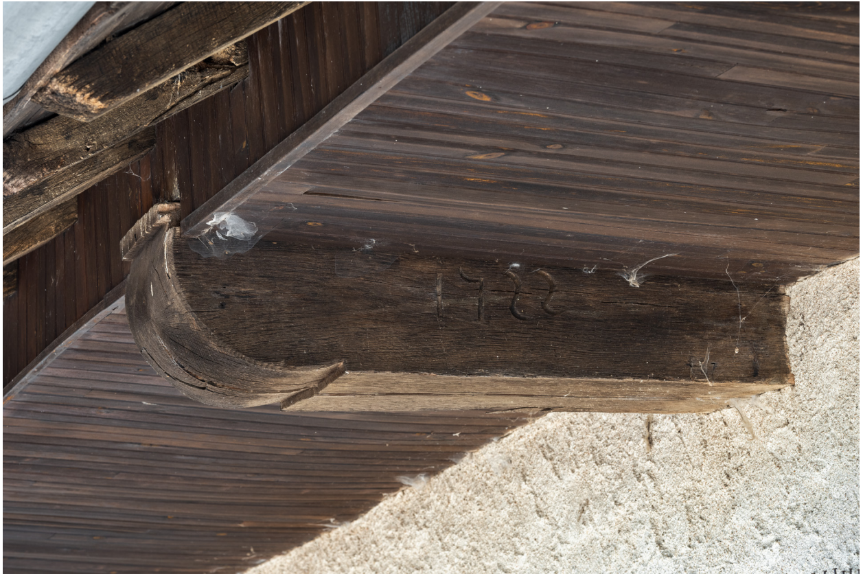
Vue de détail de la date 1722 sur un élément de charpente.