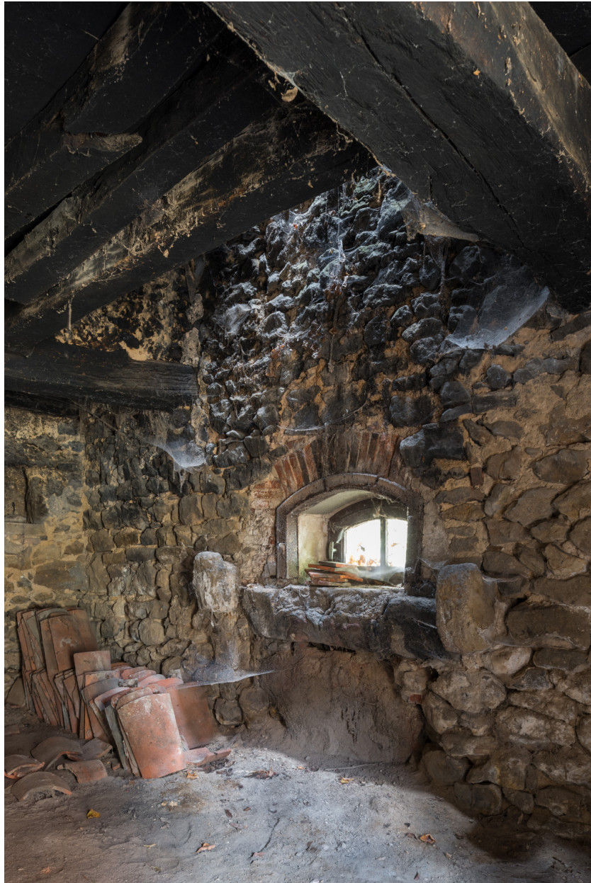
Vue intérieure du pignon ouest de la dépendance.