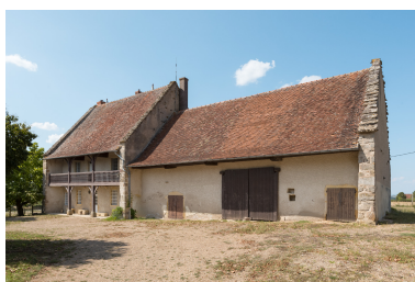
Vue des façades antérieures depuis la cour au sud-est. IVR26_20187100361NUC4A