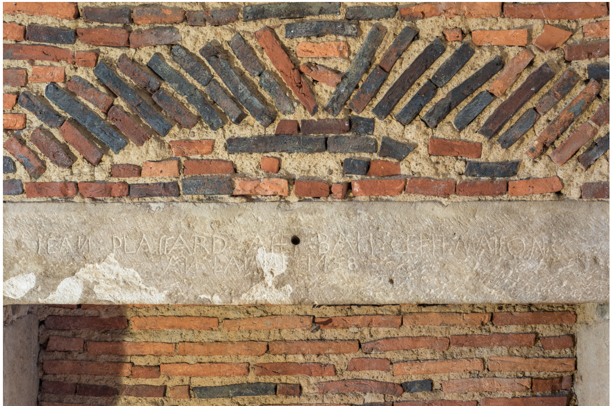
Vue rapprochée : inscription et date portée -1438- sur le couverture d'une cheminée à l'étage.