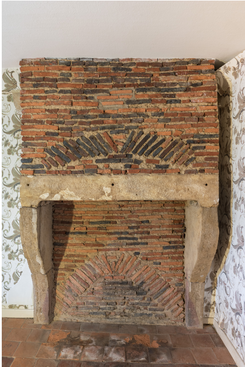
Vue de face de la cheminée de l'étage. inscription et date portée -1438- sur le couverture.