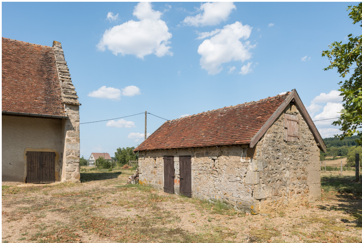
Vue de trois-quart sud-ouest de la dépendance est. (soue? poulailler?)