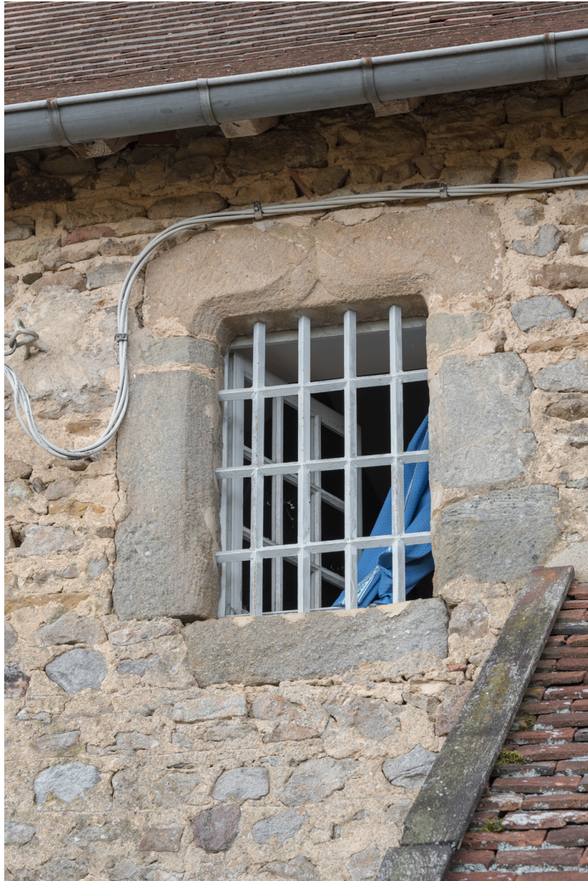
Détail de la baie est à l'étage de la façade postérieure.