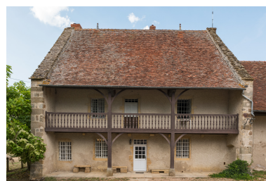
Vue de face de la maison. Façade antérieure. IVR26_20187100362NUC4A