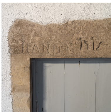
Vue rapprochée d'une inscription et d'une date portée sur un linteau.