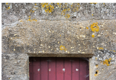
Vue rapprochée du linteau qui porte la date : 1685 (?)