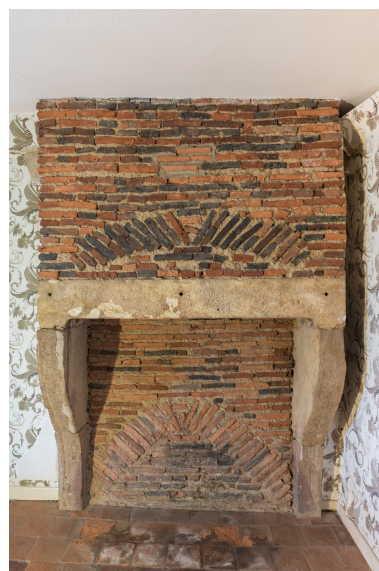
Vue de face de la cheminée de l'étage. inscription et date portée -1438- sur le couvrement. IVR26_20187100368NUC4A