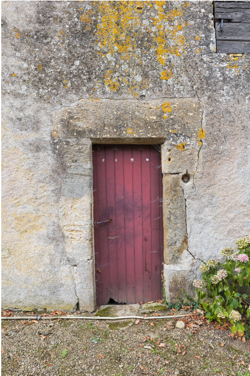
Vue rapprochée de la porte d'entrée de la dépendance dont le linteau porte la date : 1685 (?)