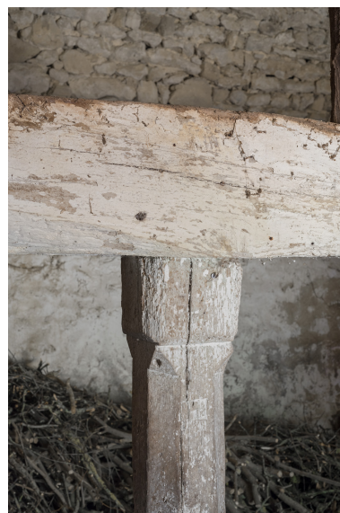
Vue rapprochée d'un assemblage poutre-poteau. IVR26_20187100374NUC4A