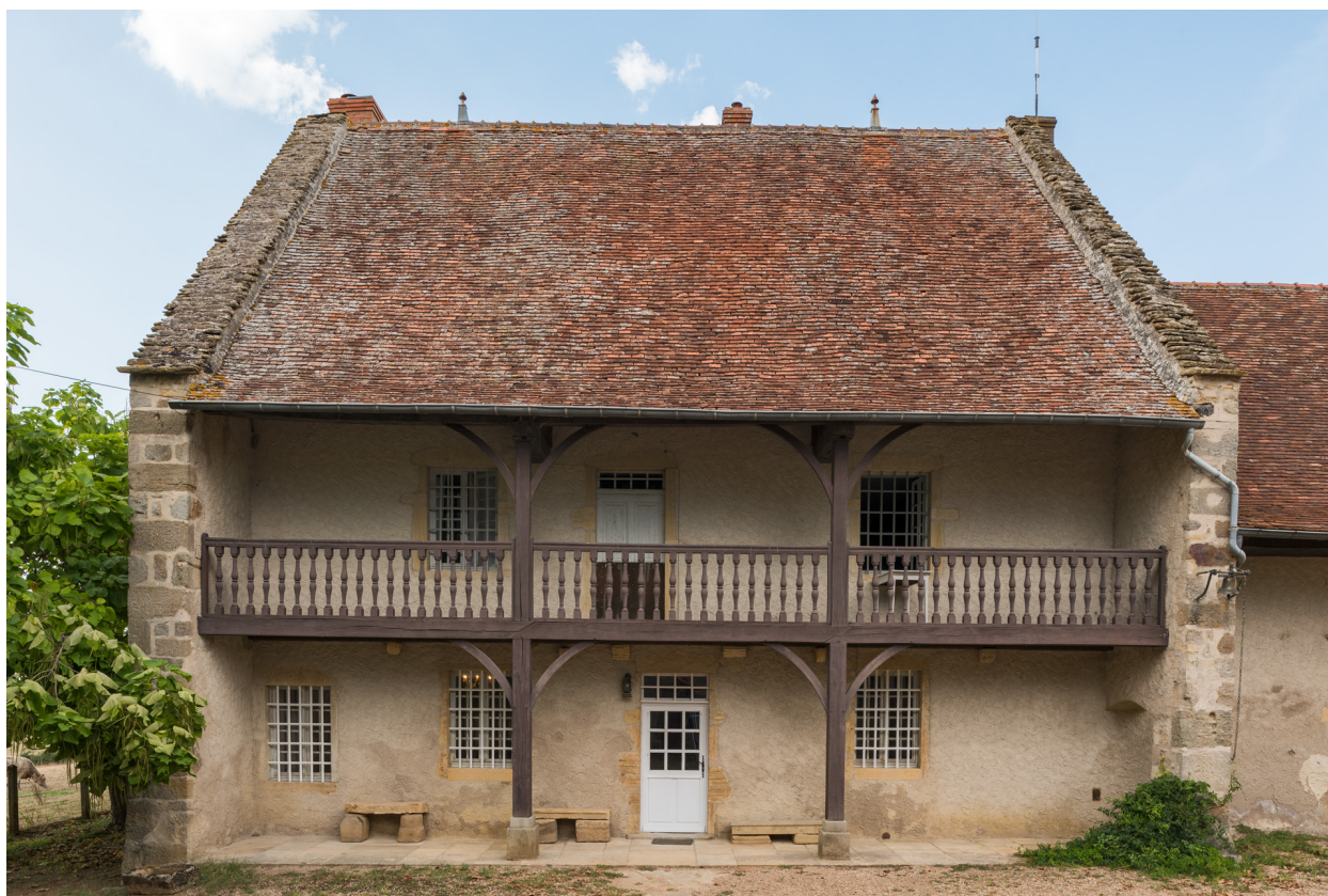
Vue de face de la maison. Façade antérieure.