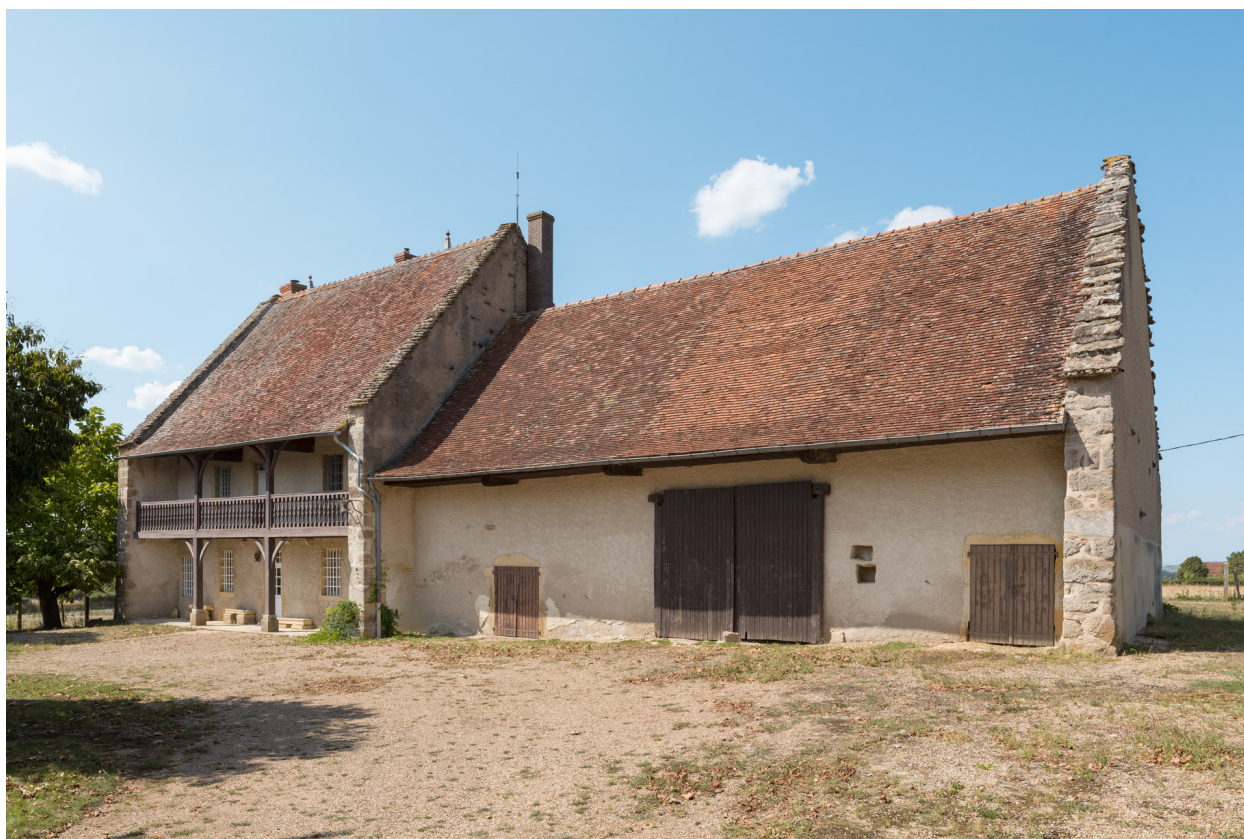
Vue des façades antérieures depuis la cour au sud-est.