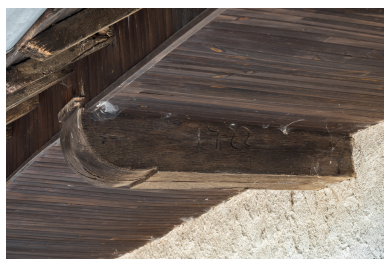
Vue de détail de la date 1722 sur un élément de charpente.