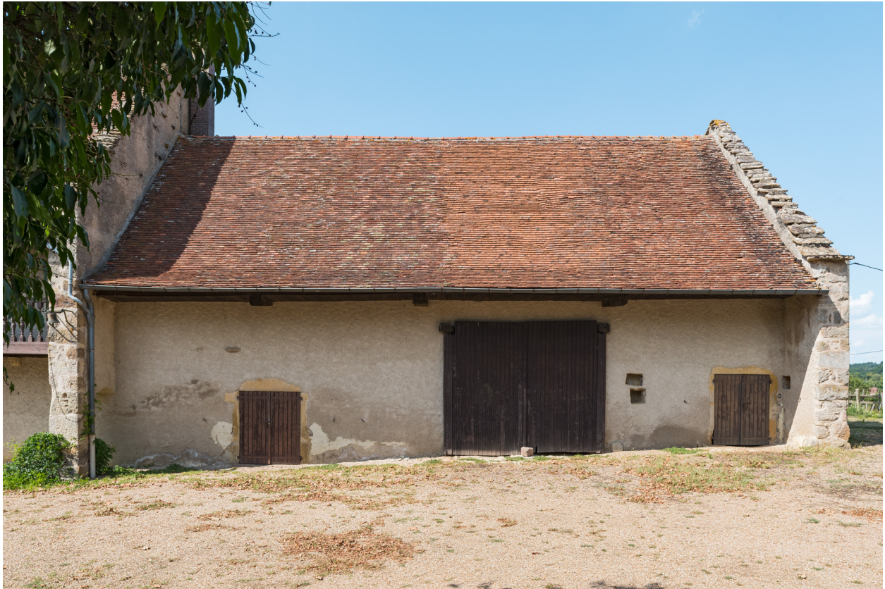
Vue de face de la façade antérieure de la partie agricole : grange et étables.