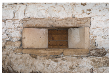
Vue rapprochée d'une baie - dite feuron- menagée dans la cloison entre la grange et l'étable. IVR26_20187100375NUC4A