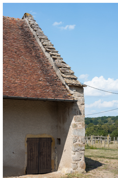
Vue rapprochée du pignon est de la partie agricole. IVR26_20187100371NUC4A