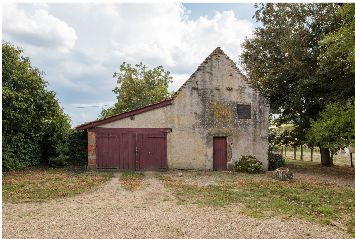
Vue de face de la façade antérieure - nord - des dépendances.