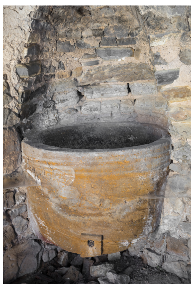
Vue rapprochée : cuve.