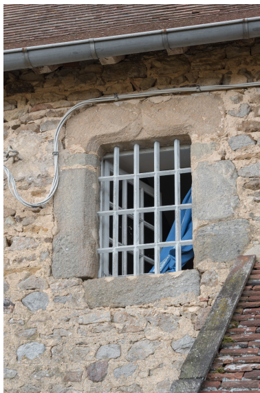
Détail de la baie est à l'étage de la façade postérieure.