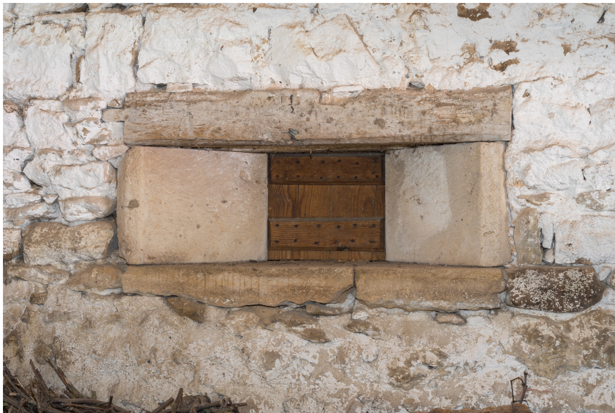
Vue rapprochée d'une baie -dite feuron- ménagée dans la cloison entre la grange et l'étable.