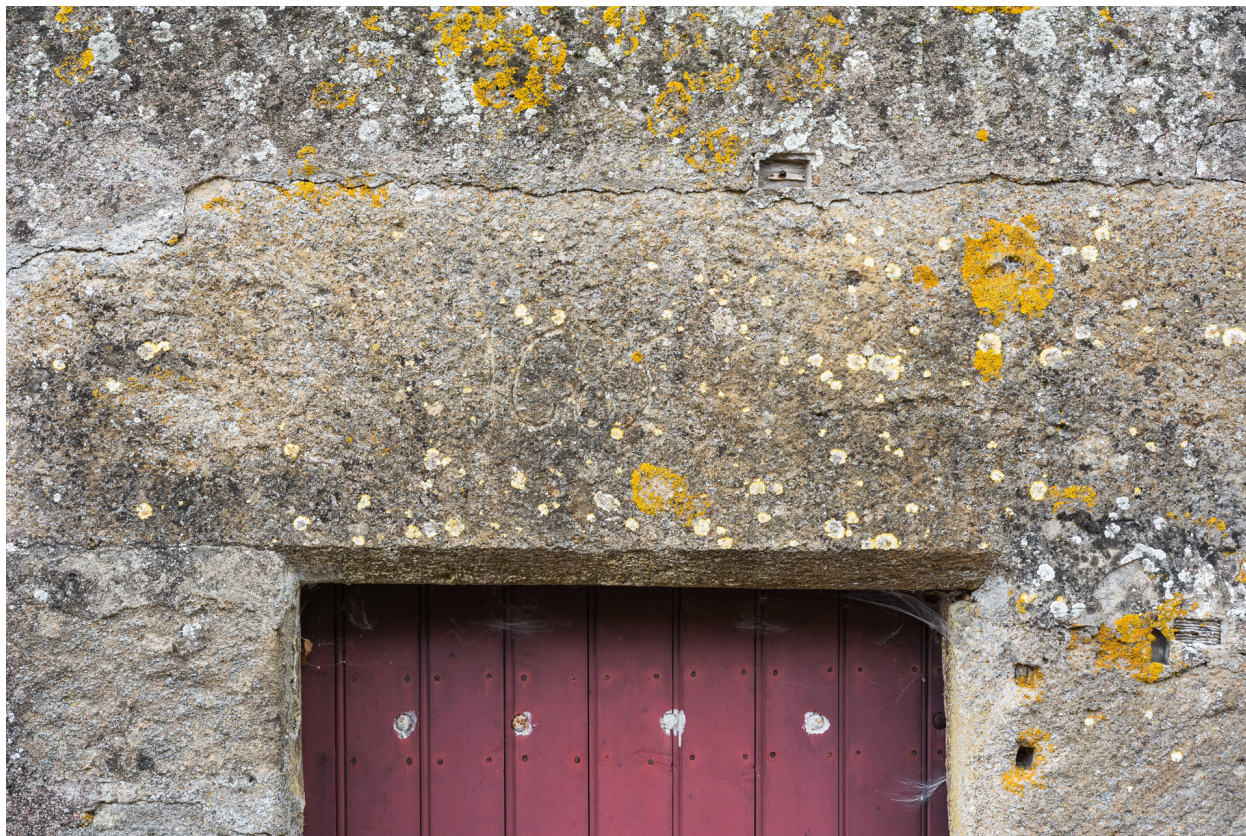
Vue rapprochée du linteau qui porte la date : 1685 (?)