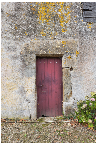
Vue rapprochée de la porte d'entrée de la dépendance dont le linteau porte la date : 1685 (?) IVR26_20187100378NUC4A