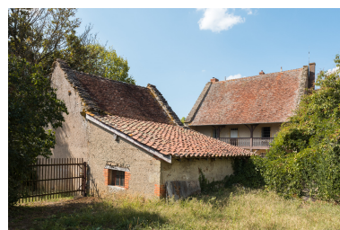
Vue de trois-quart sud-est de la dépendance agricole. IVR26_20187100377NUC4A