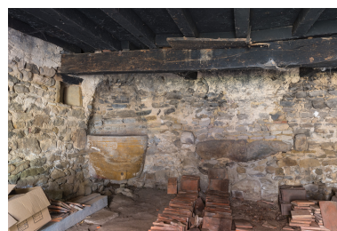
Vue intérieure de la dépendance. Face au mur postérieur sud. IVR26_20187100380NUC4A