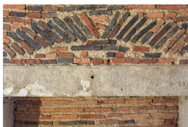
Vue rapprochée : inscription et date portée -1438- sur le couverture d'une cheminée à l'étage. IVR26_20187100369NUC4A