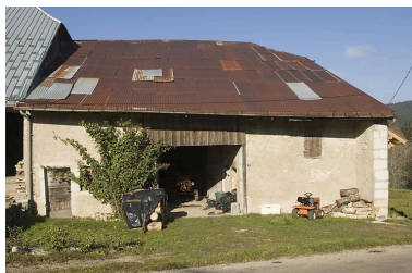
Façade antérieure. IVR43_20082500861NUC2A

IVR43_20102501476NUDA