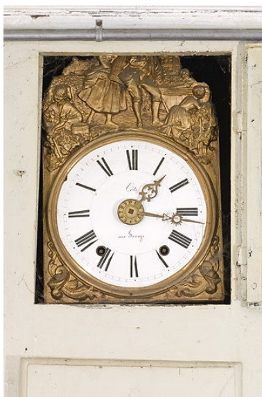
Boiseries de la première chambre : cadran de l'horloge comtoise (porte ouverte). IVR43_20082500859NUC2A