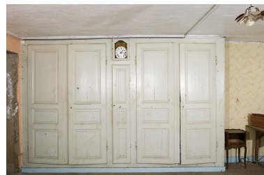
Boiseries de la première chambre.