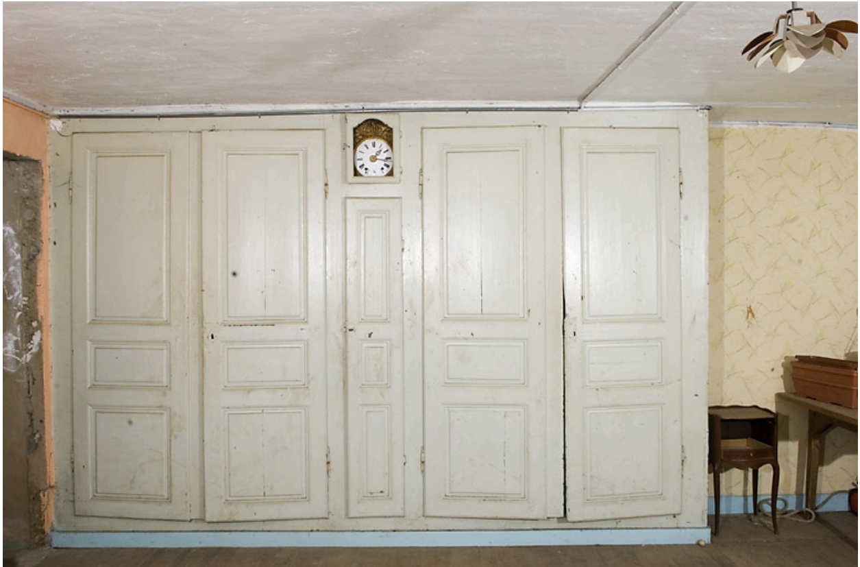
Boiseries de la première chambre.