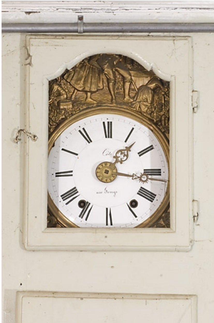
Boiseries de la première chambre : cadran de l'horloge comtoise.