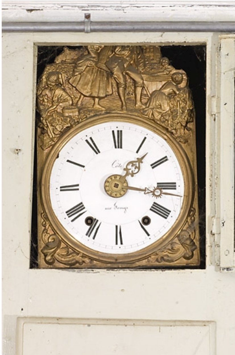
Boiseries de la première chambre : cadran de l'horloge comtoise (porte ouverte).