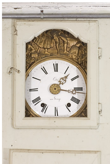
Boiseries de la première chambre : cadran de l'horloge comtoise.