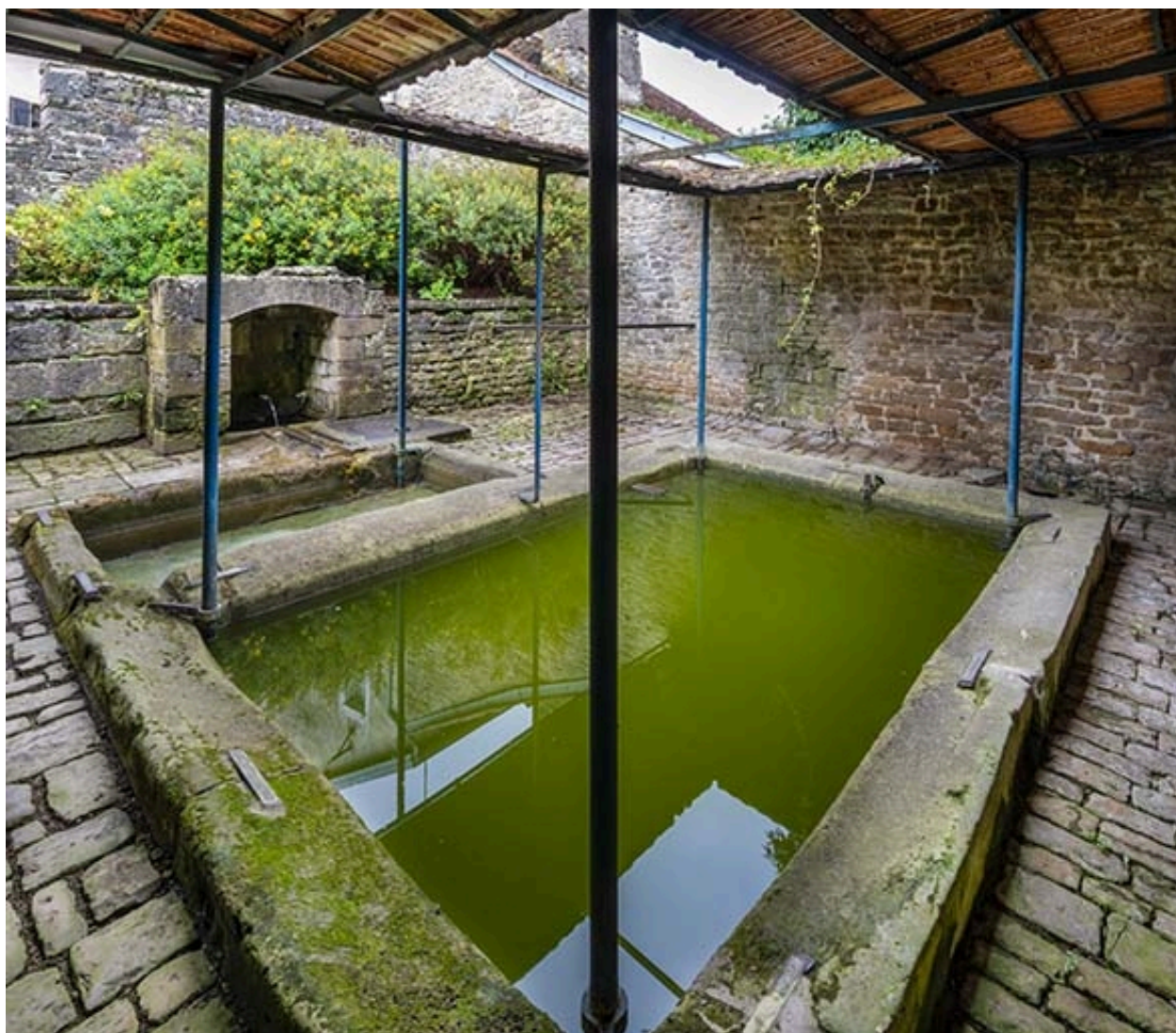
Vue intérieure des bassins.