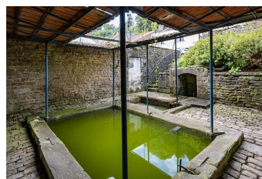
Les deux bassins depuis l'est. IVR43_20217000566NUC4A