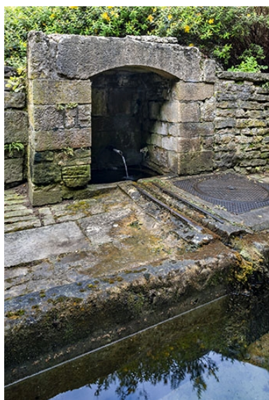
L'alimentation en eau. IVR43_20217000565NUC4A