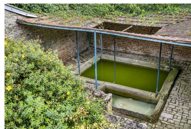
Les deux bassins en vue plongeante depuis la rue. IVR43_20217000563NUC4A