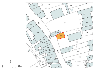
Plan-masse et de situation. Extrait du plan cadastral numérisé de la direction générale des finances publiques, 2025, 1/500. IVR43_20257000082NUDA