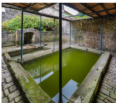
Vue intérieure des bassins. IVR43_20217000567NUC4A

IVR43_20217000564NUC4A