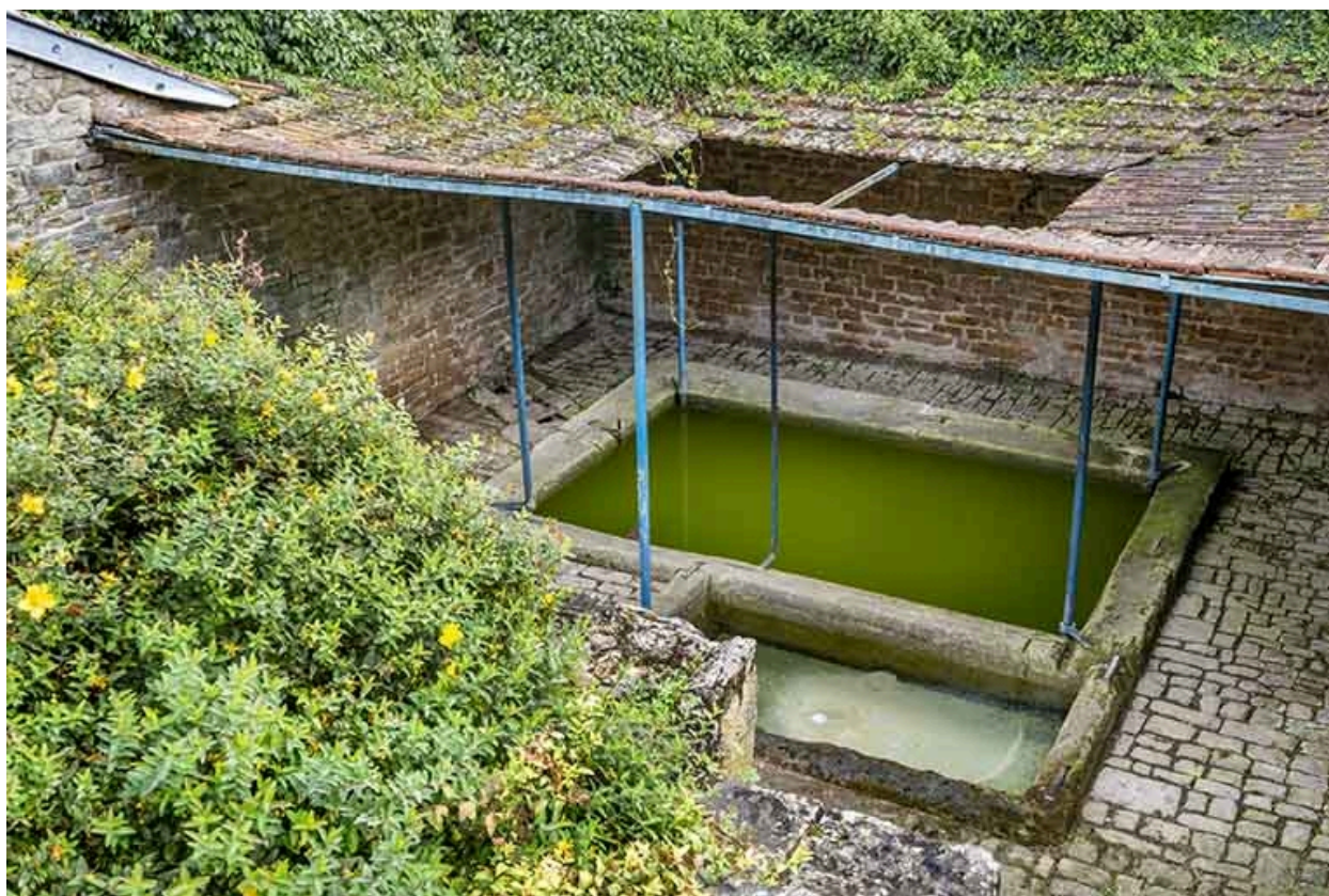
Les deux bassins en vue plongeante depuis la rue.