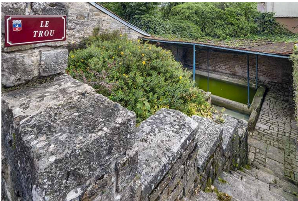
L'escalier et les bassins depuis la rue.