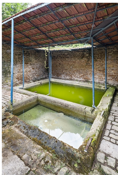
Les deux bassins, vus de trois quarts.

IVR43_20217000564NUC4A