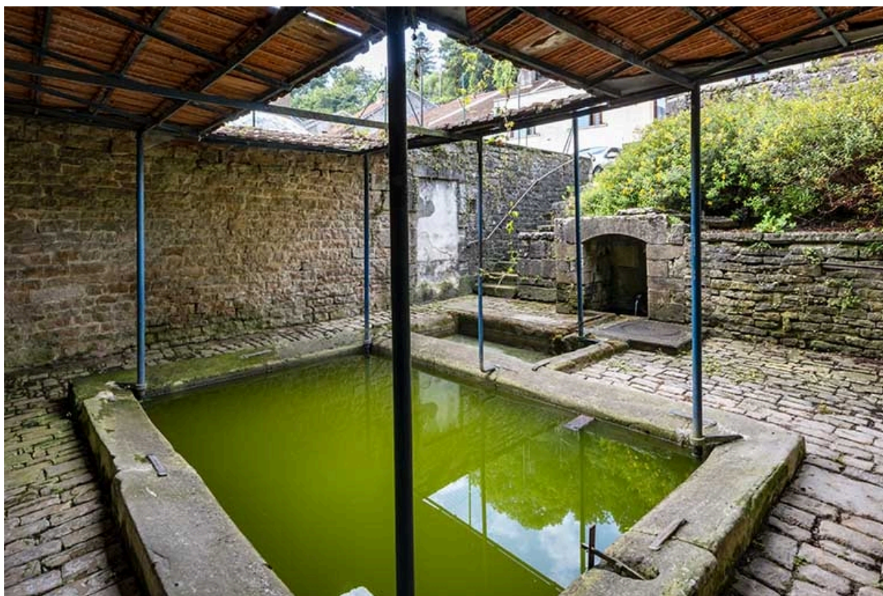
Les deux bassins depuis l'est.