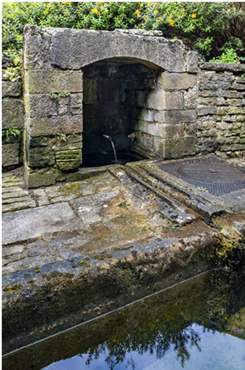
L'alimentation en eau.