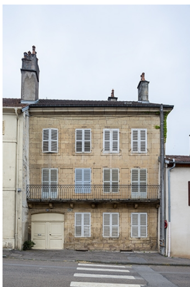
Façade antérieure.