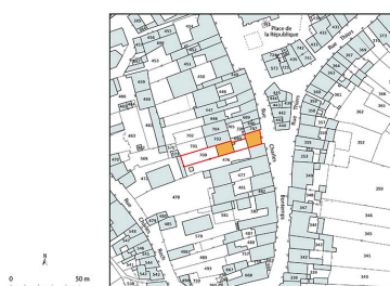
Plan-masse et de situation. Extrait du plan cadastral numérisé de la direction générale des finances publiques, 2025, 1/1 000. IVR43_20257000054NUDA